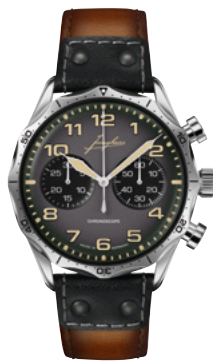
Pilot Chronoscope 27/3493.00