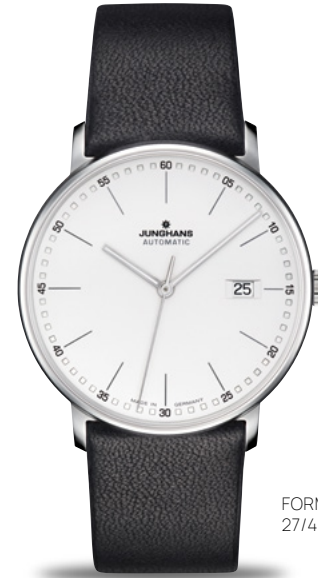
FORM A 27/4730.00

Form follows function: ein Gestaltungsgrundsatz, der dem deutschen Industriedesign zu weltweitem Ansehen verholfen hat. Diesem Designstil verpflichtet, steht die Uhrenlinie FORM für konsequente Reduktion und stilvolle Sachlichkeit.