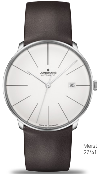
Meister fein Automatic 27/4152.00