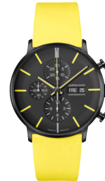
FORM A Chronoscope 27/4473.00