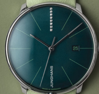
Meister fein Automatic 2714357.00