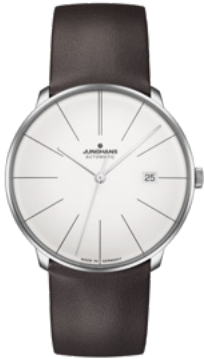
Meister fein Automatic 27/4152.00