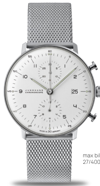
max bill Chronoscope 2714003.46

Automatikwerk J800.5 | Gehäuse Edelstahl Ø 40,0 mm | Saphirglas | wasserdicht bis 5 bar