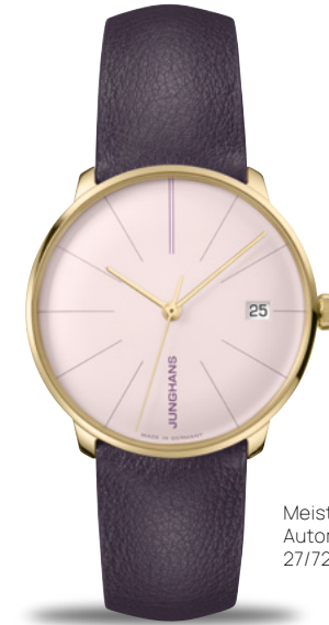
Meister fein Kleine Automatic 27/7232.00