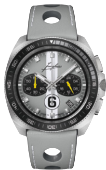
1972 Chronoscope Sports Edition 2024 41/4468.00