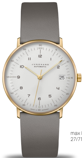
max bill Kleine Automatic 2717108.02