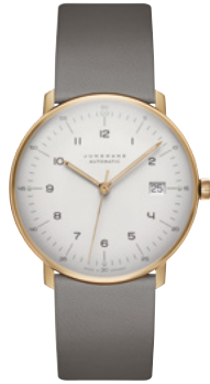
max bill Automatic 2717806.02