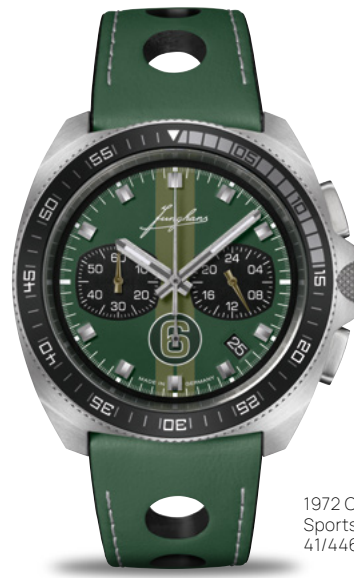
1972 Chronoscope Sports Edition 2024 41/4467.00

Ein Hauch klassischer Rennsport schwingt mit: Die Zifferblätter der 1972 Chronoscope Sports Edition 2024 tragen einen markanten Doppelstreifen, den historischen Junghans-Schriftzug sowie die Ziffer 6 in Form einer Startnummer. Limitiert sind die sportlichen Uhren auf je 200 Exemplare.