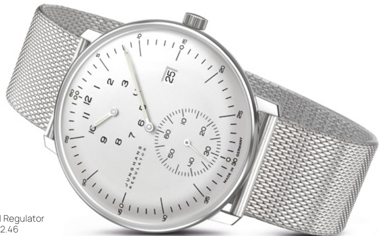
max bill Regulator 2714492.46

Die max bill Regulator besticht durch ihre radikale Trennung von Stunde, Minute und Sekunde: Die Zeit wird in ihre drei Grundelemente aufgesplittet und der Betrachter erhält die Möglichkeit, sich ganz auf eines zu fokussieren.