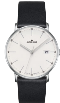
FORM Quarz 41/4884.00