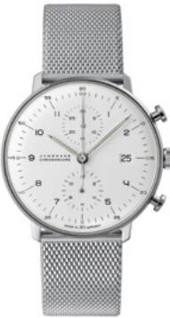
max bill Chronoscope 2714003.46