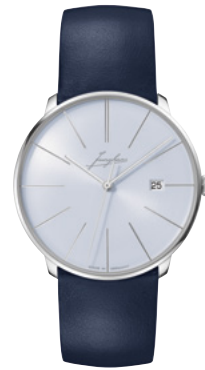
Meister fein Automatic Signatur 27/4359.00