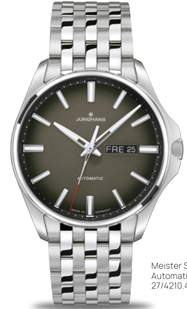
Meister S Automatic 2714210.44

Die Modelle sind mit Saphirglas ausgestattet und wasserdicht bis 20 bar.