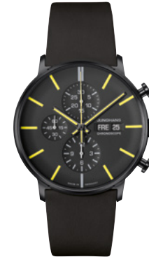
FORM A Chronoscope 27/4473.02