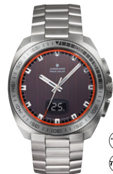
1972 Mega Solar 56/4211.44