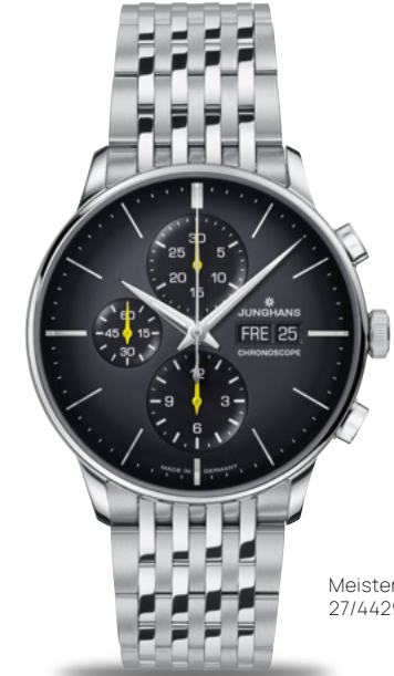
Meister Chronoscope 27/4429.46

Der Name spricht für sich selbst. Uhren der Modellreihe Meister stehen für erstklassige Zeitmesser, für die sich viele Junghans-Freunde begeistern. Die neue Meister Automatic punktet mit perfekten Proportionen und unaufdringlicher Eleganz, die Meister Chronoscope mit sportlichen Akzenten.