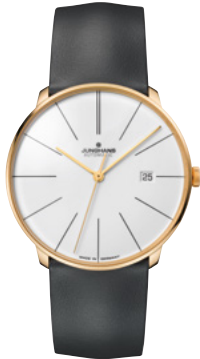
Meister fein Automatic 27/7150.00