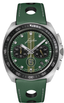
1972 Chronoscope Sports Edition 2024 41/4467.00