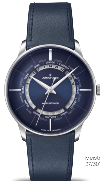
Meister Worldtimer 27/3010.01

Gehäuse Edelstahl PVD-beschichtet | Saphirglas | Sichtboden | wasserdicht bis 5 bar Meister Chronoscope: Automatikwerk J880.1 | Stoppfunktion | Gehäuse Ø 40,7 mm Meister Handaufzug: Handaufzugwerk J815.1 | Gehäuse Ø 37,7 mm