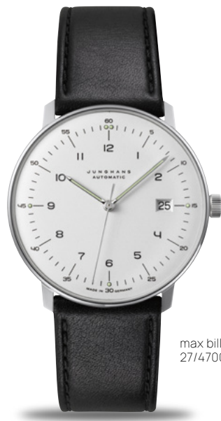
max bill Automatic 27/4700.02