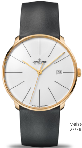
Meister fein Automatic 27/7150.00