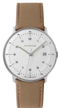
max bill Quarz 41/4562.02