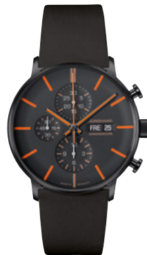
FORM A Chronoscope 27/4370.02