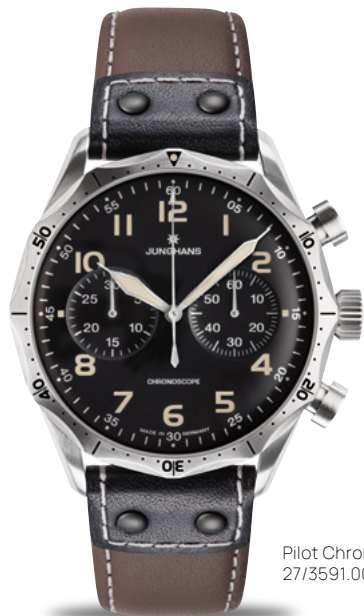
Pilot Chronoscope 27/3591.00