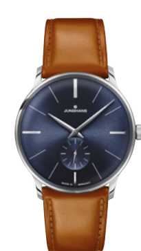
Meister Handaufzug 2713504.02