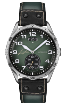
Pilot Automatic 27/4495.00