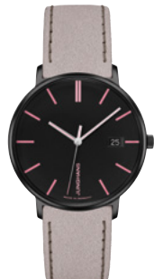
FORM Damen 47/4256.00