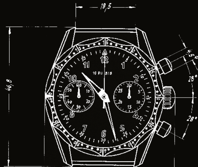
1950er Fliegerchronograph J88/0111 für die Bundeswehr mit der markanten Drehlunette