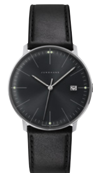
max bill Quarz 41/4465.02