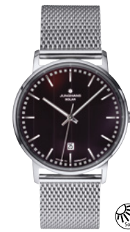
Milano Solar 14/4061.44