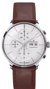
Meister Chronoscope 2714120.02