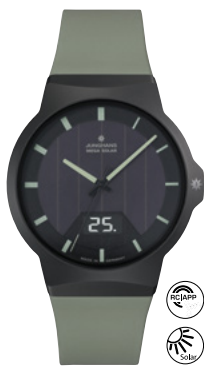
Force Mega Solar 18/1002.00