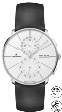
Meister feyn Chronoscope Mega Solar 59/4200.00