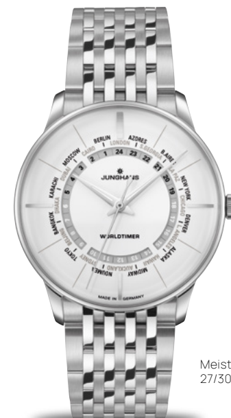
Meister Worldtimer 27/3011.45

Ein meisterhaft eleganter Zeitmesser, der die unaufhörliche Bewegung der Welt widerspiegelt: Eine Stundenscheibe zeigt die Zeit an 24 Orten gleichzeitig an. So erinnert uns die Meister Worldtimer daran, dass wir uns vielleicht gerade in verschiedenen Zeitzonen, aber doch im selben Augenblick befinden.