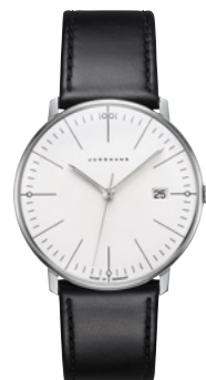
max bill Quarz 41/4817.02