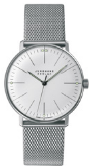
max bill Handaufzug 27/3004.46