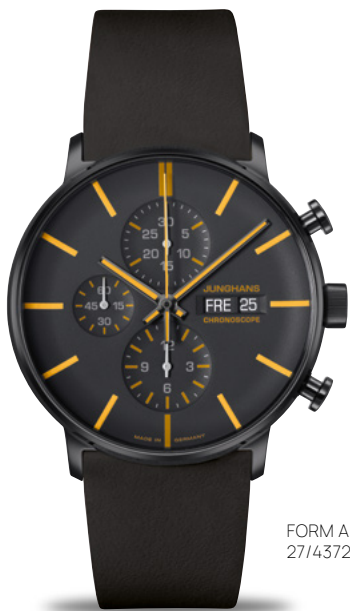
FORM A Chronoscope 2714372.02