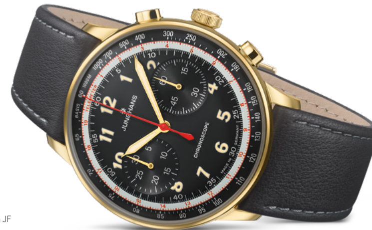
Telemeter Edition JF 27/3480.02