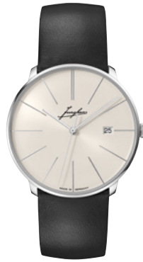
Meister fein Automatic Signatur 27/4355.00