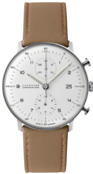
max bill Chronoscope 2714502.02