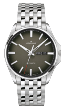
Meister S Automatic 27/4210.44