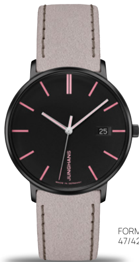
FORM Damen 47/4256.00