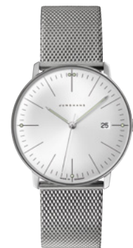
max bill Quarz 41/4463.46