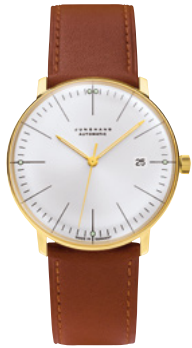
max bill Automatic 2717002.02