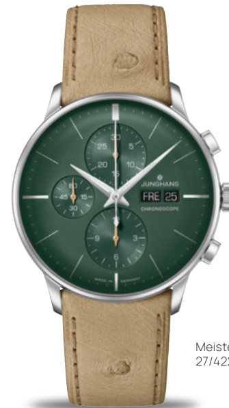
Meister Chronoscope 27/4222.02