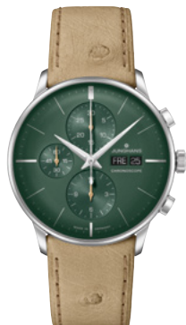
Meister Chronoscope 2714222.02