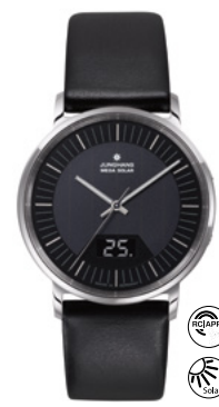
Milano Mega Solar 56/4220.00 Inkl. Milanaiseband