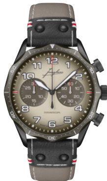
Pilot Chronoscope Desert 27/3398.00