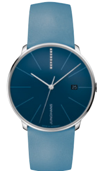
Meister fein Automatic 27/4356.00