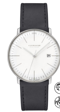
max bill Mega Solar 59/2020.02