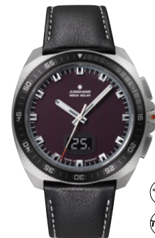
1972 Mega Solar 56/4210.00