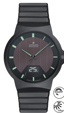
Force Mega Solar 18/1938.44