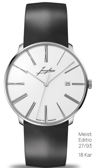
Meister fein Automatic Edition Erhard 27/9300.00 18 Karat Weißgold

Firmengründer Erhard Junghans legte den Grundstein für den Erfolg des Unternehmens. Das würdigen diese auf je 200 Uhren limitierten Editionsmodelle. Feine römische Zahlen, die wie langgezogene Indexe wirken, prägen das Zifferblatt mit dem historischen Junghans Schriftzug. Die Rückseite steht ganz im Zeichen des Firmengründers: Der gewölbte Saphirglasboden trägt seine Signatur, der zweischenkige Rotor ein graviertes Profil von Erhard Junghans. Ob Gelb- oder Weißgold: Mit jedem Blick auf die Meister fein Automatic Edition Erhard werden 200 Jahre Uhrengeschichte lebendig.