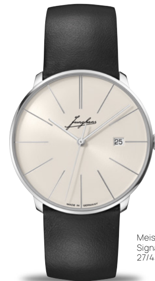
Meister fein Automatic Signatur 2714355.00