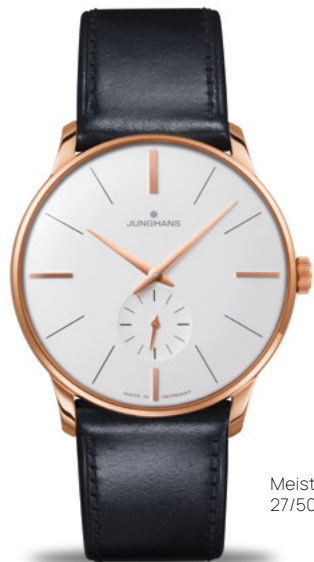
Meister Handaufzug 27/5002.02

Stilvolle Verbindung von elegantem Design und mechanischer Präzision: Das feine Zusammenspiel des roségoldfarbenen Gehäuses mit dem matt versilberten Zifferblatt lassen das klassische Gesicht dieser Modelle in warmen Tönen glänzen.