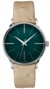
Meister Damen Automatic 27/3343.00