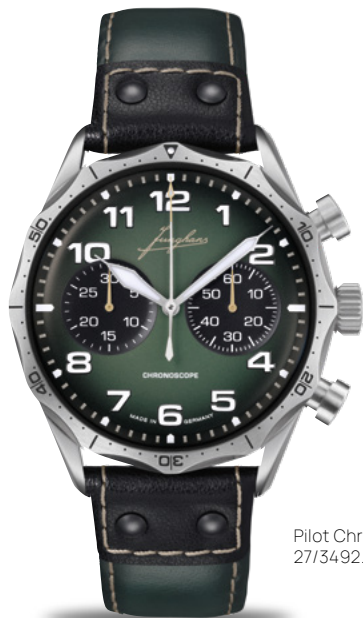
Pilot Chronoscope 27/3492.00