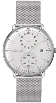
max bill Regulator 2714492.46