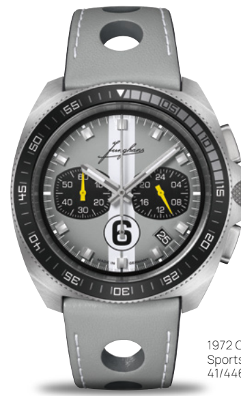
1972 Chronoscope Sports Edition 2024 41/4468.00

Quarzwerk J645.83 | Stoppfunktion | Gehäuse Edelstahl Ø 43,3 mm | drehbare Lünette | Saphirglas | wasserdicht bis 10 bar | Limitiert auf je 200 Uhren