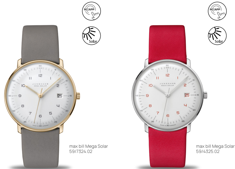
max bill Mega Solar 59/7324.02

Für den Gestalter Max Bill stand optische Nachhaltigkeit an erster Stelle. Ein Anspruch, den die max bill Mega Solar mit energetischer Nachhaltigkeit verbindet: Denn das hoch-effiziente App-Connected Funkwerk wird von der Kraft der Sonne angetrieben. Ein Ewiger Kalender, die automatische Umstellung auf Sommer- und Winterzeit sowie die einfache Einstellbarkeit der Zeitzonen per Krone oder Junghans-App machen die Uhr fit für heute, morgen und übermorgen.