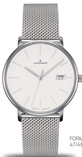
FORM Damen 47/4851.44