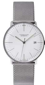
max bill Automatic 27/4002.46