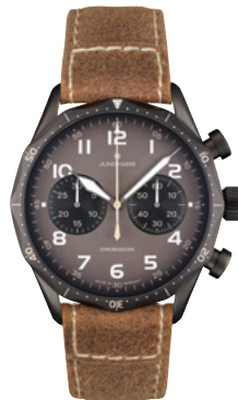
Pilot Chronoscope 27/3794.00