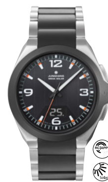
Spektrum Mega Solar 18/1425.44