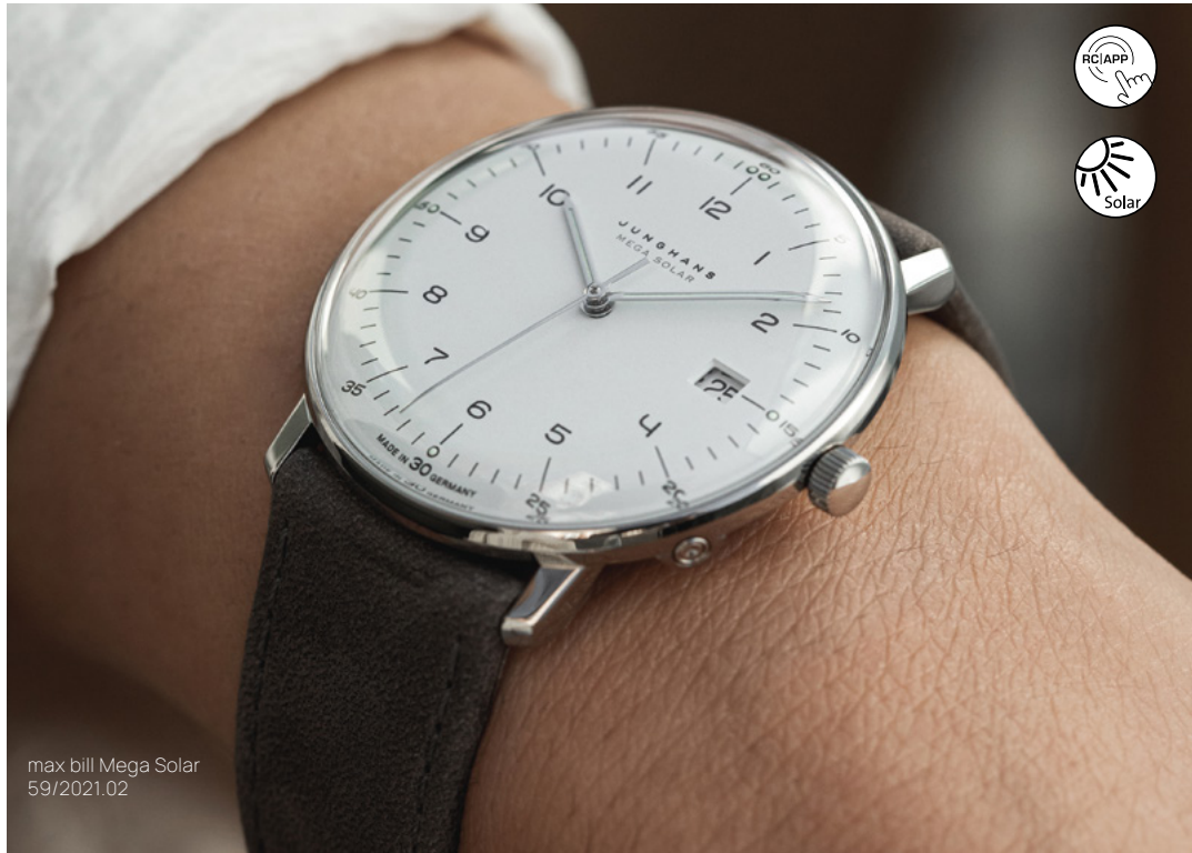
max bill Mega Solar 59/2021.02

Gefertigt aus korrosions- und temperaturbeständigem, überraschend leichtem und hautfreundlichem Titan, ist diese Variante der max bill Mega Solar mit vegetabil gegerbtem Lederband besonders angenehm zu tragen.