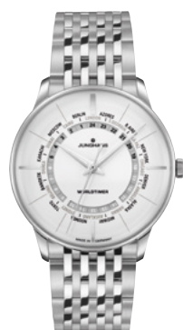
Meister Worldtimer 273011.45