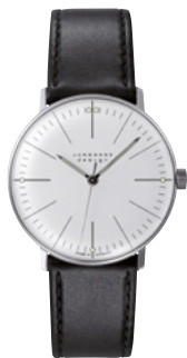
max bill Handaufzug 27/3700.02