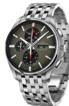
Meister S Chronoscope 27/4023.44