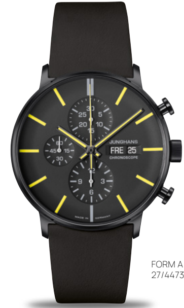
FORM A Chronoscope 2714473.02

Automatikwerk J880.1 | Stoppfunktion | Gehäuse Edelstahl PVD beschichtet Ø 42,0 mm | Saphirglas | Boden mit Motivdruck Times Square | wasserdicht bis 5 bar