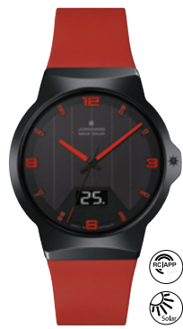
Force Mega Solar 18/1402.00