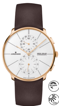
Meister feyn Chronoscope Mega Solar 59/7201.00