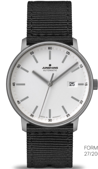
FORM A Titan 27/2000.00

FORM C: Quarzwerk J645.85 | Stoppfunktion | Gehäuse Edelstahl Ø 40,0 mm | wasserdicht bis 5 bar FORM A: Automatikwerk J800.2 | Gehäuse Edelstahl Ø 39,3 mm | getönter Sichtboden | wasserdicht bis 5 bar FORM A Titan: Automatikwerk J800.2 | Gehäuse Titan Ø 40,0 mm | getönter Sichtboden | wasserdicht bis 10 bar