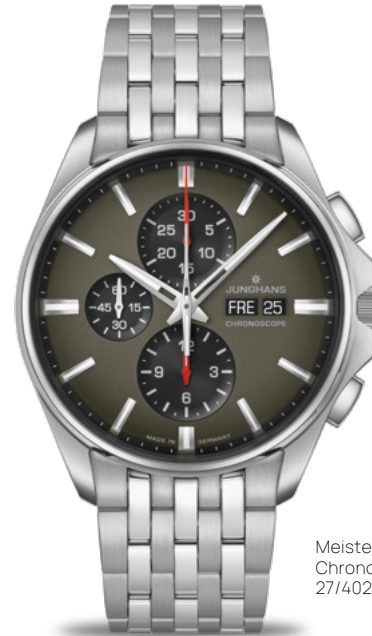
Meister S Chronoscope 2714023.44

Sportiv. Maskulin. Kompromisslos widerstandsfähig. Durch den massiven, dynamisch geschwungenen Flankenschutz, entspiegeltes Saphirglas und Wasserdichtheit bis 20 bar. Das Edelstahlband ist ausgestattet mit einer Feinjustierung, über die sich die Bandlänge einfach anpassen lässt.