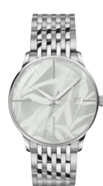
Meister Automatic 2714243.46