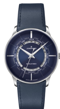
Meister Worldtimer 273010.01