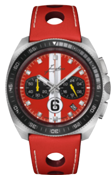
1972 Chronoscope Sports Edition 2024 41/4466.00