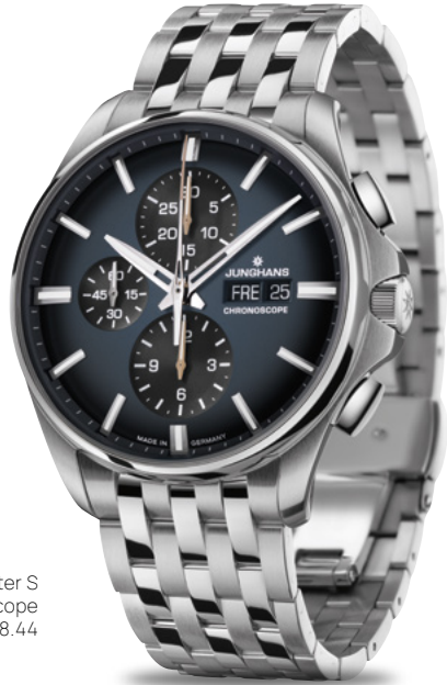
Meister S Chronoscope 2714228.44

Sportiv. Maskulin. Kompromisslos widerstandsfähig. Durch den massiven, dynamisch geschwungenen Flankenschutz, entspiegeltes Saphirglas und Wasserdichtheit bis 20 bar. Das Edelstahlband ist ausgestattet mit einer Feinjustierung, über die sich die Bandlänge einfach anpassen lässt.