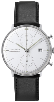
max bill Chronoscope 2714600.02