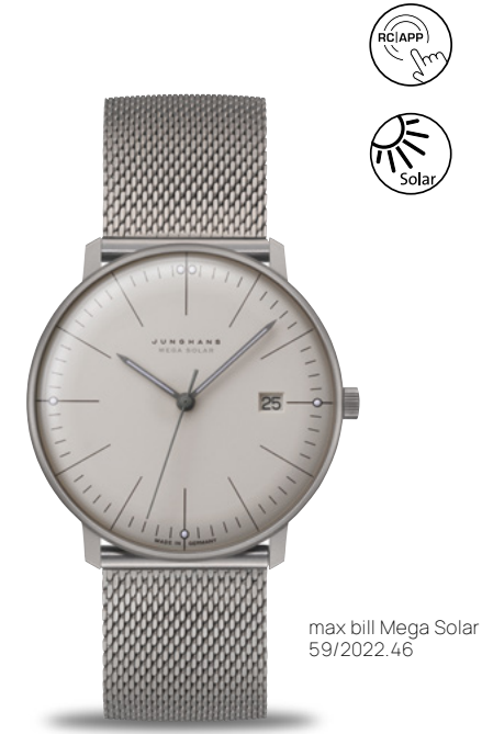
max bill Mega Solar 59/2022.46

Junghans Connected Funk-Solarwerk J101.85 | Dunkelgangreserve bis zu 3 Jahre | Gehäuse Titan Ø 38,0 mm | Saphirglas | wasserdicht bis 5 bar