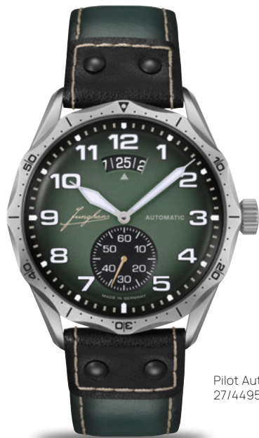
Pilot Automatic 27/4495.00