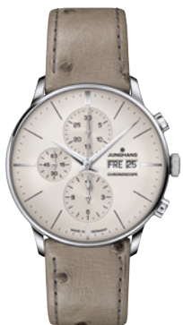
Meister Chronoscope 2714223.02