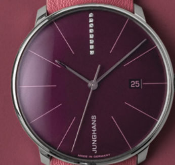
Meister fein Automatic 2714358.00