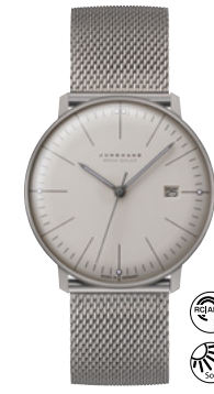
max bill Mega Solar 59/2022.46