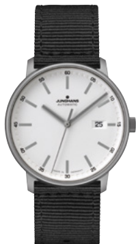
FORMA Titan 27/2000.00