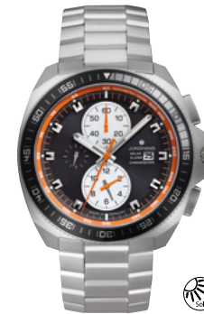
1972 Chronoscope Solar 14/4202.44