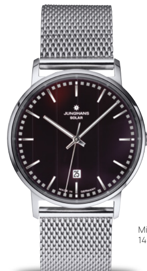
Milano Solar 14/4061.44