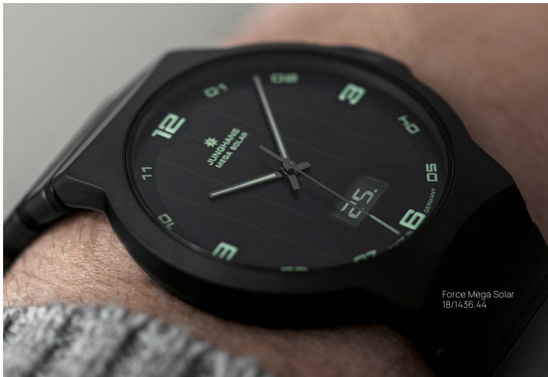
Force Mega Solar 18/1436.44

Junghans gilt als Pionier der Funkarmbanduhr und seit der Präsentation der Mega 1 im Jahr 1990 ist diese Technologie ein fester Bestandteil der Kollektion. Und weil Funkuhren auch heute noch die genaueste Zeitanzeige bieten, ist dieser Zeitmesser ein verlässlicher Partner für alle Lebenssituationen.