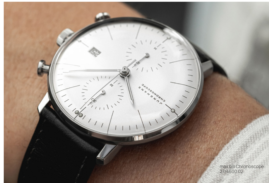
max bill Chronoscope 27/4600.02

Automatikwerk J800.1 | Gehäuse Edelstahl Ø 38,0 bzw. 34,0 mm | Saphirglas | wasserdicht bis 5 bar