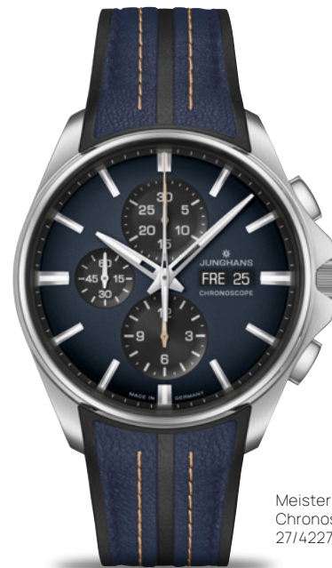
Meister S Chronoscope 2714227.00

Bei der Arbeit. Beim Sport. In der Freizeit. Wann oder wo auch immer, die Meister S in Mitternachtsblau bleibt kompromisslos funktional. Und kompromisslos souverän. Beim ergonomischen Armband sorgt der auf der Haut aufliegende, erhabene Junghans Schriftzug im synthetischen Kautschuk für eine gute Unterlüftung.