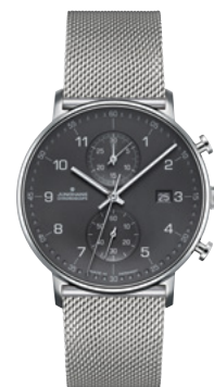
FORM C 41/4877.44