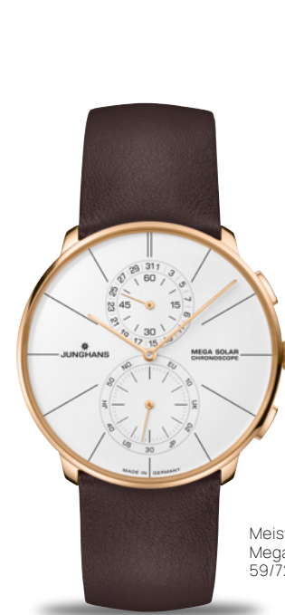
Meister fein Chronoscope Mega Solar 59/7201.00

Filigrane Gestaltung. Präzises Connected Funkwerk. Nachhaltiger Solarantrieb. Praktische Stoppfunktion. Trotz komplexer Technologie einfach zu bedienen. Keine Frage, die Meister fein Chronoscope Mega Solar vereint viele gute Eigenschaften in sich.