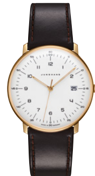
max bill Quarz 41/7872.02