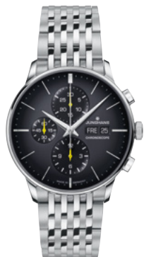
Meister Chronoscope 2714429.46