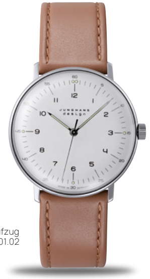
max bill Handaufzug 27/3701.02

Original max bill Armbanduhren: Zeit vergeht. Gutes Design nicht.