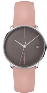
Meister fein Kleine Automatic 27/4231.00