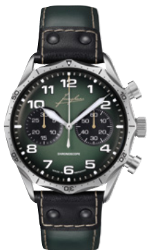
Pilot Chronoscope 27/3492.00