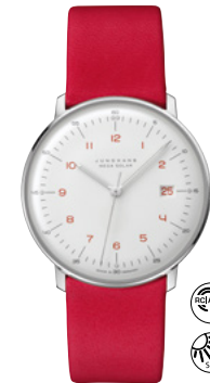
max bill Mega Solar 59/4325.02