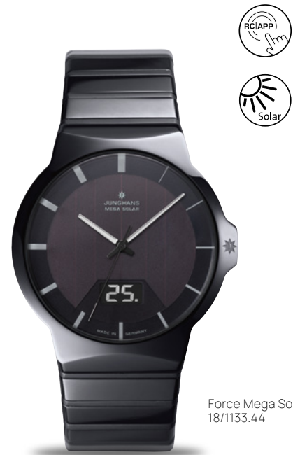
Force Mega Solar 18/1133.44

Junghans gilt als Pionier der Funkarmbanduhr und seit der Präsentation der Mega 1 im Jahr 1990 ist diese Technologie ein fester Bestandteil der Kollektion. Und weil Funkuhren auch heute noch die genaueste Zeitanzeige bieten, ist dieser Zeitmesser ein verlässlicher Partner für alle Lebenssituationen.