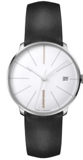
Meister fein Kleine Automatic 27/4230.00