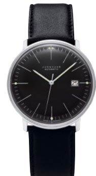
max bill Automatic 27/4701.02