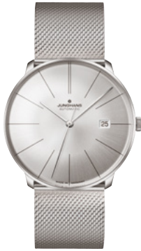
Meister fein Automatic 27/4153.44