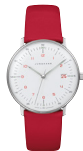
max bill Damen 47/4541.02