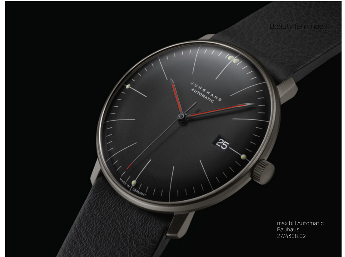
Automatikwerk J800.1 | Gehäuse Edelstahl schwarz PVD-beschichtet Ø 38,0 mm | Saphirglas | Sichtboden mit Bauhausmotiv | wasserdicht bis 5 bar