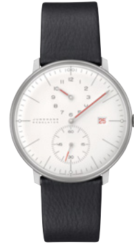
max bill Regulator Bauhaus 2714493.02