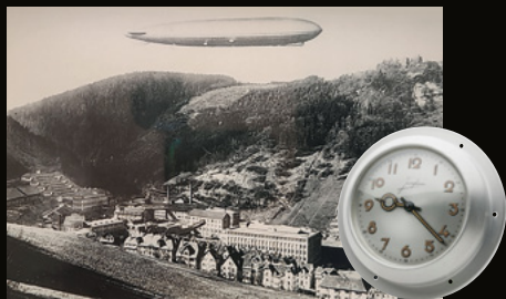
1920er Zeppelin über Schramberg und Zeppelin Borduhr (1930er Jahre)