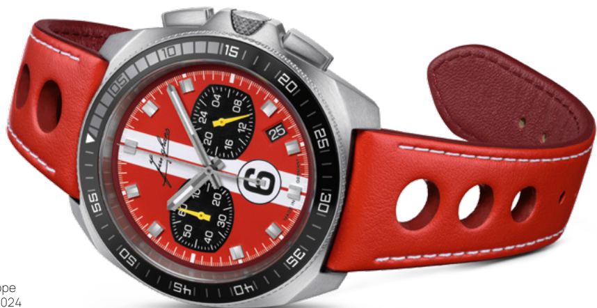
1972 Chronoscope Sports Edition 2024 41/4466.00

Ein Hauch klassischer Rennsport schwingt mit: Die Zifferblätter der 1972 Chronoscope Sports Edition 2024 tragen einen markanten Doppelstreifen, den historischen Junghans-Schriftzug sowie die Ziffer 6 in Form einer Startnummer. Limitiert sind die sportlichen Uhren auf je 200 Exemplare.