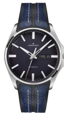
Meister S Automatic 27/4211.00