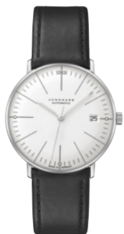
max bill Kleine Automatic 27/4105.02