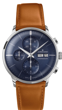
Meister Chronoscope 2714526.02