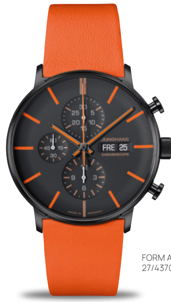
FORM A Chronoscope 27/4370.00