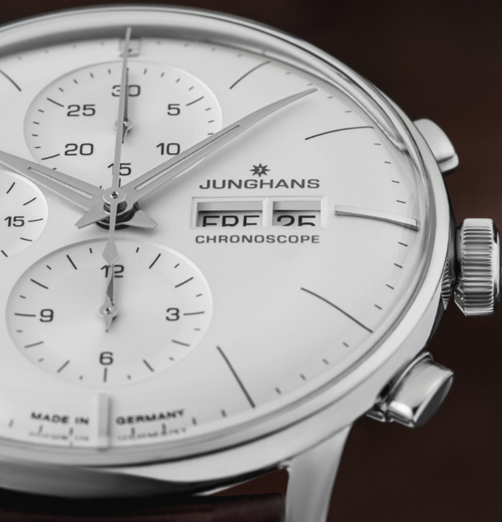
Meister Chronoscope 27/4120.02