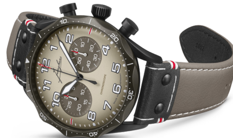
Pilot Chronoscope Desert 27/3398.00