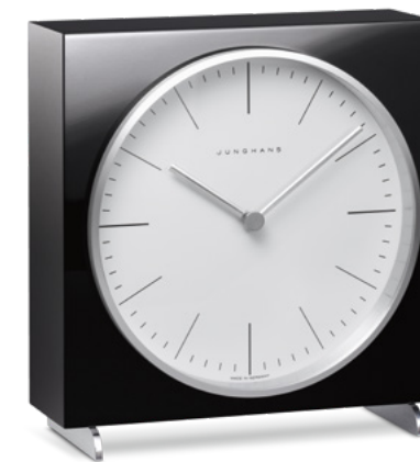
max bill Tischuhr Funk (EU) 383/2202.00 Quarz 363/2212.00