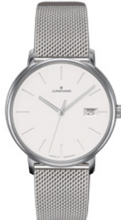
FORM Damen 47/4851.44