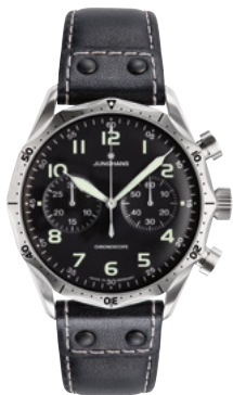
Pilot Chronoscope 27/3590.00