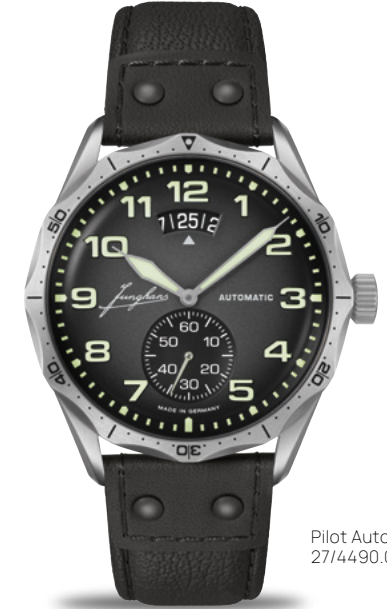
Pilot Automatic 27/4490.00

Gehäuse Edelstahl Ø 43,3 mm | beidseitig drehbare Lünette | Saphirglas | wasserdicht bis 10 bar Pilot Chronoscope: Automatikwerk J880.4 | Stoppfunktion Pilot Automatic: Automatikwerk J800.1.6