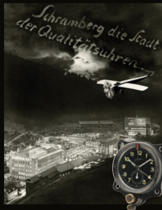
1930er: Junghans Borduhr und Werbemotiv aus dieser Zeit