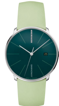
Meister fein Automatic 27/4357.00