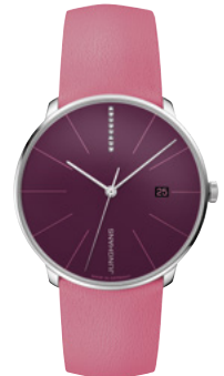
Meister fein Automatic 27/4358.00