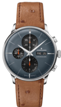
Meister Chronoscope 2714224.02