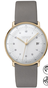
max bill Mega Solar 59/7324.02