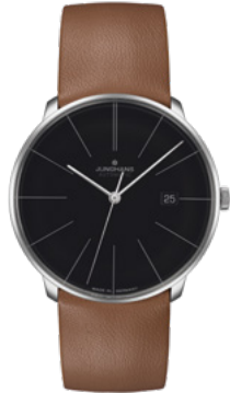
Meister fein Automatic 27/4154.00