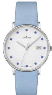
FORM Damen 47/4055.00