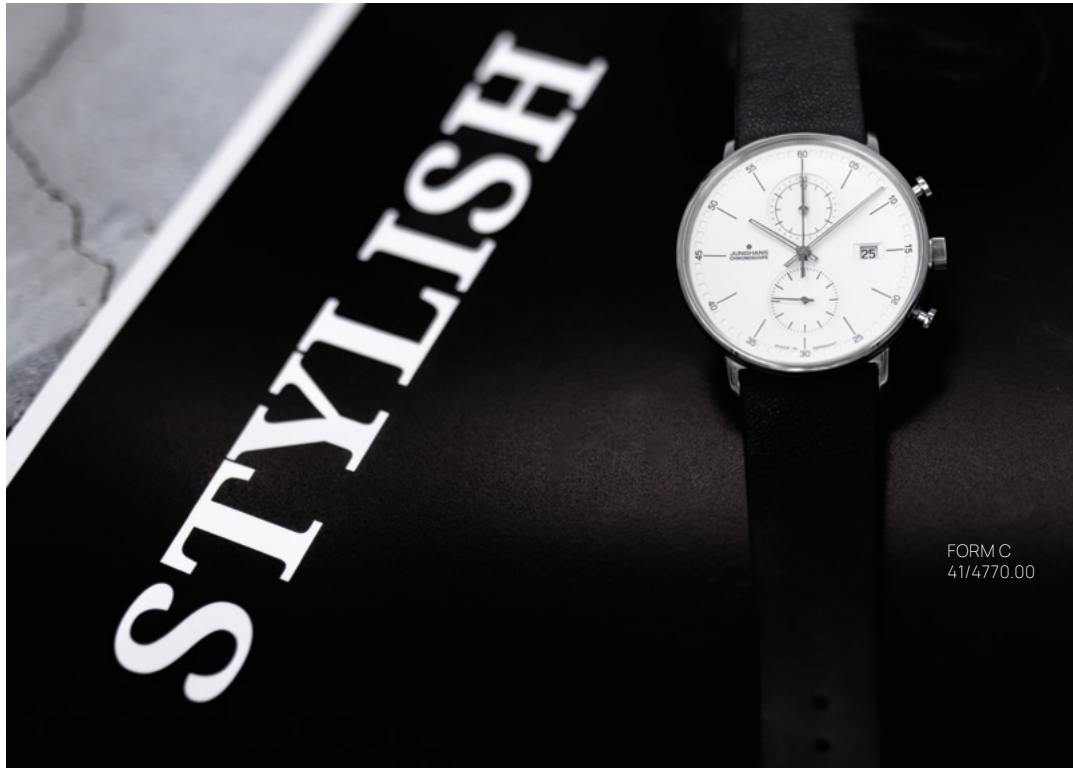
FORM C 41/4770.00

Form follows function: ein Gestaltungsgrundsatz, der dem deutschen Industriedesign zu weltweitem Ansehen verholfen hat. Diesem Designstil verpflichtet, steht die Uhrenlinie FORM für konsequente Reduktion und stilvolle Sachlichkeit.