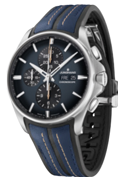
Meister S Chronoscope 27/4227.00