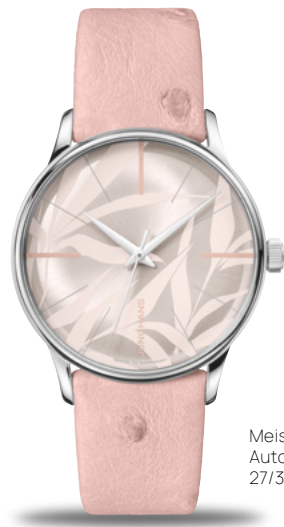
Meister Damen Automatic 27/3242.00