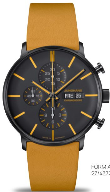
FORM A Chronoscope 2714372.00