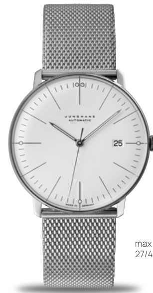
max bill Automatic 2714002.46

Gehäuse Edelstahl | Saphirglas | wasserdicht bis 5 bar max bill Chronoscope: Automatikwerk J880.2 | Stoppfunktion | Gehäuse Ø 40,0 mm max bill Automatic: Automatikwerk J800.1 | Gehäuse Ø 38,0 mm