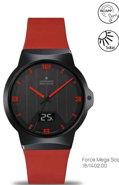
Force Mega Solar 18/1402.00