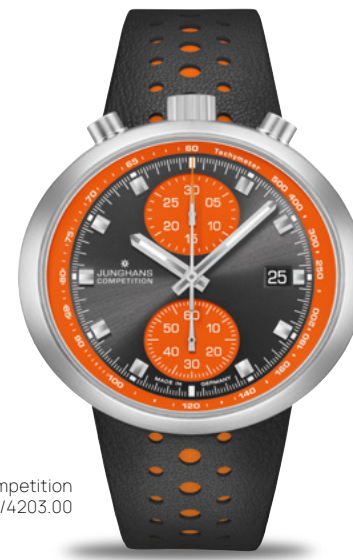
1972 Competition 2714203.00

Inspiziert von diesem Uhrenklassiker ist die 1972 Competition: Dynamisch die ovale Gehäuseform und die wie bei einer Handstoppuhr oben platzierten Drücker und Krone, spannend der Kontrast zwischen dem anthrazitfarbenen Zifferblatt und den Totalisatoren und Tachymeter-Skala in Orange. Mit modernster Ausstattung – von widerstandsfähigem Saphirglas und Schraubkrone bis zum mit Edelstahlschrauben fixierten Armband.