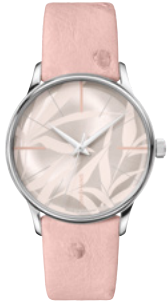
Meister Damen Automatic 27/3242.00