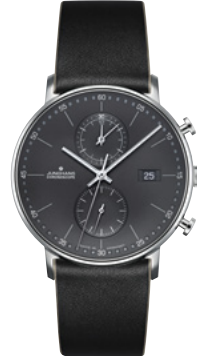
FORM C 41/4876.00