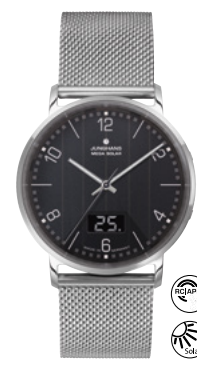
Milano Mega Solar 56/4628.44 Inkl. Lederband