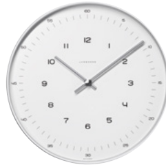
max bill Wanduhr Ø 22 cm Funk (EU) 374/7003.00 Quarz 367/6048.00