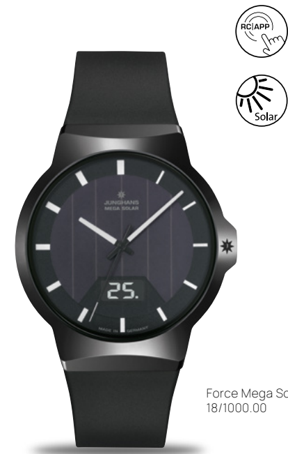
Force Mega Solar 18/1000.00