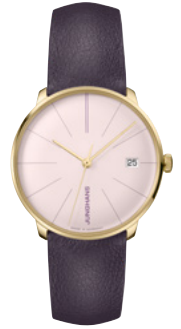
Meister fein Kleine Automatic 27/7232.00