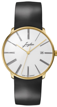
Meister fein Automatic Edition Erhard 27/9301.00