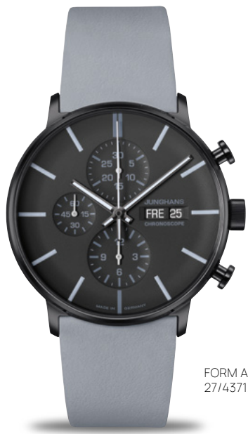
FORM A Chronoscope 27/4371.00