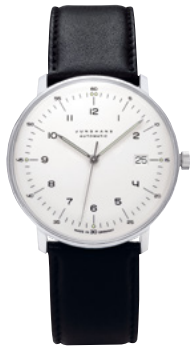
max bill Automatic 2714700.02