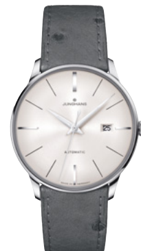
Meister Automatic 2714416.02