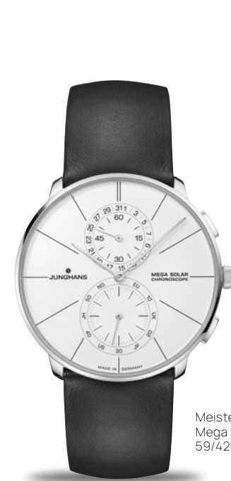
Meister fein Chronoscope Mega Solar 59/4200.00

Junghans Connected Funk-Solarwerk J110 | Stoppfunktion | Ewiger Kalender | Dunkelgangreserve bis zu 3 Jahre | Gehäuse Edelstahl bzw. PVD-beschichtet Ø 39,5 mm | Sichtboden | Saphirglas | wasserdicht bis 5 bar