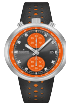
1972 Competition 27/4203.00