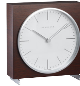
max bill Tischuhr Funk (EU) 383/2201.00 Quarz 363/2211.00