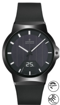
Force Mega Solar 18/1000.00