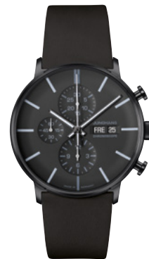
FORM A Chronoscope 27/4371.02