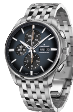
Meister S Chronoscope 27/4228.44