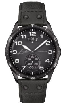
Pilot Automatic 27/4491.00