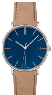
FORM Damen 47/4255.00