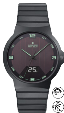
Force Mega Solar 18/1436.44