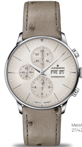
Meister Chronoscope 2714223.02

Die Uhren der Junghans Meister Linie sind seit fast einem Jahrhundert verlässliche Zeitgeber und bilden das Herzstück unserer Kollektion. Mit unserer langjährigen Erfahrung in Handarbeit gefertigt, bestechen sie durch ihre vielen liebevollen Details. Die geschwungene Gehäuseform mit stark gewölbten Gläsern, die gewölbten Zifferblätter und die schalenförmigen Hilfszifferblätter erzeugen eine ebenso elegante wie dreidimensional wirkende Anmutung. Der Sichtboden gibt den Blick auf die dekorierten mechanischen Werke frei.