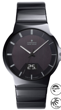
Force Mega Solar 18/1133.44