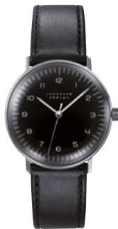
max bill Handaufzug 27/3702.02