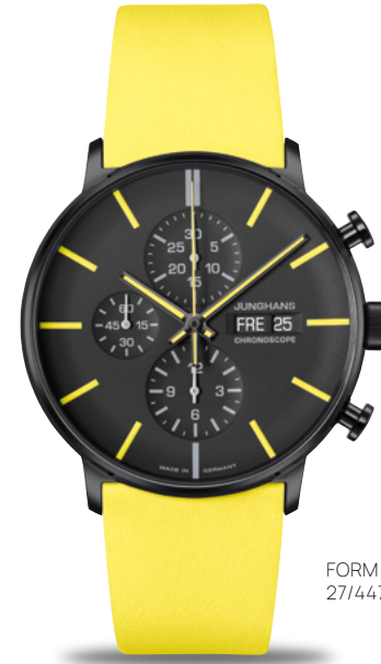
FORM A Chronoscope 2714473.00