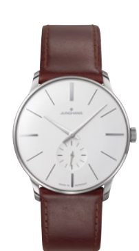
Meister Handaufzug 273200.02