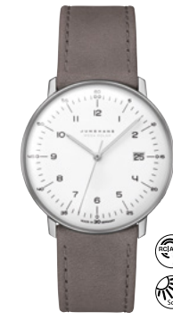
max bill Mega Solar 59/2021.02