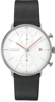
max bill Chronoscope Bauhaus 2714303.02