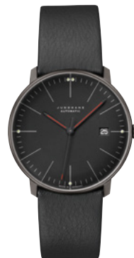
max bill Automatic Bauhaus 27/4308.02