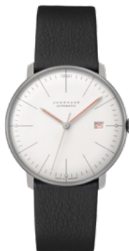
max bill Automatic Bauhaus 27/4009.02