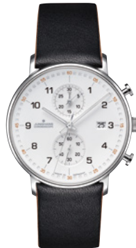
FORM C 41/4771.00