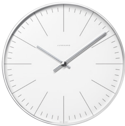
max bill Wanduhr Ø 30 cm Funk (EU) 374/7000.00 Quarz 367/6046.00