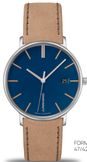
FORM Damen 47/4255.00