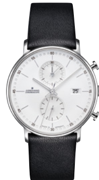
FORM C 41/4770.00