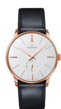
Meister Handaufzug 2715002.02