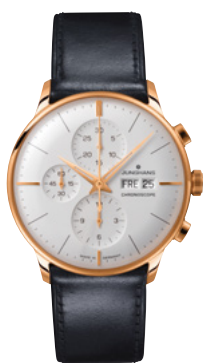
Meister Chronoscope 2717023.02