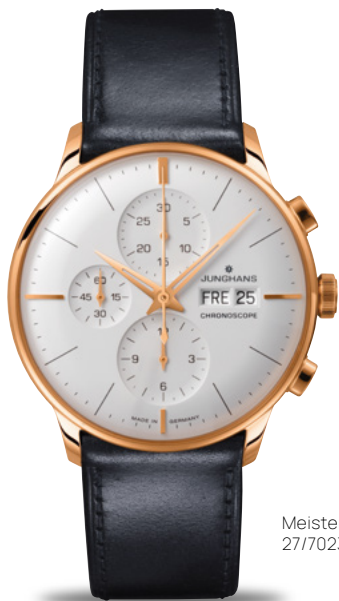
Meister Chronoscope 27/7023.02