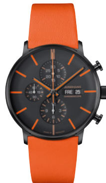
FORM A Chronoscope 27/4370.00