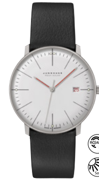
max bill Mega Solar Bauhaus 59/2326.02