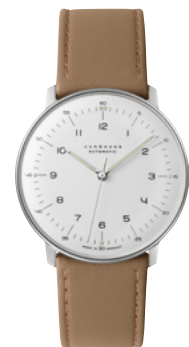
max bill Automatic 27/3502.02