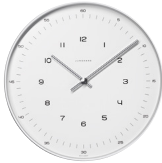
max bill Wanduhr Ø 30 cm Funk (EU) 374/7001.00 Quarz 367/6047.00