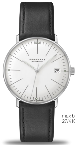
max bill Kleine Automatic 27/4105.02