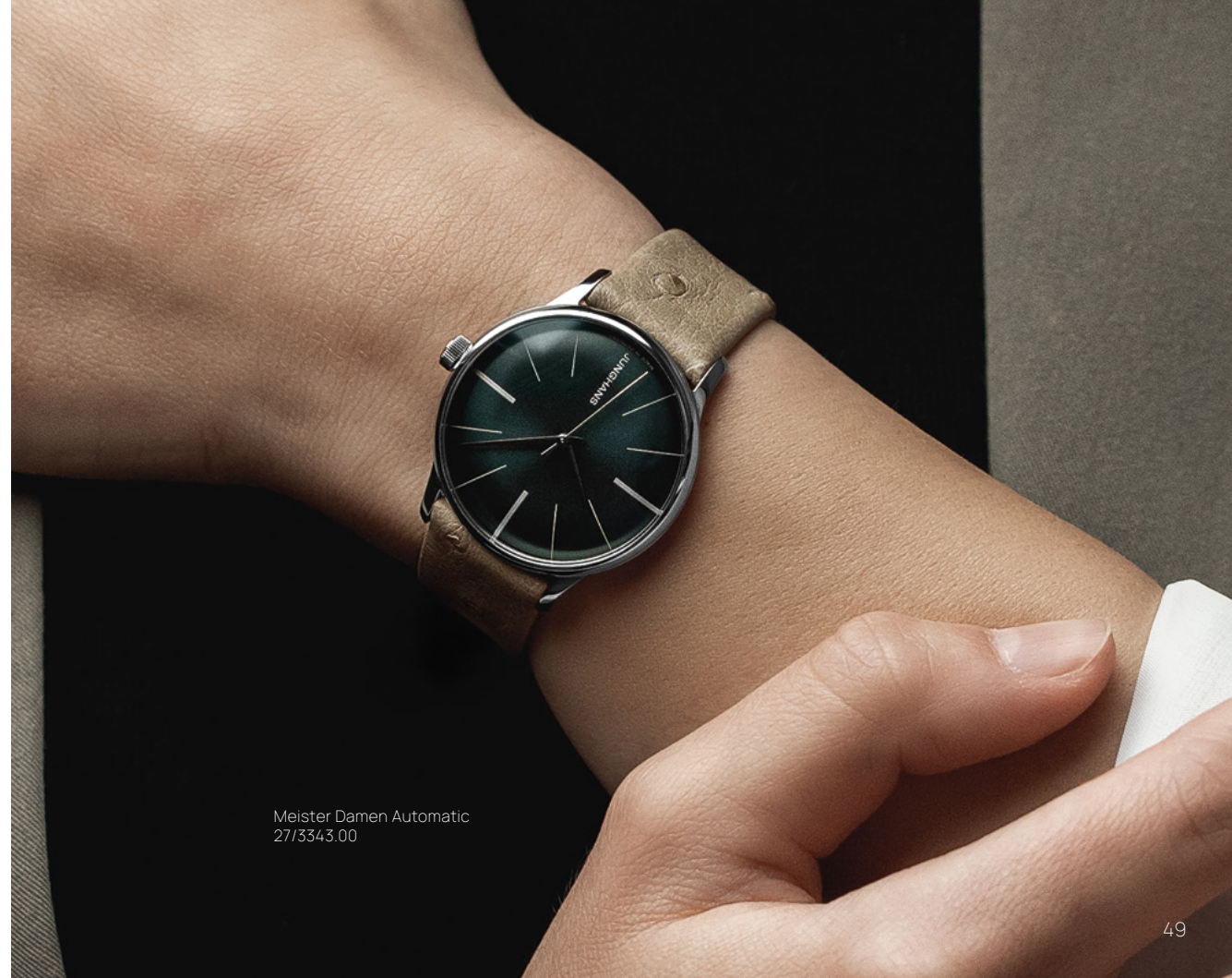
Meister Damen Automatic 27/3343.00

Gehäuse Edelstahl | Saphirglas | Sichtboden | wasserdicht bis 5 bar Meister Automatic: Automatikwerk J800.1 | Gehäuse Ø 38,4 mm Meister Damen Automatic: Automatikwerk J840.1 | Gehäuse Ø 33,1 mm