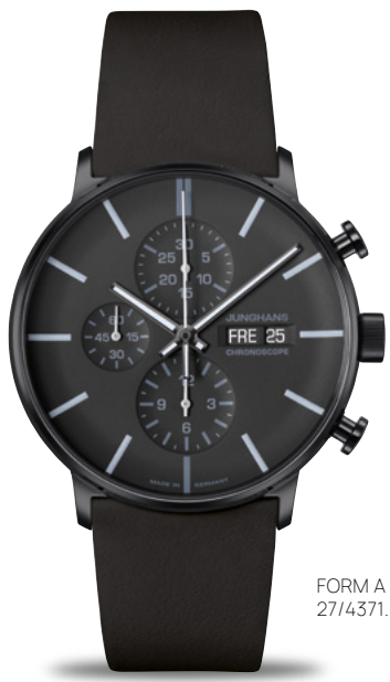
FORM A Chronoscope 27/4371.02