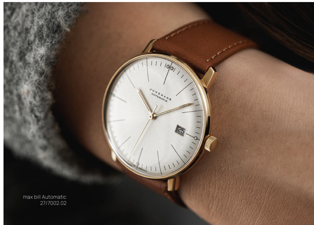
max bill Automatic 2717002.02

Automatikwerk J800.1 | Gehäuse Edelstahl PVD-beschichtet | Saphirglas | wasserdicht bis 5 bar max bill Automatic: Gehäuse Ø 38,0 mm max bill Kleine Automatic: Gehäuse Ø 34,0 mm