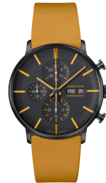
FORM A Chronoscope 27/4372.00