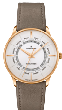
Meister Worldtimer 275012.01