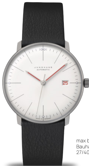
max bill Automatic Bauhaus 2714009.02