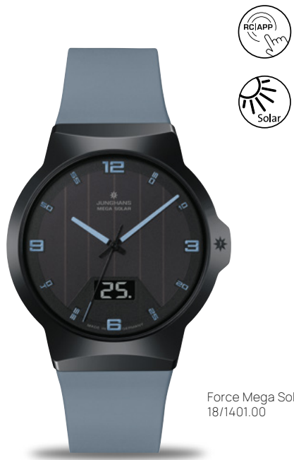
Force Mega Solar 18/1401.00