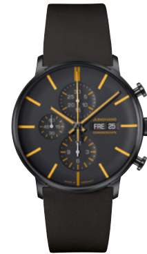
FORM A Chronoscope 27/4372.02