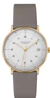
max bill Kleine Automatic 27/7108.02