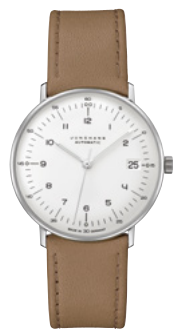
max bill Kleine Automatic 27/4107.02