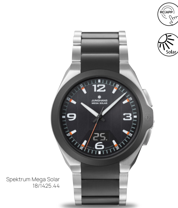
Spektrum Mega Solar 18/1425.44

Edelstahl, kratzfeste Keramik und eine Wasserdichtheit bis 10 bar machen die Spektrum Mega Solar zu unserer sportlichsten Funkuhr. Angetrieben durch die Energie der Sonne, erweist sich die Uhr nicht nur als besonders präziser, sondern gleichzeitig auch als besonders ressourcenschonender Zeitmesser.