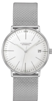
max bill Kleine Automatic 27/4106.46