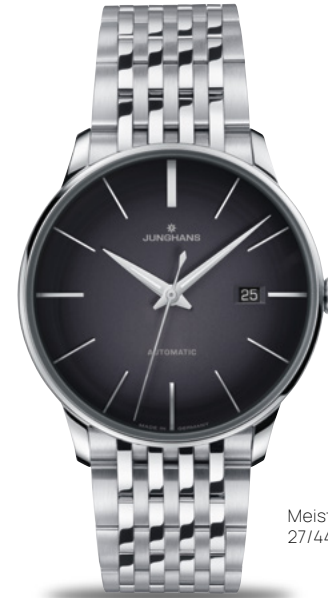
Meister Automatic 27/4417.46