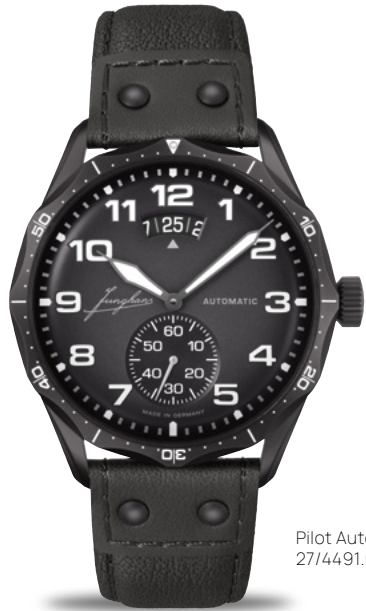
Pilot Automatic 27/4491.00