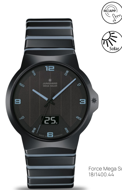
Force Mega Solar 18/1400.44

Junghans Multifrequenz-Funk-Solarwerk J615.84 | Dunkelgangreserve bis zu 21 Monate | Gehäuse Keramik Ø 40,4 mm | Saphirglas | wasserdicht bis 5 bar