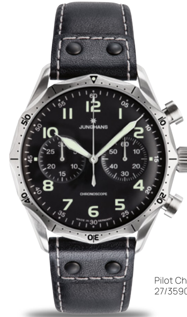
Pilot Chronoscope 27/3590.00

Die Pilot zeugt von unserer Begeisterung für die Luftfahrt: Das Zifferblatt mit seinen markanten Leuchtzahlen und -zeigern bietet eine optimale Ablesbarkeit. Die ergonomisch konzipierte Lünette sorgt sowohl für eine gute Griffbarkeit als auch für eine einmalige Optik.