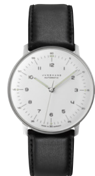
max bill Automatic 27/3500.02