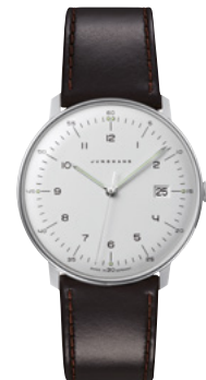
max bill Quarz 41/4461.02