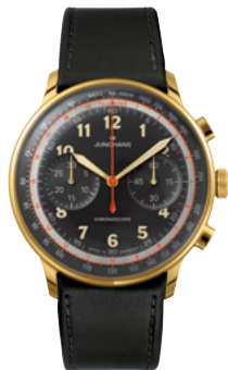
Telemeter Edition JF 27/3480.02