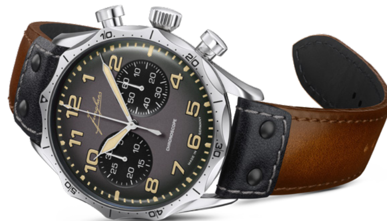
Pilot Chronoscope 27/3493.00