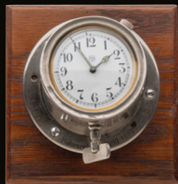
1917 Borduhr eines Luftschiffs, das mit 7600 m einen Höhenrekord erreichte

Schon immer übte die Fliegerei eine besondere Faszination auf Junghans aus. Kein Wunder, sind doch Aeronautik und Zeitmessung historisch eng miteinander verbunden. Schon in den 1930er Jahren fertigte Junghans Borduhren für Flugzeuge und Luftschiffe, anhand derer die Flugdauer ermittelt werden konnte. In den 1950ern entwickelte man für die neu gegründete Bundeswehr einen heute legendären Flieger-Chronographen. In dieser Tradition stehen auch die neuesten Pilot-Modelle unserer Kollektion.