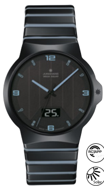
Force Mega Solar 18/1400.44