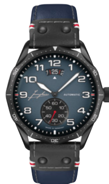
Pilot Automatic Navy Blue 27/4397.00