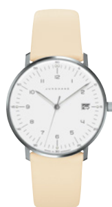
max bill Damen 47/4252.02