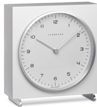
max bill Tischuhr Funk (EU) 383/2200.00 Quarz 363/2210.00