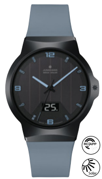
Force Mega Solar 18/1401.00