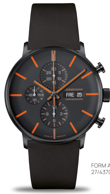
FORM A Chronoscope 27/4370.02