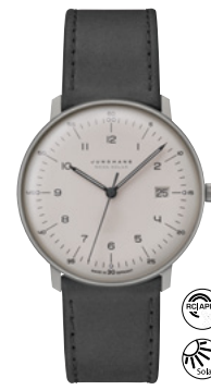
max bill Mega Solar 59/2023.02