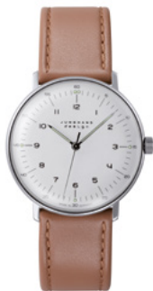
max bill Handaufzug 27/3701.02