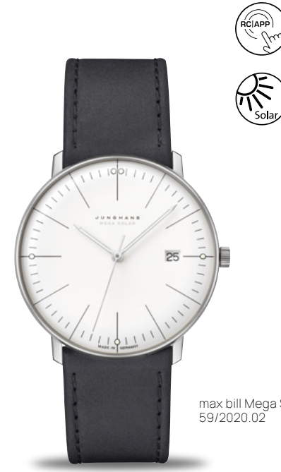
max bill Mega Solar 59/2020.02

Gefertigt aus korrosions- und temperaturbeständigem, überraschend leichtem und hautfreundlichem Titan, ist diese Variante der max bill Mega Solar mit vegetabil gegerbtem Lederband besonders angenehm zu tragen.