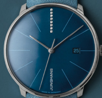
Meister fein Automatic 2714356.00