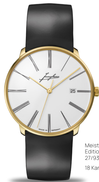
Meister fein Automatic Edition Erhard 27/9301.00 18 Karat Gelbgold