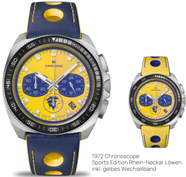
1972 Chronoscope Sports Edition Rhein-Neckar Löwen inkl. gelbes Wechselband