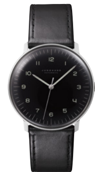
max bill Automatic 27/3400.02