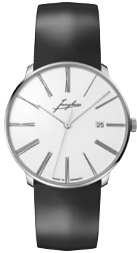
Meister fein Automatic Edition Erhard 27/9300.00