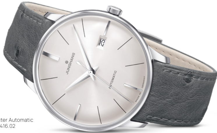
Meister Automatic 27/4416.02