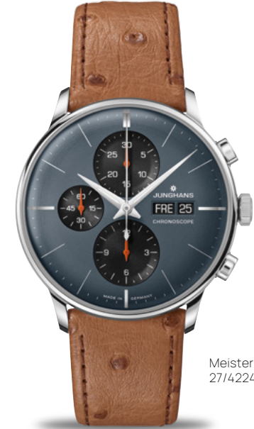
Meister Chronoscope 2714224.02

Automatikwerk J880.1 | Stoppfunktion | Gehäuse Edelstahl Ø 40,7 mm | Saphirglas | Sichtboden | wasserdicht bis 5 bar