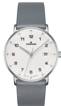
FORM Quarz 41/4885.00