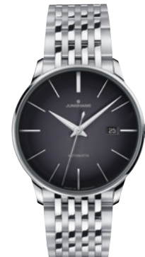
Meister Automatic 2714417.46