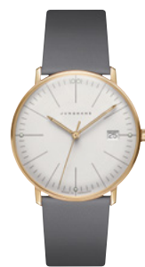
max bill Damen 47/7853.02