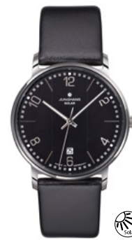
Milano Solar 14/4062.00