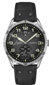
Pilot Automatic 27/4490.00