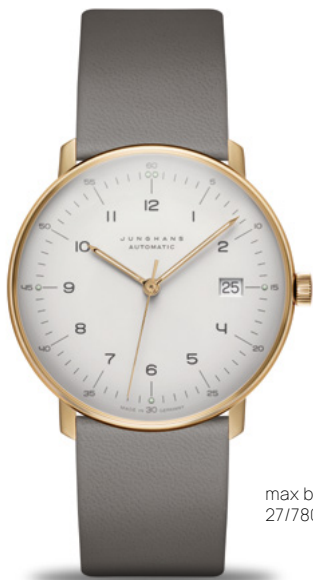
max bill Automatic 2717806.02