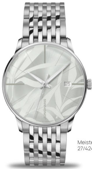
Meister Automatic 27/4243.46