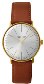
max bill Handaufzug 27/5703.02