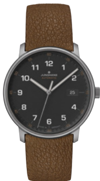
FORMA Titan 27/2002.00