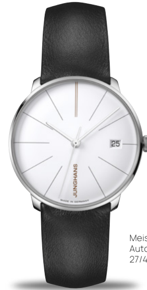
Meister fein Kleine Automatic 27/4230.00