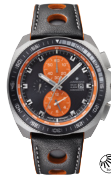
1972 Chronoscope Solar 14/4200.00