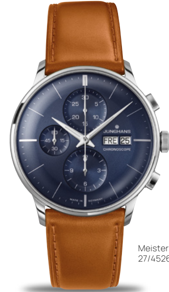
Meister Chronoscope 27/4526.02

Automatikwerk J880.1 | Stoppfunktion | Gehäuse Edelstahl Ø 40,7 mm | Saphirglas | Sichtboden | wasserdicht bis 5 bar