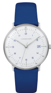
max bill Damen 47/4540.02