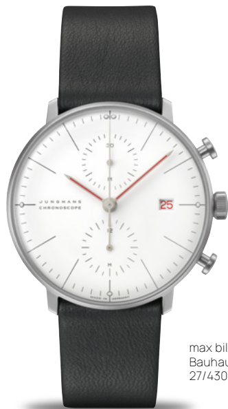
max bill Chronoscope Bauhaus 2714303.02