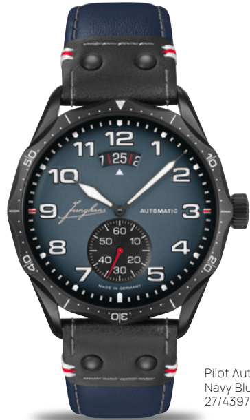
Pilot Automatic Navy Blue 27/4397.00