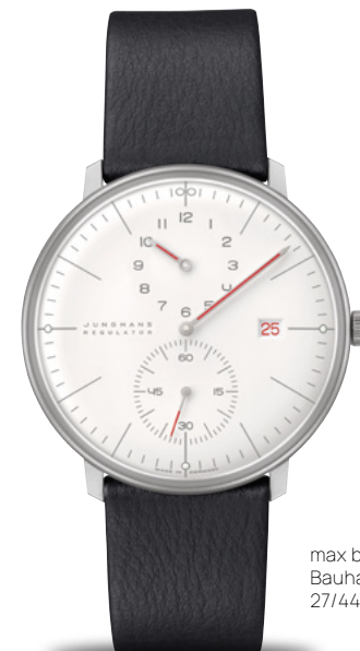
max bill Regulator Bauhaus 2714493.02