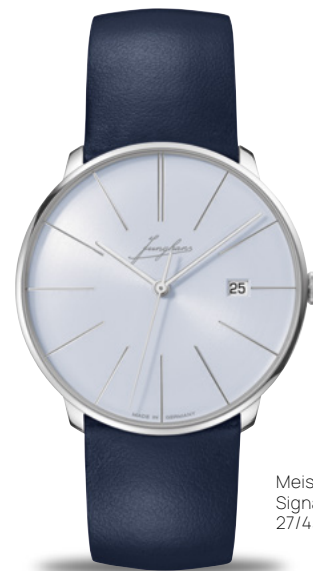
Meister fein Automatic Signatur 2714359.00

Die Meister fein Automatic Signatur besticht durch feine, wertvolle Details: Wie das flache Gehäuse. Wie das gewölbte Front- und Bodenglas aus entspiegeltem Saphirglas. Wie das Zifferblatt mit einem historischen Junghans Logo und diamantierten Linien für die Stundenmarkierungen. Durch den extragroßen Sichtboden kann man den eigens entwickelten zwischenkligen Rotor bewundern.