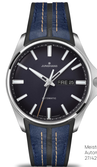
Meister S Automatic 2714211.00

Meister S Chronoscope: Automatikwerk J880.1 | Stoppfunktion | Gehäuse Edelstahl Ø 45,0 mm | verschraubte Krone