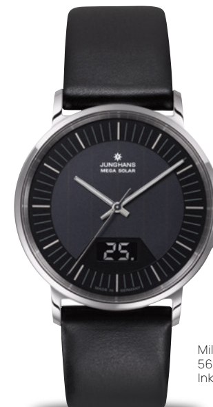
Milano Mega Solar 56/4220.00 Inkl. Milanaiseband

Let the sun shine in: In der Milano Mega Solar und der Milano Solar sorgen Solarzellen für die nötige Energie. Die Glassolarzifferblätter, die das kostbare Sonnenlicht aufnehmen, werden in unserer Schleiferei und Druckerei in zahlreichen Arbeitsschritten bearbeitet.