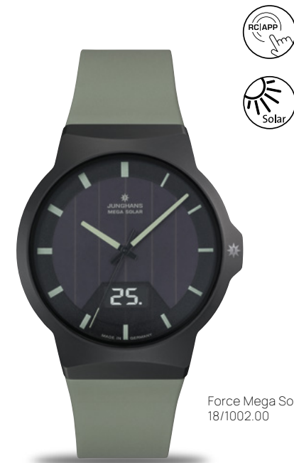
Force Mega Solar 18/1002.00

Die Force Mega Solar kombiniert einen hohen Tragekomfort und Coolness mit enormer Alltagstauglichkeit. Unterstrichen wird dies nicht zuletzt durch das gut ablesbare Großdatum sowie die Zeiger und Ziffern, die mit umweltfreundlicher Leuchtmasse ausgelegt sind – farblich passend zum Armband aus synthetischem Kautschuk.