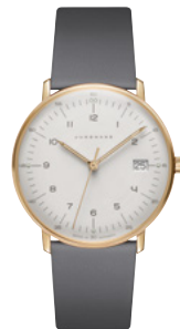
max bill Damen 47/7854.02