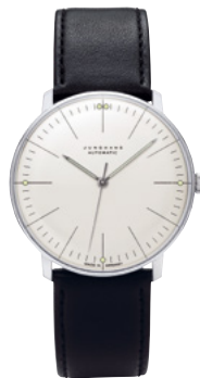
max bill Automatic 27/3501.02