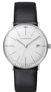
max bill Damen 47/4251.02