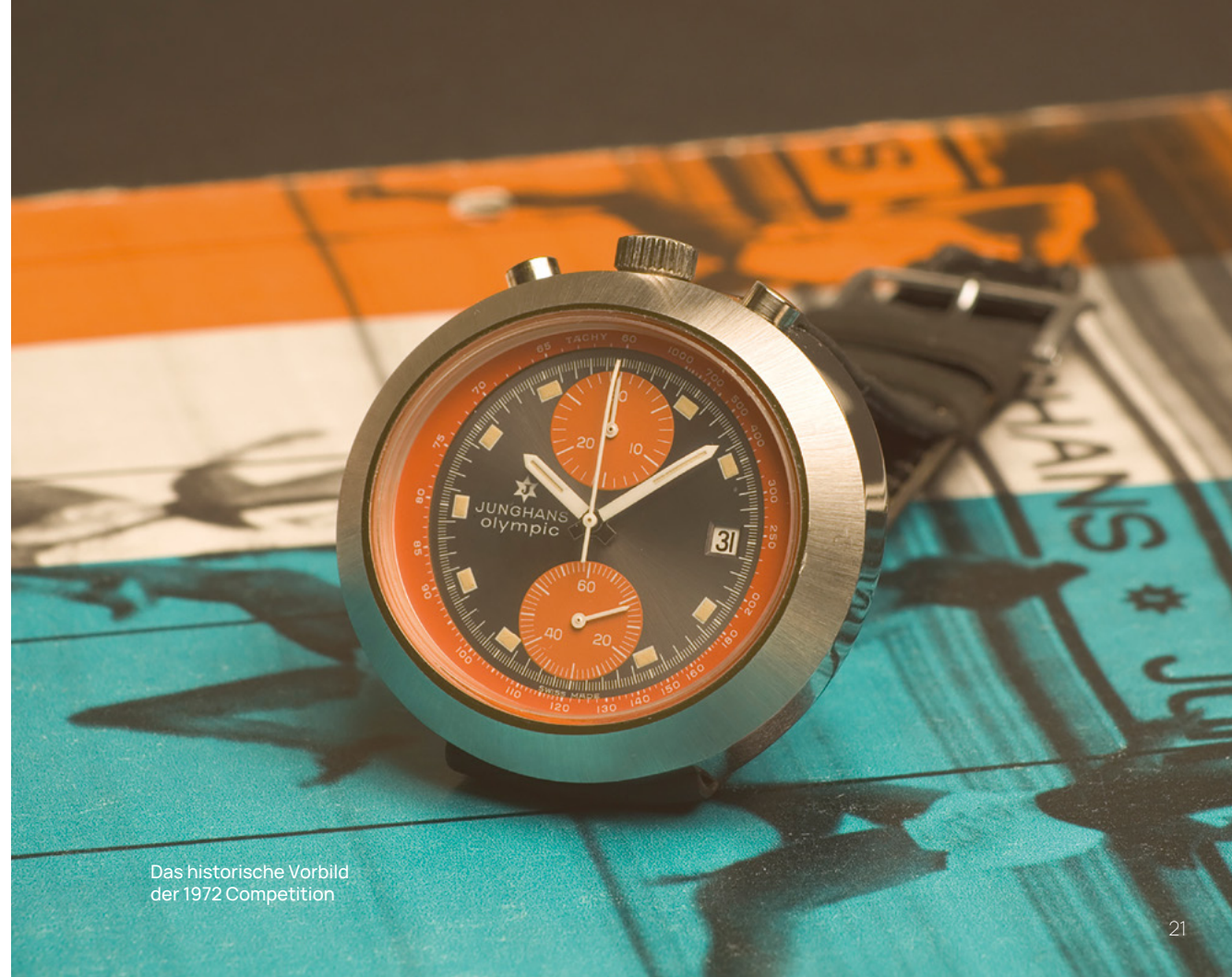
Das historische Vorbild der 1972 Competition