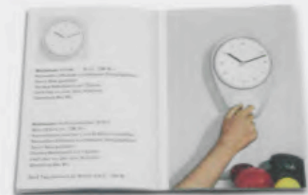
Junghans Katalog aus den 1960er Jahren Junghans catalogue 1960s