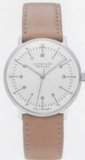
Max Bill Handaufzug 027/3701.00

Features: mechanical hand-winding movement J805.1, some models with luminous hands and indices/figures, stainless steel case or 10 micron gold-plated stainless steel case, convex hard Plexiglas, calfskin strap with buckle, water-protected