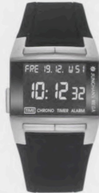
Mega 1000 026/4801.00