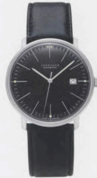
Max Bill Automatic 027/4701.00

Features: Automatic mechanical movement J800.1 with display for date, luminous hands and indices, stainless steel case or 10 micron gold-plated stainless steel case, convex hard Plexiglas, calfskin strap with buckle, water-protected