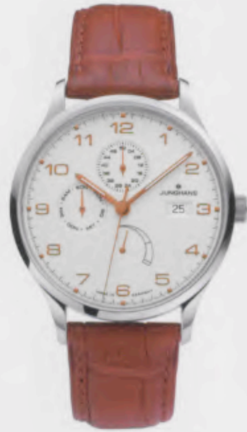
Attaché Agenda 027/4761.00