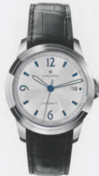
Ambassador Automatic 027/4513.00

Features: Automatic mechanical movement J800.1, with display for date, luminous hands and indices, stainless steel case, sapphire crystal on top and bottom, genuine crocodile leather strap, stainless steel folding clasp, water-resistant up to 5 atm