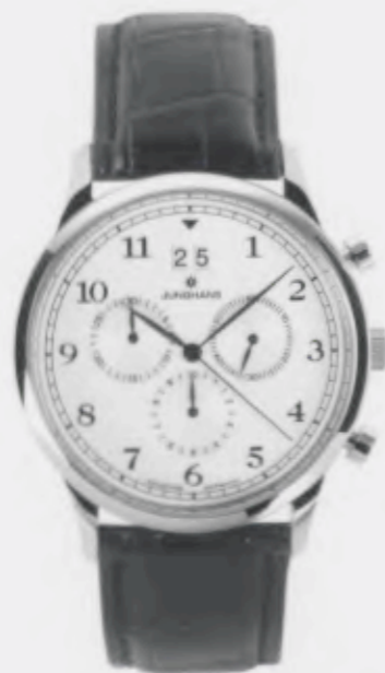
Tempora Chronograph 041/4687.00

Features: Quartz movement with display for big date, chronoscope with second stop, 1/10 second and 30 minutes counter, stainless steel case, sapphire crystal, leather strap, stainless steel buckle, water-resistant up to 5 atm