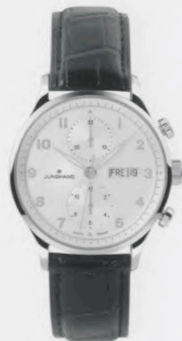
Attaché Chronoscope 027/4550.00