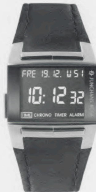
Mega 1000 026/4511.00