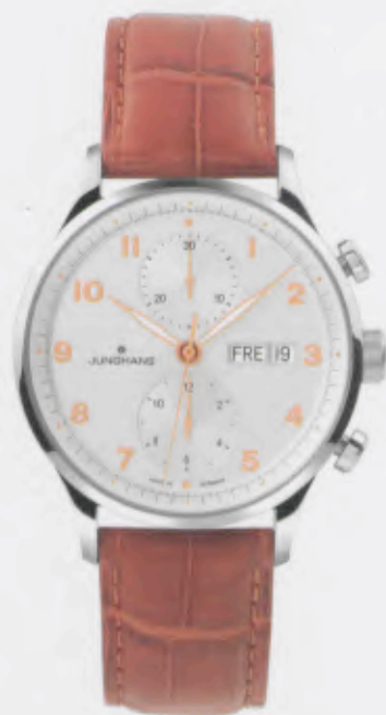
Attaché Chronoscope 027/4551.00

Features: Automatic mechanical movement J880.2 with display for date and day, chronoscope with second stop, luminous hands, stainless steel case, sapphire crystal on top and bottom, genuine crocodile leather strap, stainless steel folding clasp, water-resistant up to 3 atm