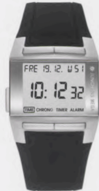
Mega 1000 026/4802.00