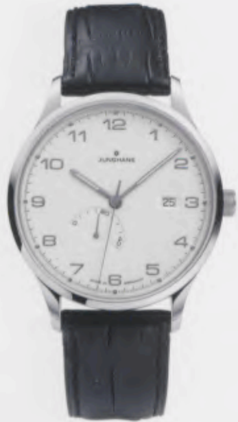
Attaché Gangreserve 027/4780.00

Features: Automatic mechanical movement J810.2 with display for date and power reserve, luminous hands, stainless steel case, sapphire crystal on top and bottom, genuine crocodile leather strap, stainless steel folding clasp, water-resistant up to 3 atm