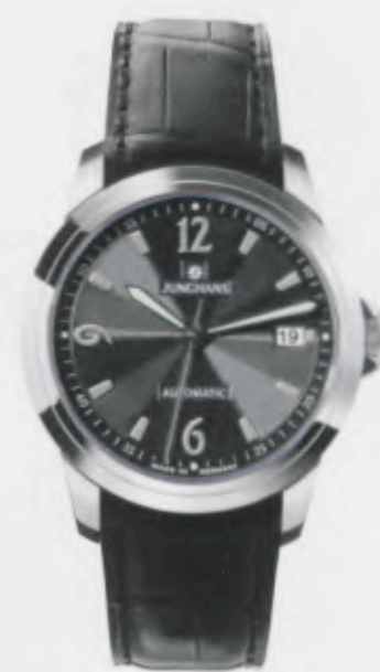
Ambassador Automatic 027/4515.00