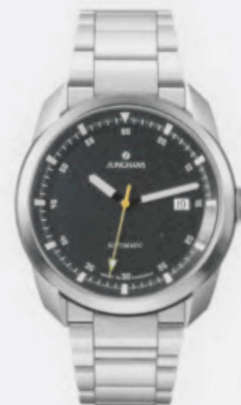
Archimedes Automatic 027/4609.44