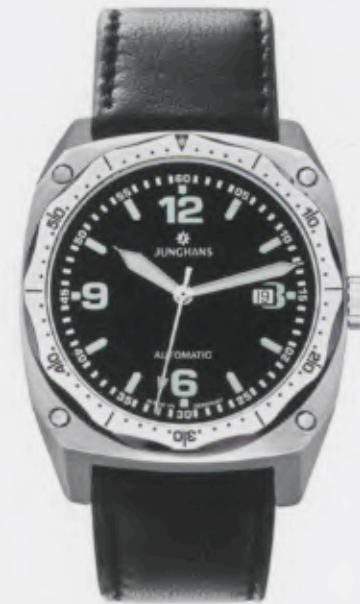
Pilot Automatic 027/4520.00

Features: Automatic mechanical movement J800.1 with display for date, luminous hands and indices, satin-finished or black PVD-coated stainless steel case, turning bezel, sapphire crystal, leather strap, stainless steel buckle, water-resistant up to 10 atm