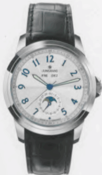
Ambassador Kalender 027/4530.00

Features: Automatic mechanical movement J800.2 with display for date, day, month and moon phase, luminous hands and indices, stainless steel case, sapphire crystal on top and bottom, genuine crocodile leather strap, stainless steel folding clasp, water-resistant up to 5 atm