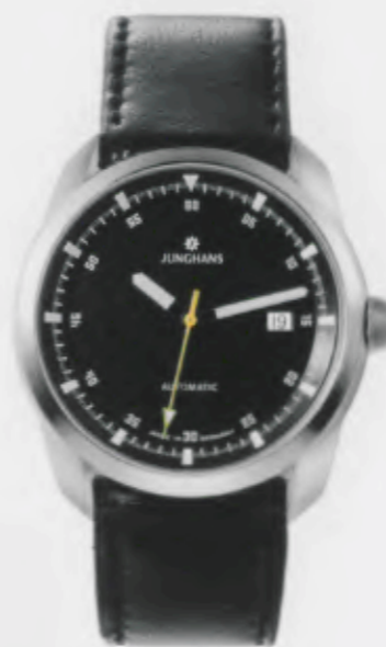
Archimedes Automatic 027/4508.00

Features: Automatic mechanical movement J800.1 with display for date, luminous hands and indices, stainless steel case, sapphire crystal on top and bottom, leather strap or stainless steel bracelet, stainless steel folding clasp, water-resistant up to 5 atm