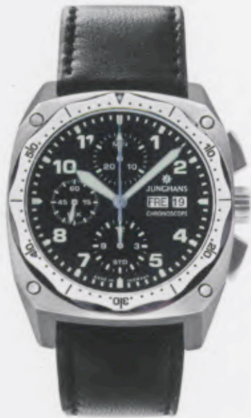
Pilot Chronoscope 027/4522.00

Features: Automatic mechanical movement J880.1 with display for date and day, chronoscope with second stop, luminous hands and indices, satin-finished or black PVD-coated stainless steel case, turning bezel, sapphire crystal, leather strap, stainless steel buckle, water-resistant up to 10 atm