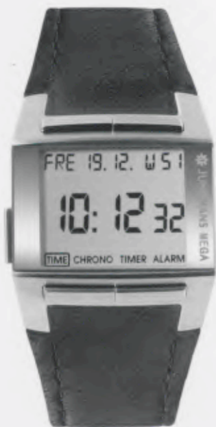
Mega 1000 026/4510.00

Features: Multi-frequency radio-controlled movement J604.64, alarm, chronograph with second stop, countdown, date (German, English, or French), calendar week, 2nd time zone, stainless steel case, sapphire crystal, leather strap with stainless steel buckle or stainless steel bracelet with folding clasp, water-resistant up to 5 atm