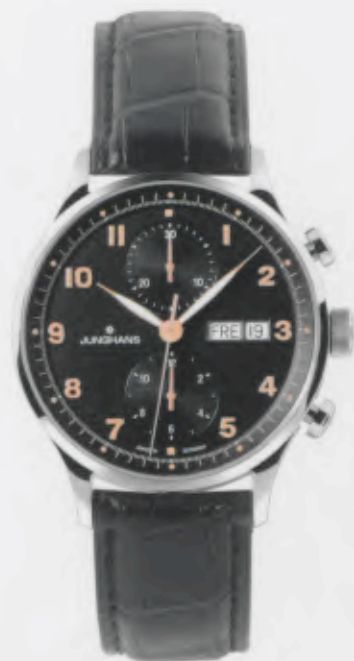
Attaché Chronoscope 027/4553.00