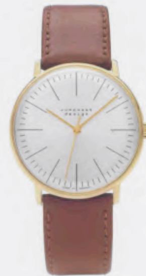
Max Bill Handaufzug 027/5703.00