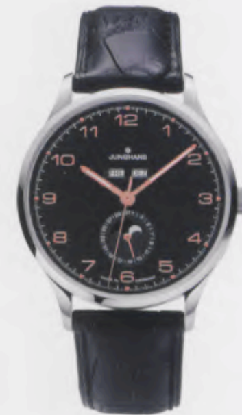
Attaché Kalender 027/4773.00