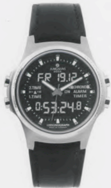
Apollo Alarm Chronograph 054/4620.00

Features: Analog/digital radio-controlled movement J615.33, alarm, chronograph with stopwatch function, countdown, date (German, English or French), 2nd time zone, LCD can be switched off, luminous hands and indices, stainless steel case, sapphire crystal, leather strap or stainless steel bracelet, stainless steel folding clasp, water-resistant up to 10 atm