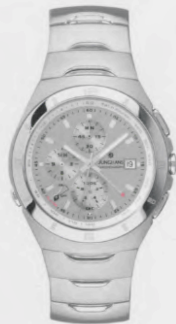
Stream Chronograph 041/4632.44

Features: Quartz movement with display for date, chronograph with second stop, alarm, luminous hands, stainless steel case, sapphire crystal, stainless steel bracelet, stainless steel folding clasp, water-resistant up to 10 atm