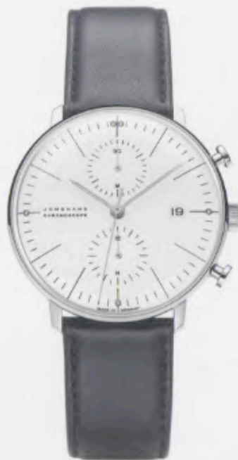
Max Bill Chronoscope 027/4600.00

Features: Automatic mechanical movement J880.2 with display for date, chronoscope with second stop, luminous hands and indices, stainless steel case, convex hard Plexiglas, calfskin strap with buckle, water-protected