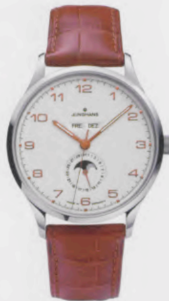
Attaché Kalender 027/4771.00