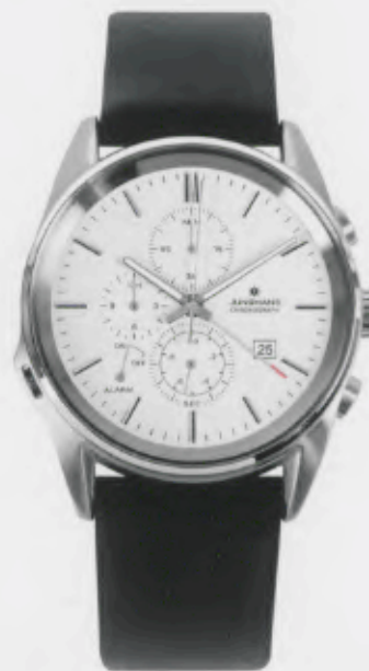
Sigma Chronograph 041/4657.00

Features: Quartz movement with display for date, chronograph with second stop, alarm, luminous hands, stainless steel case, sapphire crystal, leather strap, stainless steel buckle, water-resistant up to 5 atm