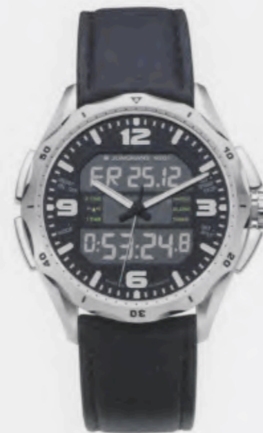
Aviator Chronograph 056/4701.00

Features: Multi-frequency radio-controlled movement J615.97 with date (German, English or French), stop watch including split-function, countdown, alarm, 2nd time zone display, luminous hands and indices, stainless steel case, sapphire crystal, leather strap or stainless steel bracelet, stainless steel folding clasp, water-resistant up to 10 atm