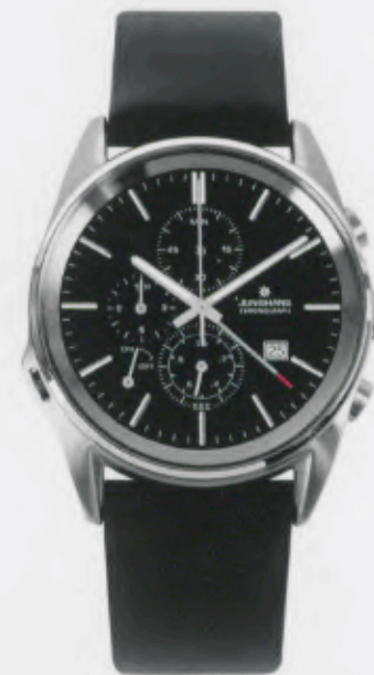
Sigma Chronograph 041/4658.00