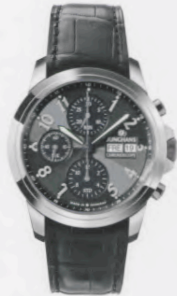
Ambassador Chronoscope 027/4514.00