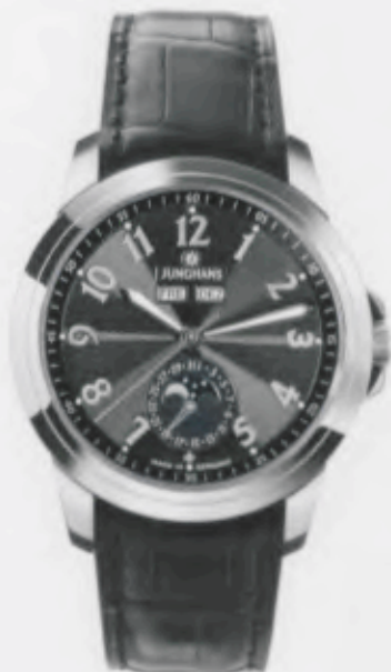
Ambassador Kalender 027/4629.00