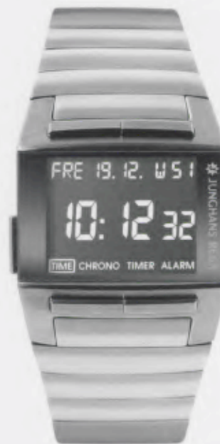
Mega 1000 026/4512.44