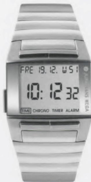
Mega 1000 026/4513.44