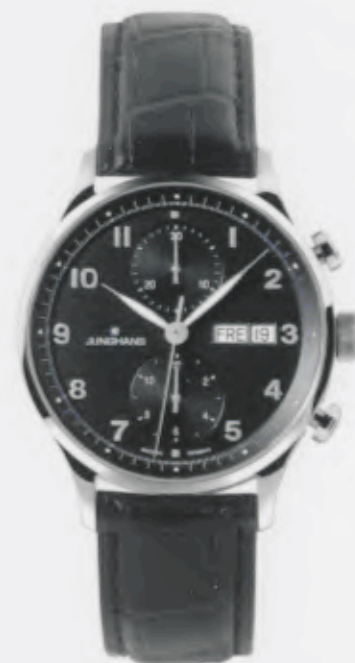
Attaché Chronoscope 027/4552.00