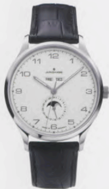
Attaché Kalender 027/4770.00

Features: Automatic mechanical movement J800.2 with display for day and date, month and moon phase, luminous hands, stainless steel case, sapphire crystal on top and bottom, genuine crocodile leather strap, stainless steel folding clasp, water-resistant up to 3 atm