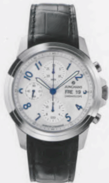
Ambassador Chronoscope 027/4512.00

Features: Automatic mechanical movement J880.1 with display for date and day, chronoscope with second stop, luminous hands and indices, stainless steel case, sapphire crystal on top and bottom, genuine crocodile leather strap, stainless steel folding clasp, water-resistant up to 5 atm