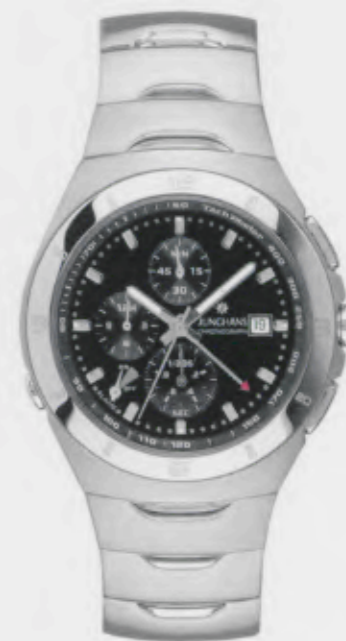
Stream Chronograph 041/4430.44