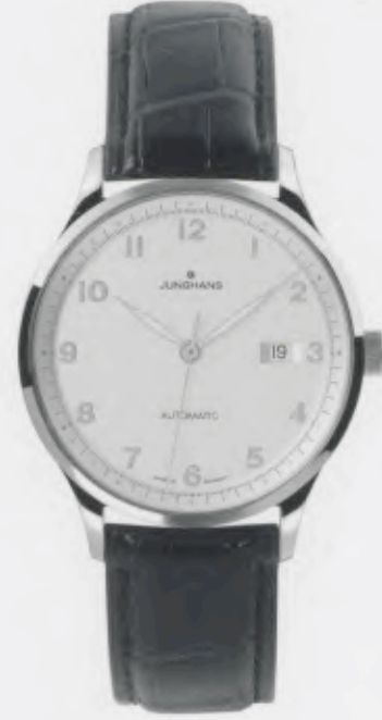
Attaché Automatic 027/4540.00