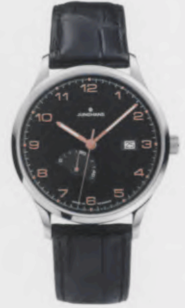
Attaché Gangreserve 027/4783.00