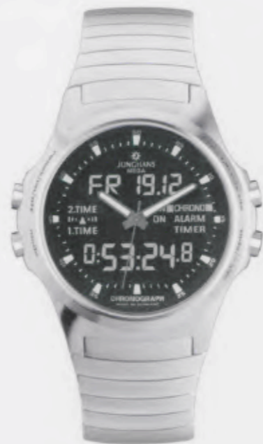
Apollo Alarm Chronograph 054/4320.44