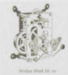
Wischer Werk Nr. 10

The legendary caliber 10 is introduced and will be applied, unchanged, as the standard alarm clock movement for the next 50 years.