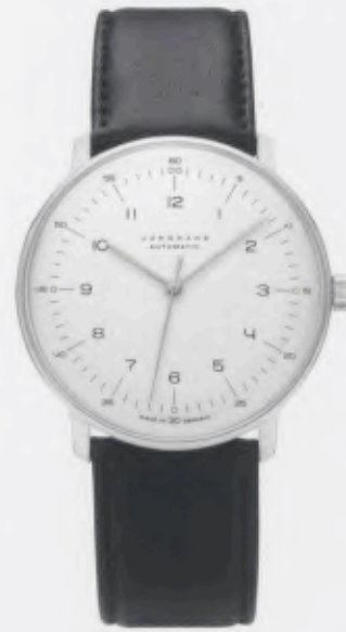
Max Bill Automatic 027/3500.00

Ausstattung: Automatikwerk J800.1 mit Datumsanzeige, Indizes und Zeiger mit Leuchtmasse, Gehäuse Edelstahl bzw. Edelstahl 10 Mikron vergoldet, Plexi Hartglas gewölbt, Kalbslederband mit Dornschnelle, wassergeschützt