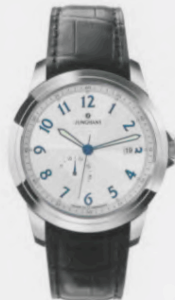
Ambassador Gangreserve 027/4531.00

Features: Automatic mechanical movement J810.2 with display for date and power reserve, luminous hands and indices, stainless steel case, sapphire crystal on top and bottom, genuine crocodile leather strap, stainless steel folding clasp, water-resistant up to 5 atm