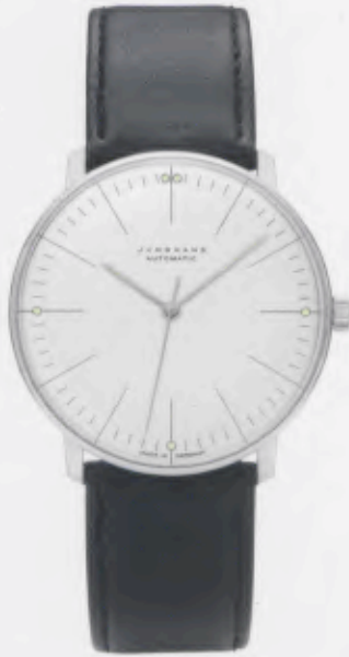
Max Bill Automatic 027/3501.00

Features: Automatic mechanical movement J800.1, luminous hands and indices, stainless steel case, convex hard Plexiglas, calfskin strap with buckle, water-protected