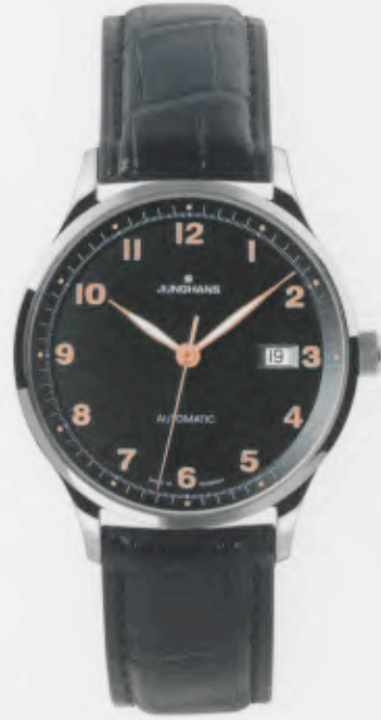
Attaché Automatic 027/4543.00