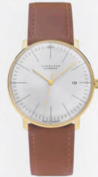
Max Bill Automatic 027/7700.00