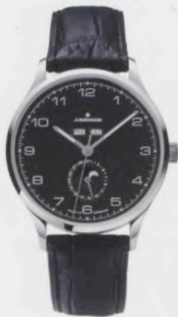
Attaché Kalender 027/4772.00