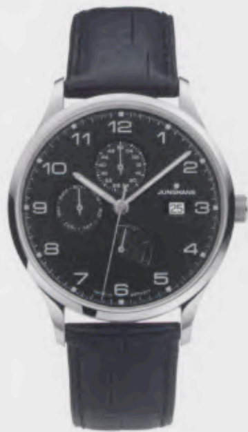
Attaché Agenda 027/4762.00