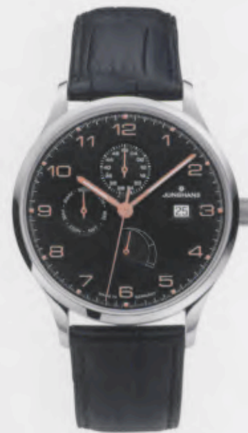
Attaché Agenda 027/4763.00