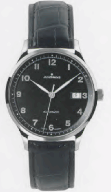
Attaché Automatic 027/4542.00