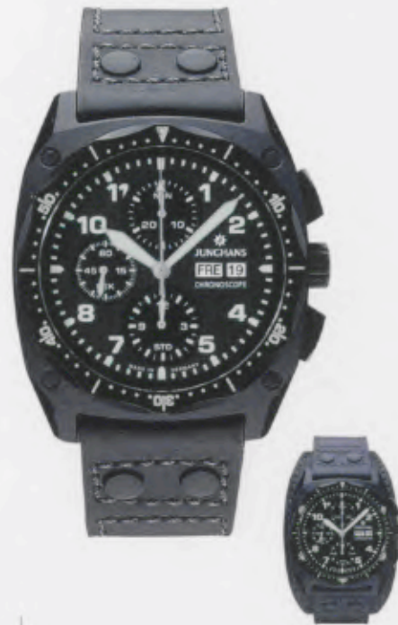
Pilot Chronoscope 027/4523.00