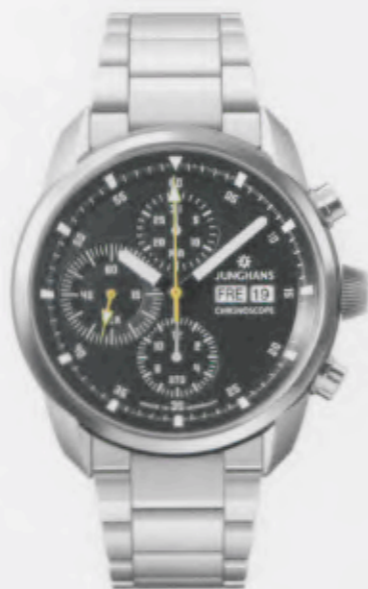
Archimedes Chronoscope 027/4611.44