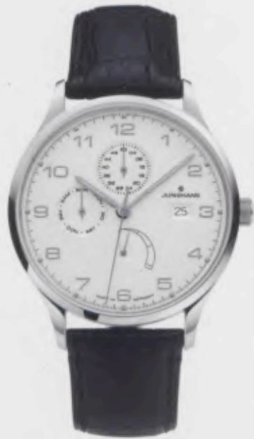
Attaché Agenda 027/4760.00

Features: Automatic mechanical movement J810.5 with display for date, day, calendar week and power reserve, luminous hands, stainless steel case, sapphire crystal on top and bottom, genuine crocodile leather strap, stainless steel folding clasp, water-resistant up to 3 atm