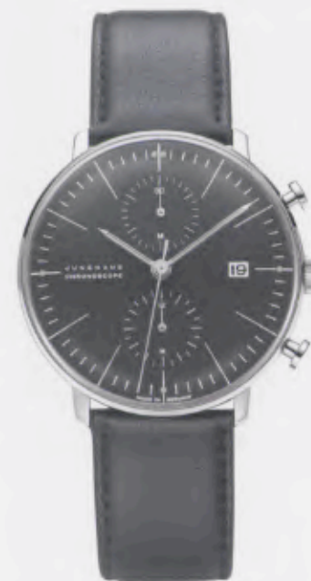
Max Bill Chronoscope 027/4601.00