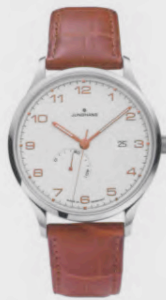
Attaché Gangreserve 027/4781.00