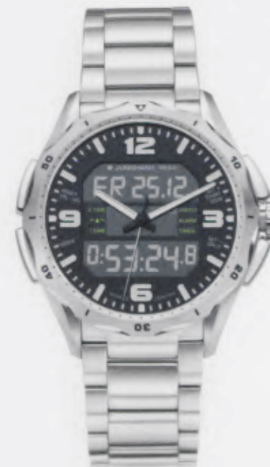
Aviator Chronograph 056/4700.44