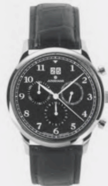
Tempora Chronograph 041/4690.00