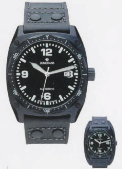
Pilot Automatic 027/4521.00