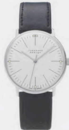
Max Bill Handaufzug 027/3700.00