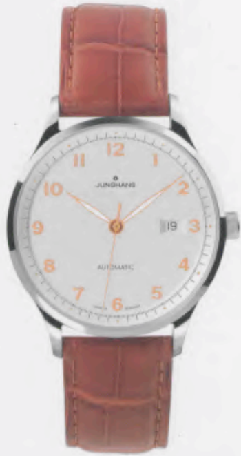
Attaché Automatic 027/4541.00

Features: Automatic mechanical movement J800.1 with display for date, luminous hands, stainless steel case, sapphire crystal on top and bottom, genuine crocodile leather strap, stainless steel folding clasp, water-resistant up to 3 atm