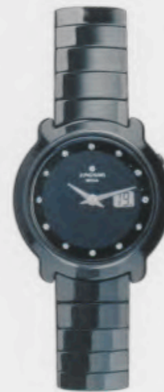
Stratos Lady 013/1002.44