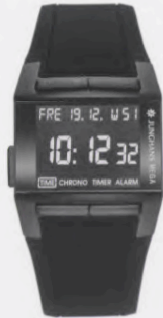
Mega 1000 026/4800.00

Features: Multi-frequency radio-controlled movement J604.64, alarm, chronograph with second stop, countdown, date (German, English, or French), calendar week, 2nd time zone, stainless steel case, sapphire crystal, rubber strap, stainless steel buckle, water-resistant up to 5 atm