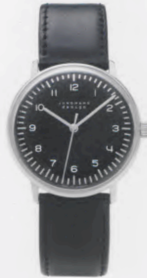
Max Bill Handaufzug 027/3702.00