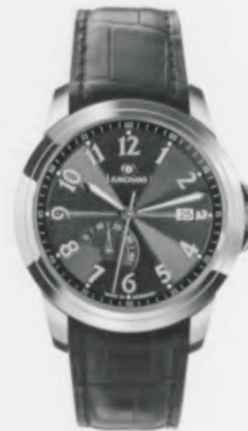
Ambassador Gangreserve 027/4632.00