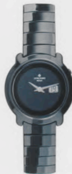
Stratos Lady 013/1611.44

Features: Radio-controlled movement J612.42 with display for date, ceramic case, sapphire crystal, ceramic bracelet, stainless steel folding clasp, water-resistant up to 3 atm