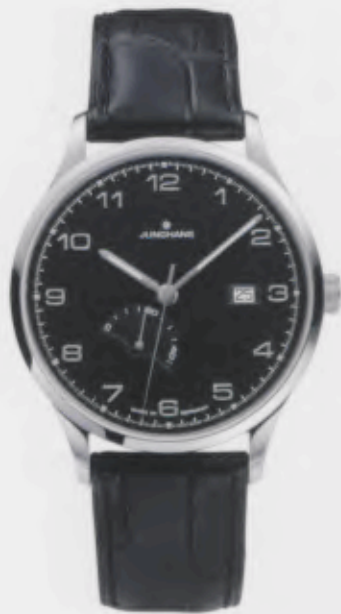
Attaché Gangreserve 027/4782.00