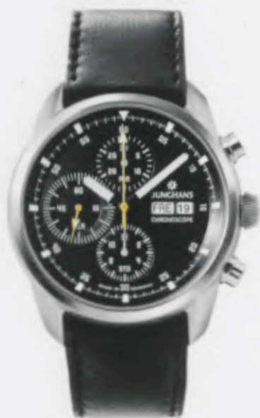
Archimedes Chronoscope 027/4510.00

Features: Automatic mechanical movement J880.1, chronoscope with second stop, display for date and day, luminous hands and indices, stainless steel case, sapphire crystal on top and bottom, leather strap or stainless steel bracelet, stainless steel folding clasp, water-resistant up to 5 atm