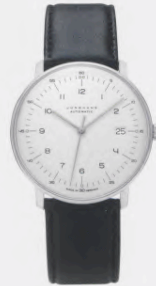
Max Bill Automatic 027/4700.00