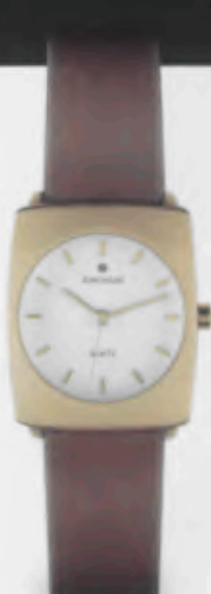
047/5222.00 Gehäuse ionenplattiert. Braunes Lederband. € 99,00*

Modell auch in silberfarben erhältlich. € 99,00*