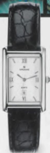
041/4103.00 Gehäuse poliert. Schwarzes Krokodermimitationsband. € 99,00*