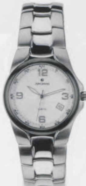
041/4191.44 Edelstahlgehäuse und -band poliert und geschliffen, Silber- grainée Zifferblatt. € 155,00*