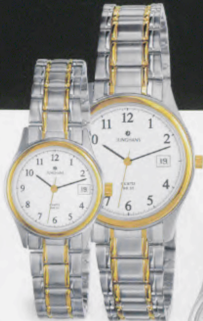
047/4729.44 Edelstahlband bicolor gelbver- goldet, geschliffen und poliert. € 75,00*