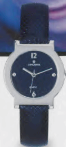
047/3091.00 Blaues Textilband. € 79,00*