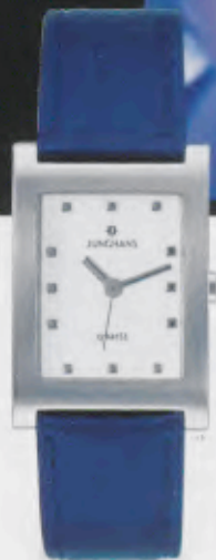
047/0981.00 Blaues Textilband. € 79,00*