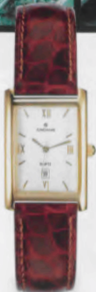
041/7100.00 Gehäuse gelbvergoldet. Braunes Krokodermimitationsband. € 115,00*