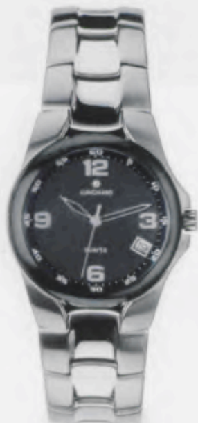
041/4190.44 Edelstahlgehäuse und -band poliert und geschliffen, Dunkel- graues Zifferblatt. € 155,00*

Global Player. Spitzenleistung! Zu jeder Zeit. An jedem Ort. Überall. Junghans Air Jet.