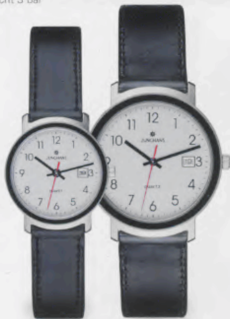
047/1220.00 Schwarzes Lederband. € 59,00*