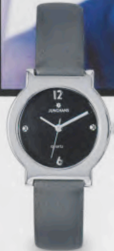
047/3092.00 Graues Textilband. € 79,00*