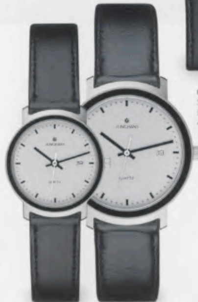
047/1221.00 Schwarzes Lederband. € 59,00*