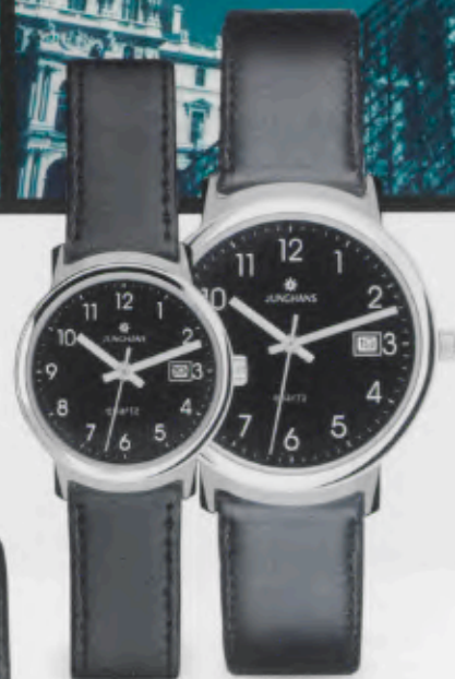
047/1222.00 Schwarzes Lederband. € 59,00*