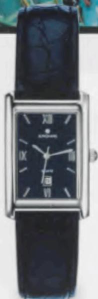
041/4104.00 Gehäuse poliert. Blaues Krokodermimitationsband. € 99,00*