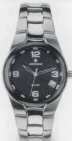
047/4190.44 Edelstahlgehäuse und -band poliert und geschliffen, Dunkel- graues Zifferblatt. € 155,00*