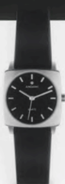
047/3221.00 Gehäuse geschliffen. Schwarzes Lederband. € 99,00*

Modell auch in silberfarben erhältlich. € 99,00*