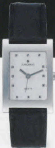
047/0982.00 Schwarzes Textilband. € 79,00*