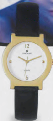
047/5094.00 Gehäuse gelbver- goldet. € 79,00*