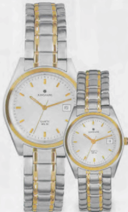
041/4186.44 Edelstahlband bicolor gelbver- goldet, geschliffen und poliert. € 119,00*