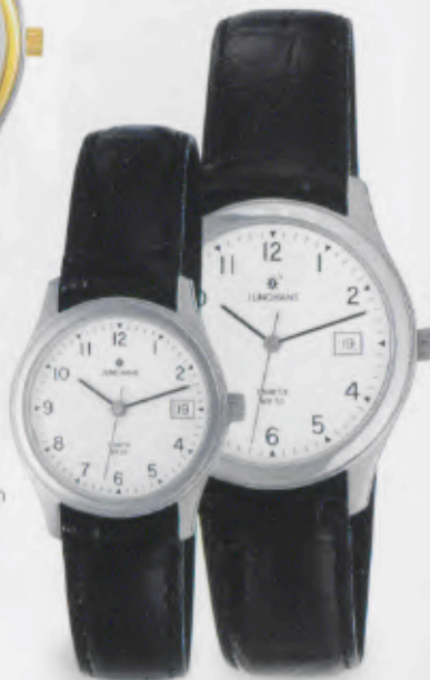
047/4732.00 Schwarzes Lederband. € 65,00*