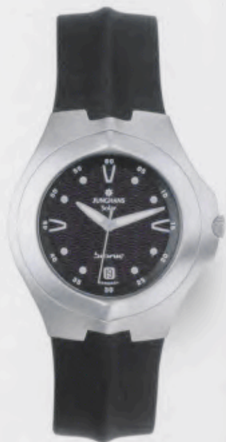
014/4026.00 Junghans Bionic Solar. Gehäuse Edelstahl, fein geschliffen. Solarzelle natur. Kautschukband mit Edelstahl-Dreifalt- Drückerschließe. € 209,00*