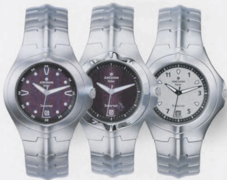
014/4922.44 Junghans Bionic Solar. Gehäuse Edelstahl, fein geschliffen. Solarzelle natur. Edelstahlband fein geschliffen mit Edelstahl-Dreifalt- Drückerschließe. € 229,00*