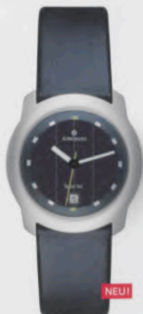
014/4210.00 Junghans Economy Solar. Gehäuse Edelstahl, gebürstet. Solarzelle natur. Schwarzes Lederband. € 99,00*