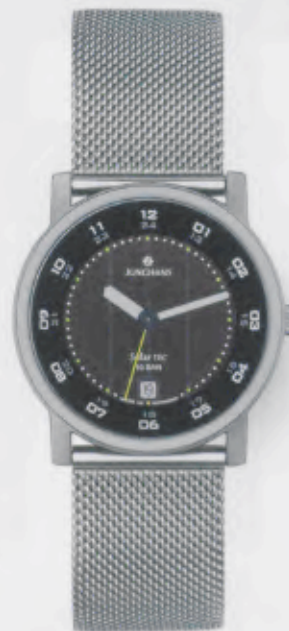
014/4042.44 Junghans SolarTEC. Solarzelle schwarz. Edelstahl-Milaneseband. € 159,00*