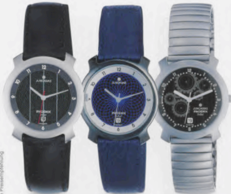
014/4711.00 Junghans Phoenix Solar. „Black hole“ Gehäuse fein gestrahlt. Schwarzes Lederband. € 109,00*