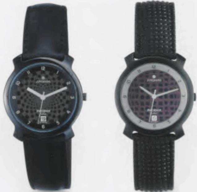
014/4715.00 Junghans Phoenix Solar. „Darts“ Gehäuse PVD-be- schichtet, poliert. Schwarzes Lederband. € 109,00*