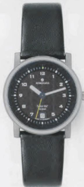
014/4041.00 Junghans SolarTEC. Solarzelle schwarz. Schwarzes Lederband. € 159,00*