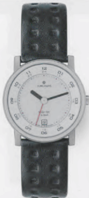
014/4040.00 Junghans SolarTEC. Solarzelle hellgrau bedruckt. Schwarzes Lederband mit Rechteckprägung. € 159,00*