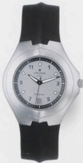
014/4025.00 Junghans Bionic Solar. Gehäuse Edelstahl, gestrahlt. Solarzelle silberfarben. Kautschuk- band mit Edelstahl-Dreifalt- Drückerschließe. € 209,00*