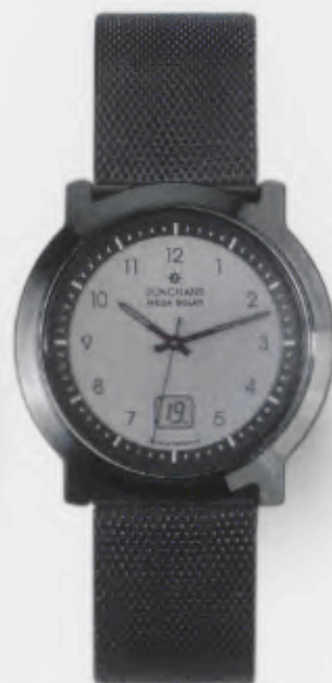
018/1113.44 Junghans Stratos Mega Solar Ceramic. Ceramicgehäuse poliert. Solarzelle silber-metallisch. Milaneseband, PVD-beschichtet. € 629,00*

Junghans Stratos Mega Solar Ceramic. Daran müssen sich die Uhren dieser Welt messen.