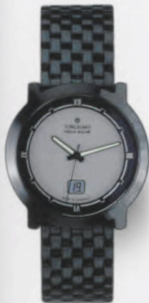
018/1101.44 Junghans Stratos Mega Solar Ceramic. Ceramicgehäuse poliert. Solarzelle silber-metallic. Massives Edelstahlband, PVD-beschichtet, poliert. € 649,00*