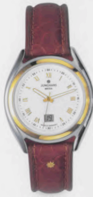
030/4961.00 Junghans Integral Mega Steel. Gehäuse bicolor. Weißes Zifferblatt. Leuchtzeiger. Braunes Lederband aus Krokoimitat. € 259,00*