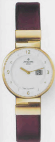
010/7105.00 Junghans Integra Mega Steel. Gehäuse 10 Micron vergoldet. Braunes Lederband. € 529,00*