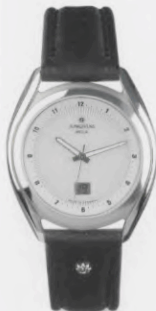
030/4100.00 Junghans Integral Mega Steel. Weißes Zifferblatt. Schwarzes Lederband. € 299,00*