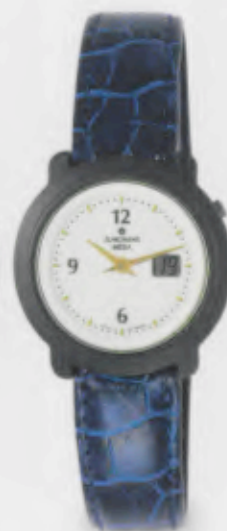
013/1718.00 Junghans Scala Mega Ceramic. Ceramicgehäuse matt. Perimuttfarbenedes Ziffer- blatt. Blaues Lederband. € 449,00*