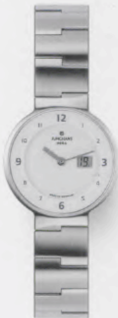
010/4101.44 Junghans Integra Mega Steel. Gehäuse und Band Edelstahl gebürstet. € 579,00*