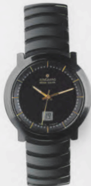
018/1116.44 Junghans Stratos Mega Solar Ceramic. Ceramicgehäuse poliert. Schwarzes Zifferblatt. Ceramicband mit hochglanzpolierten Ceramicgliedern. € 699,00*