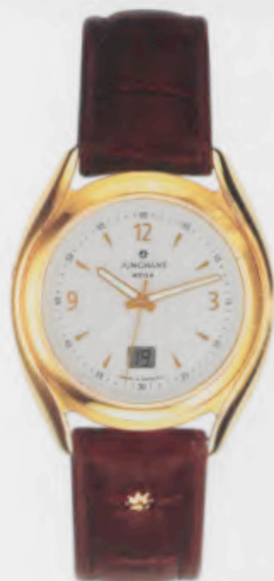
030/7067.00 Junghans Integral Mega Steel. Edelstahlgehäuse 10 µ vergoldet, poliert. Cremefarbenes Ziffer- blatt. Braunes Lederband aus Krokoimitat. € 329,00*