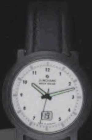
018/1100.00 Junghans Stratos Mega Solar Ceramic. Ceramicgehäuse matt. Solarzelle grau. Schwarzes Lederband. € 599,00*

Das Thema der Zeit: Völlige Unabhängigkeit. Duch Funk- und Solartechnologie der neuesten Generation.