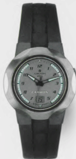
050/2191.00 Junghans Actio Mega Carbon. Geschliffene Lünette, Dunkelgraues Zifferblatt, Kautschukband mit Lüftungsschlitzen. € 229,00*