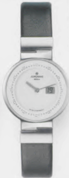
010/4104.00 Junghans Integra Mega Steel. Gehäuse Edelstahl gebürstet. Anthrazit- farbenedes Lederband. € 479,00*