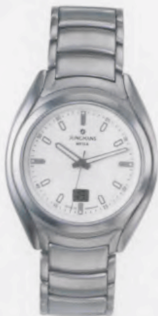
030/4064.44 Junghans Integral Mega Steel. Weißes Zifferblatt. Massives Edelstahl- band. € 329,00*