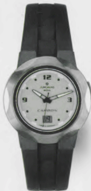
050/2190.00 Junghans Actio Mega Carbon. Geschliffene Lünette, Hellgraues Zifferblatt, Kautschukband mit Lüftungsschlitzen. € 229,00*