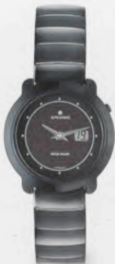
015/1005.44 Junghans Scala Mega Solar Ceramic. Ceramicgehäuse matt. Solarzelle natur. Ceramicband matt/ glänzend. € 849,00*

Schmuck, so unvergänglich wie schön. Junghans Scala Mega Solar Ceramic.