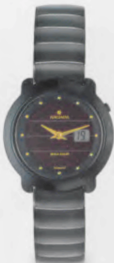
015/1000.44 Junghans Scala Mega Solar Ceramic. Ceramicgehäuse poliert. Solarzelle natur. Ceramicband poliert/gestrahlt. € 849,00*