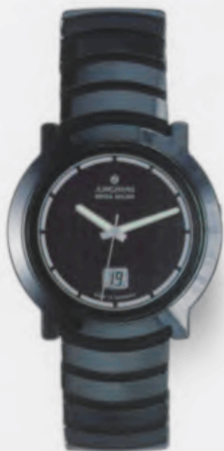
018/1102.44 Junghans Stratos Mega Solar Ceramic. Ceramicgehäuse poliert. Solarzelle schwarz. Ceramic- band mit hochglanzpolierten Keramikgliedern auf einem Polyurethan/Silikonträger. € 699,00*