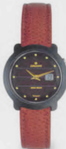
015/1724.00 Junghans Scala Mega Solar Ceramic. Ceramicgehäuse poliert. Solarzelle natur. Braunes Leder- band. € 499,00*