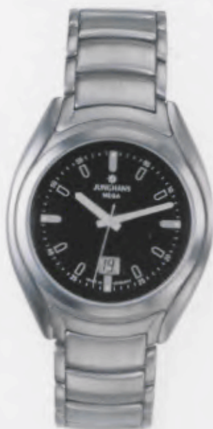
030/4065.44 Junghans Integral Mega Steel. Schwarzes Zifferblatt. Massives Edelstahl- band. € 329,00*