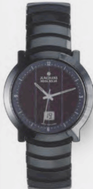
018/1112.44 Junghans Stratos Mega Solar Ceramic. Ceramicgehäuse poliert. Solarzelle natur. Ceramicband mit hochglanzpolierten Keramikgliedern auf einem Polyurethan/Silikonträger. € 699,00*