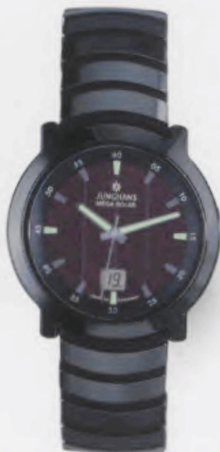
018/1111.44 Junghans Stratos Mega Solar Ceramic. Ceramicgehäuse poliert. Solarzelle schwarz. Ceramicband mit hochglanzpolierten Keramikgliedern auf einem Polyurethan/Silikonträger. € 699,00*