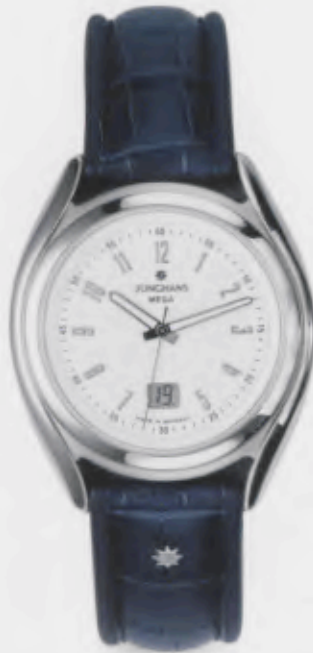
030/4962.00 Junghans Integral Mega Steel. Weißes Zifferblatt. Leuchtzeiger. Blaues Lederband aus Krokoimitat. € 259,00*