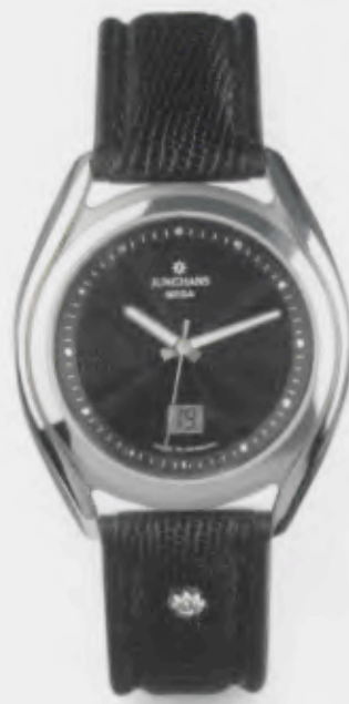
030/4101.00 Junghans Integral Mega Steel. Schwarzes Zifferblatt. Schwarzes Lederband. € 299,00*