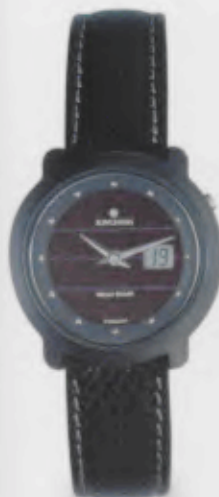
015/1723.00 Junghans Scala Mega Solar Ceramic. Ceramicgehäuse matt gestrahlt. Solarzelle natur. Schwarzes Lederband. € 499,00*