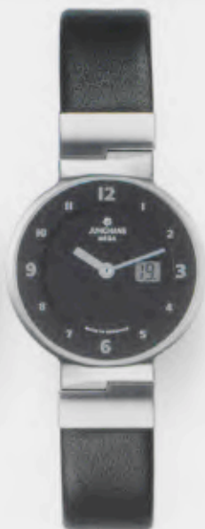
010/4103.00 Junghans Integra Mega Steel. Gehäuse Edelstahl gebürstet. Schwarzes Lederband. € 479,00*