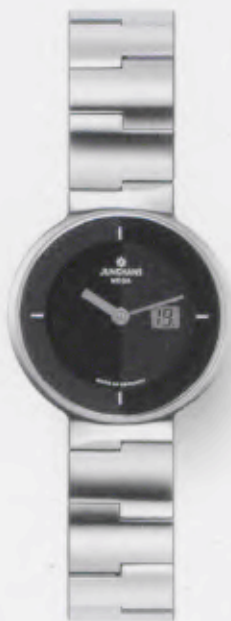
010/4100.44 Junghans Integra Mega Steel. Gehäuse und Band Edelstahl poliert. € 579,00*

Das vollendete Zusammenspiel von Technik, Form und Material setzt Zeichen. Zeichen eines eigenen Stils und Zeichen unserer Zeit.