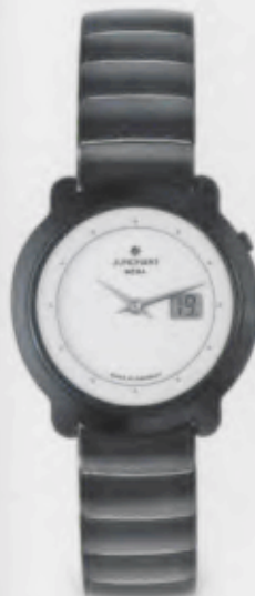
013/1001.44 Junghans Scala Mega Ceramic. Ceramicgehäuse poliert. Weißes Zifferblatt. Ceramicband hoch- glanzpoliert. € 799,00*