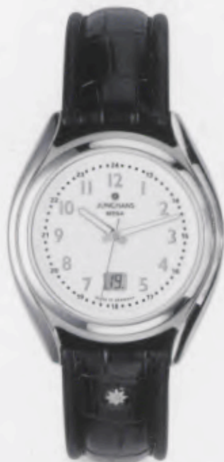
030/4960.00 Junghans Integral Mega Steel. Weißes Zifferblatt. Leuchtzeiger. Schwarzes Lederband aus Kroko- imitat. € 259,00*