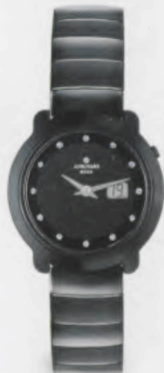
013/1002.44 Junghans Scala Mega Ceramic Diamond. Ceramicgehäuse poliert. Schwarzes Zifferblatt mit 12 echten Diamanten. Ceramicgliederband hoch- glanzpoliert. € 999,00*