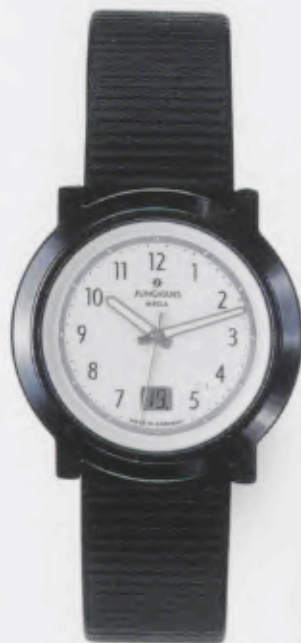
017/1010.00 Junghans Stratos Mega Ceramic. Ceramicgehäuse poliert. Weißes Zifferblatt. Schwarzes Kalbslederband mit Rillenprägung. € 499,00*