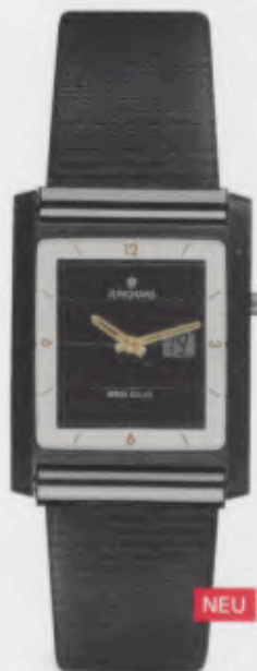
011/1105.00 Junghans Berlin Mega Solar Ceramic. Ceramicgehäuse satiniert. Solarzelle natur. Schwarzes Lederband mit Rillenprägung. € 849,00*