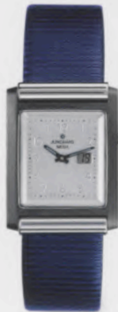
012/1806.00 Junghans Berlin Mega Ceramic. Ceramicgehäuse poliert. Silberfarbenes Relief- Zifferblatt. Blaues Lederband mit Rillen- prägung. € 649,00*