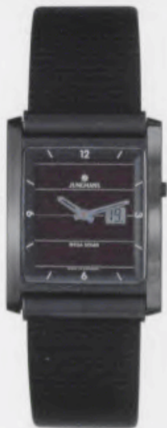
011/1800.00 Junghans Berlin Mega Solar Ceramic. Ceramicgehäuse poliert. Solarzelle natur. Schwarzes Lederband mit Rillen- prägung. € 849,00*