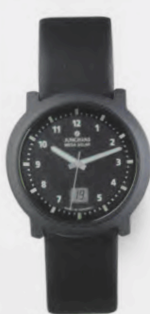
018/1115.00 Junghans Stratos Mega Solar Ceramic. Ceramicgehäuse matt gestrahlt. Schwarzes Zifferblatt. Leuchtziffern und -zeiger. Schwarzes Lederband. € 599,00*