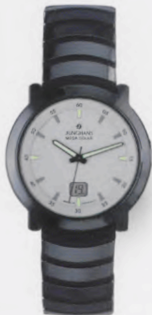
018/1110.44 Junghans Stratos Mega Solar Ceramic. Ceramicgehäuse poliert. Solarzelle weiß. Ceramicband mit hochglanzpolierten Keramikgliedern auf einem Polyurethan/Silikonträger. € 699,00*