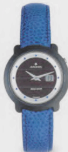
015/1722.00 Junghans Scala Mega Solar Ceramic. Ceramicgehäuse poliert. Solarzelle natur. Blaues Leder- band. € 499,00*