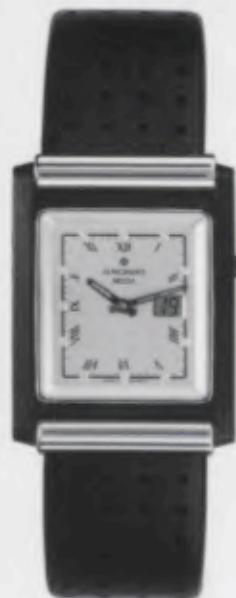
012/1807.00 Junghans Berlin Mega Ceramic. Ceramicgehäuse matt. Silberfarbenes Relief- Zifferblatt. Schwarzes Lederband. € 649,00*