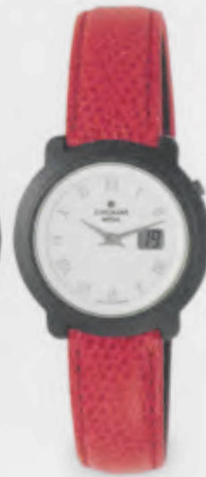
013/1717.00 Junghans Scala Mega Ceramic. Ceramicgehäuse matt. Perimuttfarbenedes Guilloché-Zifferblatt. Rotes Lederband. € 449,00*

Modell auch mit schwarzem Band lieferbar.