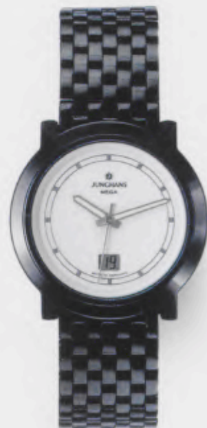
017/1012.44 Junghans Stratos Mega Ceramic. Ceramicgehäuse poliert. Weißes Zifferblatt. Massives Edelstahlband, PVD-beschichtet, poliert. € 549,00*