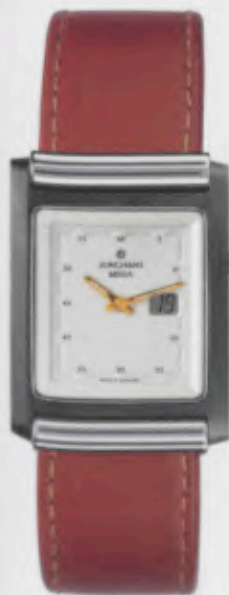
012/1805.00 Junghans Berlin Mega Ceramic. Ceramicgehäuse poliert. Perlmutterfarbenes Relief- Zifferblatt. Braunes Leder- band. € 649,00*