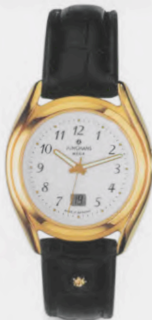
030/7066.00 Junghans Integral Mega Steel. Edelstahlgehäuse 10 µ vergoldet, poliert. Weißes Zifferblatt. Schwarzes Lederband aus Kroko- imitat. € 329,00*