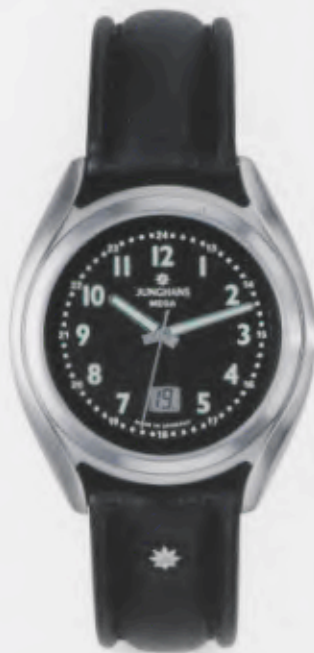
030/4963.00 Junghans Integral Mega Steel. Schwarzes Zifferblatt. Leuchtziffern und -zeiger. Schwarzes Lederband. € 259,00*