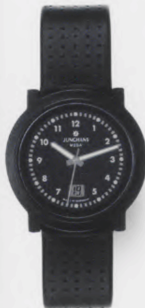
017/1011.00 Junghans Stratos Mega Ceramic. Ceramicgehäuse matt gestrahlt. Schwarzes Zifferblatt. Schwarzes Kalbslederband mit Punktmuster. € 499,00*