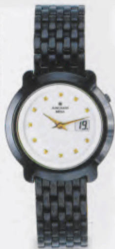
013/1920.44 Junghans Mega Ceramic Funkuhr PVD-beschichtetes, schwarzes Edelstahlband. Weißes Zifferblatt. DM 990,00* € 506,18*