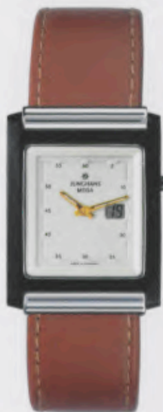
012/1805.00 Junghans Mega Berlin Braunes Lederband. Perlmuttfarbened Relief-Zifferblatt. DM 1.250,00* € 639,11*