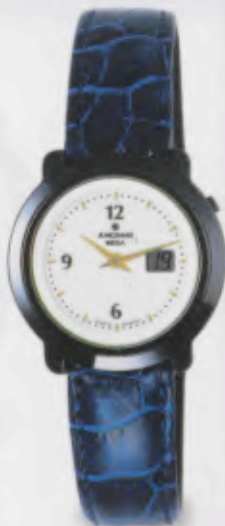
013/1718.00 Junghans Mega Ceramic Funkuhr Blaues Lederband. Perlmuttfarbenes Zifferblatt. DM 890,00* € 455,05*