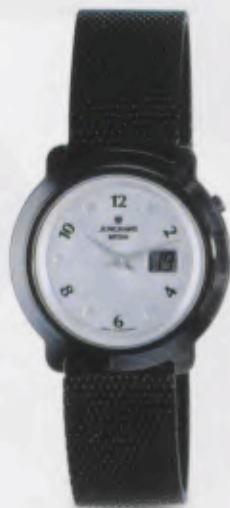
013/1800.44 Junghans Mega Ceramic Funkuhr Schwarzes Milaneseband. Silberfarbenes Zifferblatt. DM 990,00* € 506,18*