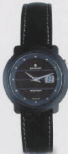
015/1723.00 Junghans Mega Solar Ceramic Funk-Solaruhr Schwarzes Lederband. Zifferblatt mit silberfarbenen Appliques. DM 950,00* € 485,73*