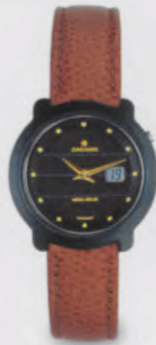
015/1724.00 Junghans Mega Solar Ceramic Funk-Solaruhr Braunes Lederband. Zifferblatt mit goldfarbenen Appliques. DM 990,00* € 506,18*