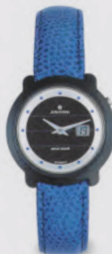
015/1722.00 Junghans Mega Solar Ceramic Funk-Solaruhr Blaues Lederband. Zifferblatt mit blauen Appliques. DM 990,00* € 506,18*