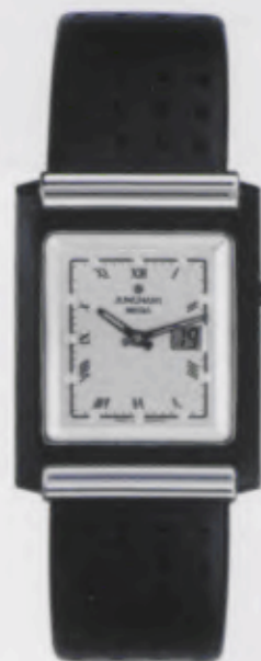
012/1807.00 Junghans Mega Berlin Schwarzes Lederband. Silberfarbenes Relief-Zifferblatt. DM 1.250,00* € 639,11*