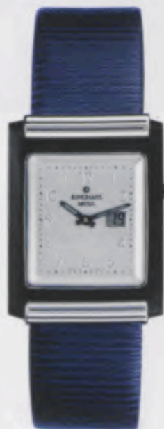
012/1806.00 Junghans Mega Berlin Blaues Lederband. Silberfarbenes Relief-Zifferblatt. DM 1.250,00* € 639,11*