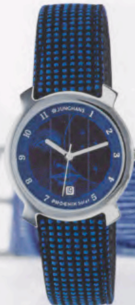
014/4855.00 »man in the moon« DM 199,-*

JUNGHANS PHOENIX SOLAR. ZEITGEIST AUF DEN PUNKT GEBRACHT. MIT DEM EINZIGARTIGEN JUNGHANS „SOLAR PRINTING“-VERFAHREN.