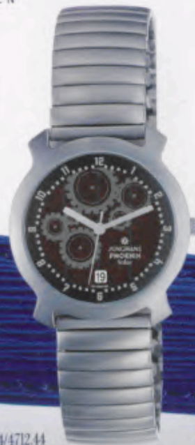
014/4712.44 »modern times« DM 199,-*

Technische Informationen siehe Preisliste.