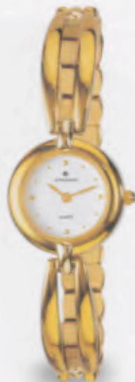
0475888.44 -Marlen- DM 349,-*