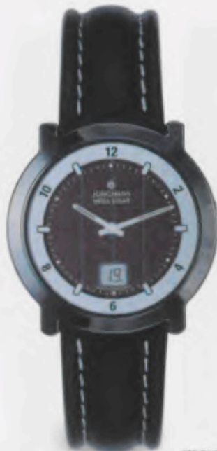
018/1928.00 DM 790,-*