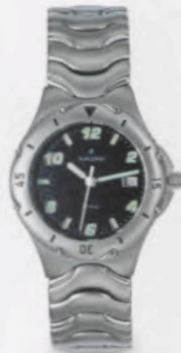
047/2921.44 •Titan-Sport• DM 299,-*