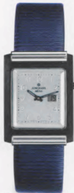
012/1806.00 DM 1250,-*

EINE HOMMAGE AN EINE GROSSE STADT. DIE JUNGHANS FUNK- COLLECTION BERLIN AUS MASSIVER HIGHTECH- CERAMIC.