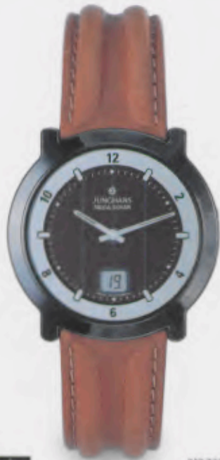
018/1927.00 DM 790,-*