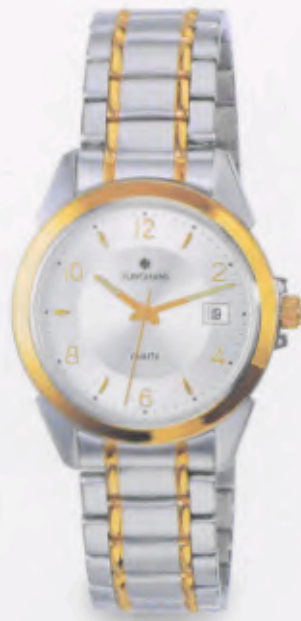
041/4866.44 »Cicero« DM 229,-*