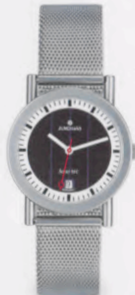
014/496L44 DM 269,-*

Technische Informationen siehe Preisliste.