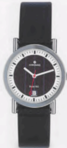
014/4960.00 DM 249,-*

JUNGHANS STATION SOLAR. IHR VORBILD: DIE KLASSISCHEN BAHNHOFSUHREN. IHR ANTRIEB: LICHTENERGIE.