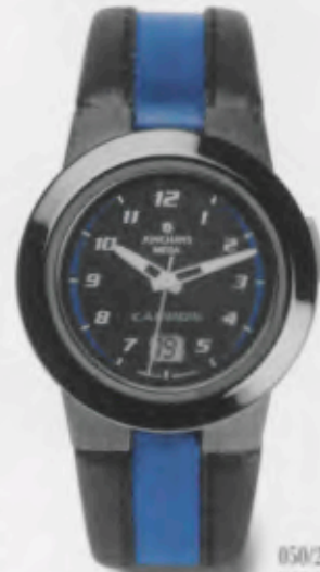
050/2993.00 DM 399,-*

Junghans Carbon: ultraleicht, extrem hart, funkgenau, antiallergisch. Technische Informationen siehe Preisliste.