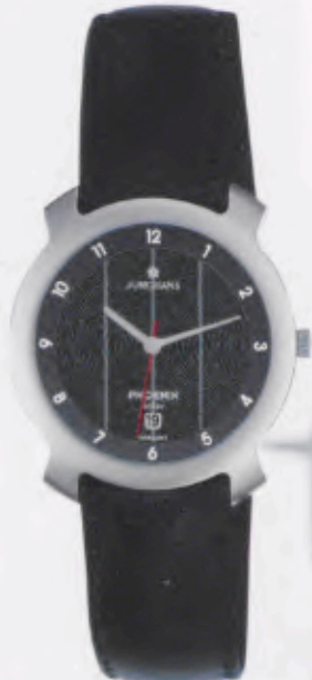
014/4711.00 »black hole« DM 199,-*