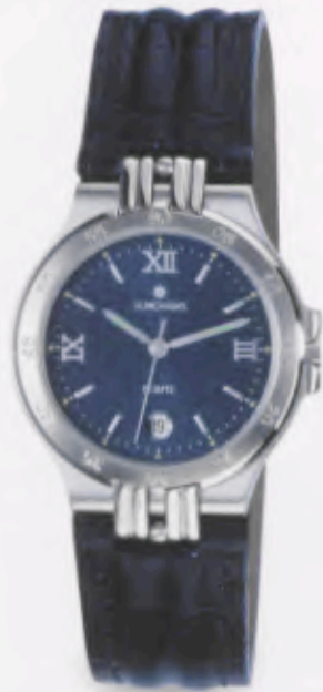
041/4340.00 •Ravel- DM 349,-*