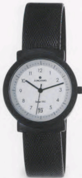
014/1711.44 DM 299,-*