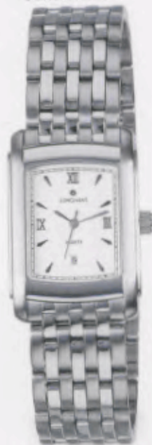
041/4871.44 »Platon« DM 249,-*