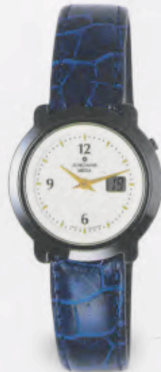
FUNK UHR 013/1718.00 DM 890,-*