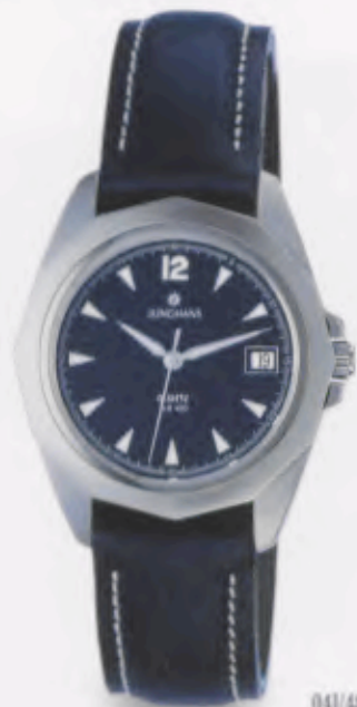
041/4856.00 •Prezisa• DM 249,-*