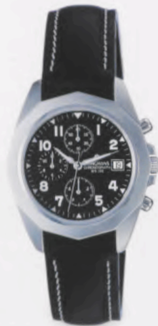
041/4861.00 •Prezisa• Chronograph DM 329,-*

EXAKT. EXTREM STRAPAZIERFÄHIG UND MODISCH SPORTIV. PREZISA. EINE AUßERGEWÖHNLICH ATTRAKTIVE COLLECTION AUS DEM JUNGHANS SPORTUHRENBEREICH. MASSIVES EDELSTAHLGEHÄUSE. VERSCHRAUBTER BODEN UND KRONE. 10 BAR WASSERDICHT.