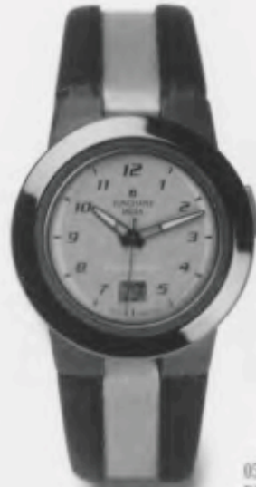
050/2992.00 DM 399,-*