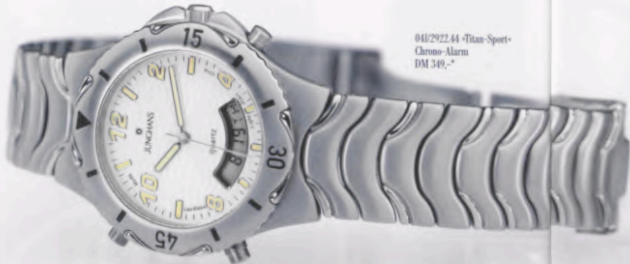
041/2922.44 •Titan-Sport• Chrono-Alarm DM 349,-*