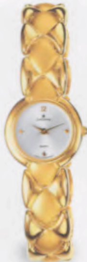
0475842.44 -Senta- DM 590,-*