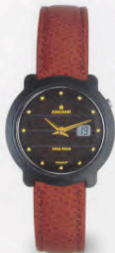
FUNK SOLAR UHR 015/1724.00 DM 990,-*