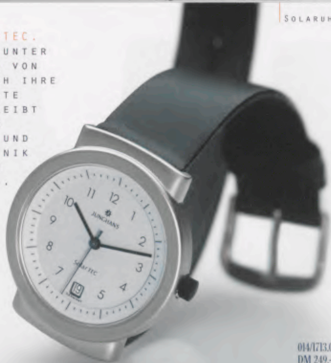
014/1713.00 DM 249,-*

JUNGHANS SOLARTEC. DER KLASSIKER UNTER DEN SOLARUHRN VON JUNGHANS. DURCH IHRE KLAR GEZEICHNETE GEHÄUSEFORM BLEIBT DIESE SOLARUHR IMMER AKTUELL UND DANK SOLARTECHNIK UNABHÄNGIG VON ENERGIEQUELLEN.