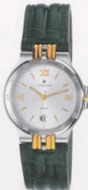
041/4341.00 •Ravel- DM 349,-*