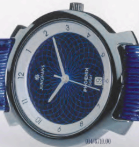
014/4710.00 »twister« DM 199,-*

JUNGHANS PHOENIX SOLAR. ZEITGEIST AUF DEN PUNKT GEBRACHT. MIT DEM EINZIGARTIGEN JUNGHANS „SOLAR PRINTING“-VERFAHREN.