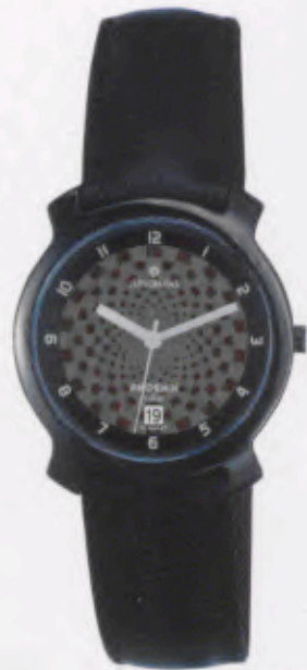
014/4715.00 »darts« DM 199,-*