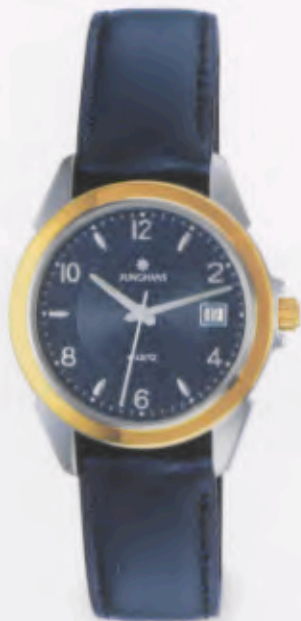
041/4864.00 »Cicero« DM 169,-*