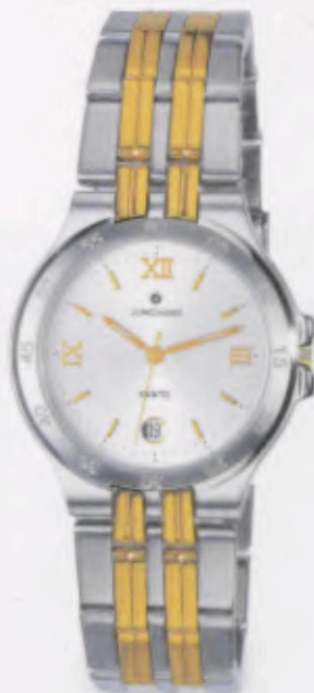
041/4343.44 •Ravel- DM 399,-*

6 4 Technische Informationen siehe Preisliste. Alle auf dieser Doppelseite abgebildeten Modelle sind auch als Damenuhren erhältlich.