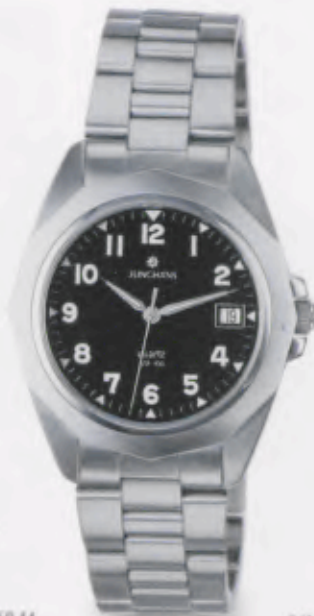
041/4858.44 •Prezisa• DM 299,-*