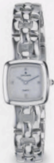
0470878.44 -Hanna- DM 199,-*