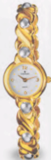
0470872.44 -Vivien- DM 299,-*