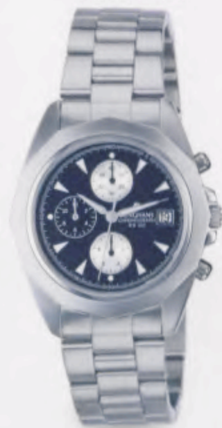
041/4862.44 •Prezisa• Chronograph DM 379,-*