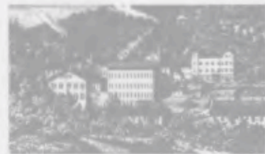
JUNGHANS UHREN IN SCHRAMBERG. SEIT 1861

ZEIT FÜR TRADITION. ALLE TECHNOLOGISCHEN ERFOLGE HABEN IHRE WÜRZELN IN EINER LANGEN TRADITION. SEIT 1861 BAUT JUNGHANS UHREN IN HANDWERKLICHER VOLL- ENDUNG. MECHANISCHE MEISTERWERKE, DEREN FASZINATION DIE ZEIT ÜBERDAUERN. EINIGE DAVON LÄBT JUNGHANS ALS REPLIKEN IN SEINER KOLLEKTION JUNGHANS MEISTER WIEDER AUFLEBEN.