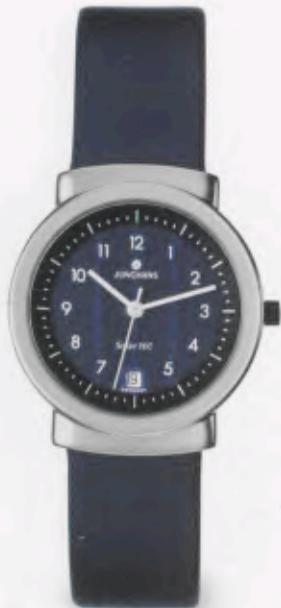
014/1802.00 DM 249,-*