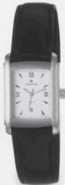
041/4869.00 »Platon« DM 199,-*

Technische Informationen siehe Preisliste. Alle »Cicero«-Modelle sind auch als Damenuhren erhältlich.