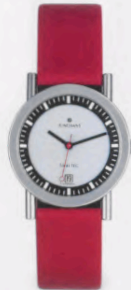
014/4962.00 DM 249,-*