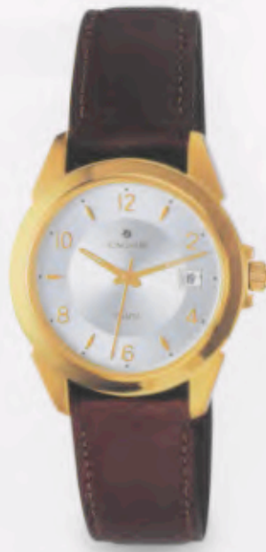
041/7870.00 »Cicero« DM 179,-*

KLASSISCHE UHREN, DIE AUCH NACH JAHREN NOCH SO ZEIT- GEMÄß UND MODERN SIND WIE HEUTE, MIT PRÄZISER QUARTZ- TECHNOLOGIE, AUS STRAPAZIERTFÄHIGEN, LANGLEBIGEN MATERIALIEN UND WASSERDICHT BIS 5 BAR.