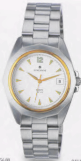
041/4860.44 •Prezisa• DM 299,-*