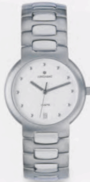
041/4950.44 DM 449,-*

GROSSE MOMENTE VERLANGEN NACH BESONDEREN DINGEN. NACH UHREN MIT STIL UND PERSÖN- LICHKEIT. JUNGHANS ELEGANCE UHREN SIND HIERFÜR WIE GESCHAFFEN. MEISTERLICH VERARBEITET. MIT PRÄZISER QUARZ- TECHNOLOGIE UND WASSERDICHT BIS 5 BAR.