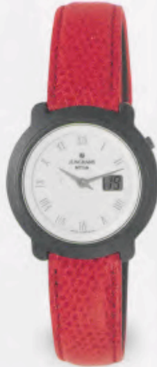
FUNK UHR 013/1717.00 DM 850,-*