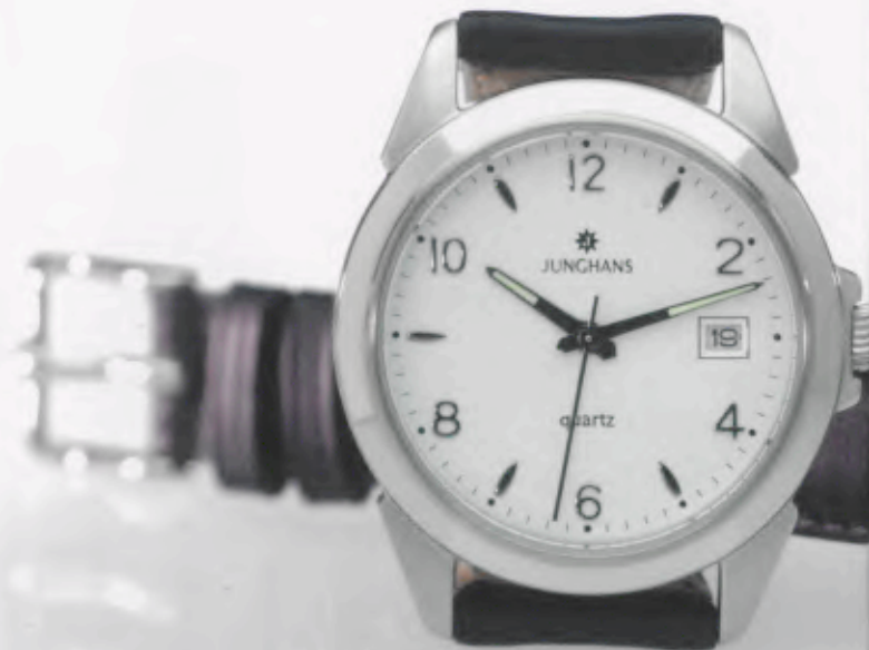
041/4863.00 »Cicero« DM 149,-*

JUNGHANS CLASSIC. DER ZUVERLÄSSIGE BEGLEITER.