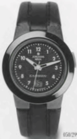
050/2990.00 DM 399,-*