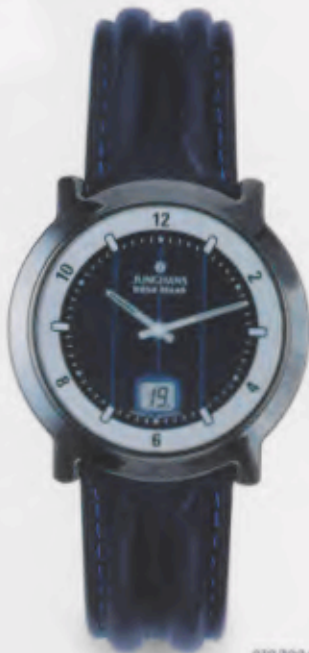
018/1926.00 DM 790,-*