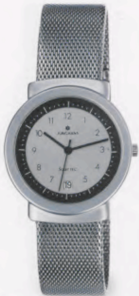
014/1710.44 DM 269,-*

JUNGHANS SOLARTEC. DER KLASSIKER UNTER DEN SOLARUHRN VON JUNGHANS. DURCH IHRE KLAR GEZEICHNETE GEHÄUSEFORM BLEIBT DIESE SOLARUHR IMMER AKTUELL UND DANK SOLARTECHNIK UNABHÄNGIG VON ENERGIEQUELLEN.