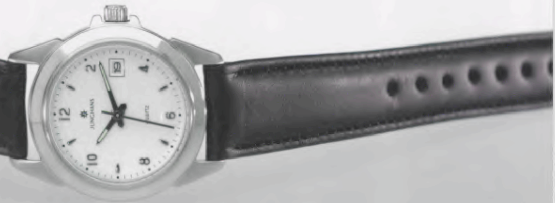
047/4863.00 »Cicero« DM 149,-*