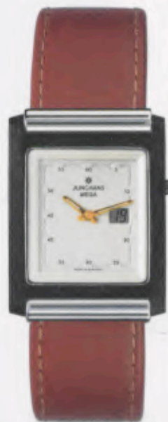
012/1805.00 DM 1250,-*