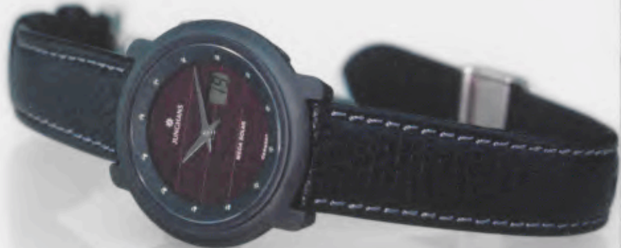
015/1723.00 DM 950,-*

DURCH DEN EINSATZ DES KLEINSTEN FUNKUHRWERKES DER WELT KOMMT DER ZEITKOMFORT EINER FUNK-/FUNK-SOLARUHR AUCH IN DAMENUHREN ZUM TRAGEN. EINE UHR, DIE IHNEN ALLES ABNIMMT: KEIN ZEITEIN- UND UMSTELLEN, KEIN BATTERIEWECHSEL. NUR ABLESEN MÜSSEN SIE NOCH SELBST.