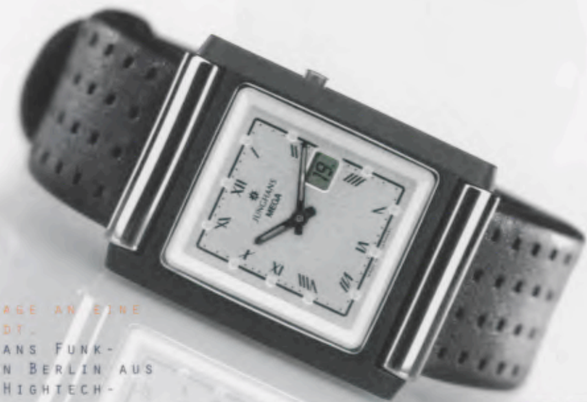
012/1807.00 DM 1250,-*

EINE HOMMAGE AN EINE GROSSE STADT. DIE JUNGHANS FUNK- COLLECTION BERLIN AUS MASSIVER HIGHTECH- CERAMIC.