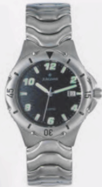
041/2921.44 •Titan-Sport• DM 299,-*