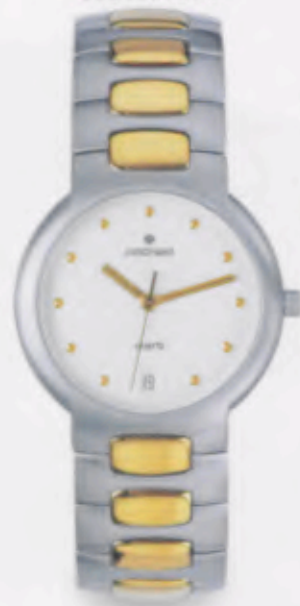
041/4951.44 DM 499,-*