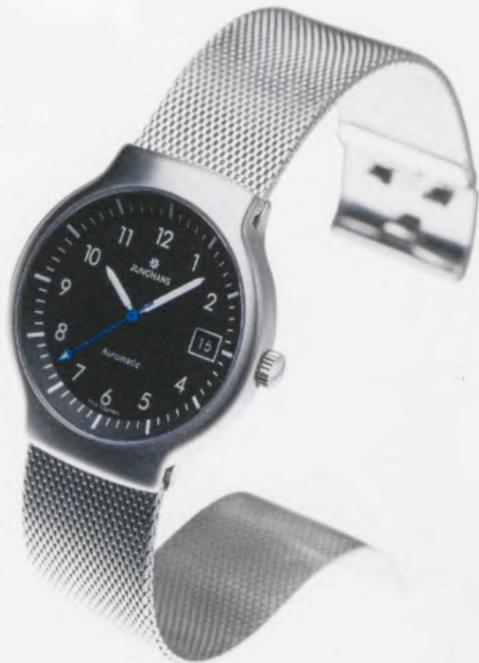
Modell 027/4711.44 Junghans Tourneur Automatic

Mechanisches, Schweizer Präzisions- Automatikwerk Kaliber ETA 2824/2. 25 Steine, 28.800 Halbschwingungen/ Stunde, Incabloc-Stoßsicherung, Gangreserve für 38 Stunden. Edelstahlgehäuse, feingeschliffen. Wasserdicht 5 bar, Gehäuse Ø 36,1 mm. Zifferblatt schwarz matt lackiert, Saphirglas, Datum, Zeiger mit inaktiver, umweltfreundlicher Leuchtmasse. Edelstahl-Milanaiseband, fein gebürstet. DM 1.700,-*