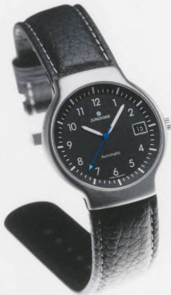
Modell 027/4710.00 Junghans Tourneur Automatic

Mechanisches, Schweizer Präzisions- Automatikwerk Kaliber ETA 2824/2. 25 Steine, 28.800 Halbschwingungen/ Stunde, Incabloc-Stoßsicherung, Gangreserve für 38 Stunden. Edelstahlgehäuse, feingeschliffen. Wasserdicht 5 bar, Gehäuse Ø 36,1 mm. Zifferblatt schwarz matt lackiert, Saphirglas, Datum, Zeiger mit inaktiver, umweltfreundlicher Leuchtmasse. Edelstahl-Milanaiseband, fein gebürstet. DM 1.700,-*