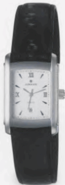
041/4869.00 »Platon« DM 199,-*

Technische Informationen siehe Preisliste. Alle »Cicero«-Modelle sind auch als Damenuhren erhältlich.