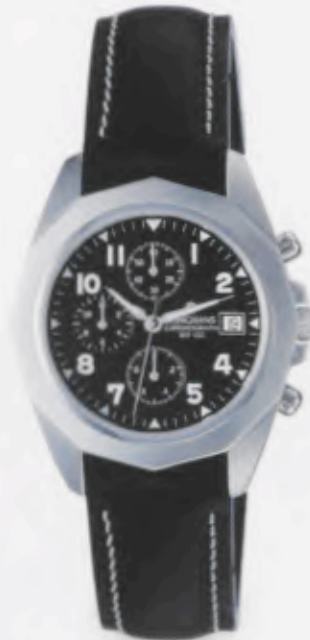
041/486L00 •Prezisa• Chronograph DM 370,-*

EXAKT. EXTREM STRAPAZIERFÄHIG UND MODISCH SPORTIV. PREZISA, EINE AUßERGEWÖHNLICH ATTRAKTIVE COLLECTION AUS DEM JUNGHANS SPORTUHRENBEREICH. MASSIVES EDELSTAHLGEHÄUSE, VERSCHRAUBTER BODEN UND KRONE. 10 BAR WASSERDICHT.