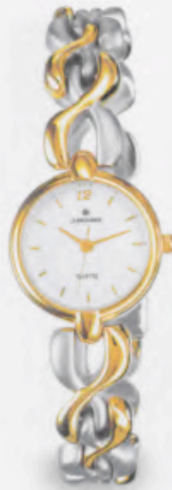
047/0736.44 DM 229,-*