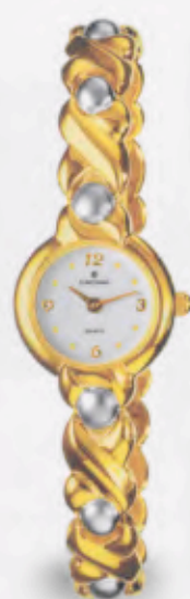
047/0872.44 »Vivien« DM 299,-*