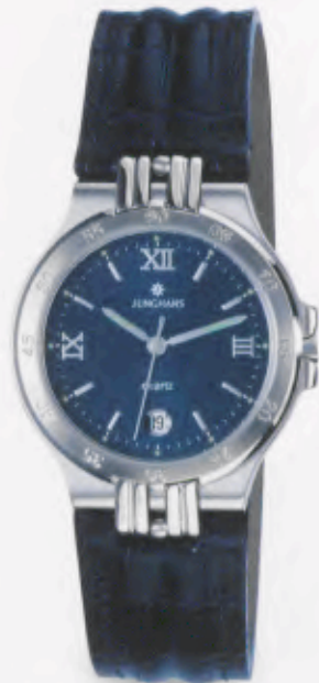
041/4840.00 »Ravel« DM 349,-*