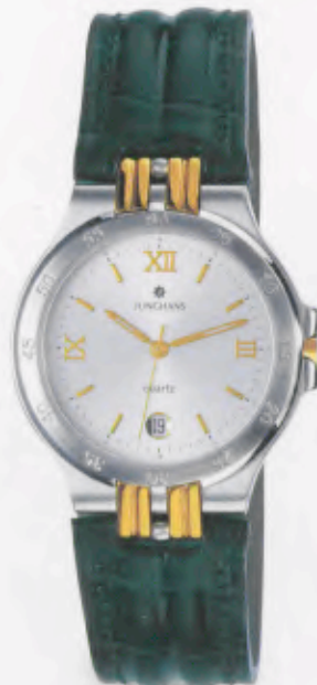
041/4841.00 »Ravel« DM 349,-*