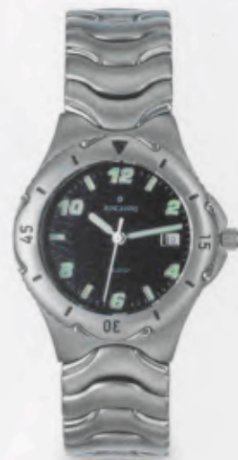
047/2921.44 »Titan-Sport« DM 299,-*