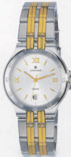
041/4843.44 »Ravel« DM 399,-*