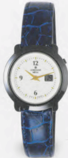
FUNK UHR 013/1718.00 DM 890,-*