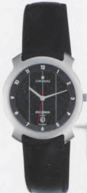
014/4711.00 »black hole« DM 199,-*