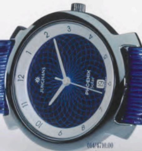
014/4710.00 »twister« DM 199,-*

JUNGHANS PHOENIX SOLAR. ZEITGEIST AUF DEN PUNKT GEBRACHT. MIT DEM EINZIGARTIGEN JUNGHANS „SOLAR PRINTING“-VERFAHREN.