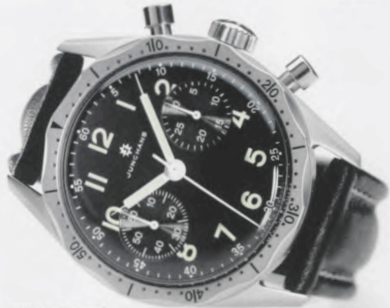
0273850.00 «Chronograph» DM 2.900,-*

DER JUNGHANS FLIEGER- CHRONO VON 1955. FÜR MÄNNER VON HEUTE, DIE IHRE TRÄUME LEBEN. EINE BERÜHMTE UHR NEU AUFGELEGT.