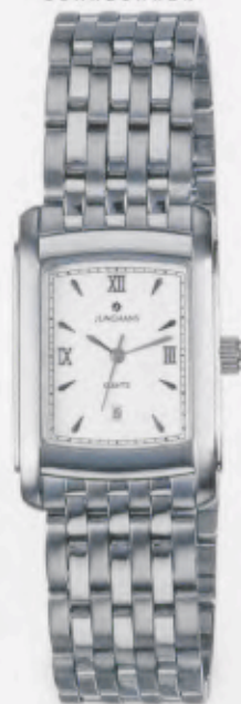
041/4871.44 »Platon« DM 249,-*