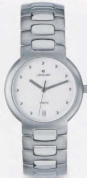
041/4950.44 DM 449,-*

GROBE MOMENTE VERLANGEN NACH BESONDEREN DINGEN. NACH UHREN MIT STIL UND PERSÖN- LICHKEIT. JUNGHANS ELEGANCE UHREN SIND HIERFÜR WIE GESCHAFFEN. MEISTERLICH VERARBEITET. MIT PRÄZISER QUARZ- TECHNOLOGIE UND WASSERDICHT BIS 5 BAR.