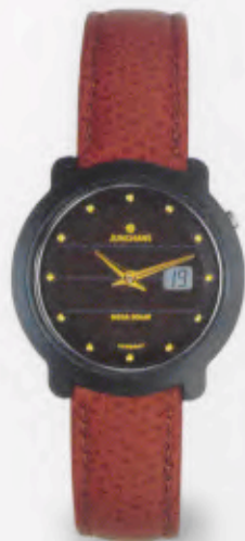
FUNK SOLAR UHR 015/1724.00 DM 990,-*