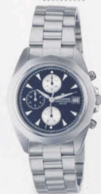
041/4862.44 •Prezisa• Chronograph DM 370,-*