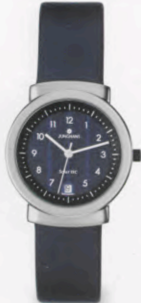
014/1802.00 DM 249,-*