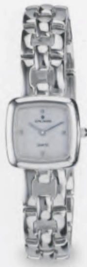
047/0878.44 »Hanna« DM 199,-*