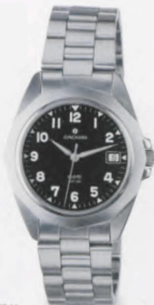
041/4858.44 •Prezisa• DM 299,-*