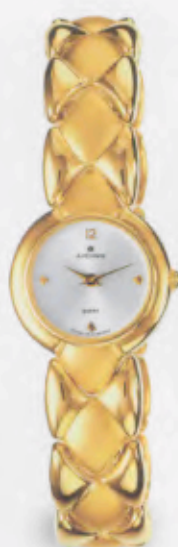
047/5842.44 »Senta« DM 590,-*