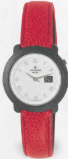
FUNK UHR 013/1717.00 DM 850,-*