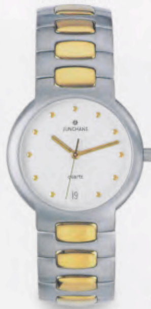
041/4951.44 DM 499,-*