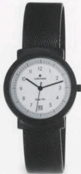
014/1711.44 DM 299,-*