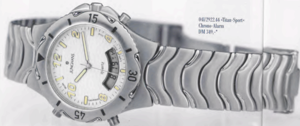
041/2922.44 »Titan-Sport« Chrono-Alarm DM 349,-*