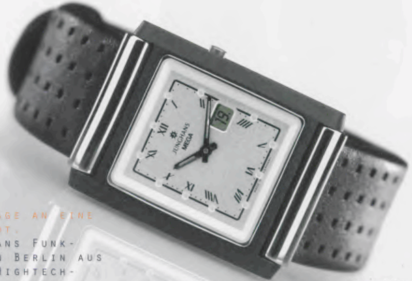
012/1807.00 DM 1.250,-*

EINE HOMMAGE AN EINE GROBE STADT. DIE JUNGHANS FUNK- COLLECTION BERLIN AUS MASSIVER HIGHTECH- CERAMIC.