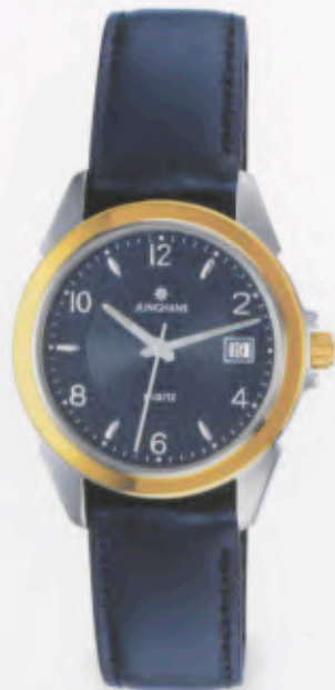
041/4864.00 »Cicero« DM 169,-*