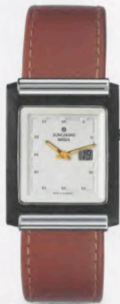
012/1805.00 DM 1.250,-*