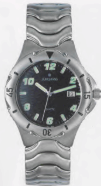
041/2921.44 »Titan-Sport« DM 299,-*

46 Technische Informationen siehe Preisliste.