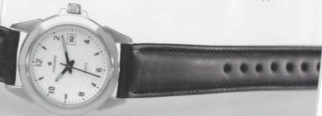
047/4863.00 »Cicero« DM 149,-*

CLASSIC- QUARZUHREN JUNGHANS CLASSIC. DER ZUVERLÄSSIGE BEGLEITER.