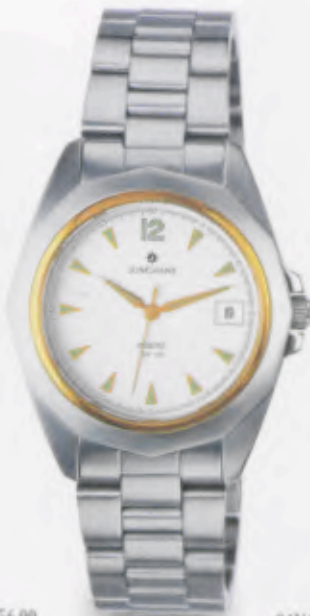
041/4860.44 •Prezisa• DM 299,-*