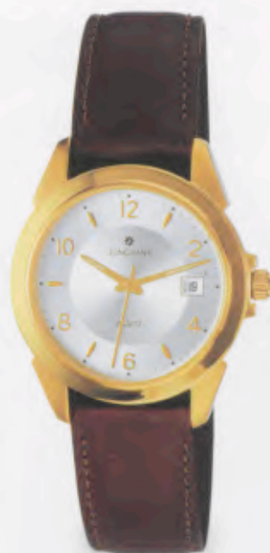
041/7870.00 »Cicero« DM 179,-*

KLASSISCHE UHREN, DIE AUCH NACH JAHREN NOCH SO ZEIT- GEMÄß UND MODERN SIND WIE HEUTE. MIT PRÄZISER QUARZ- TECHNOLOGIE, AUS STRAPA- ZIERFÄHIGEN, LANGLEBIGEN MATERIALIEN UND WASSER- DICHT BIS 5 BAR.