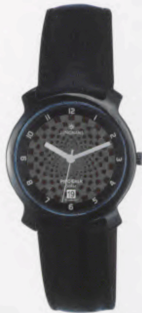
014/4715.00 »darts« DM 199,-*