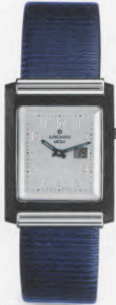
012/1806.00 DM 1.250,-*

EINE HOMMAGE AN EINE GROBE STADT. DIE JUNGHANS FUNK- COLLECTION BERLIN AUS MASSIVER HIGHTECH- CERAMIC.