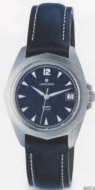
041/4856.00 •Prezisa• DM 249,-*