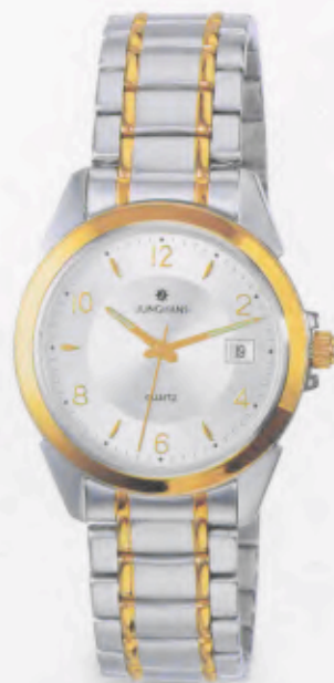
041/4866.44 »Cicero« DM 229,-*