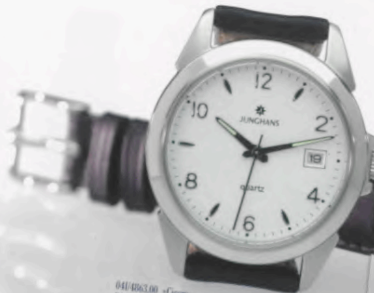
041/4863.00 »Cicero« DM 149,-*

CLASSIC- QUARZUHREN JUNGHANS CLASSIC. DER ZUVERLÄSSIGE BEGLEITER.