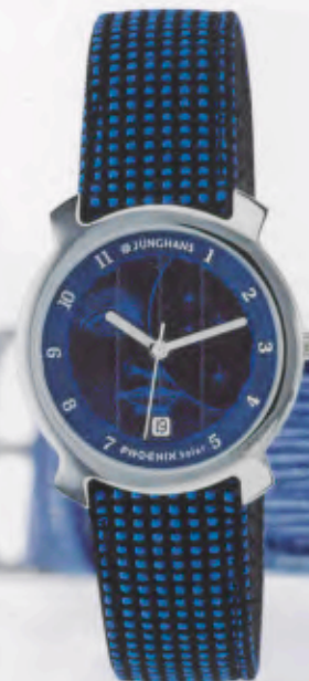
014/4855.00 »man in the moon« DM 199,-*

JUNGHANS PHOENIX SOLAR. ZEITGEIST AUF DEN PUNKT GEBRACHT. MIT DEM EINZIGARTIGEN JUNGHANS „SOLAR PRINTING“-VERFAHREN.