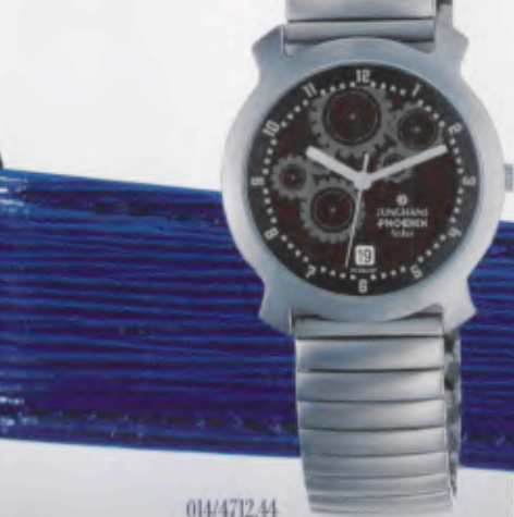
014/4712.44 »modern times« DM 199,-*

Technische Informationen siehe Preisliste.