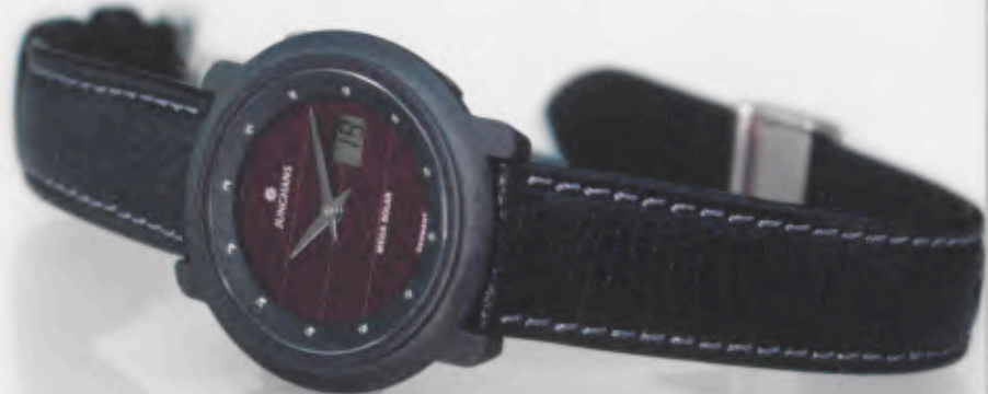
015/1723.00 DM 950,-*

ZEITKOMFORT IST JETZT AUCH FRAUENSACHE. DURCH DEN EINSATZ DES KLEINSTEN FUNKUHRWERKES DER WELT KOMMT DER ZEITKOMFORT EINER FUNK- / FUNK-SOLARUHR AUCH IN DAMENUHREN ZUM TRAGEN. EINE UHR, DIE IHNEN ALLES ABNIMMT: KEIN ZEITEIN- UND UMSTELLEN, KEIN BATTERIEWECHSEL. NUR ABLESEN MÜSSEN SIE NOCH SELBST.