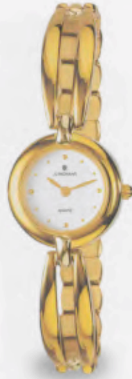
047/5888.44 »Marien« DM 349,-*