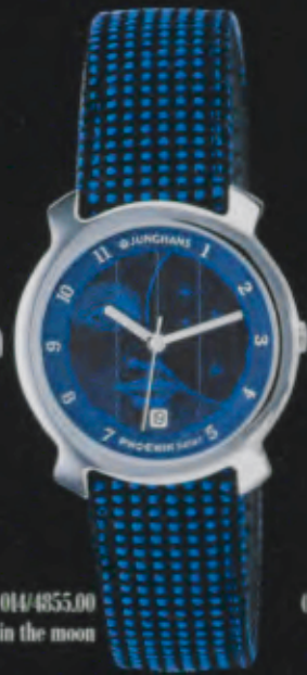
014/4855.00 man in the moon