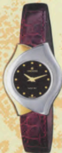
Modell 014/0660 Junghans Solar TEC -floral- quartz Gehäuse matt, gelbvergoldet, palladiumbeschichtet, Mineralglas, Wasserdicht 3 bar, Lederband, DM 199,-*