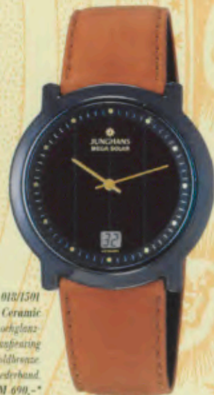
Modell 018/1501 Junghans Mega Solar Ceramic Keramik-Gehäuse, anthrazit, hochglanz- polierte Oberfläche. Zifferblattaufseinerung mit Stundenpunkten in Goldbrunze. Lederband. DM 690,-*