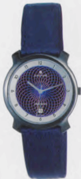
Modell 014/4710 Junghans Phoenix Solar quartz Gehäuse Edelstahl, PVD-beschichtet anthrazit, Zifferblattgring, silberfarben. Mineralglas. Wasserdicht 3 bar. Datum-Schnellkorrektur. Sekunde. Lederband. DM 199,-*

Zeitgeist charakterisiert die Persönlichkeit eines Menschen. Und Accessoires spielen dabei eine wichtige Rolle. Die Junghans Phoenix Solar ist weitaus mehr als ein modisches Accessoire. Sie ist Ausdruck eines neuen Lebensgefühls. Sie fasziniert durch außergewöhnliches Design, umweltfreundliche Solartechnologie und Präzision. Jede Junghans Phoenix Solar ist individuell gestaltet und unterstreicht den persönlichen Stil.