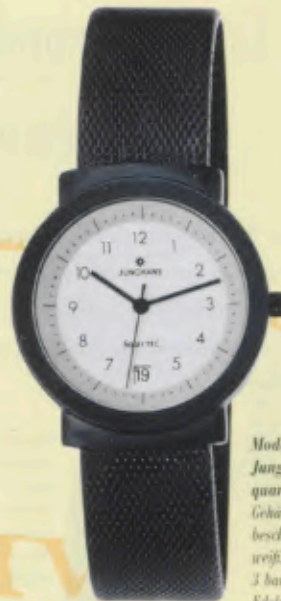
Modell 014/1711.44 Junghans SolarTEC quartz

Gehäuse fein gestrahlt, PVD-beschichtet, anthrazit, Solarzelle weiß, Mineralglas, Wasserdicht 3 bar, Datum-Schnellkorrektur, Edelstahl-Milanoariband, fein gestrahlt, anthrazit, Sekunde. DM 299,-*