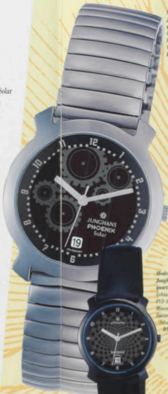
Modell 014/4712.44 Junghans Phoenix Solar quartz Gehäuse Edelstahl, fein gestrahlt, Randschliff. Edelstahl-Megaflex-Band, gehärtet. Mineralglas. Wasserdicht 3 bar. Datum-Schnellkorrektur. Sekunde. DM 199,-*