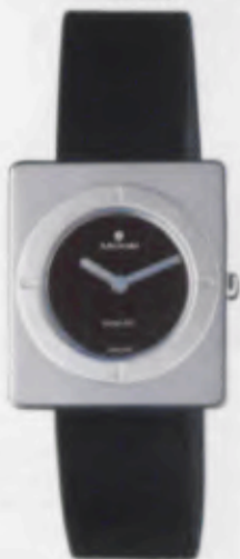
Modell 014/0650 Junghans Solar TEC -design- quartz Gehäuse und Länette palladium- beschichtet, Mineralglas, Wasserdicht 3 bar, Lederband, DM 229,-*