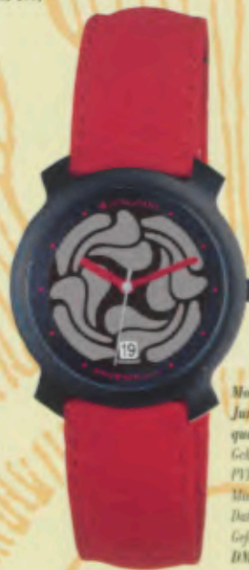
Modell 014/4713 Junghans Phoenix Solar quartz Gehäuse Edelstahl, fein gestrahlt. PVD-beschichtet anthrazit. Mineralglas. Wasserdicht 3 bar. Datum-Schnellkorrektur. Sekunde. Gefülltes Textilband. DM 199,-*