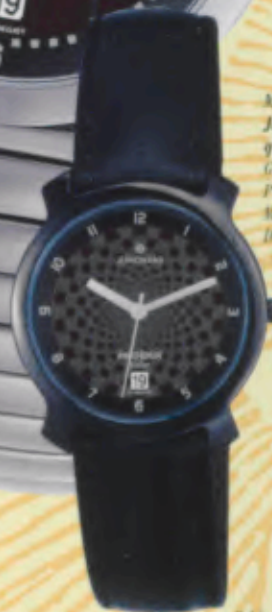
Modell 014/4715 Junghans Phoenix Solar quartz Gehäuse Edelstahl, poliert, PVD-beschichtet anthrazit. Mineralglas. Wasserdicht 3 bar. Datum-Schnellkorrektur. Sekunde. Lederband. DM 199,-*