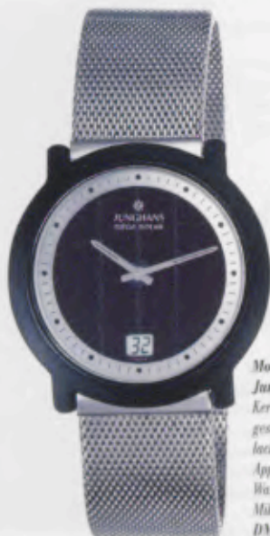
Modell 018/1720.44 Junghans Mega Solar Ceramic Keramik-Gehäuse, anthrazit, matt- gestrahlt. Zifferblattaufseinerung lackiert in Silbermetalle mit Appliqués silberfarben. Saphirglas. Wasserdicht 3 bar. Edelstahl- Milanaiselband, fein gestrahlt. DM 750,-*