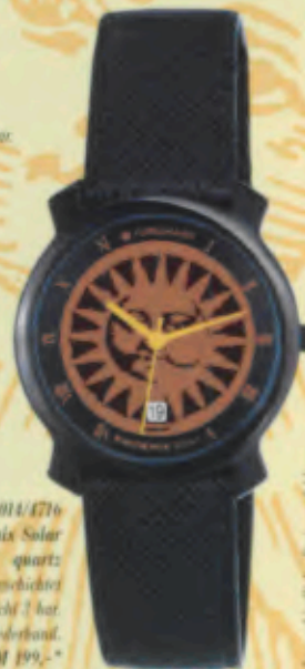
Modell 014/4716 Junghans Phoenix Solar quartz Gehäuse Edelstahl, poliert, PVD-beschichtet anthrazit, Mineralglas. Wasserdicht 3 bar. Datum-Schnellkorrektur. Sekunde. Lederband. DM 199,-*

Alle Modelle haben mehr als 2 Monate Dualzeitungsreserve und Ladekontrollanzeige.