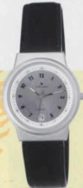
Modell 014/1714 Junghans SolarTEC quartz Gehäuse palladiumbeschichtet, fein gestrahlt. Solarzelle silberfarben. Mineralglas. Wasserdicht 3 bar. Datum-Schnellkorrektur. Leucht- ziffer. Pfälzisch gegliedertes Lederband. Sekunde. DM 229,-*