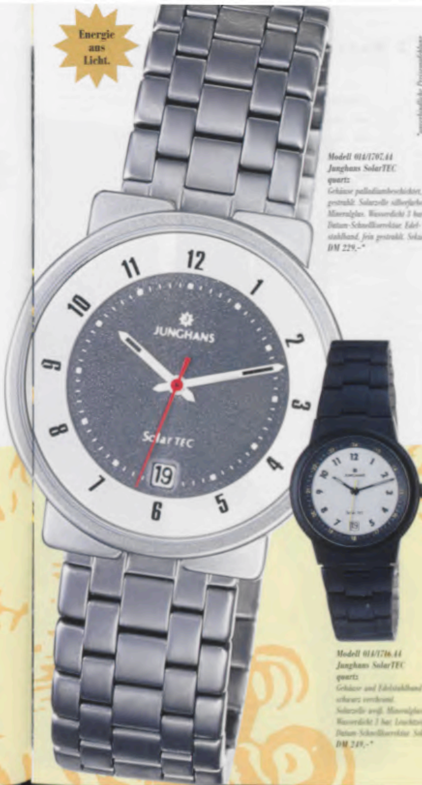
Modell 014/1702.44 Junghans SolarTEC quartz Gehäuse palladiumbeschichtet, fein gestrahlt. Solarzelle silberfarben. Mineralglas. Wasserdicht 3 bar. Datum-Schnellkorrektur. Edel- stahlband, fein gestrahlt. Sekunde. DM 229,-*