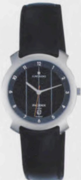
Modell 014/4711 Junghans Phoenix Solar quartz Gehäuse Edelstahl, fein gestrahlt. Mineralglas. Wasserdicht 3 bar. Datum-Schnellkorrektur. Sekunde. Lederband. DM 199,-*