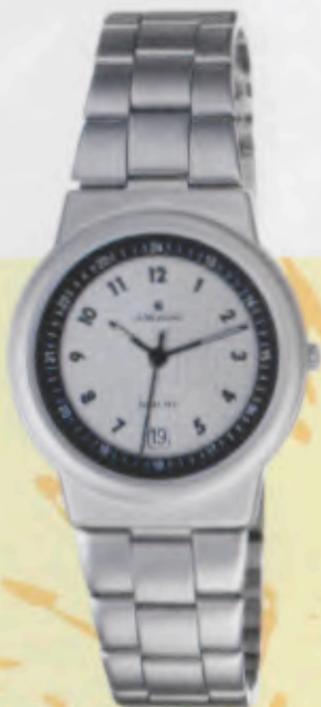
Modell 014/1715.44 Junghans SolarTEC quartz Gehäuse palladiumbeschichtet, fein gestrahlt. Solarzelle silberfarben. Mineralglas. Wasserdicht 3 bar. Datum-Schnellkorrektur. Leucht- ziffer. Edelstahlband, fein gestrahlt. Sekunde. DM 249,-*