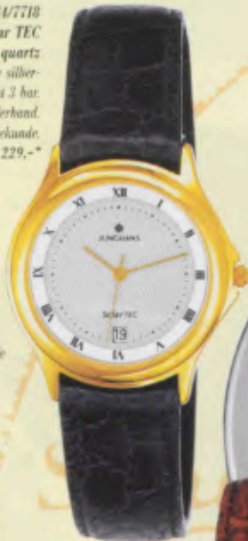
Modell 014/7719 Junghans Solar TEC quartz

Gehäuse gelbvergoldet, Solarzelle silbergrau, Mineralglas, Wasserdicht 3 bar, Datum-Schnellkorrektur, Lederband, Cabouchon-Krone, Sekunde. DM 229,-*