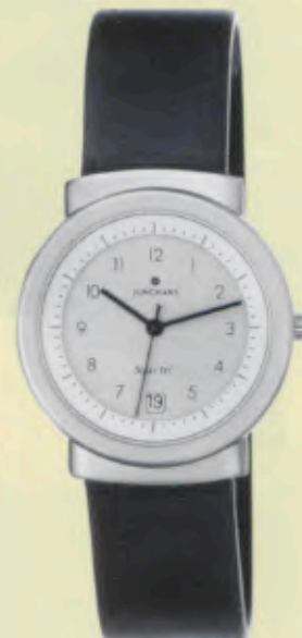
Modell 014/1713 Junghans SolarTEC quartz

Gehäuse fein gestrahlt, PVD-beschichtet, anthrazit, Solarzelle weiß, Mineralglas, Wasserdicht 3 bar, Datum-Schnellkorrektur, Pflanzlich gegerbtes Lederband, Sekunde. DM 229,-*