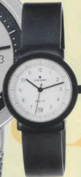
Modell 014/1712 Junghans SolarTEC quartz

Gehäuse fein gestrahlt, PVD-beschichtet, anthrazit, Solarzelle weiß, Mineralglas, Wasserdicht 3 bar, Datum-Schnellkorrektur, Edelstahl-Milanoariband, fein gestrahlt, anthrazit, Sekunde. DM 299,-*