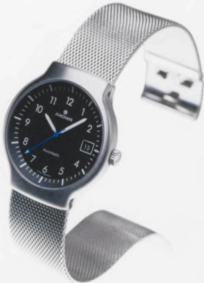
Modell 027/4711.44 Junghans Tourneur Automatic

Mechanisches, Schweizer Präzisions- Automatikwerk Kaliber ETA 2024/2. 25 Steine, 28.800 Halbschwingungen/ Stunde, Inertial-Stoßsicherung, Gangreserve für 38 Stunden, Edelstahlgehäuse, feingeschliffen, Wasserdicht 5 bar, Gehäuse Ø 36,1 mm, Zifferblatt schwarz matt lackiert, Saphirglas, Datum, Zeiger mit inaktiver, umweltfreundlicher Leuchtmasse, Edelstahl-Milannisband, fein gebürstet, DM 1.700,-*