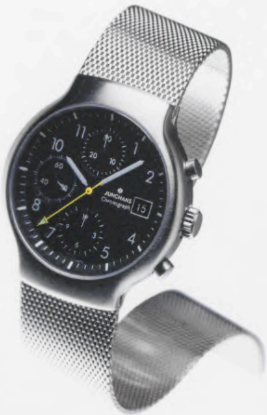
Modell 027/4713.44 Junghans Tourneur Chronograph Mechanisches, Schweizer Präzisions- Automatik-Chronographenwerk Kaliber ETA Valjoux 7750, 25 Steine, 28.800 Halbschwingungen/Stunde, Gangreserve für 44 Stunden, Incabloc-Stoßsicherung, Edelstahlgehäuse, feingeschliffen, Verschraubte Krone, Wasserdicht 5 bar, Gehäuse \varnothing 38,8 mm, Zifferblatt schwarz matt lackiert, Saphirglas, Datum, Zeiger mit inaktiver, umweltfreundlicher Leuchtmasse, Stoppfunktionen: 12 Stunden, Minuten, Sekunden, Edelstahl-Milanaiseband fein gebürstet, DM 2.400,-*