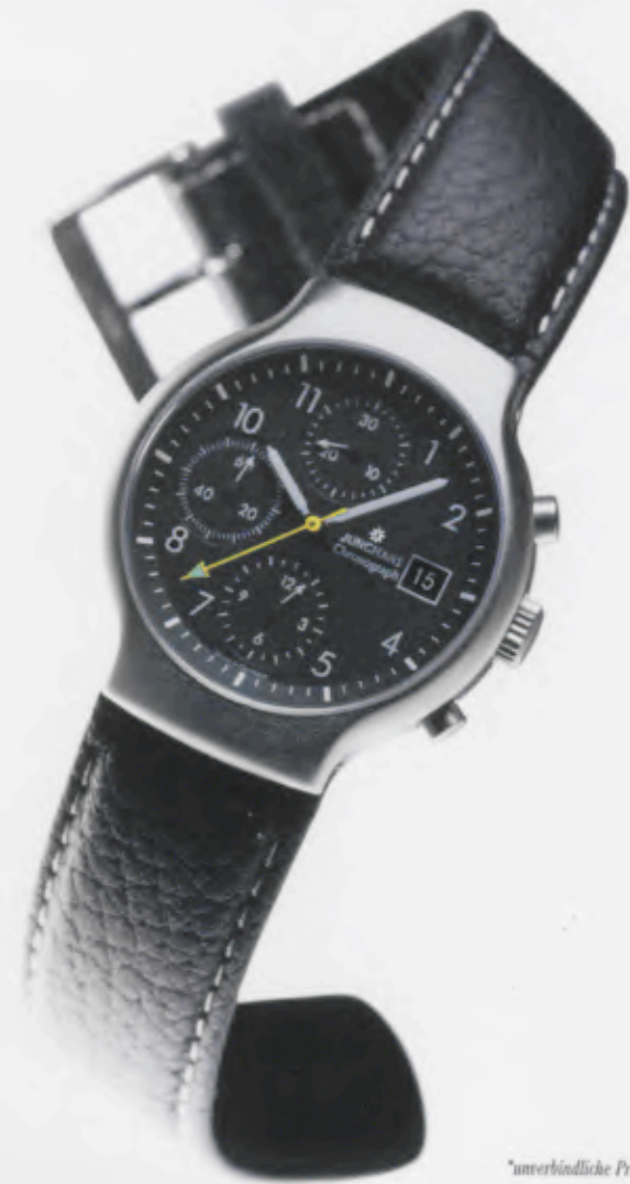
Modell 027/4712.00 Junghans Tourneur Chronograph Mechanisches, Schweizer Präzisions- Automatik-Chronographenwerk Kaliber ETA Valjoux 7750, 25 Steine, 28.800 Halbschwingungen/Stunde, Gangreserve für 44 Stunden, Incabloc-Stoßsicherung, Edelstahlgehäuse, feingeschliffen, Verschraubte Krone, Wasserdicht 5 bar, Gehäuse \varnothing 38,8 mm, Zifferblatt schwarz matt lackiert, Saphirglas, Datum, Zeiger mit inaktiver, umweltfreundlicher Leuchtmasse, Stoppfunktionen: 12 Stunden, Minuten, Sekunden, Kalblederband schwarz matt, DM 2.200,-*