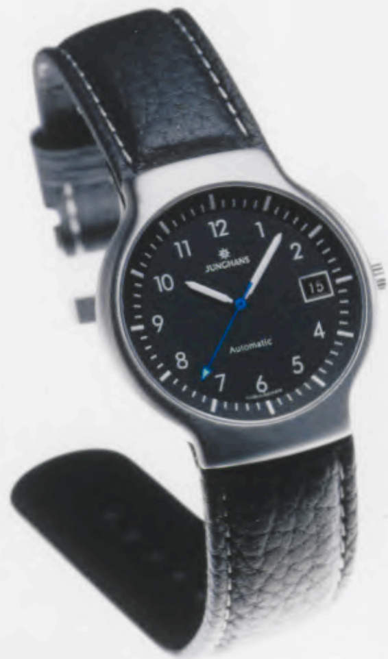
Modell 027/4710.00 Junghans Tourneur Automatic

Mechanisches, Schweizer Präzisions- Automatikwerk Kaliber ETA 2024/2. 25 Steine, 28.800 Halbschwingungen/ Stunde, Inertial-Stoßsicherung, Gangreserve für 38 Stunden, Edelstahlgehäuse, feingeschliffen, Wasserdicht 5 bar, Gehäuse Ø 36,1 mm, Zifferblatt schwarz matt lackiert, Saphirglas, Datum, Zeiger mit inaktiver, umweltfreundlicher Leuchtmasse, Edelstahl-Milannisband, fein gebürstet, DM 1.700,-*