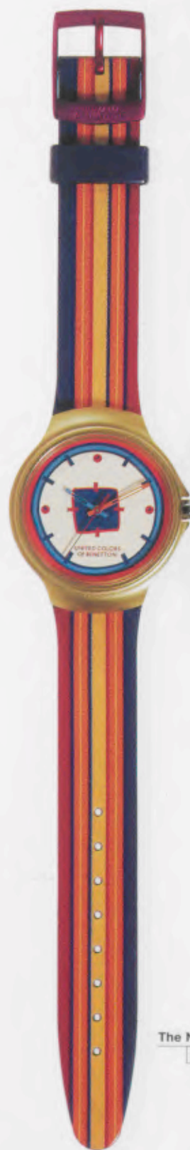
The New Wave 940.0075.10