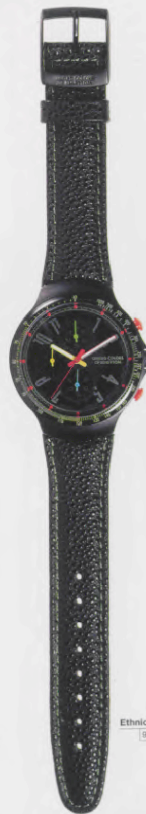
Ethnic Roots 937.0025.20