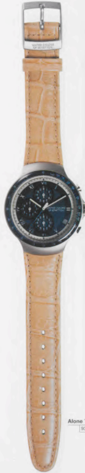
Alone Together 937.0031.20