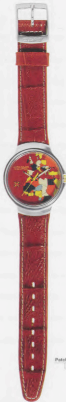
Patch World 940.0079.20