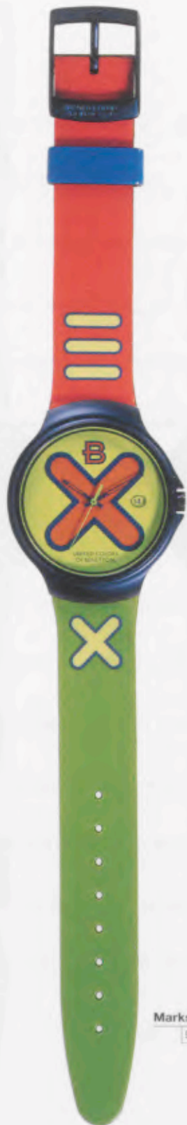
Marks the Spot 940.0098.10