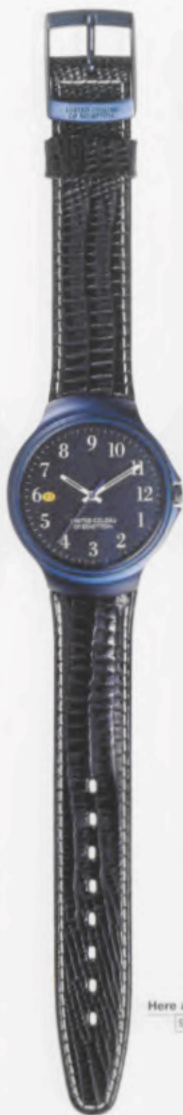
Here and There 940.0059.20