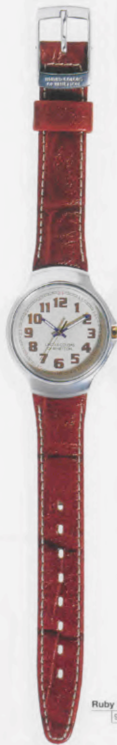
Ruby Retro 939.0022.20