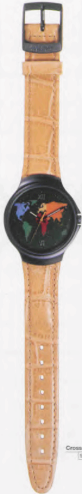
Cross Cultures 940.0080.20