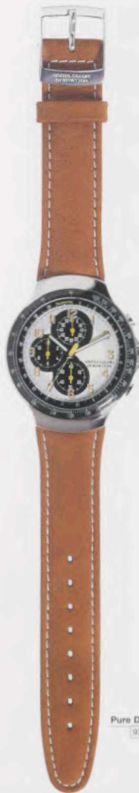
Pure Direction 937.0035.20