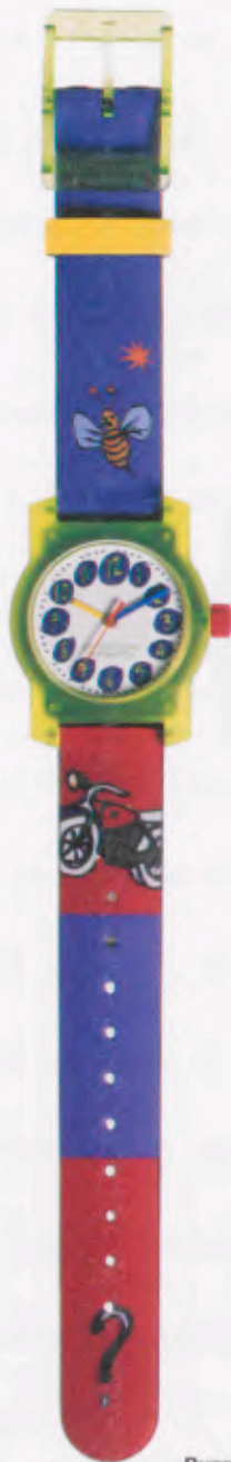
Buzzing About 944.0021.10