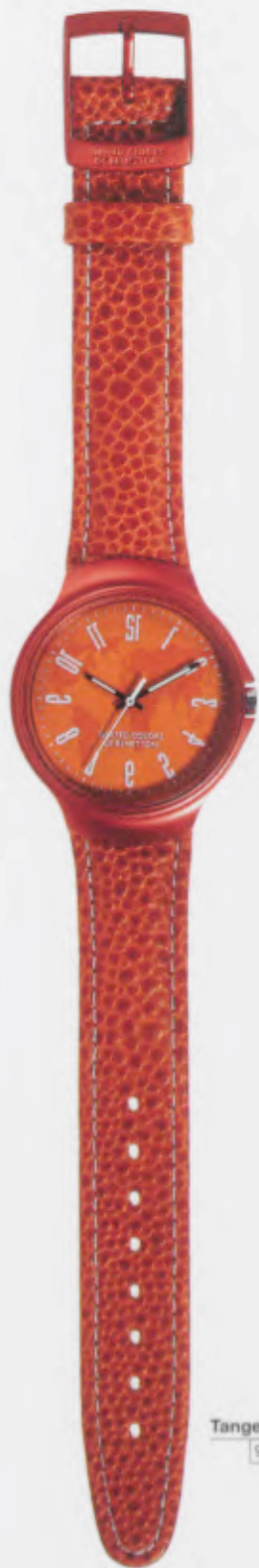
Tangerine World 940.0090.20