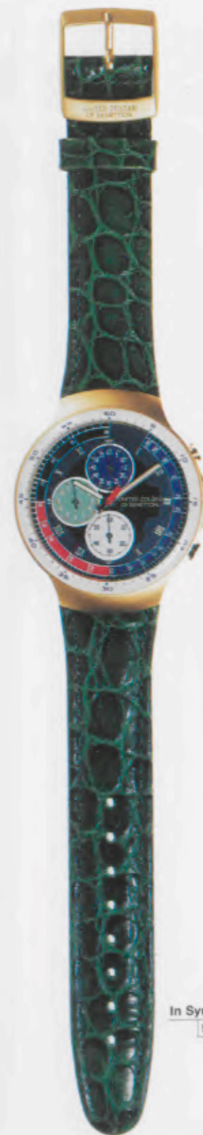
In Sync 937.0030.20