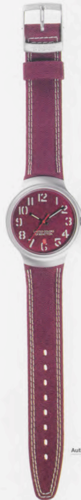
Authentic Origin 940.0066.20

Printemps/Ete 96 - La cinquième collection de la nouvelle génération de montres Benetton. Tout en gardant leur tradition de couleurs vivantes et de formes sobres, ces montres sont en constante évolution, anticipant les tendances et les styles de vie. Cela ne correspond pas seulement à la mode mais aussi à un retour au classicisme, la montre est l'accessoire indispensable au quotidien. Les bracelets en métal retrouvent leurs lettres de noblesse, alors que les bracelets en cuir ou en plastique conservent leur image de qualité. Les cadrans sont toujours rehaussés de touches de couleur en harmonie avec le printemps et l'été, mais un peu plus atténués en raison du retour à la tradition. Comme toujours, la fonction la plus importante est de donner la bonne heure.