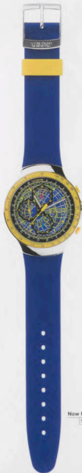
Now Power 937.0028.00