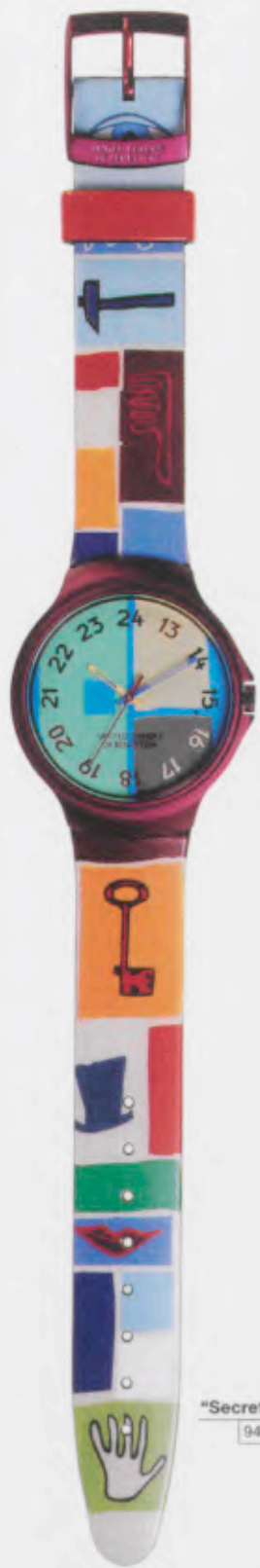
"Secret" Steps 940.0074.10