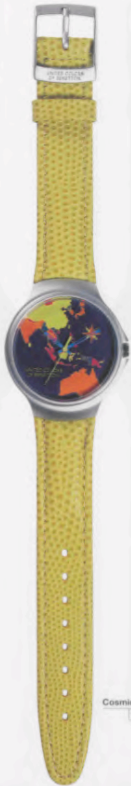
Cosmic Greetings 940.0050.20