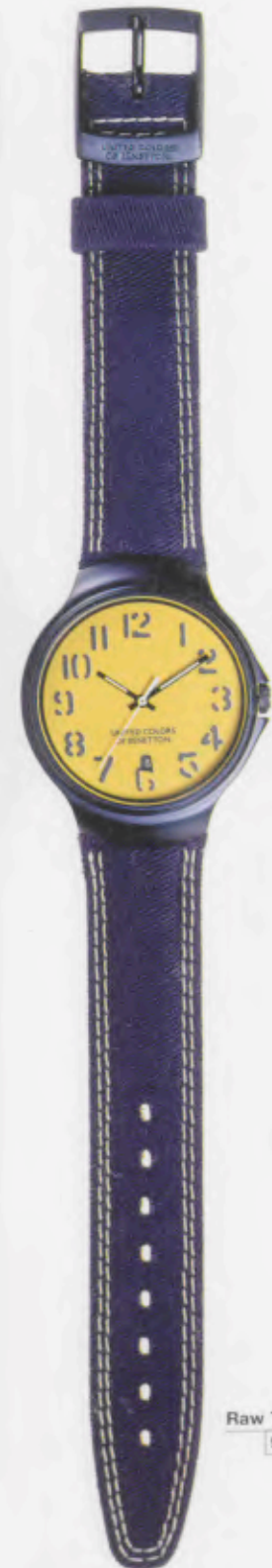
Raw Talent 940.0067.20