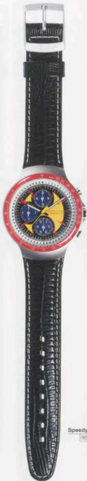
Speedy Shapes 937.0027.20