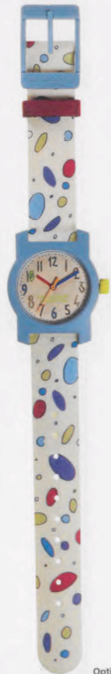
Optical Leopard 944.0017.10