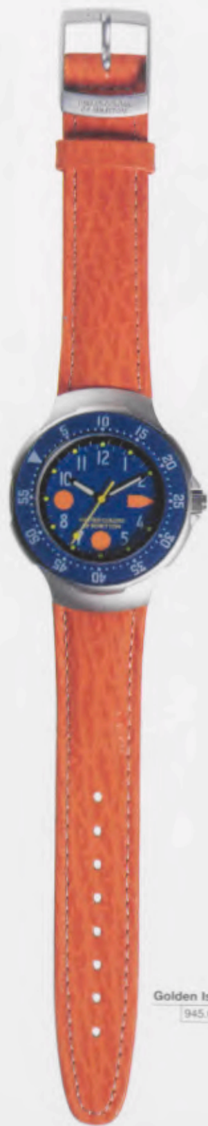
Golden Island 945.0004.20