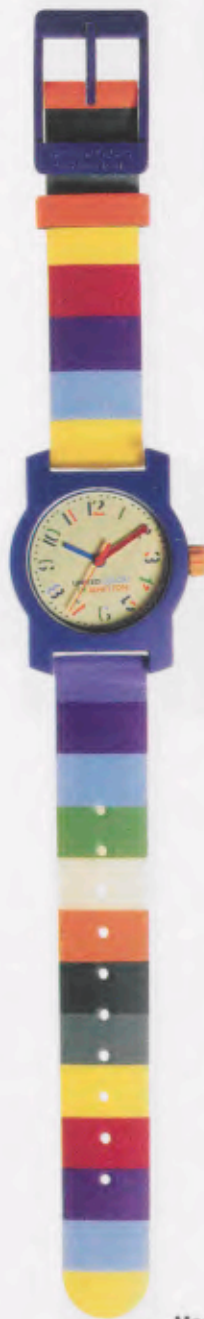
Modern Zebra 944.0016.10