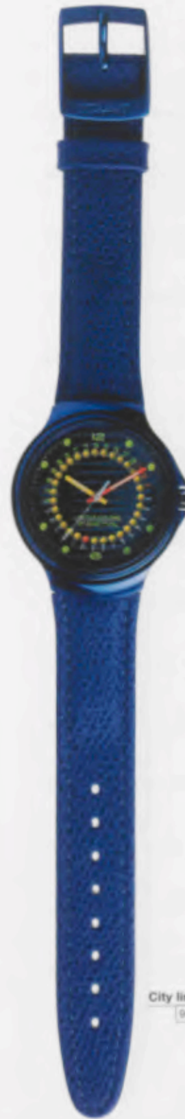
City limit 940.0048.20