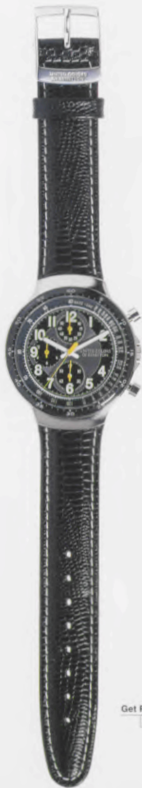
Get Ready 937.0034.20