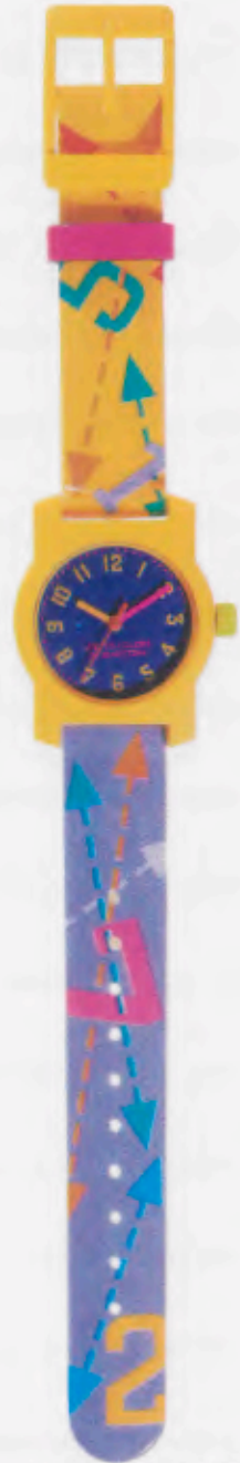
Swift Shift 944.0023.10