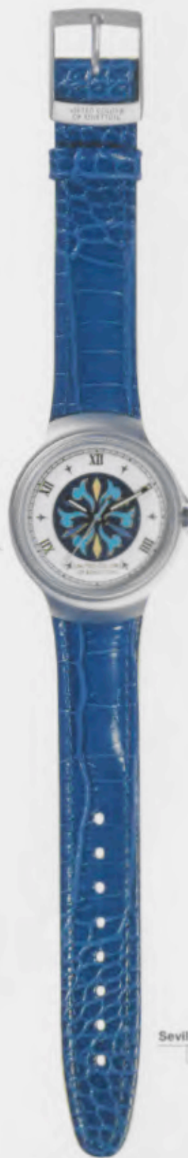
Sevilla Night 940.0046.20