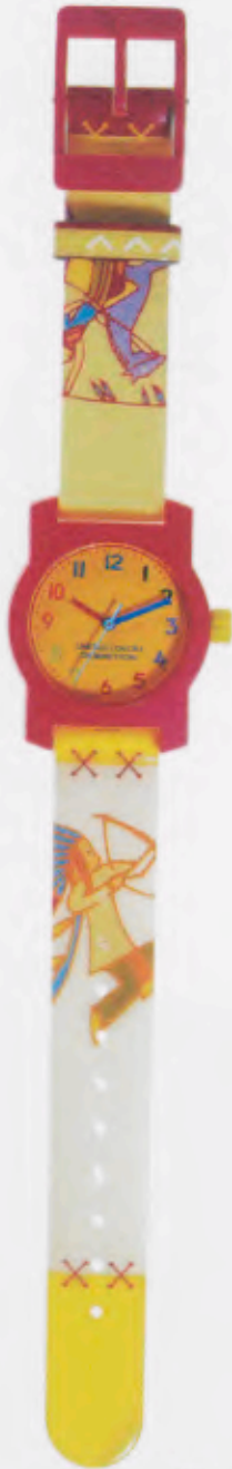
Wild West 944.0027.10