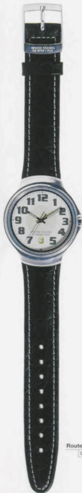
Route 66 940.0095.20