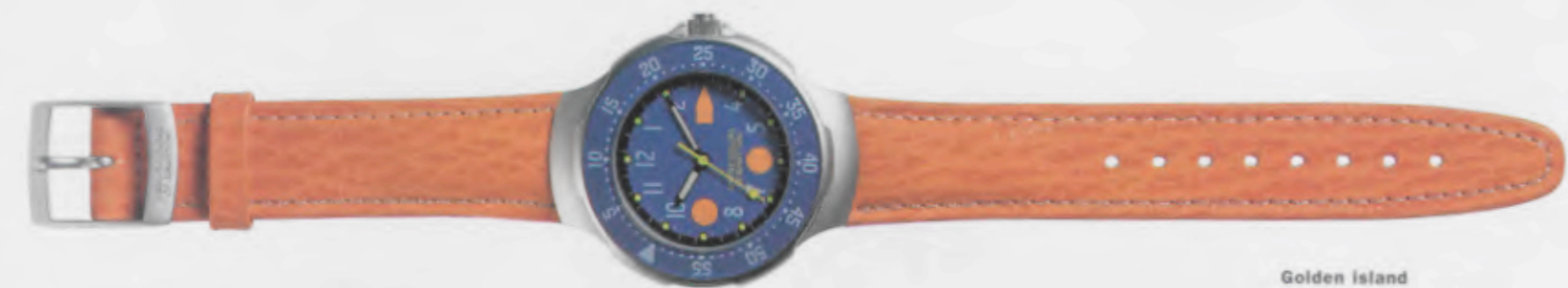
Golden Island 945.0004.00