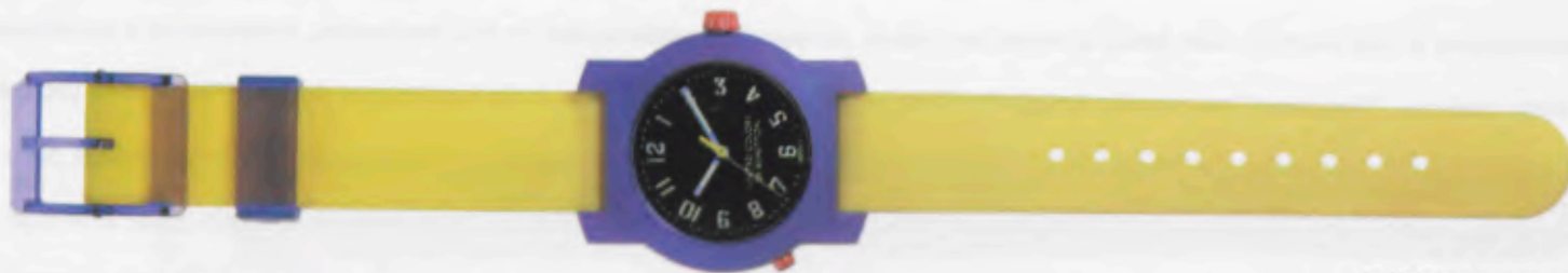
Indiglo™ Banana split