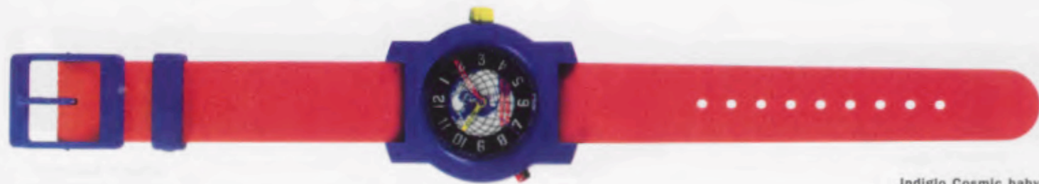
Indiglo Cosmic baby