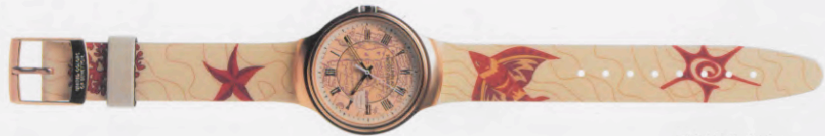
Ticket to the tropics