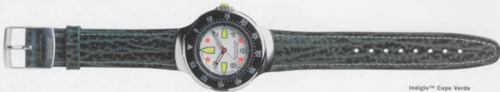
Indiglo™ Cape Verde 945.0000.20