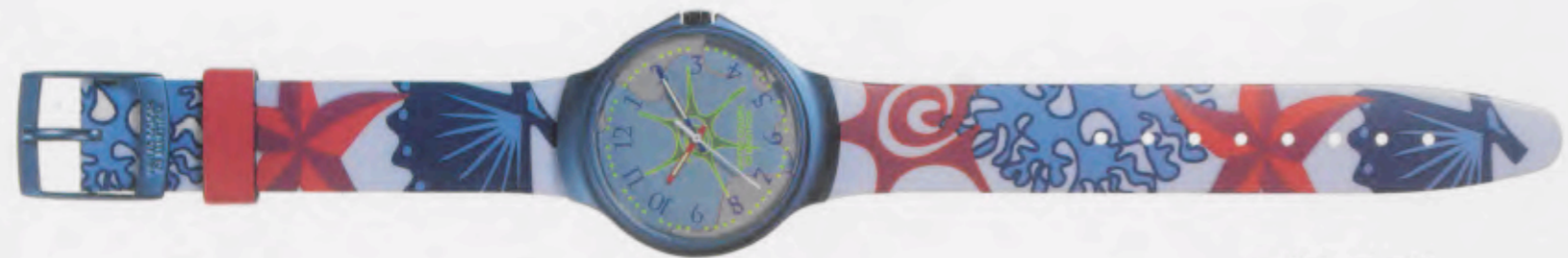
Deep sea water