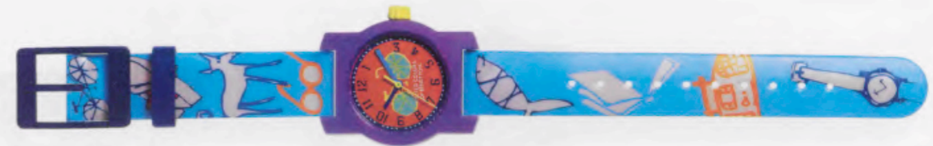
Fun machine 944.0007.10