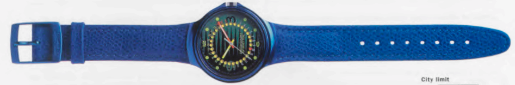
City limit 940.0048.20