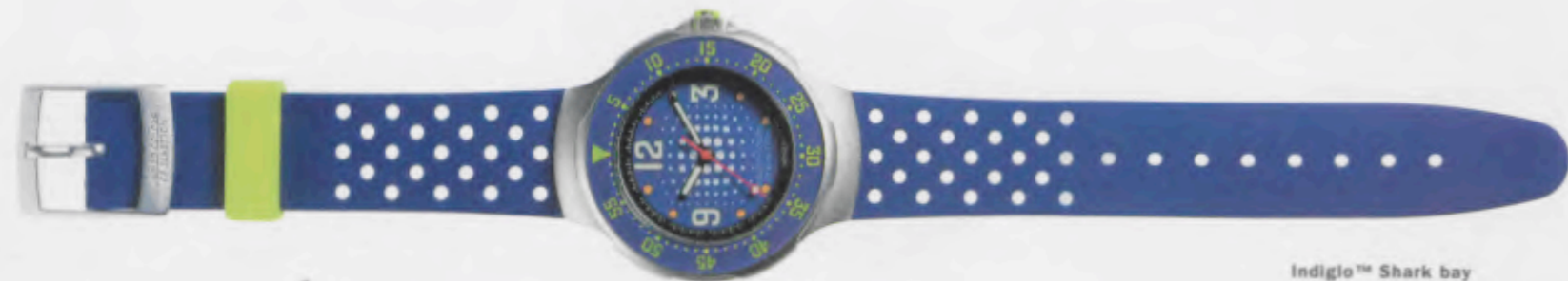
Indiglo™ Shark bay 945.0001.00

INDIGLO is a trademark of Indiglo Corporation