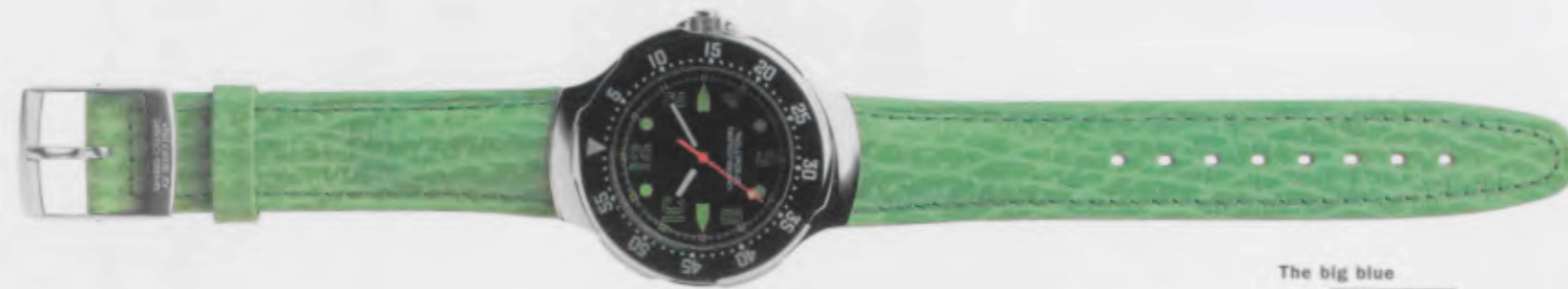
The big blue 945.0003.20