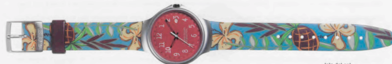
Isla del sol