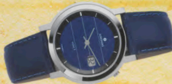
Modell 033/1412 Junghans SOLAR 1 quartz Gehäuse und Lünette palladiumbeschichtet, Mineralglas, Wasserdicht bis 30 m, Lederband. DM 249,-*