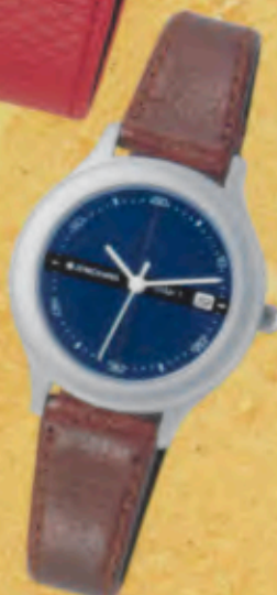
Modell 024/1335 Jungmans SOLAR 1 quartz Gehäuse palladiumbeschichtet, matt gestrahlt, Mineralglas, Wasserdicht bis 30 m, Lederband. DM 129,-*