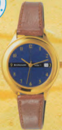
Modell 024/7100 Jungmans SOLAR 1 quartz Gehäuse gelbgoldes, Mineralglas, Wasserdicht bis 30 m, Lederband, Cabouhon-Kreuz. DM 169,-*