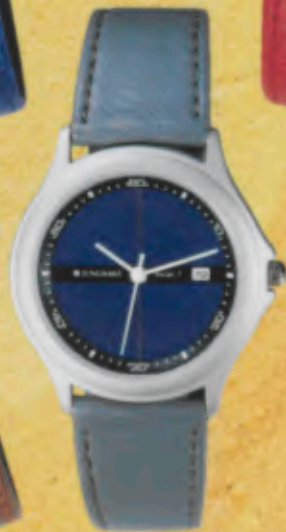
Modell 024/1331 Jungmans SOLAR 1 quartz Gehäuse palladiumbeschichtet, matt gestrahlt, Mineralglas, Wasserdicht bis 30 m, Lederband. DM 129,-*