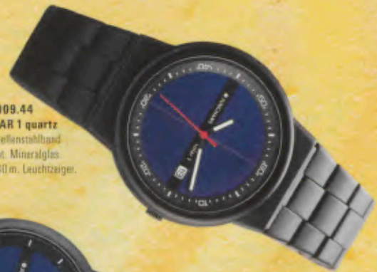
Modell 024/1009.44 Junghans SOLAR 1 quartz Gehäuse und Lamellenstahlband schwarz verchromt, Mineralglas, Wasserdicht bis 30 m, Leuchtzeiger. DM 199,-*

Alle Modelle haben eine Sekunden- und Ladekontroll-Anzeige und Datum-Schnellkorrektur.