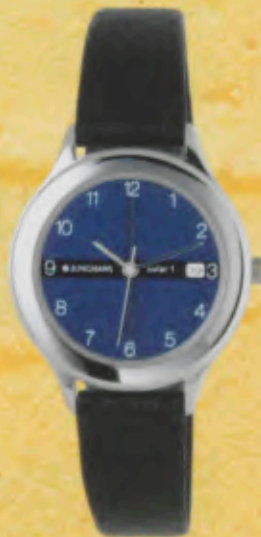
Modell 024/1107 Jungmans SOLAR 1 quartz Gehäuse palladiumbeschichtet, Mineralglas, Wasserdicht bis 30 m, Lederband. DM 149,-*