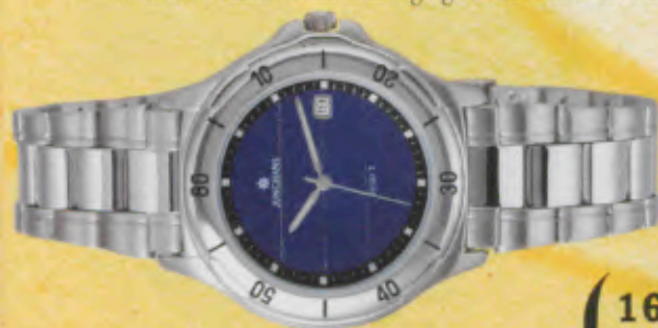
Modell 034/4500.44 Junghans SOLAR 1 quartz Gehäuse, Lunette und Band Edelstahl. Datum-Schnellkorrektur. Wasserdicht bis 50 m. Stundenzeichen und Zeiger mit umweltfreundlicher, inaktiver Leuchtmasse. DM 229,-*

Außer der umweltfreundlichen Solartechnologie haben die Quarzuhren von Junghans noch einiges mehr zu bieten: Datum-Schnellkorrektur und Mineralglas, bis zu 30 oder sogar 50 Meter wasserdicht und eine große Auswahl attraktiver Designs. Ob sportlich oder klassisch, elegant oder hochmodern – für jeden Stil die passende Uhr. Und selbstverständlich auch allergiegetestete Modelle. Wählen Sie selbst.