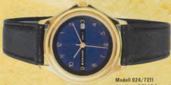
Modell 024/7211 Junghans SOLAR 1 quartz Gehäuse gelbvergoldet, Mineralglas, Wasserdicht bis 30 m, Flankenschutz, Lederband. DM 169,-*