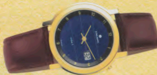
Modell 033/1402 Junghans SOLAR 1 quartz Gehäuse palladiumbeschichtet, Lünette gelbergoldet, Mineralglas, Wasserdicht bis 30 m, Lederband. DM 269,-*