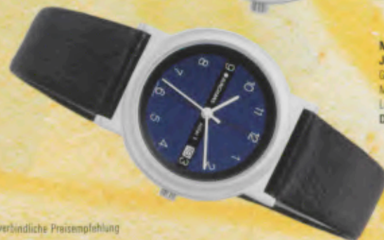
Modell 024/1006 Junghans SOLAR 1 quartz Gehäuse palladiumbeschichtet, Mineralglas, Wasserdicht bis 30 m, Lederband. DM 199,-*