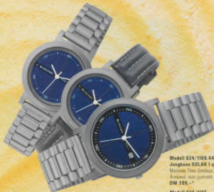
Modell 024/1106.44 Junghans SOLAR 1 quartz Massives Titan-Gehäuse, Titan-Armband, matt gestrahlt. DM 399,-*

Alle Modelle sind wasserdicht bis 30 m, haben eine Sekunden- und Ladestandsanzeige, Datum-Schnellkorrektur und Mineralglas.