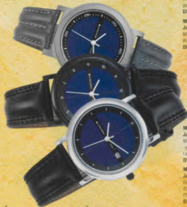
Modell 024/1102 Junghans SOLAR 1 quartz Massives Titan-Gehäuse und -schließe. Pfandlich gegebenes Lederband. DM 349,-*