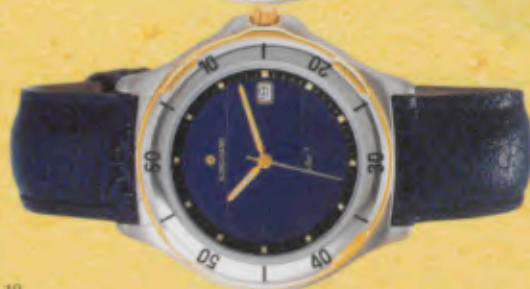
Modell 034/4502.44 Junghans SOLAR 1 quartz Gehäuse Edelstahl, Lunette Edelstahl, gelbvergoldet. Wasserdicht bis 50 m. Stundenzeichen und Zeiger mit umweltfreundlicher, inaktiver Leuchtmasse. DM 229,-*

Alle Modelle sind wasserdicht bis 30 m, haben eine Sekunden- und Ladestandsanzeige, Datum-Schnellkorrektur und Mineralglas.