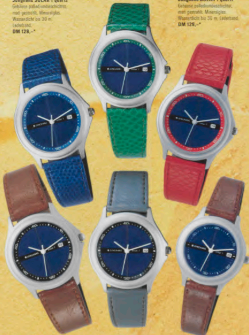
Modell 024/1330 Jungmans SOLAR 1 quartz Gehäuse palladiumbeschichtet, matt gestrahlt, Mineralglas, Wasserdicht bis 30 m, Lederband. DM 129,-*