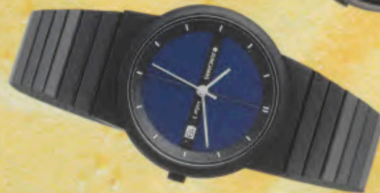
Modell 024/1706.44 Junghans SOLAR 1 quartz Gehäuse und Lamellenstahlband schwarz verchromt, Mineralglas, Wasserdicht bis 30 m. DM 249,-*