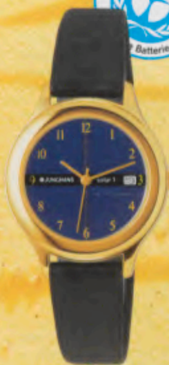
Modell 024/7212 Jungmans SOLAR 1 quartz Gehäuse gelbgoldes, Mineralglas, Wasserdicht bis 30 m, Reflexschutz, Lederband. DM 169,-*