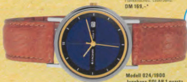
Modell 024/1900 Junghans SOLAR 1 quartz Gehäuse verchromt, Mineralglas, Innenseite goldfarben metallisiert, Krone gelbvergoldet, Wasserdicht bis 30 m, Lederband, Leuchtzeiger. DM 229,-*