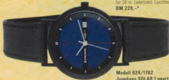
Modell 024/1702 Junghans SOLAR 1 quartz Gehäuse schwarz verchromt, Mineralglas, Lederband, Wasserdicht bis 30 m, Leuchtzeiger. DM 199,-*