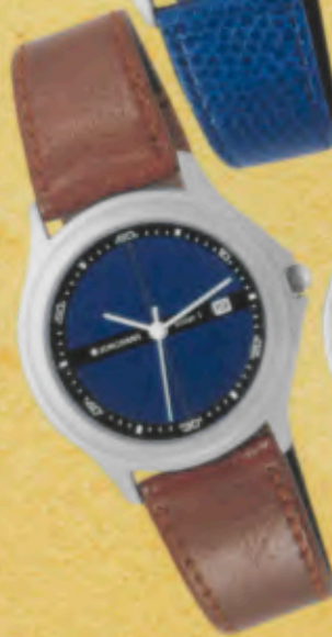
Modell 024/1334 Jungmans SOLAR 1 quartz Gehäuse palladiumbeschichtet, matt gestrahlt, Mineralglas, Wasserdicht bis 30 m, Lederband. DM 129,-*