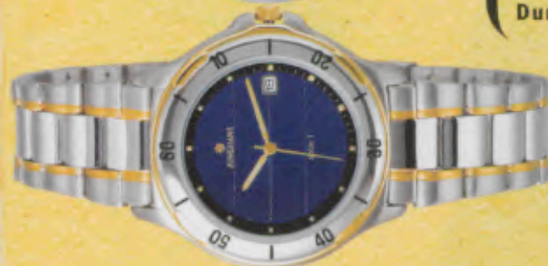
Modell 034/4501.44 Junghans SOLAR 1 quartz Gehäuse und Band Edelstahl. Band einlagen gelbvergoldet. Lunette Edelstahl, gelbvergoldet. Wasserdicht bis 50 m. Stundenzeichen und Zeiger mit umweltfreundlicher, inaktiver Leuchtmasse. DM 249,-*