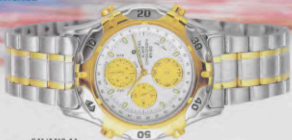
041/4410.44 Herrenuhr quartz Alarm-Chronograph Gehäuse und Band Edelstahl. Drehbare Lunette und Bandenlagen gelbvergoldet. Mineralglas. Wasserdicht bis 100 m. Sekunde. Verschraubter Boden. Leucht- zeichen und -zeiger. DM 499,-*

Auch die Junghans Chronographen überzeugen sowohl durch ihre Optik als auch durch ihre Funktionen, wie zum Beispiel einige Modelle mit Alarmautomatik. Außerdem sind sie selbstverständlich wasserdicht.