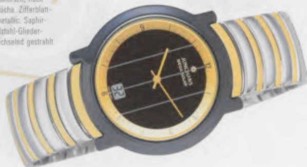
Modell 018/1503.44 Junghans Mega Solar Ceramic Keramik-Gehäuse, anthrazit, hochglanzpolierte Oberfläche. Zifferblattaußenring in Goldmetallic. Saphirglas. Massives Edelstahl-Gliederband, bicolor, abwechselnd gestrahlt und poliert. DM 790,-*

Alle Modelle haben digitale Sekunde und Datum, Saphirglas, wasserdicht bis 30 m.