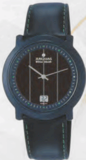
Modell 018/1500 Junghans Mega Solar Ceramic Keramik-Gehäuse, anthrazit, mattsablierte Oberfläche. Zifferblattaußenring mit Stundenpunkten in Grün. Saphirglas. Kalbslederband matt schwarz. DM 650,-*