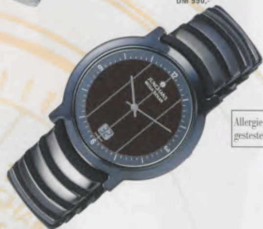
Modell 018/1504.44 Junghans Mega Solar Ceramic Keramik-Gehäuse, anthrazit, hochglanzpolierte Oberfläche. Saphirglas bedruckt und nanofarben bedampft. Keramikband mit hochglanzpolierten Keramikgliedern auf einem Polyurethan Silikonträger schwarz matt. DM 990,-*