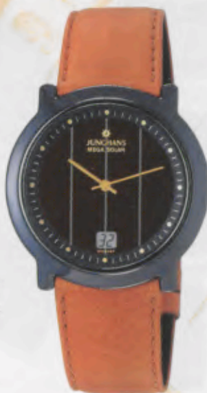
Modell 018/1501 Junghans Mega Solar Ceramic Keramik-Gehäuse, anthrazit, hochglanzpolierte Oberfläche. Zifferblattaußenring mit Stundenpunkten in Goldbronze. Saphirglas. Lederband braun. DM 690,-*