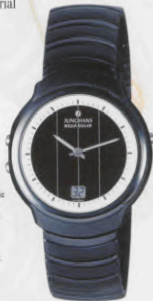
Modell 018/1613.44 Junghans Mega Solar Ceramic Keramik-Gehäuse, anthrazit, matt gestrahlt, Topring hochglanzpoliert. Zifferblattaußenring weiß. Massives Edelstahl-Gliederarmband, komplett PVD-beschichtet, abwechselnd gebürstet und poliert. DM 890,-*