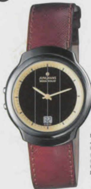
Modell 018/1612 Junghans Mega Solar Ceramic Keramik-Gehäuse, anthrazit, hochglanzpoliert. Zifferblattaußenring goldmetallisch-beschriftet. Kalbslederband. DM 750,-*