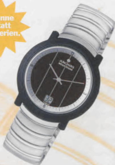
Modell 018/1502.44 Junghans Mega Solar Ceramic Keramik-Gehäuse, anthrazit, mattsablierte Oberfläche. Zifferblattaußenring in Silbermetallic. Saphirglas. Massives Edelstahl-Gliederband, abwechselnd poliert und gebürstet. DM 750,-*