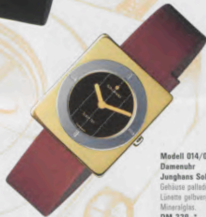
Modell 014/0652 quartz Damenuhr Junghans SolarTEC »design« Gehäuse palladiumbeschichtet. Lünette gelbvergoldet. Mineralglas. DM 229,-*