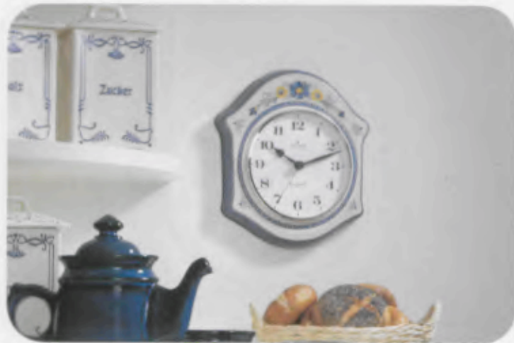
362/1482 quartz 21,5x21,5cm Gehäuse Keramik. Ceramic case. Boîtier céramique. W738