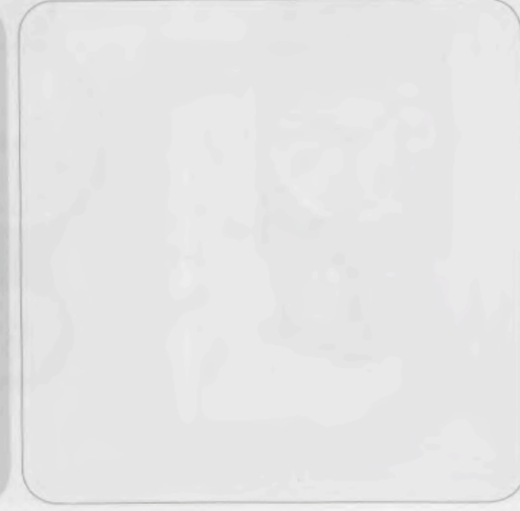
367/6030 quartz 23,5x23,5cm PS-Gehäuse. Verglast. Extraflach. PS case. Vitrified. Extra-flat. Boîtier PS. Vitré. Extra-plat. W738