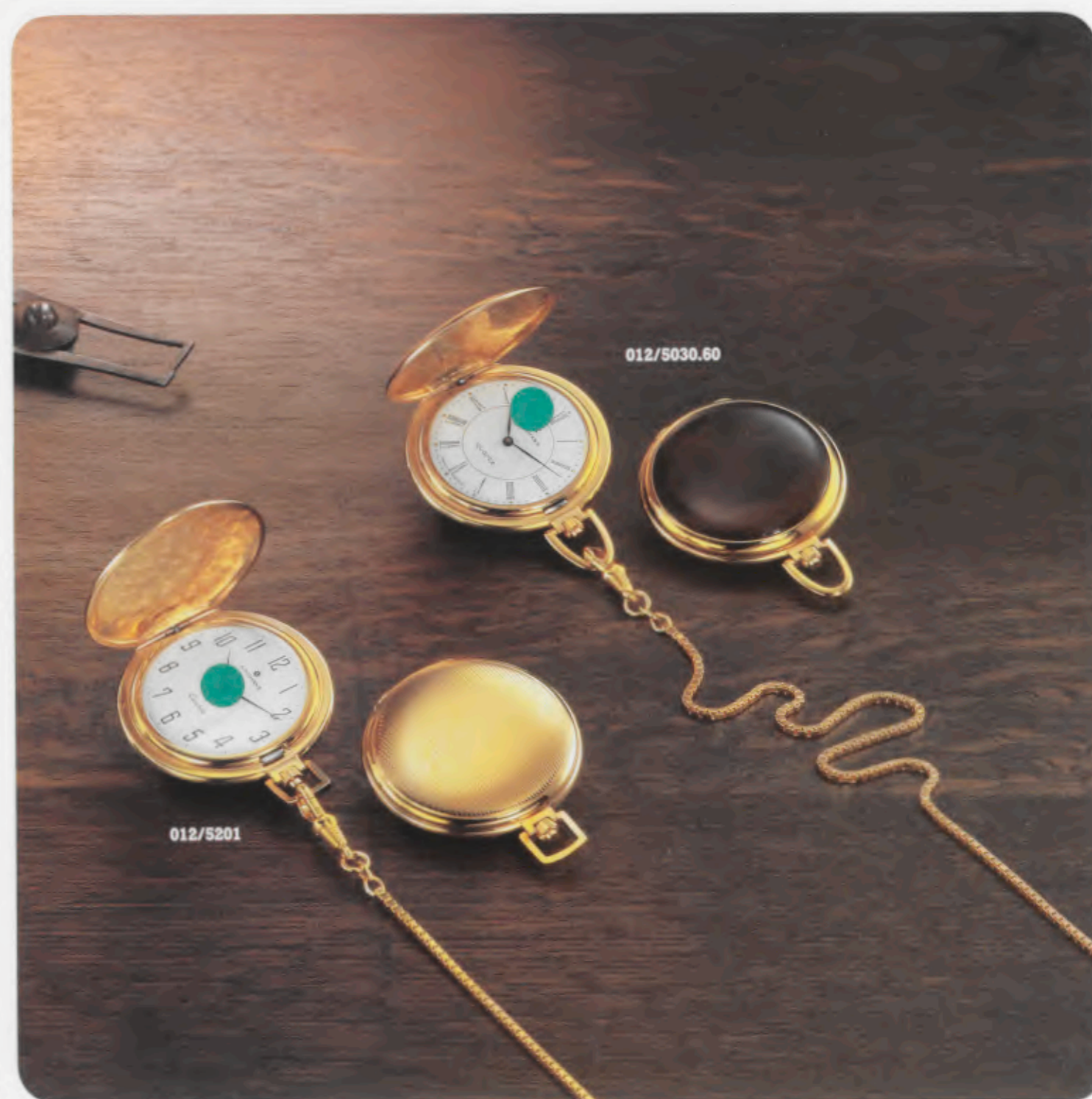
012/5201 Savonette-Taschenuhr mit Liniendekor. Gehäuse Gelb- goldauflage, hartvergoldet. Savonette pocket watch with line décor. Yellow hard gold-plated case. Montre gousset Savonnette, décor rayé. Boîtier plaqué or jaune, placage dur. Reloj de bolsillo Savonette con decoración de líneas. Caja de enchape duro de oro amarillo.