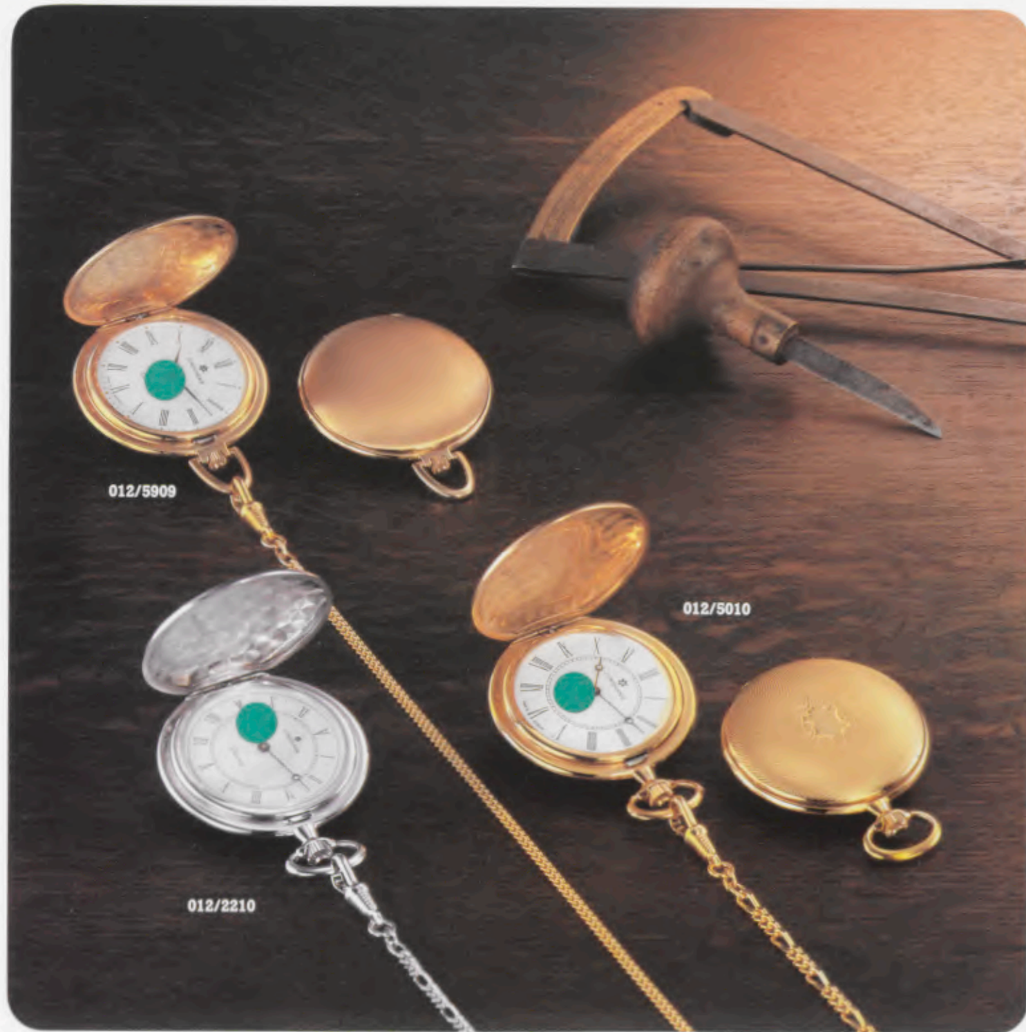
012/5909 Savonette-Taschenuhr. Gehäuse Gelbgoldauflage, hartvergoldet. Savonette pocket watch. Yellow hard gold-plated case. Montre gousset Savonnette. Boîtier plaqué or jaune, placage dur. Reloj de bolsillo Savonette. Caja de enchape duro de oro amarillo.