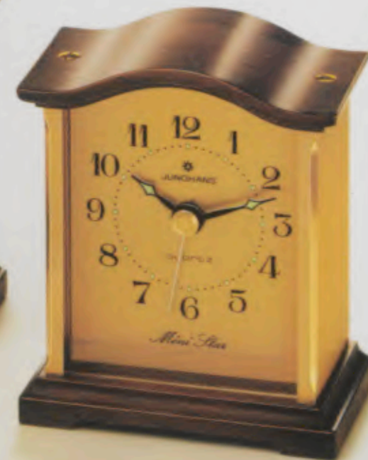
148/1022 »Mini Star« 7,1 x 5,8 cm Metall-Gehäuse, geschliffen, messingfarben, diamantiert. Boden und Deckel in Nußbaum. Metall-Zifferblatt, geschliffen, messingfarben. Mineralglas. Leuchtpunkte und -zeiger. Intermittierendes Wecksignal.