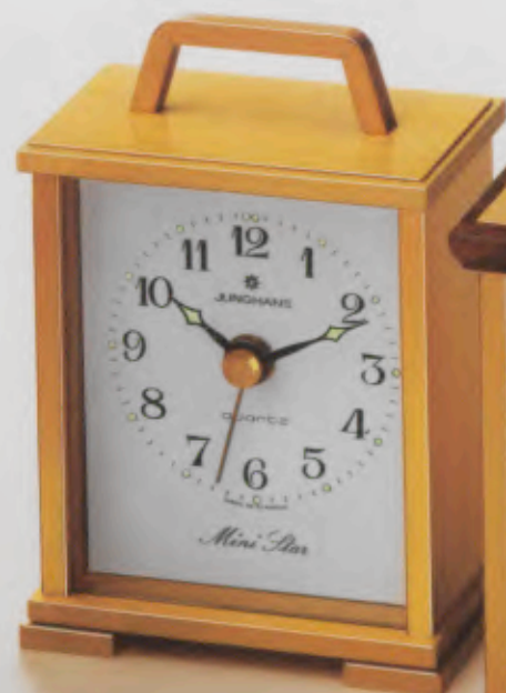
148/1023 »Mini Star« 7,8 x 5,5 cm Metall-Gehäuse, geschliffen, messingfarben, diamantierte Stirnflächen. Metall-Zifferblatt, weiß. Mineralglas. Leuchtpunkte und -zeiger. Intermittierendes Wecksignal.