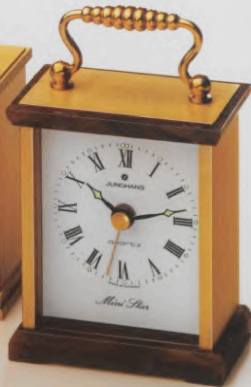
148/1025 »Mini Star« 9,2 x 5,6 cm Metall-Gehäuse, geschliffen, messingfarben, mit marmoriertem Boden und Deckel. Metall-Zifferblatt, weiß. Mineralglas. Leuchtpunkte und -zeiger. Intermittierendes Wecksignal.