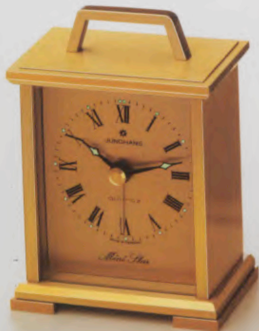
148/1021 »Mini Star« 7,8 x 5,5 cm Metall-Gehäuse, geschliffen, messingfarben mit diamantierten Facetten. Metall-Zifferblatt, messingfarben, geschliffen. Mineralglas. Leuchtpunkte und -zeiger. Intermittierendes Wecksignal.