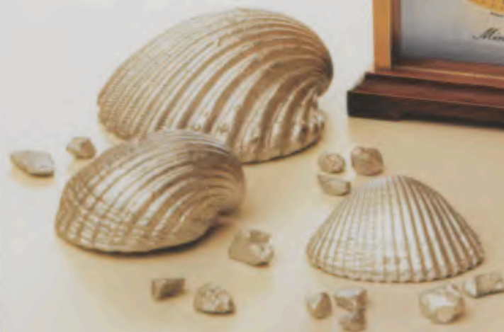
148/1024 »Mini Star« 7,7 x 5,8 cm Metall-Gehäuse, messingfarben, geschliffen. Boden und Deckel in Nußbaum. Messing-Zifferblatt, geschliffen, versilbert, diamantiert. Mineralglas. Leuchtpunkte und -zeiger. Intermittierendes Wecksignal.

Und wer könnte, wer möchte sich dem Charme dieser kleinen, brillant gearbeiteten Kunstwerke entziehen? Sie sind – auf ihre Art – in ihrer Unmittelbarkeit Beispiele für Geschmack und hohe Wohnkultur.