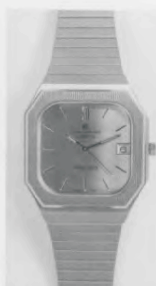
022/4162.44 «Grand Prix»