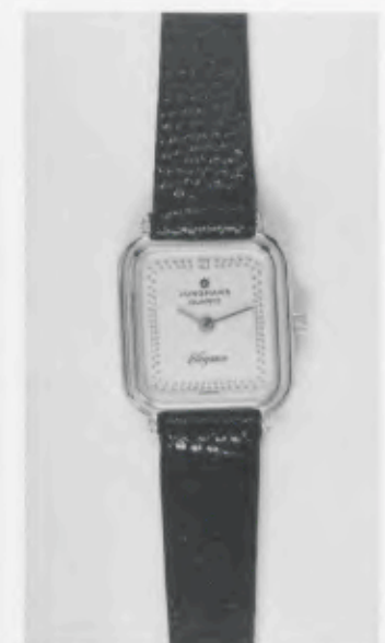
030/2203 »Elegance« Neu