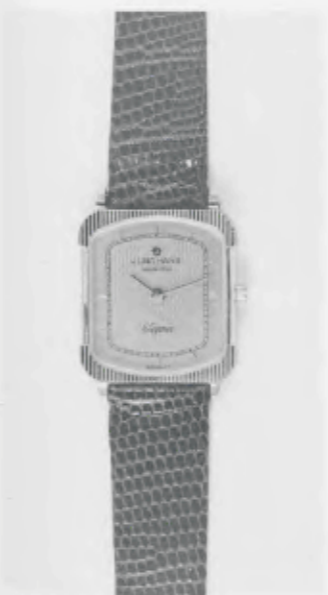
030/2208 »Elegance« Neu