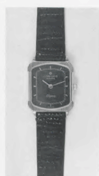
030/5208 »Elegance« Neu