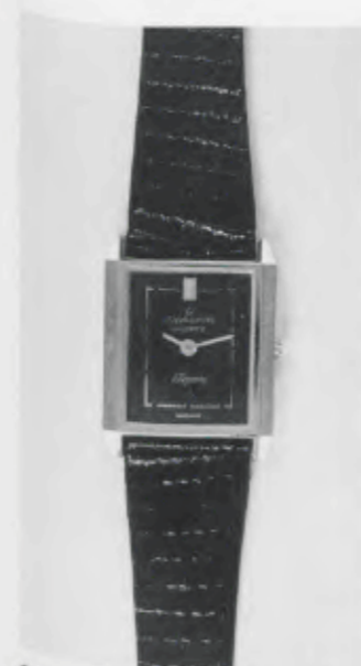
030/5205 »Elegance« Neu