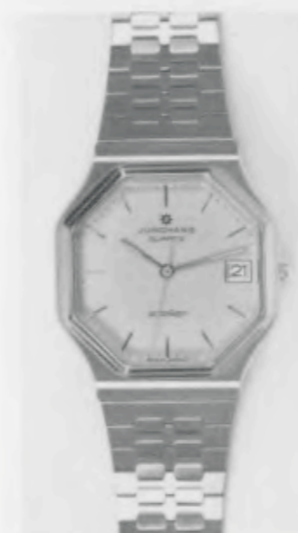
022/4246.44 »atelier« Neu