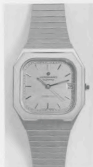
022/4164.44 »Grand Prix«