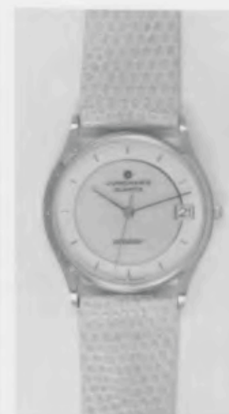
022/2233 »atelier« Neu