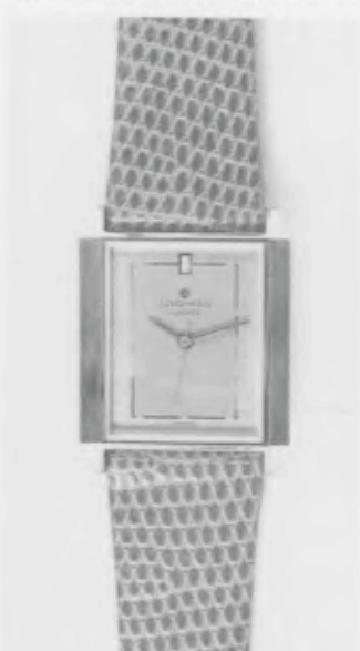
023/2221 »Elegance« Neu