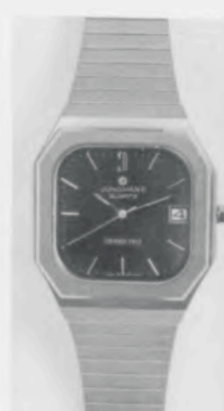
022/4163.44 «Grand Prix»