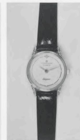
030/2201 »Elegance« Neu