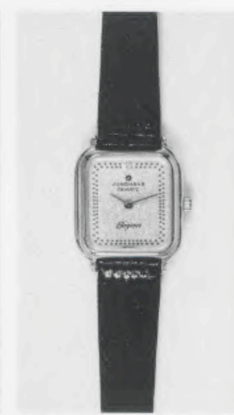
030/5203 »Elegance« Neu