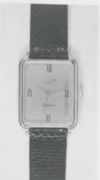
023/5211 »Elegance« Neu