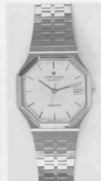
022/4245.44 »atelier« Neu