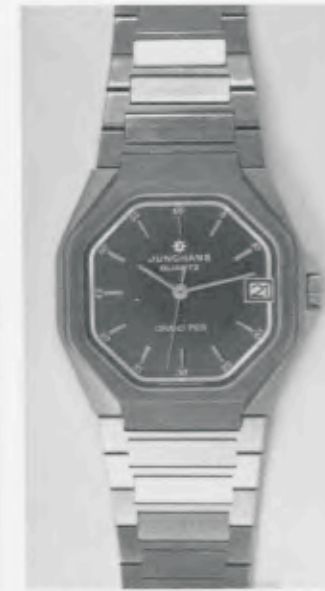
024/4211.44 »Grand Prix« Neu