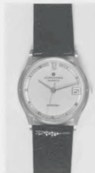
022/2232 »atelier« Neu