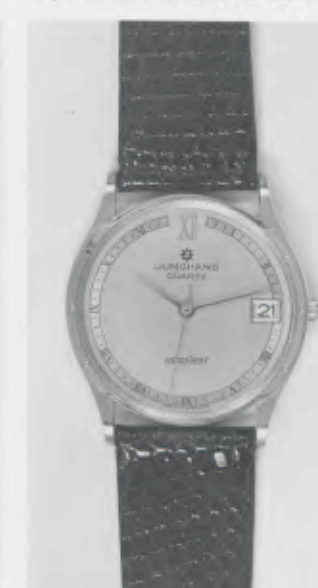
022/7233 »atelier« Neu