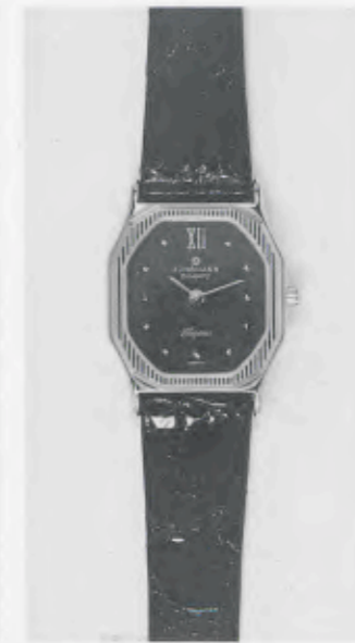
030/5211 »Elegance« Neu