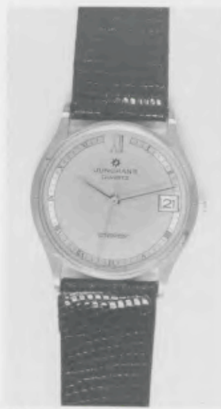
022/7239 »atelier« Neu