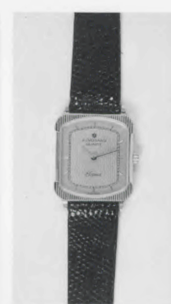
030/5207 »Elegance« Neu