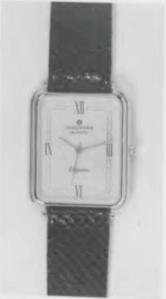
023/5210 »Elegance« Neu