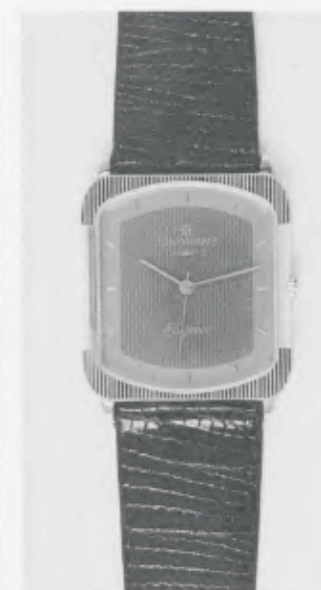
023/5232 »Elegance« Neu