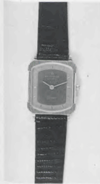
030/5209 »Elegance« Neu