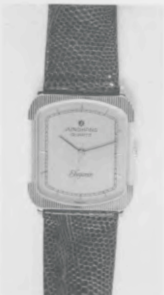
023/2231 »Elegance« Neu