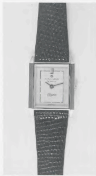
030/2205 »Elegance« Neu