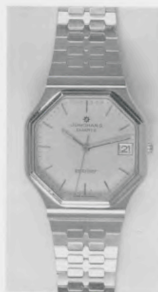
022/7245.44 »atelier« Neu