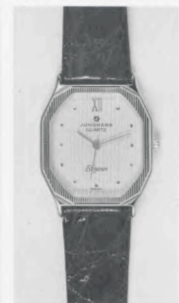
023/5240 »Elegance« Neu