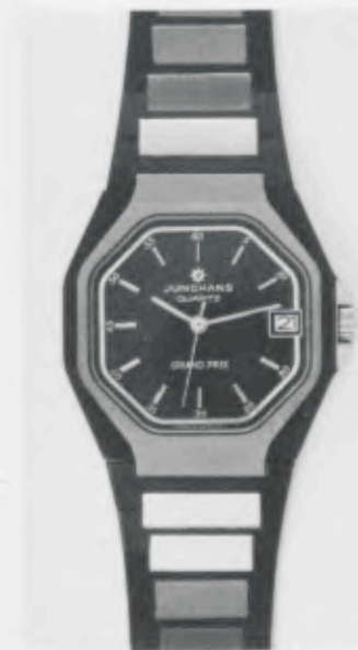
024/4213.44 »Grand Prix« Neu