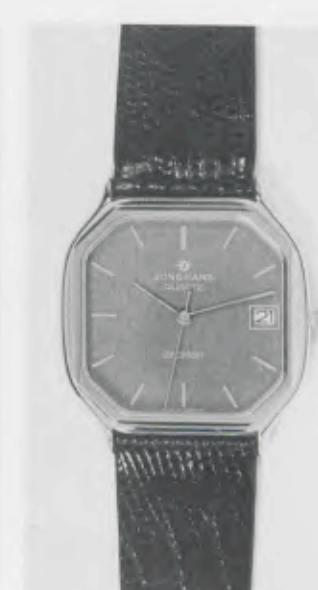
022/7237 »atelier« Neu