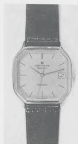
022/7235 »atelier« Neu