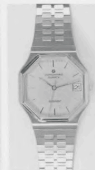
022/4248.44 »atelier« Neu