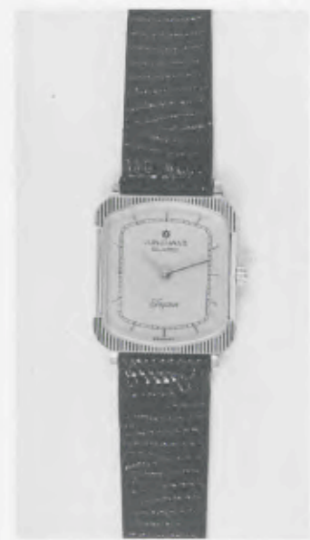
030/2207 »Elegance« Neu