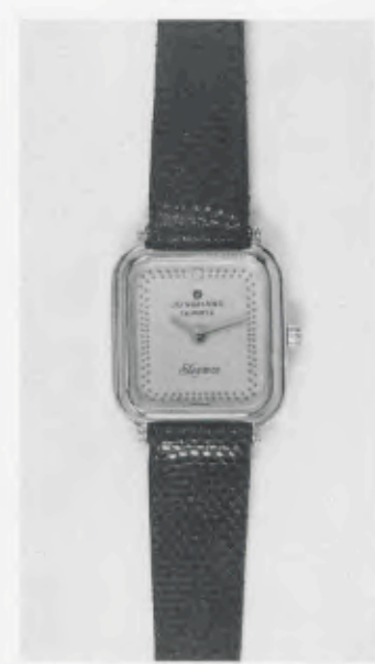
030/5204 »Elegance« Neu