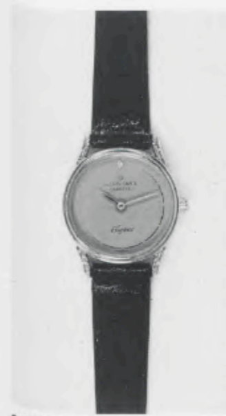
030/5201 »Elegance« Neu