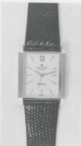
023/2220 »Elegance« Neu