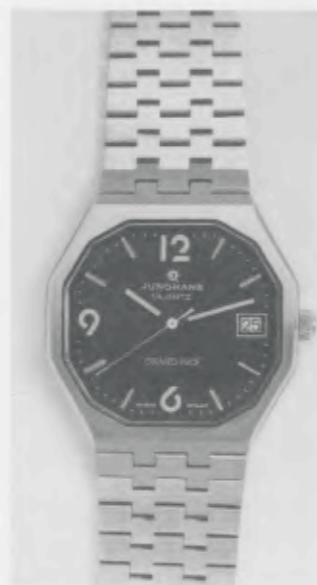
022/4123.44 »Grand Prix«