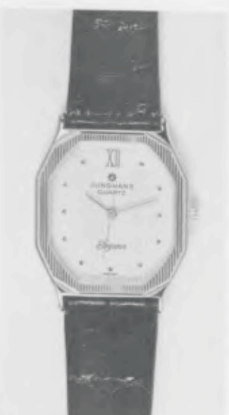
023/2240 »Elegance« Neu