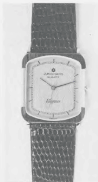
023/5230 »Elegance« Neu