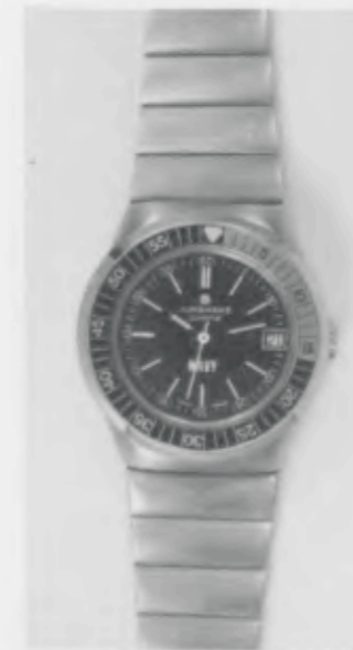
017/4260.40 «Grand Prix» Neu