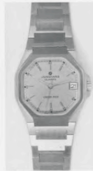
024/4214.44 »Grand Prix« Neu