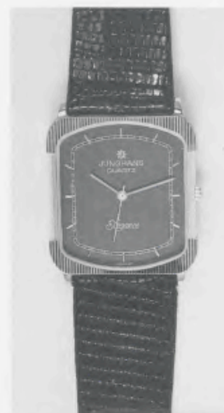
023/5231 »Elegance« Neu