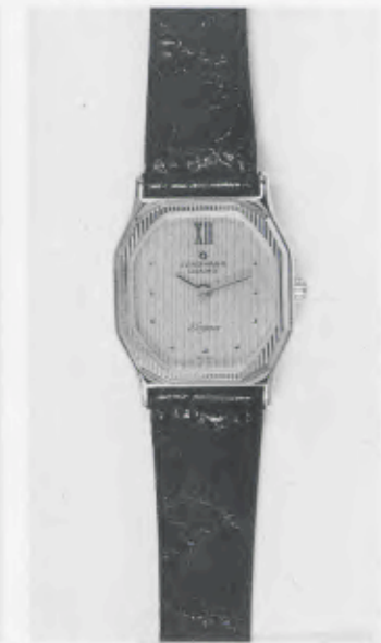
030/5212 »Elegance« Neu