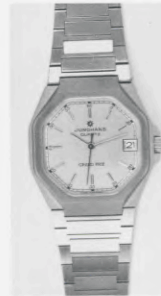
024/4210.44 »Grand Prix« Neu