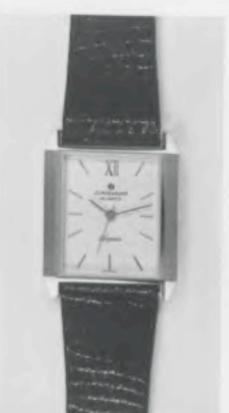
023/5220 »Elegance« Neu