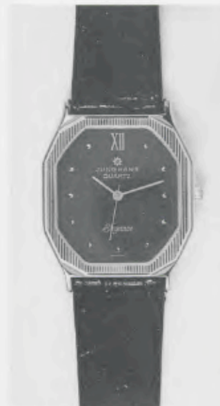
023/5241 »Elegance« Neu