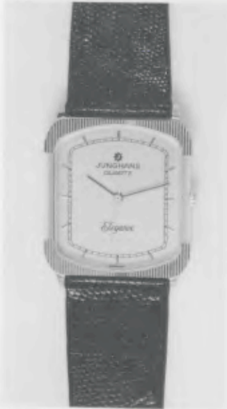
023/2230 »Elegance« Neu