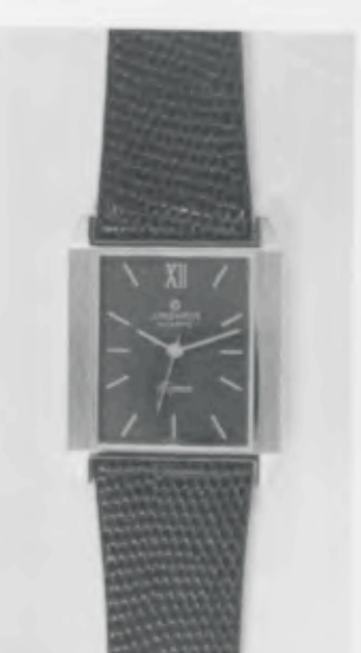
023/5221 »Elegance« Neu