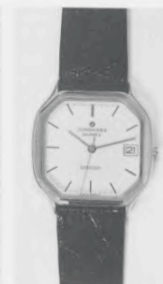
022/2235 »atelier« Neu