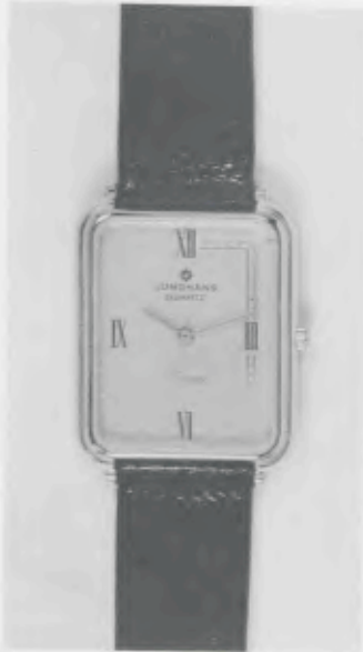
023/2210 »Elegance« Neu