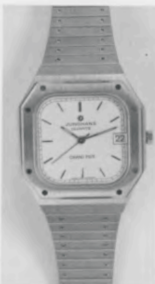
022/4160.44 «Grand Prix»