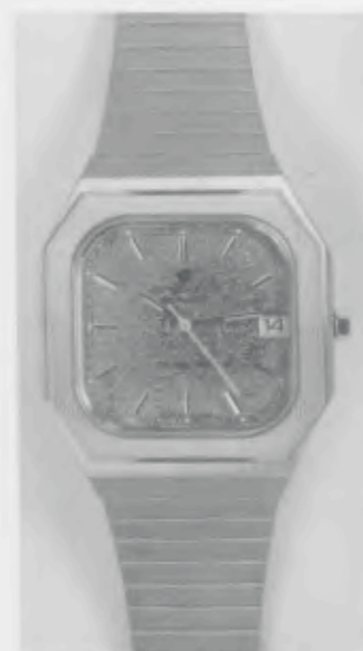
022/4165.44 »Grand Prix«