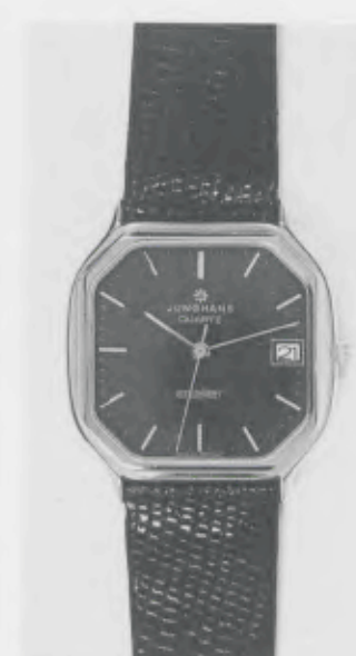
022/7236 »atelier« Neu