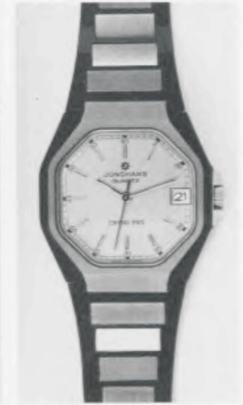
024/4212.44 »Grand Prix« Neu