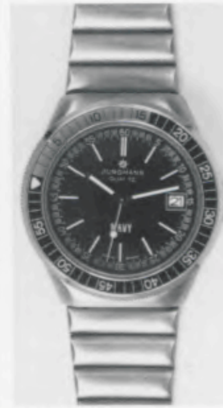
024/4245.44 »Grand Prix« Neu