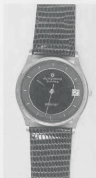
022/7234 »atelier« Neu