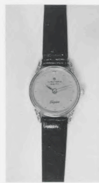
030/5202 »Elegance« Neu