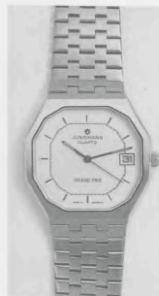
022/4120.44 »Grand Prix«