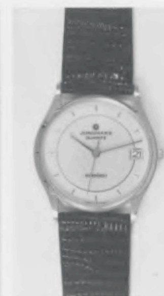
022/2234 »atelier« Neu