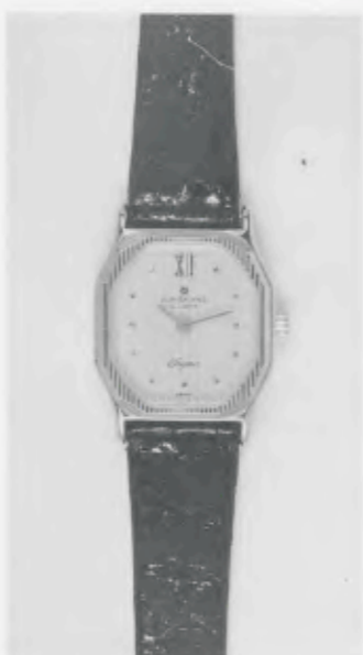
030/2210 »Elegance« Neu