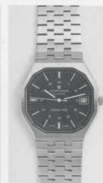
022/4122.44 »Grand Prix«