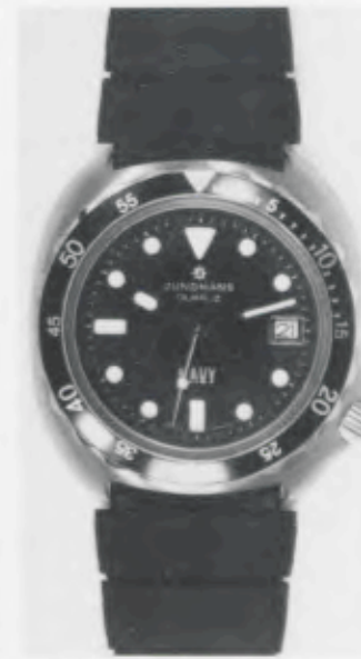
024/4240 »Grand Prix« Neu