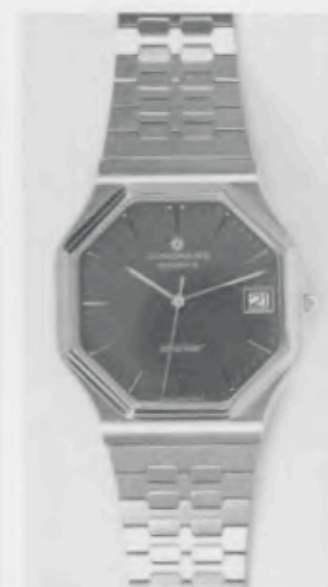
022/4247.44 »atelier« Neu