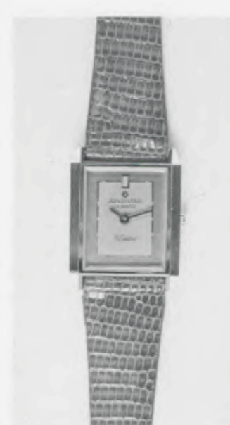
030/5206 »Elegance« Neu