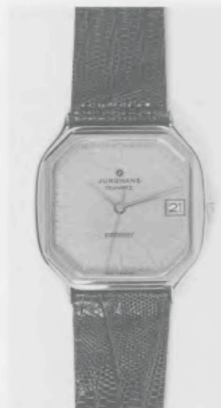
022/2236 »atelier« Neu