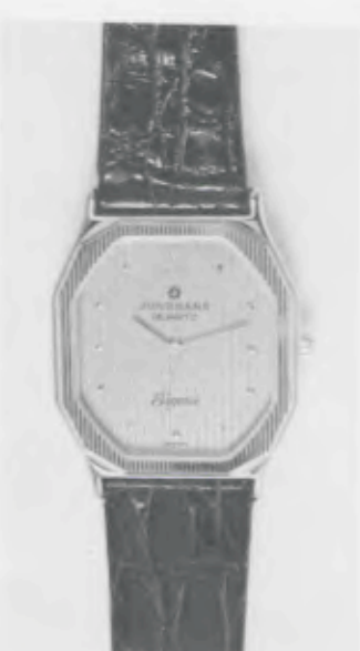
023/2241 »Elegance« Neu