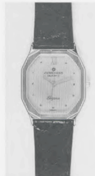
023/5242 »Elegance« Neu