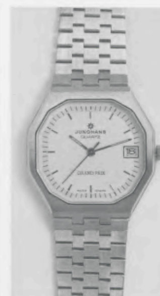
022/4121.44 »Grand Prix«