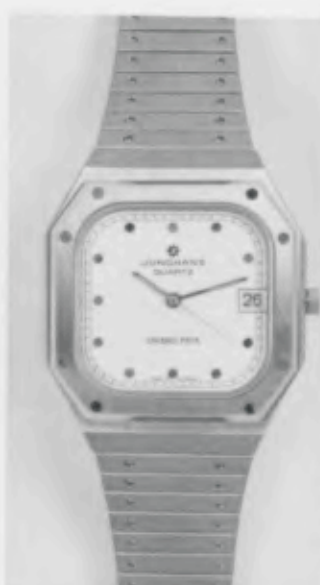
022/4161.44 «Grand Prix»