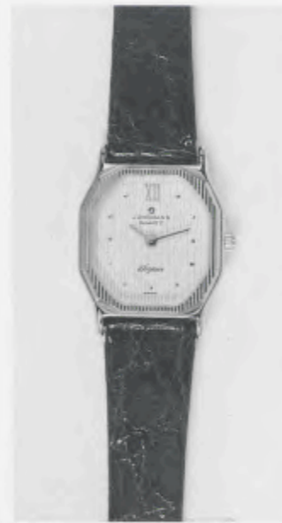
030/5210 »Elegance« Neu