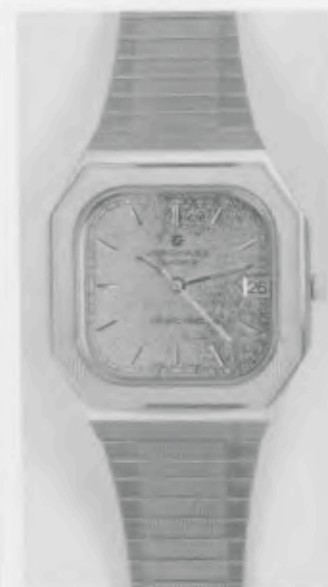
022/4166.44 »Grand Prix«