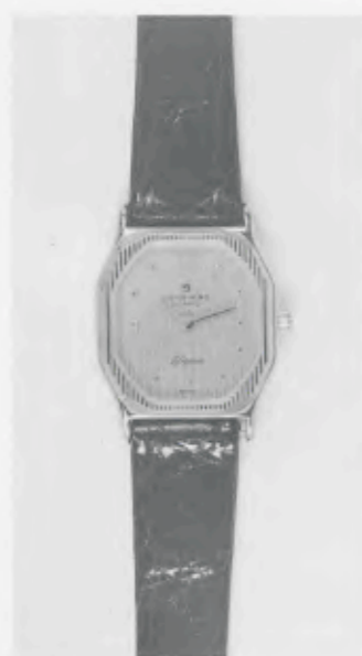
030/2211 »Elegance« Neu