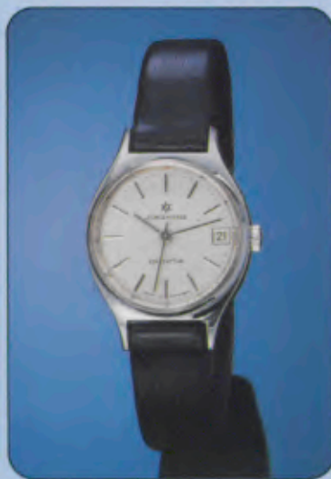
017/1110 Damen-Quartzuhr. Gehäuse Chromauf- lage, hartverchromt. Wasserdicht DIN 8310. Datum mit Schnellkorrektur. Zeit- zone-Schnelleinstellung. Lederband.

017/7110 gleiches Modell, Gelbgoldauf- lage, hartvergoldet.