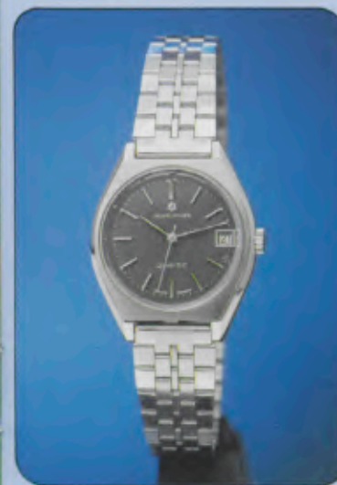
017/4103.44 Damen-Quartzuhr. Gehäuse und Band Edelstahl. Wasserresistent. Datum mit Schnellkorrektur. Zeitzone-Schnellein- stellung. Leuchtzeichen. 017/4102.44 gleiches Modell, versilber- tes Zifferblatt 017/4101.44 gleiches Modell, versilber- tes Zahlenblatt.