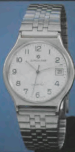
020/4115.44 Herren-Quartzuhr. Gehäuse und Band Edelstahl. Wasserresistent. Datum mit Schnellkorrektur. Zeitzone-Schnellein- stellung. Leuchtzeichen. 020/4116.44 gleiches Modell mit Stun- denzeichen. 020/4117.44 gleiches Modell, mattblaues Zifferblatt mit Stundenzeichen.