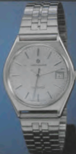
020/4111.44 Herren-Quartzuhr. Gehäuse und Band Edelstahl. Wasserresistent. Datum mit Schnellkorrektur. Zeitzone-Schnellein- stellung. Leuchtzeichen. 020/4112.44 gleiches Modell, graues Zifferblatt.