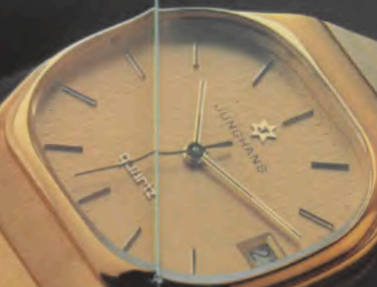
020/7150.44 Herren-Quartzuhr. Gehäuse und Edel- stahlband Gelbgoldauflage, hart- vergoldet. Staub- und wassergeschützt. Mineralglas. Datum mit Schnellkorrektur. Zeitzone-Schnelleinstellung. Leucht- zeichen. 020/7151.44 gleiches Modell, dunkel- blaues Zifferblatt.

Das Besondere dieser Quartz-Uhren offenbart sich auf den ersten Blick im Styling, der hochwertigen Verarbeitung und dem unverwechselbaren Finish. Ihr innerer Wert jedoch zeigt sich im Alltag: Zuverlässigkeit auf der Basis modernster Quartz-Technologie. Die Sorgfalt, mit der jede JUNGHANS-Quartz gefertigt wird, macht aus ihr einen zuverlässigen Begleiter über viele Jahre.