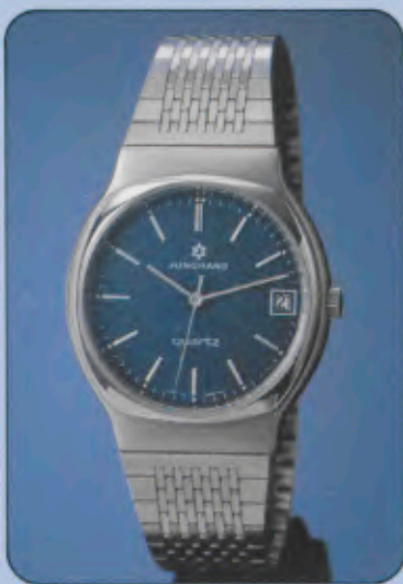
020/4081.44 Herren-Quartzuhr. Gehäuse und Band Edelstahl. Wasserresistent. Mineralglas. Datum mit Schnellkorrektur. Zeitzone- Schnelleinstellung. Leuchtzeichen.

020/4080.44 gleiches Modell, Zifferblatt versilbert.