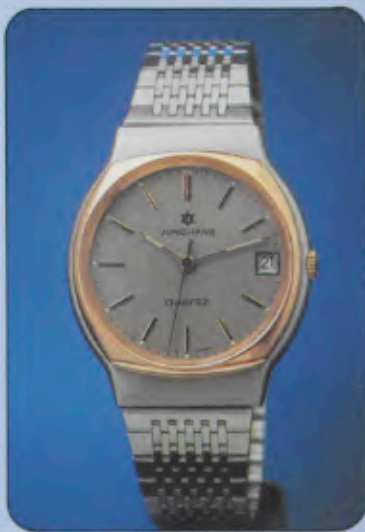
020/4082.44 Herren-Quartzuhr. Gehäuse und Band Edelstahl. Lünette mit Gelbgoldauflage, hartvergoldet. Wasserresistent. Mi- neralglas. Datum mit Schnellkorrektur. Zeitzone-Schnelleinstellung. Leucht- zeichen.

020/4080.44 gleiches Modell, Zifferblatt versilbert.