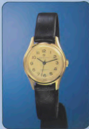
017/5101 Damen-Quartzuhr. Gehäuse Gelbgoldauf- lage, hartvergoldet. Wasserdicht DIN 8310. Lederband. 017/5102 gleiches Modell, versilbertes Zifferblatt mit Stundenzeichen. 017/0101 gleiches Modell, Gehäuse Chromauflage, hartverchromt. Versilber- tes Zifferblatt mit arabischen Zahlen.

017/7110 gleiches Modell, Gelbgoldauf- lage, hartvergoldet.