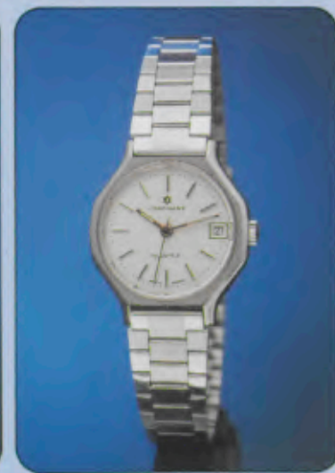
017/4111.44 Damen-Quartzuhr. Gehäuse und Band Edelstahl. Wasserresistent. Datum mit Schnellkorrektur. Zeitzone-Schnellein- stellung. Leuchtzeichen. 017/4112.44 gleiches Modell, römisches Zahlenblatt.