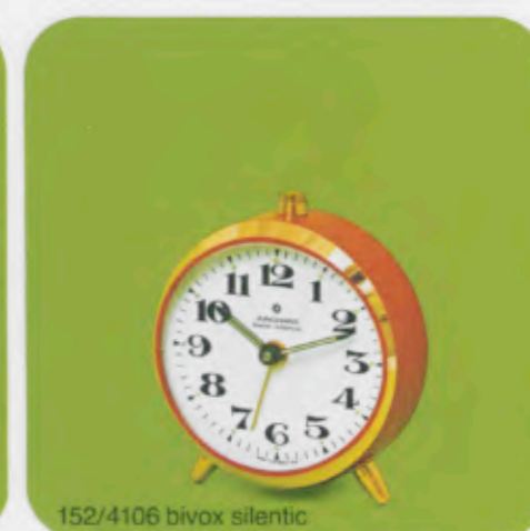
152/4106 bivox silentic