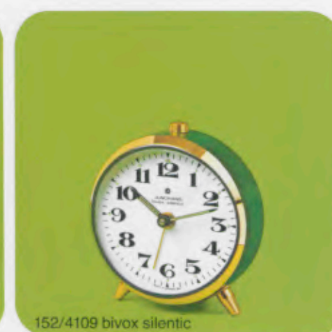
152/4109 bivox silentic