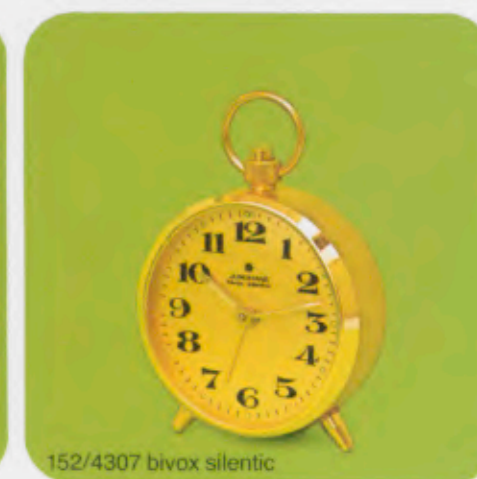
152/4307 bivox silentic

152/4105 bivox silentic 7,0 x 6,5 cm Gehäuse Messing, diamantiert. Zifferblatt Aluminium, lackiert. Außenglocke. Leuchtpunkte und -zeiger. Brass case, diamond finished. Aluminum dial, painted. Outside bell. Luminous dots and hands. Boîtier laiton diamanté. Cadran aluminium, laqué. Cloche extérieure. Aiguilles et points lumineux. Caja de latón diamantada. Campanilla externa. Esfera de aluminio, barnizada. Campanilla externa. Agujas y punteros luminosos.