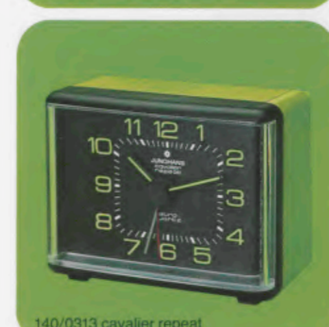
140/0313 cavalier repeat