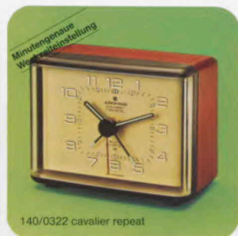
140/0322 cavalier repeat