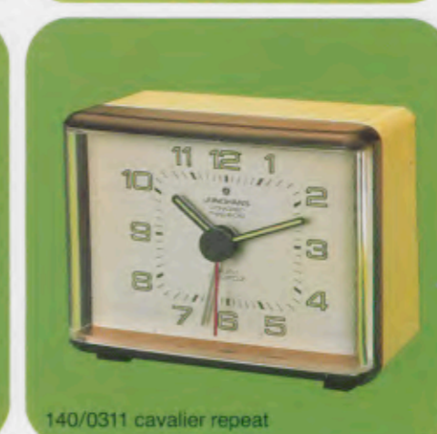
140/0311 cavalier repeat