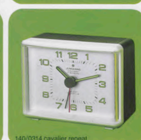
140/0314 cavalier repeat