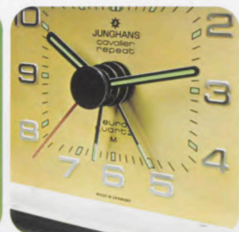
Fig. 1 Minutengenaue Weckzeiteinstellung. Alarm setting accurate to within 1 minute. Système de réglage sonnerie très précis. Ajuste de la alarma con precisión de minutos.

140/0321 »euro-quartz M cavalier repeat« 9,5 x 7,4 cm Minutengenaue Weckzeiteinstellung. ABS-Gehäuse. Zifferblatt Aluminium, diamantierte Zahlen. Leuchtpunkte und -zeiger. Beleuchtung. Alarm setting accurate to within 1 minute. ABS case. Aluminum dial, figures diamond finished. Luminous dots and hands. Illumination.