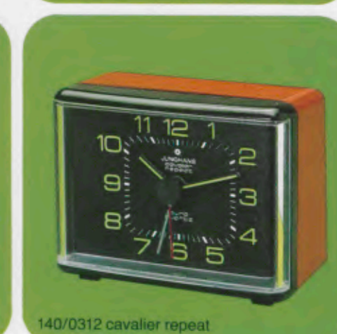
140/0312 cavalier repeat