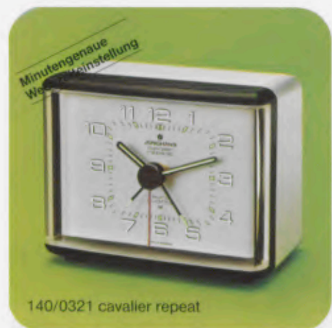
140/0321 cavalier repeat