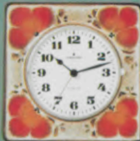
382/2010 Quartz-Küchenuhr mit Pendel. Gehäuse Edelkeramik. Sekundengenau. Quartzwerk. Laufzeit mit einer Batterie ca. 3 Jahre. DM 148,-*