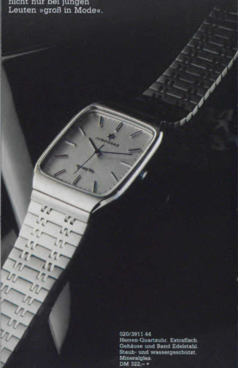
020/3911 44 Herren-Quartzuhr. Extraflach. Gehäuse und Band Edelstahl. Staub- und wassergeschützt. Mineralglas. DM 322,- *

S portlichkeit – in attraktiven Edelstahl-Gehäusen verpackt – verschenkt sich gut. Markante oder flache sportliche Modelle mit vielen Funktionen sind nicht nur bei jungen Leuten »groß in Mode«.