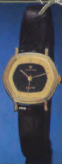
017/5011 Damen-Quartzuhr. Extraflach. Gehäuse mit Gelbgoldauflage. 18 Karat, hartvergoldet. Staub- und wassergeschützt. Reptillederarmband. DM 212.- *