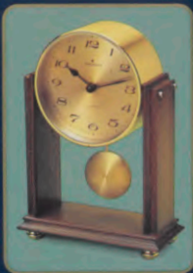
385/3005 Quartz-Stiluhr mit Pendel für die behagliche Atmosphäre. Gehäuse Nußbaum und Messing, diamantiert. Sekundengenaues Quartzwerk. Laufzeit mit einer Batterie ca. 3 Jahre. DM 299,- *

G anz individuelle Geschenke sind stilvolle und repräsentative Tischuhren. Sie schaffen Atmosphäre oder bringen ein Stück »große weite Welt« in Büro und Wohnzimmer. Und sie gehen immer sekundengenaу.