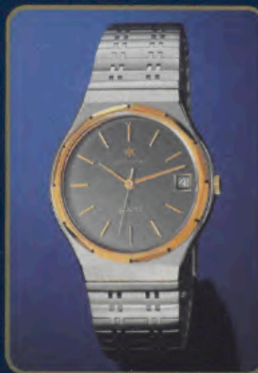
020/4923 44 Herren-Quartzuhr. Extraflach. Gehäuse und Band Edelstahl. Lunette mit Gelbgoldauflage. 18 Karat, hartvergoldet. Wasserdicht DIN 8310/6 bar (5 atü). Mineralglas. Datum mit Schnellkorrektur. Zeitzone-Schnelleinstellung. Leuchtzeichen. DM 329,- *