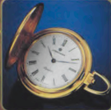
012/5909 Savonette Quartz-Taschenuhr. Gelbgoldauflage. 18 Karat, hartvergoldet. DM 290.- *