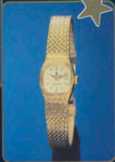
015/5963.44 Damen-Quartzuhr. Extraflach. Dekoriertes Gehäuse und Milanaisearmband mit Gelbgoldauflage. 18 Karat, hartvergoldet. Staub- und wassergeschützt. Mineralglas. DM 360,-*