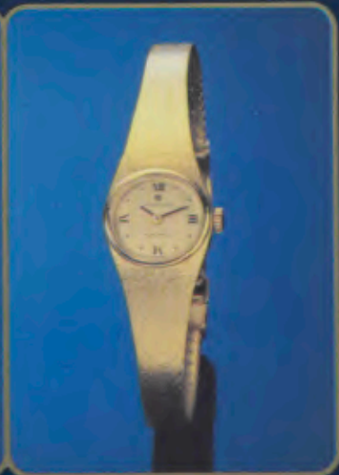
015/5983.44 Damen-Quartzuhr. Extraflach. Gehäuse und Milanaisearmband mit Gelbgoldauflage. 18 Karat, hartvergoldet. Staub- und wassergeschützt. Mineralglas. DM 340,-*