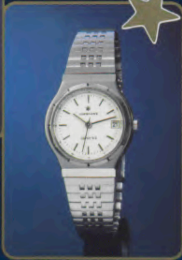
017/4030 44 Damen-Quartzuhr. Extraflach. Gehäuse und Band Edelstahl. Mineralglas. Wasserdicht DIN 8310/6 bar (5 atü). Datum mit Schnellkorrektur. Zeitzone-Schnelleinstellung. DM 335,- *