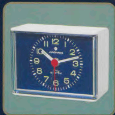
140/0105 city-quartz Moderner Quartzwecker. Leuchtzahlen und -zeiger. Elektronischer Summer. Bequeme Obenabsteltaste. Sekundengenaues Quartzwerk. Laufzeit mit einer Batterie ca. 3 Jahre. Auch in Rot, Grün und Braun lieferbar. DM 39,90*