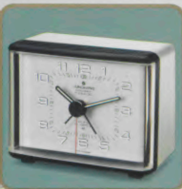
140/0321 euro-quartz M – cavalier repeat Der Quartzwecker mit den vielen Extras: minutengenaue Weckzeiteinstellung. »cavalier« Wecksystem: die Signalintervalle verkürzen sich bis zum Sekundenrhythmus. Repetition (Weckwiederholung im 4-Minutentakt). Elektronischer Summer. Leuchtpunkte und -zeiger. Beleuchtung. Bequeme Obenabsteltaste. Diamantiertes Zifferblatt. Sekundengenaues Quartzwerk. Laufzeit mit einer Batterie ca. 3 Jahre. Auch in Rot lieferbar. DM 64,-*