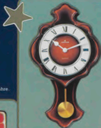
362/1106 Quartz-Küchenuhr. Gehäuse in Edelkeramik mit dekorativem, handgemalten Blumendekor. Sekundengenau. Quartzwerk. Laufzeit mit einer Batterie ca. 4 Jahre. DM 76,-*