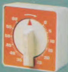
130/2212 Kurzzeitmesser. Stufenlos und genau einstellbar bis 60 Minuten. Lautes, angenehmes Glockensignal. Zum Hängen, Stellen und Legen! Auch in Weiß, Grün und Rot lieferbar. DM 21,50*

F rische Farben und dekorative Formen bringen Freude in's Heim. Deshalb ist eine JUNGHANS Quartzuhr für die Küche, das Kamin- oder Eßzimmer immer eine reizvolle Überraschung.