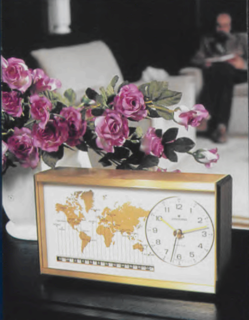
364/3033 Sekundengenaue Quartz-Weltzeituhr mit Angabe der wichtigsten Städte jeder Zeitzone. Ein Stück »große-weite-Welt« für's Zuhause, für das Büro und ein wertvolles Geschenk. Massives Messing-Gehäuse, geschliffen und diamantiert. Sekundengenaues Quartzwerk. Laufzeit mit einer Batterie ca. 4 Jahre. DM 490,- *