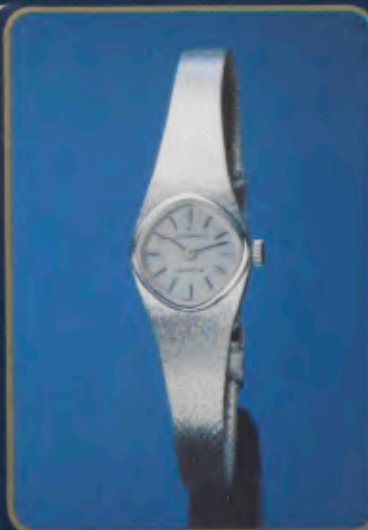
015/2985.44 Damen-Quartzuhr. Extraflach. Gehäuse und Milanaisearmband mit Weißgoldauflage. 18 Karat, hartvergoldet. Staub- und wassergeschützt. Mineralglas. DM 340,-*