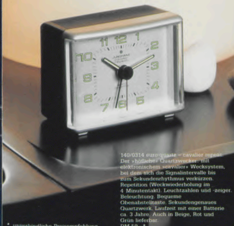
140/0314 euro-quartz – cavalier repeat. Der »höfliche« Quartzwecker: mit elektronischem »cavalier« Wecksystem, bei dem sich die Signalintervalle bis zum Sekundenrhythmus verkürzen. Repetition (Weckwiederholung im 4 Minutentakt). Leuchtzahlen und -zeiger. Beleuchtung. Bequeme Obenabsteltaste. Sekundengenaues Quartzwerk. Laufzeit mit einer Batterie ca. 3 Jahre. Auch in Beige, Rot und Grün lieferbar. DM 59,-*