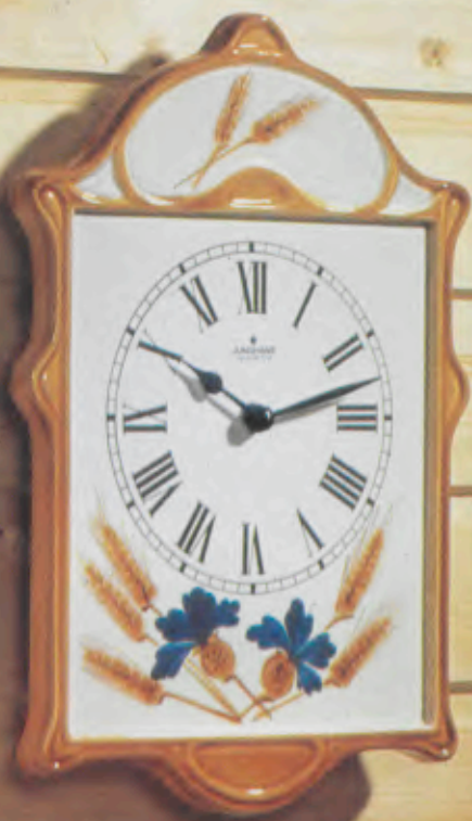
362/1171 Quartz-Küchenuhr. Gehäuse Edelkeramik, handgemalt. Original Schramberger Majolika. Sekundengenau. Quartzwerk. Laufzeit mit einer Batterie ca. 4 Jahre. DM 118,-*

F rische Farben und dekorative Formen bringen Freude in's Heim. Deshalb ist eine JUNGHANS Quartzuhr für die Küche, das Kamin- oder Eßzimmer immer eine reizvolle Überraschung.