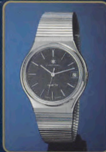
020/4914 44 Herren-Quartzuhr. Extraflach. Gehäuse und Band Edelstahl. Wasserdicht DIN 8310/6 bar (5 atü). Mineralglas. Datum mit Schnellkorrektur. Zeitzone-Schnelleinstellung. Leuchtzeichen. DM 302,- *