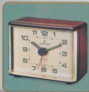
140/0303 euro-quartz Moderner Quartzwecker. Leuchtzahlen und -zeiger. Beleuchtung. Elektronischer Summer. Bequeme Obenabsteltaste. Sekundengenaues Quartzwerk. Laufzeit mit einer Batterie ca. 3 Jahre. Auch in Rot, Weiß und Schwarz lieferbar. DM 54,-*