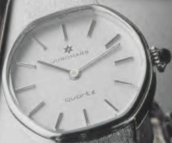
015/2010.44 Damen-Quartzuhr. Extraflach. Gehäuse und Milanaisearmband mit Weißgoldauflage. 18 Karat, hartvergoldet. Staub- und wassergeschützt. Cabouchon-Krone DM 319,-*

Uhren sind wunderbare Geschenke. Geschenke, die man immer und ganz nah bei sich trägt. Geschenke, die immer an den Schenkenden erinnern.