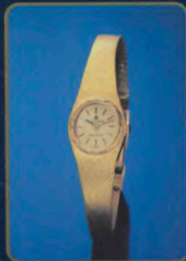
015/5966.44 Damen-Quartzuhr. Extraflach. Gehäuse und Geflecht-Band mit Gelbgoldauflage. 18 Karat, hartvergoldet. Staub- und wassergeschützt. Mineralglas. DM 370,-*