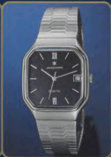
020/4942 44 Herren-Quartzuhr. Extraflach. Gehäuse und Band Edelstahl. Staub- und wassergeschützt. Mineralglas. Datum mit Schnellkorrektur. Zeitzone-Schnelleinstellung. Leuchtzeichen. DM 392,- *