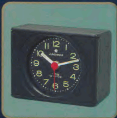
140/0202 city-quartz Moderner Quartzwecker. Leuchtzahlen und -zeiger. Beleuchtung. Elektronischer Summer. Bequeme Obenabsteltaste. Sekundengenaues Quartzwerk. Laufzeit mit einer Batterie ca. 3 Jahre. Auch in Rot, Beige und Grün lieferbar. DM 49,-*

G eschenke, die nicht nur an Termine erinnern. Reizvolle Präsente, die jeden Morgen sanft, sicher und zuverlässig wecken – den Tag schöner beginnen lassen.