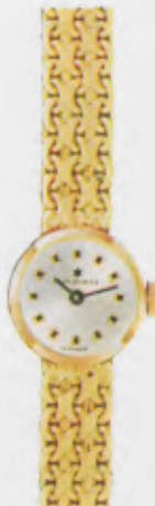
72/9537 G - Sb - So 20,2 g