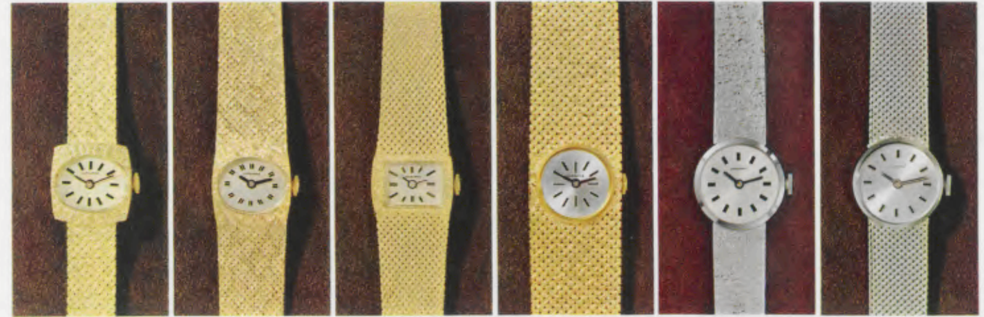
77/9501 G - Gb 26,4 g