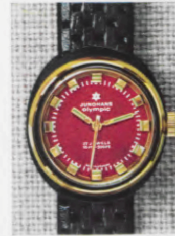
66/0250 Lp - Wd - 10 atü