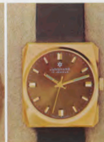
63/5373 P - So - Lp - Wd