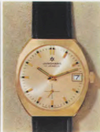
62/7305 P - ch - So - Lp - Wd