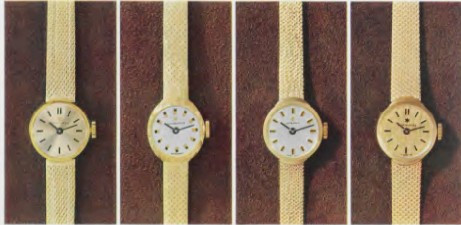
72/9533 G - ch - So 14,5 g