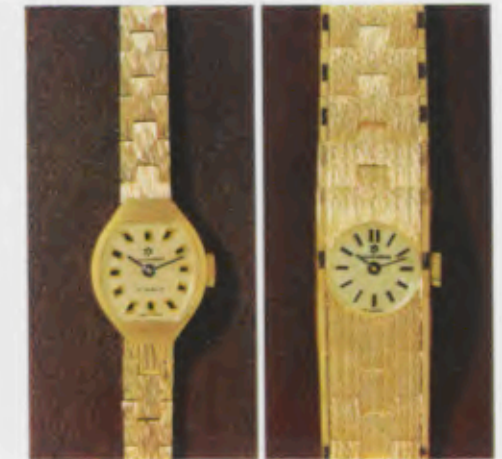
72/7012 P - Gb 72/7052 P - Sb