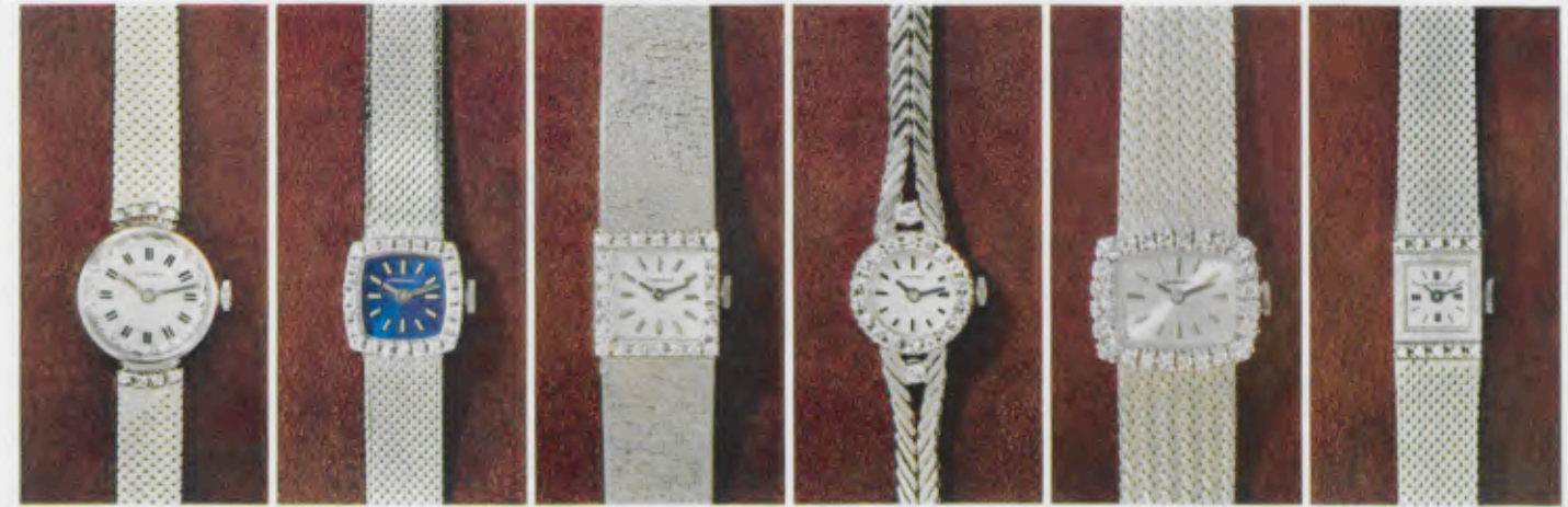
77/9952 Gw - Sb - 16,6 g 8 Brill. = 0,11 ct.