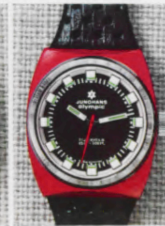
66/0262 Lp - Wd - 10 atü