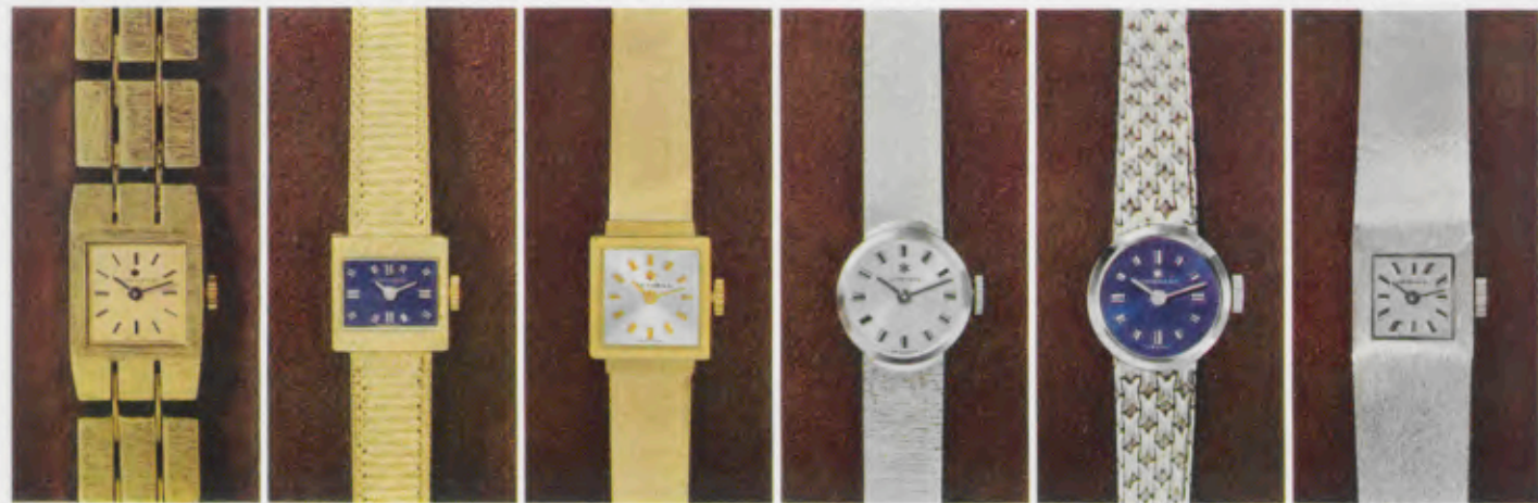
72/9668 G - Gb 38,4 g