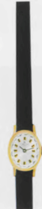
72/6005 P - Sb - So