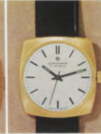
63/5352 P - Sb - Lp - Wd