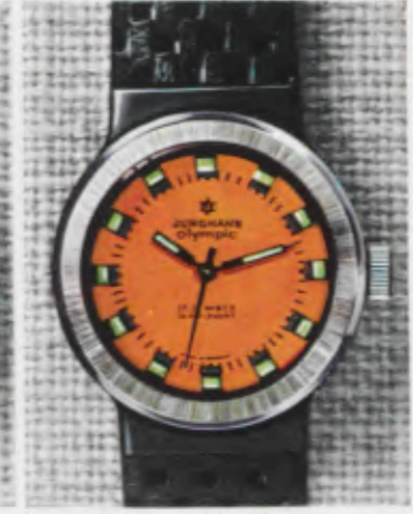
66/0271 Lp - Wd - 10 atü Wechselringe - changing rings anneaux de change