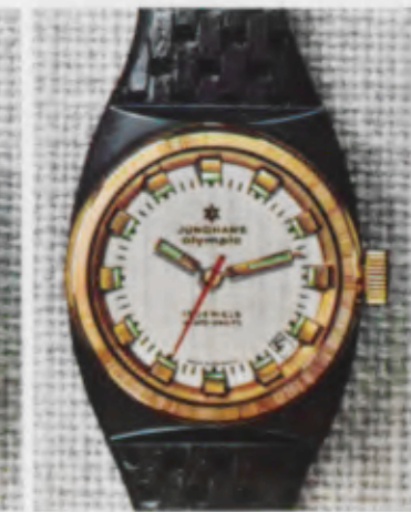
66/1263 Sb - Lp - Wd - 10 atü

G = Gold 585/000 C = Chrom P = Plaqué Es = Edelstahl Gb = Goldblatt Sb = Silberblatt So = Sonnenschliiff ch = champagnerfarb, Zifferblatt Lz = Leuchtzahlen Lp = Leuchtpunkte Wd = Wasserdicht