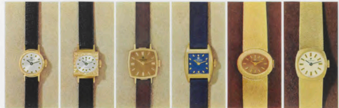
72/8006 G - Sb - So 72/8226 G - Sb - So 72/8227 G 72/8228 G 72/9341 G - So 30,6 g 72/9342 G - Gb 31,9 g

Alle Uhren sind in natürlicher Größe abgebildet All watches shown in actual size Toutes ces montres sont représentées en grandeur naturelle