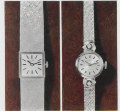
77/9913 Gw - Sb 30,2 g