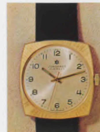
63/5353 P - ch - So - Lp - Wd