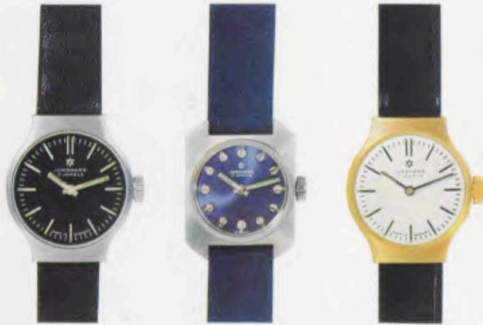
68/0530 C - Lp - Wd 68/3233 Es - So - Lp - Wd 68/5531 P - Sb - Lp - Wd