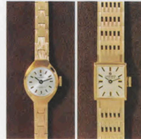
72/5722 P - Sb - So 72/5767 P - ch