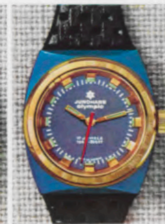
66/0261 Lp - Wd - 10 atü