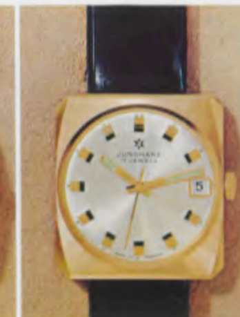
63/7372 P - Sb - So - Lp - Wd

Alle Uhren sind in natürlicher Größe abgebildet All watches shown in actual size Toutes ces montres sont représentées en grandeur naturelle