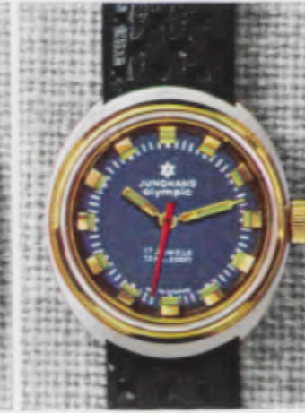
66/0251 Lp - Wd - 10 atü