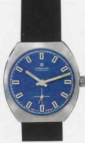
62/0302 C - Lp - Wd