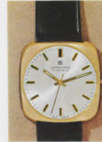
63/5253 P - Sb - So - Lp - Wd