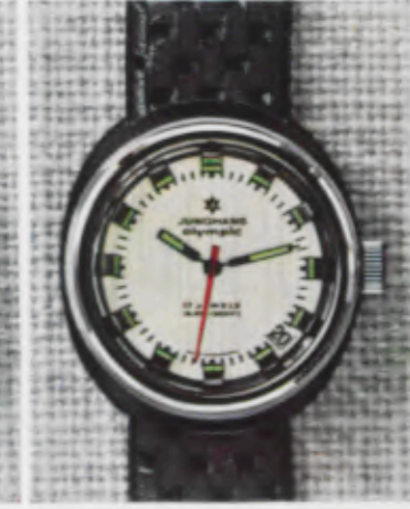
66/1253 Sb - Lp - Wd - 10 atü