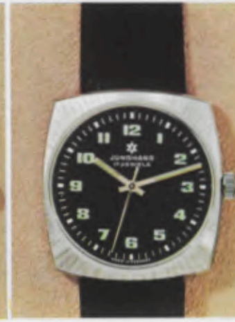
63/0351 C - Lz - Wd