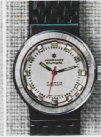
66/0270 Sb - Lp - Wd - 10 atü Wechselringe - changing rings anneaux de change