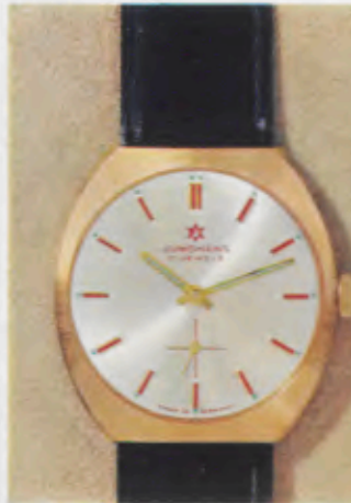
62/5303 P - Sb - So - Lp - Wd