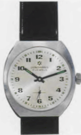
62/0301 C - Sb - So - Lp - Wd