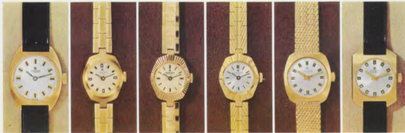
68/5535 P - Sb - Lp - Wd 68/5755 P - Gb 68/5756 P - Gb 68/5757 P - Sb - So 68/5784 P - Sb - Lp - Wd 68/6232 P - Sb - So - Lp - Wd