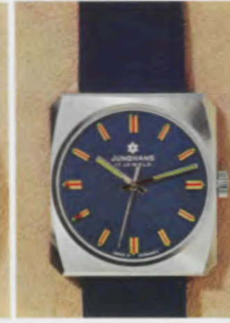
63/0371 C - Lp - Wd