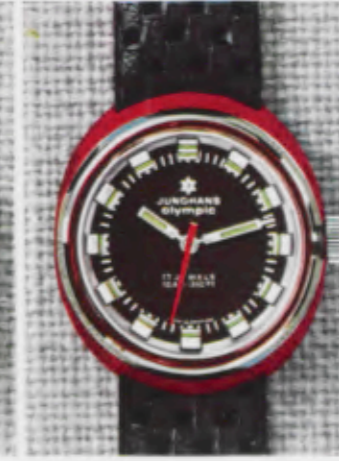
66/0252 Lp - Wd - 10 atü