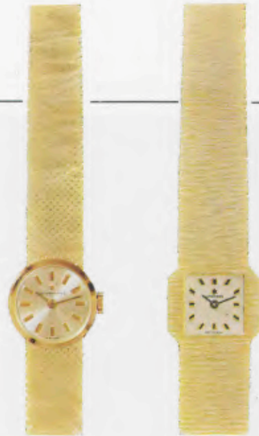
72/9413 G - ch - So 24,7 g