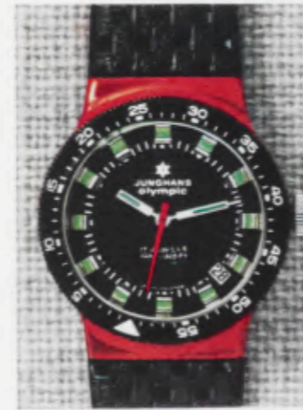
66/1272 Lp - Wd - 10 atü Wechselringe - changing rings anneaux de change

Gehäuse Fiberglas - case fibre glass - boîte fibre de verre