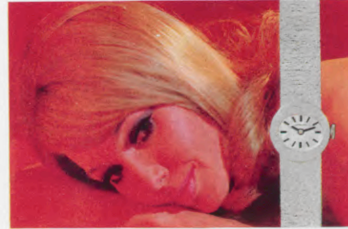
77/9912 Gw - Sb 28,5 g