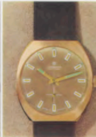
62/5304 P - So - Lp - Wd