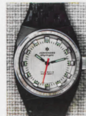
66/0260 Sb - Lp - Wd - 10 atü