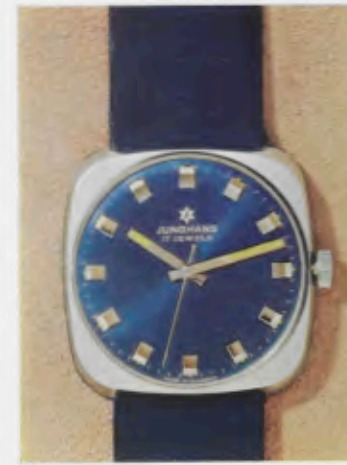
63/0252 C - So - Lp - Wd