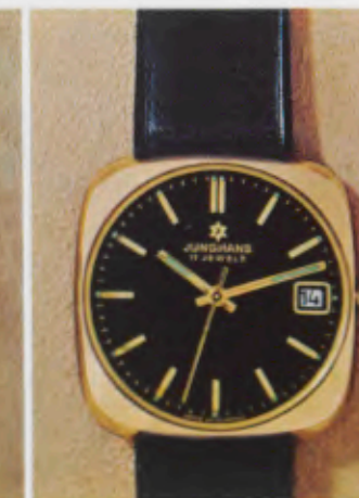
63/7254 P - Lp - Wd