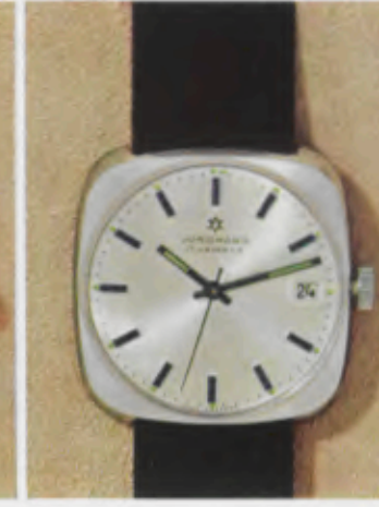
63/1251 C - Sb - So - Lp - Wd