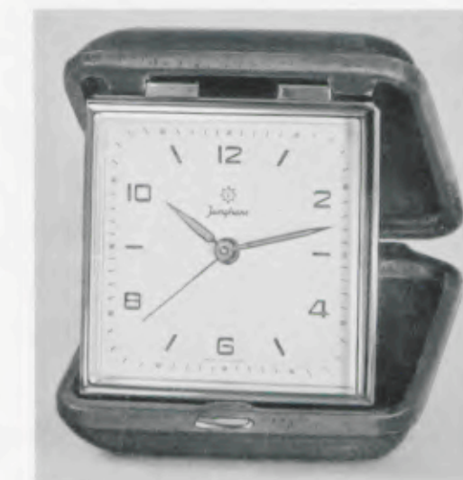
7,1 x 7,3 cm = 2 3/4 x 2 7/8 inches

Marco dorado, esfera plateada con cifras y agujas luminosas de radiación inofensiva, cristal bombeado