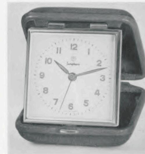
7,1 x 7,3 cm = 2 3/4 x 2 7/8 inches

Máquina despertador 30 horas, shockproof, campana en el respaldo, impermeable al polvo, muelle real irrompible