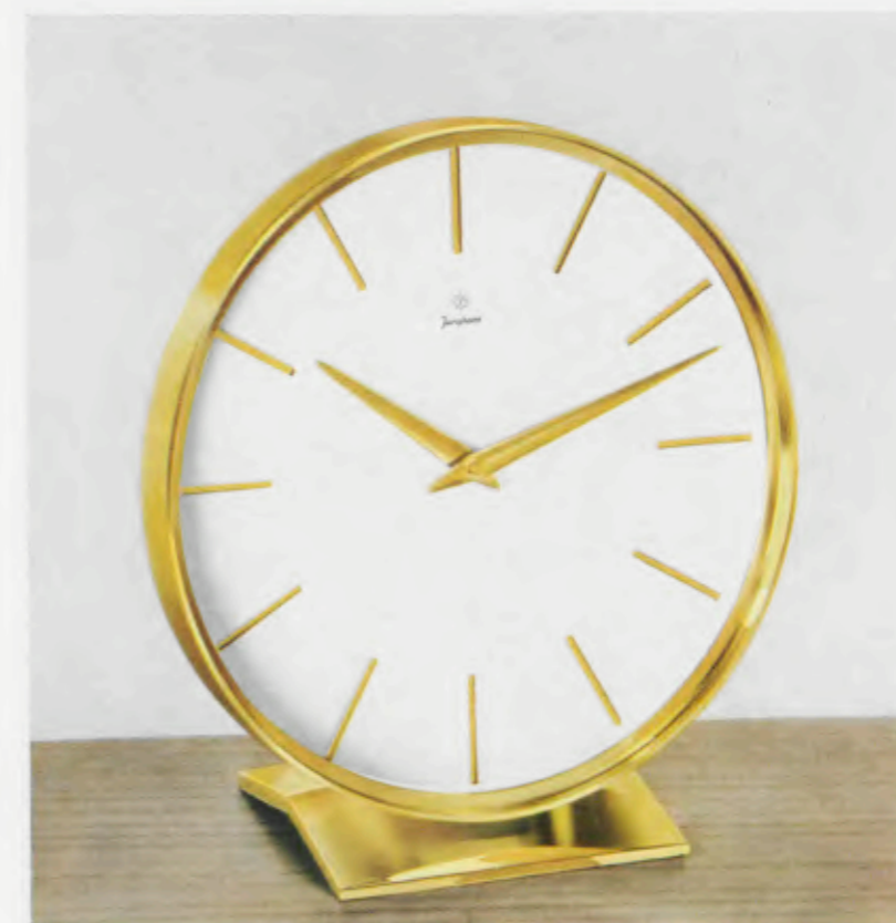
16,5 x 15,5 cm = 6 1/2 x 6 1/4 inches