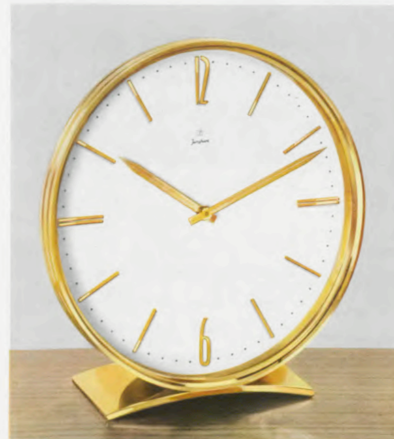
18,2 x 17,5 cm = 7 1/16 x 6 3/4 inches