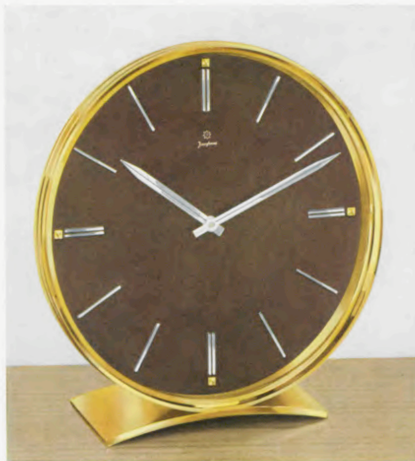
18,5 x 17,5 cm = 7 1/4 x 6 3/4 inches

Máquina 8 días cuerda á áncora, plana, 4 rubís