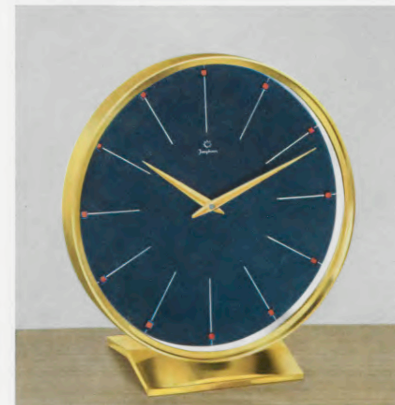
16,5 x 15,5 cm = 6 1/2 x 6 1/4 inches

Máquina 8 días cuerda á áncora con 4 rubis