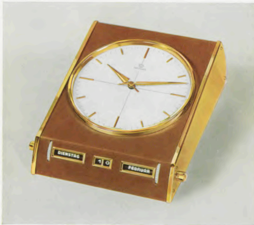
18 x 14 cm – 7 1/4 x 5 1/2 inches

Mit Kalender – With calendar – Avec calendrier – Con calendario