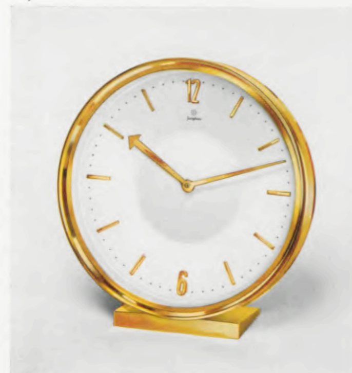
13,5 x 12,5 cm = 5 1/4 x 5 inches

Flaches 8 Tage Ankergehwerk Nr. 257, 4 Steine Flat 8 day lever time movement, 4 jewels Mouvement 8 jours simple à ancre, plat, 4 rubis Máquina 8 días cuerda á áncora, plana, 4 rubis