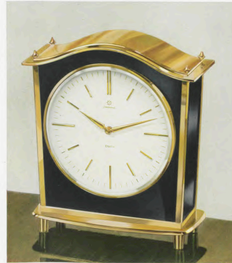
20 x 18 cm – 7 7/8 x 7 1/4 inches

Desk clocks · Pendulettes de bureau · Relojes para escritorio