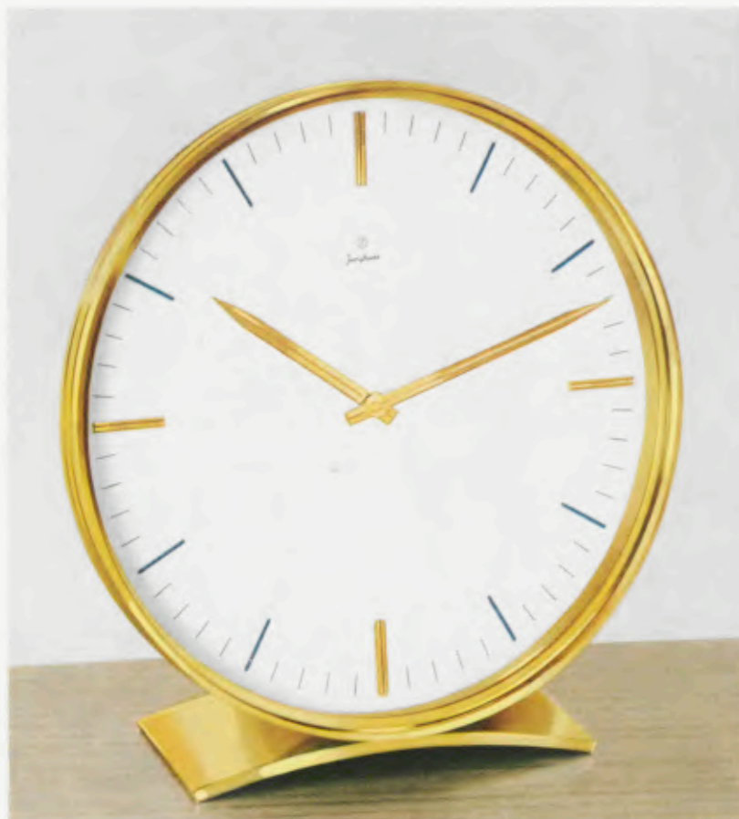
18,5 x 17,5 cm = 7 1/4 x 6 3/4 inches