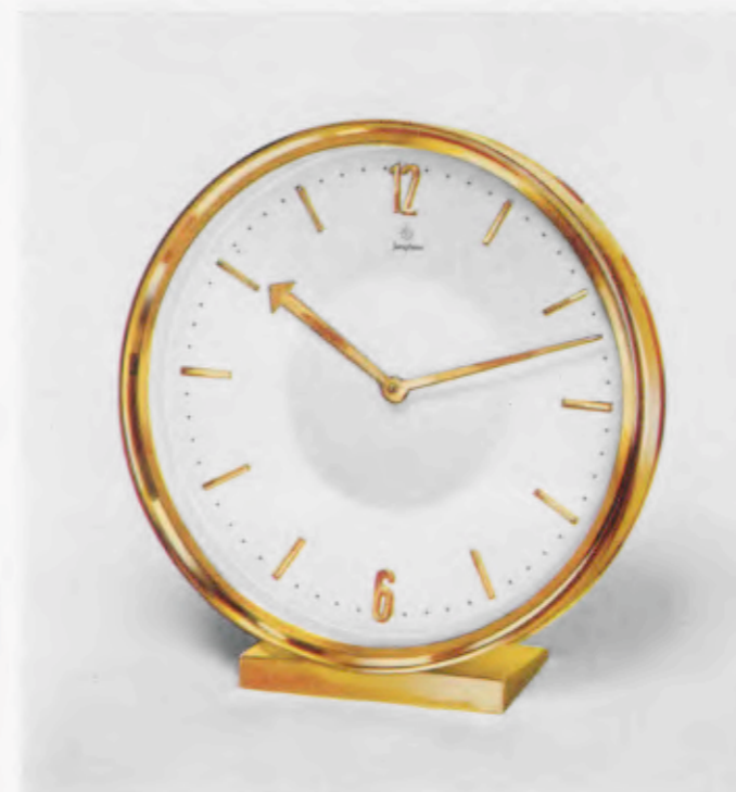
13,5 x 12,5 cm = 5 1/4 x 5 inches

Desk clocks · Pendulettes de bureau · Relojes para escritorio