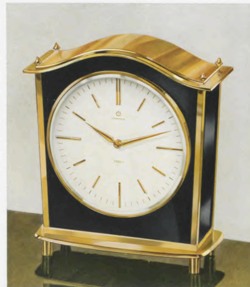
20x18 cm = 7 3 / 4 x 7 1 / 16 inches

Desk clocks · Pendulettes de bureau · Relojes para escritorio