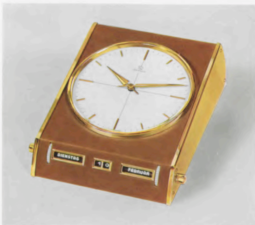
18 x 14 cm = 7 1 / 4 x 5 1 / 2 inches

Mit Kalender With calendar Avec calendrier Con calendario