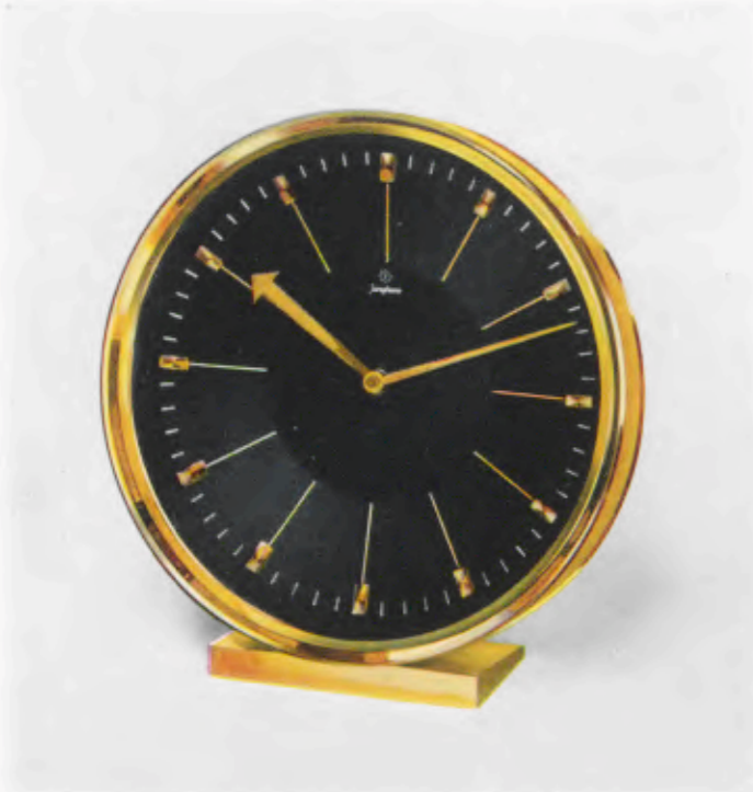
13,5 x 12,5 cm = 5 1/4 x 5 inches

Desk clocks · Pendulettes de bureau Relojes para escritorio