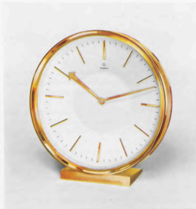
13,5 x 12,5 cm = 5 1/4 x 5 inches

Máquina 8 días cuerda á áncora, plana, 4 rubis