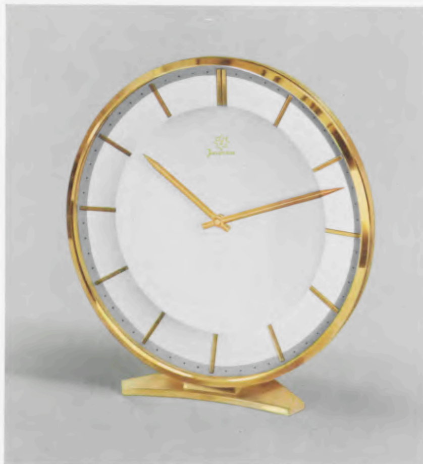
18,2 x 17,5 cm = 7 1 / 16 x 6 3 / 4 inches

Desk clocks · Pendulettes de bureau Relojes para escritorio