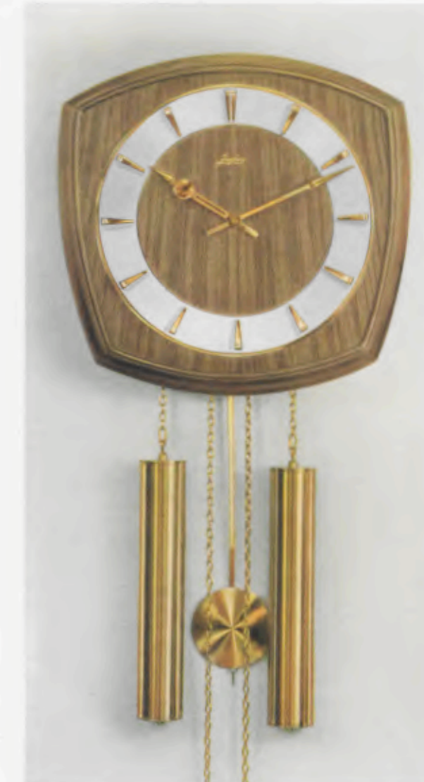
30 x 31 cm = 11 3 / 4 x 12 3 / 4 inches

8 Tage Schlagwerk Nr. 248 auf vollklingenden Membran-Gong „Bim Bam“, 3 Stäbe (DBP. und Auslandspatente) – 8 day strike on membrane-gong “Bim Bam”, 3 rods (German and foreign patents) – Mouvement 8 jours avec sonnerie sur gong à membrane «Bim Bam», 3 tiges (Brevet allemand et brevets étrangers) – Máquina 8 días con sonería sobre gong membrana «Bim Bam», 3 varillas