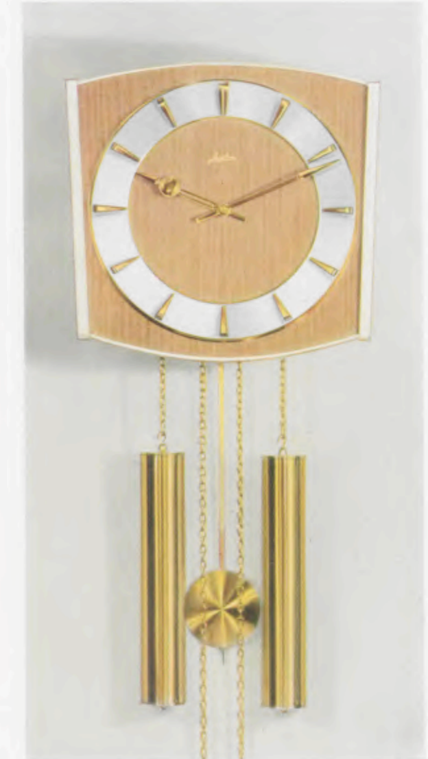
28 x 27 cm = 11 x 10 1/2 inches

8 Tage Schlagwerk Nr. 248 auf vollklingenden Membran-Gong „Bim Bam“, 3 Stäbe (DBP. und Auslandspatente) – 8 day strike on membrane-gong “Bim Bam”, 3 rods (German and foreign patents) – Mouvement 8 jours avec sonnerie sur gong à membrane «Bim Bam», 3 tiges (Brevet allemand et brevets étrangers) – Máquina 8 días con sonería sobre gong membrana »Bim Bam», 3 varillas