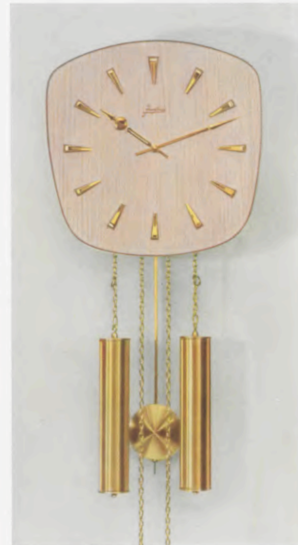
26 x 28 cm = 11 x 11 inches

Smart wall clocks for the modern home Pendules art nouveau pour intérieurs modernes Relojes de pared especiales para la casa moderna