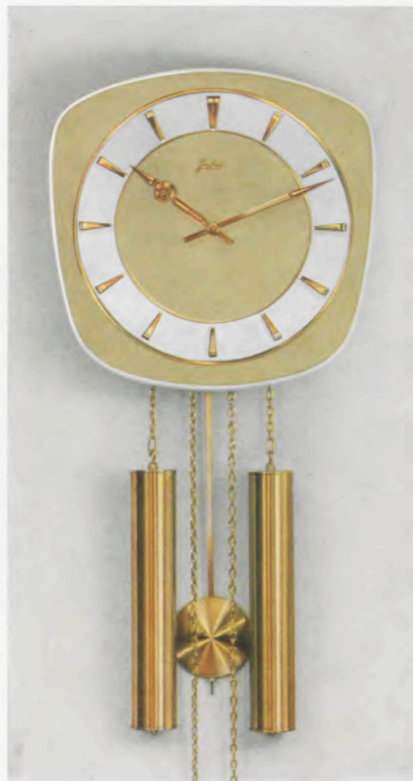
28 x 28 cm = 11 x 11 inches

8 Tage Schlagwerk Nr. 248 auf vollklingenden Membran-Gong „Bim Bam“, 3 Stäbe (DBP. und Auslandspatente) – 8 day strike on membrane-gong “Bim Bam”, 3 rods (German and foreign patents) – Mouvement 8 jours avec sonnerie sur gong à membrane «Bim Bam», 3 tiges (Brevet allemand et brevets étrangers) – Máquina 8 días con sonería sobre gong membrana «Bim Bam», 3 varillas