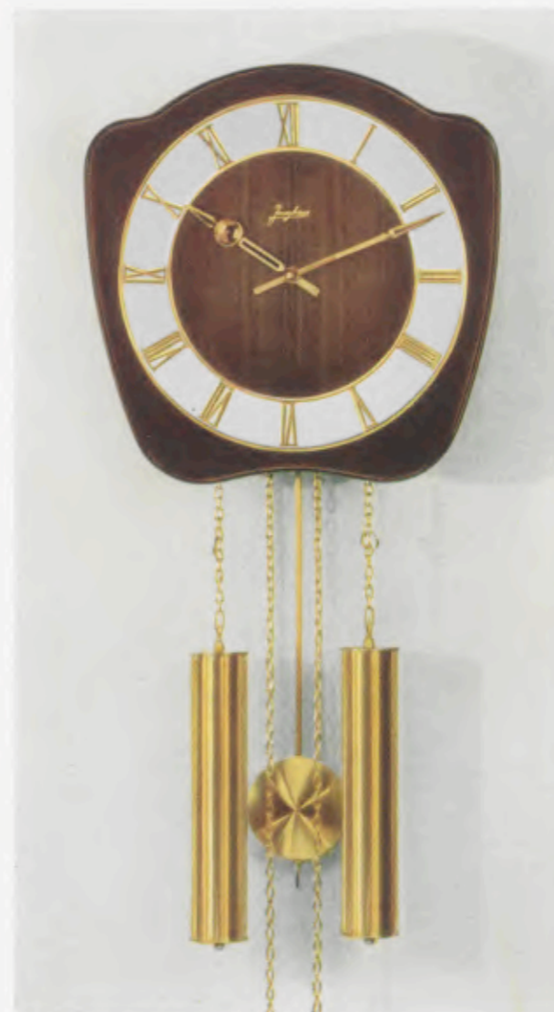
29 x 29 cm = 11 3/4 x 11 3/4 inches

Smart wall clocks for the modern home Pendules art nouveau pour intérieurs modernes Relojes de pared especiales para la casa moderna