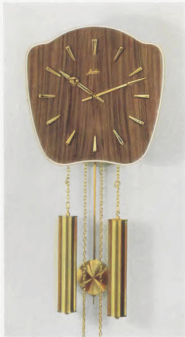
29 x 29 cm = 11 7 / 16 x 11 7 / 16 inches

Smart wall clocks for the modern home Pendules art nouveau pour intérieurs modernes Relojes de pared especiales para la casa moderna