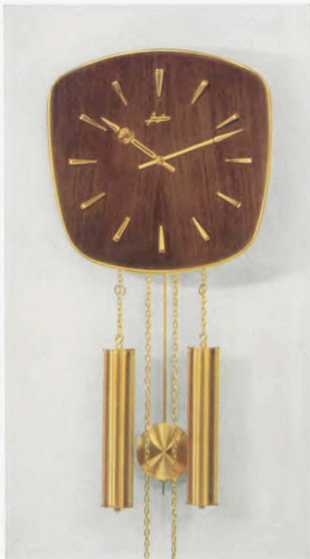
28 x 28 cm = 11 x 11 inches

Smart wall clocks for the modern home Pendules art nouveau pour intérieurs modernes Relojes de pared especiales para la casa moderna