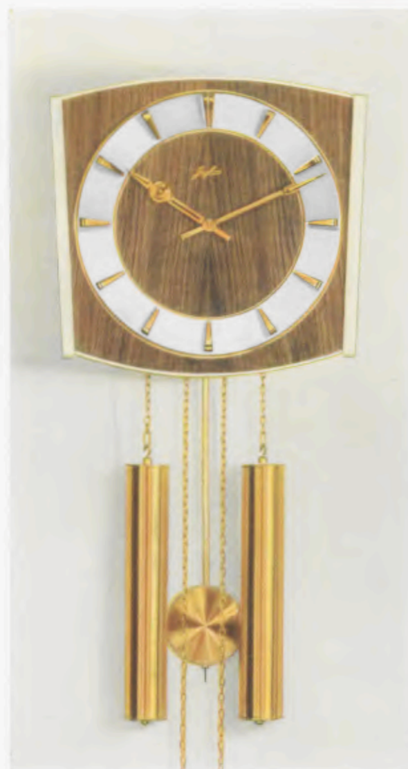
28 x 27 cm = 11 x 10 3 / 4 inches

8 Tage Schlagwerk Nr. 248 auf vollklingenden Membran-Gong „Bim Bam“, 3 Stäbe (DBP. und Auslandspatente) – 8 day strike on membrane-gong “Bim Bam”, 3 rods (German and foreign patents) – Mouvement 8 jours avec sonnerie sur gong à membrane «Bim Bam», 3 tiges (Brevet allemand et brevets étrangers) – Máquina 8 días con sonería sobre gong membrana «Bim Bam», 3 varillas