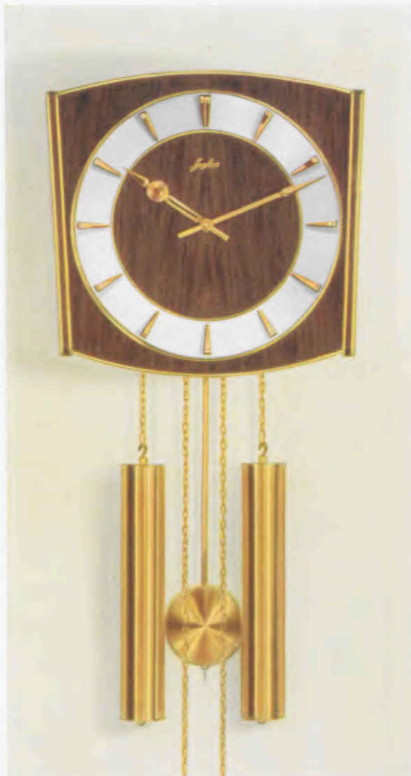
28 x 27 cm = 11 x 10 3/4 inches

8 Tage Schlagwerk Nr. 248 auf vollklingenden Membran-Gong „Bim Bam“, 3 Stäbe (DBP. und Auslandspatente) – 8 day strike on membrane-gong “Bim Bam”, 3 rods (German and foreign patents) – Mouvement 8 jours avec sonnerie sur gong à membrane «Bim Bam», 3 tiges (Brevet allemand et brevets étrangers) – Máquina 8 días con sonería sobre gong membrana «Bim Bam», 3 varillas