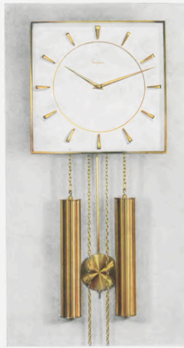
26 x 26 cm = 10 1/4 x 10 1/4 inches

Smart wall clocks for the modern home Pendules art nouveau pour intérieurs modernes Relojes de pared especiales para la casa moderna