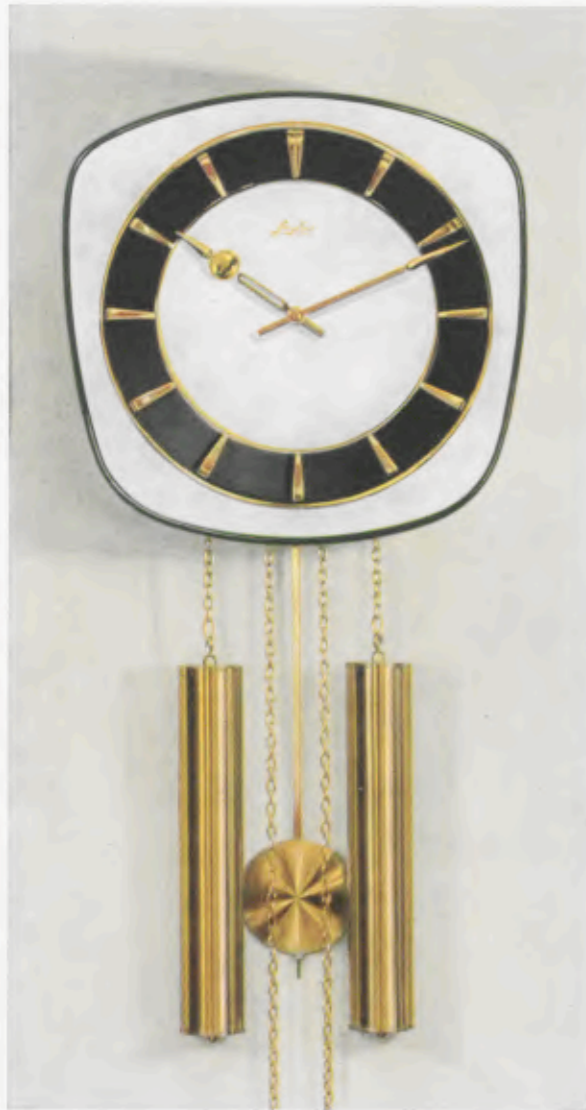
28 x 28 cm = 11 x 11 inches

Smart wall clocks for the modern home Pendules art nouveau pour intérieurs modernes Relojes de pared especiales para la casa moderna