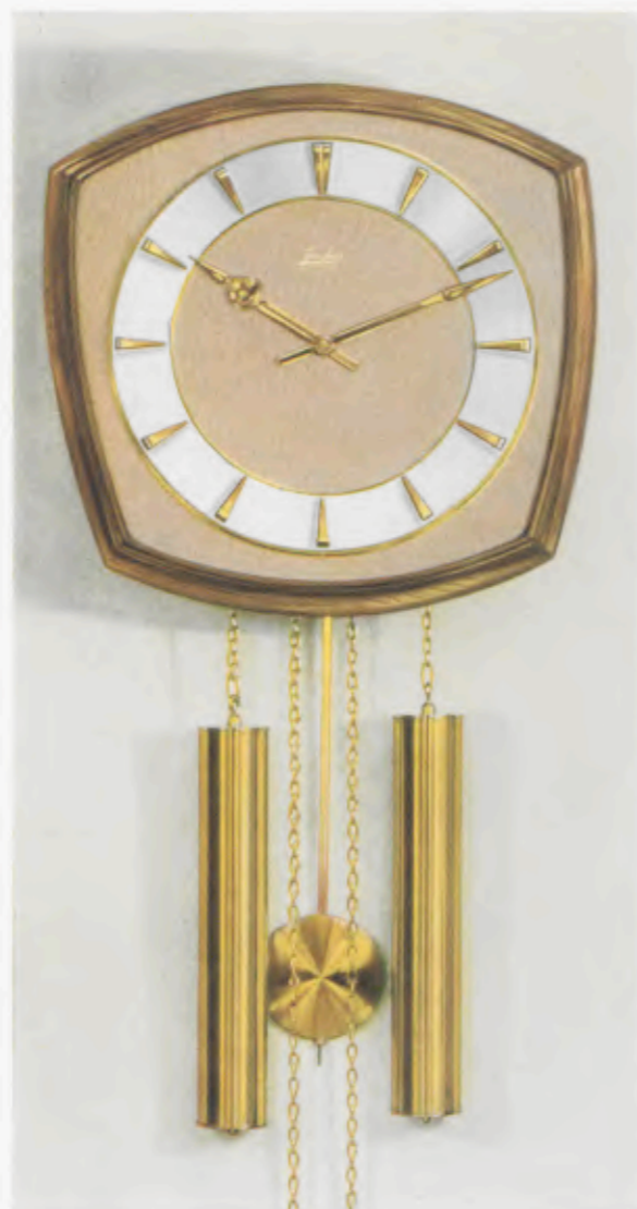
30 x 31 cm = 11 3/4 x 12 1/4 inches

8 Tage Schlagwerk Nr. 248 auf vollklingenden Membran-Gong „Bim Bam“, 3 Stäbe (DBP. und Auslandspatente) – 8 day strike on membrane-gong “Bim Bam”, 3 rods (German and foreign patents) – Mouvement 8 jours avec sonnerie sur gong à membrane «Bim Bam», 3 tiges (Brevet allemand et brevets étrangers) – Máquina 8 días con sonería sobre gong membrana «Bim Bam», 3 varillas