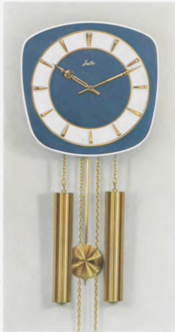
28 x 28 cm = 11 x 11 inches

Smart wall clocks for the modern home Pendules art nouveau pour intérieurs modernes Relojes de pared especiales para la casa moderna