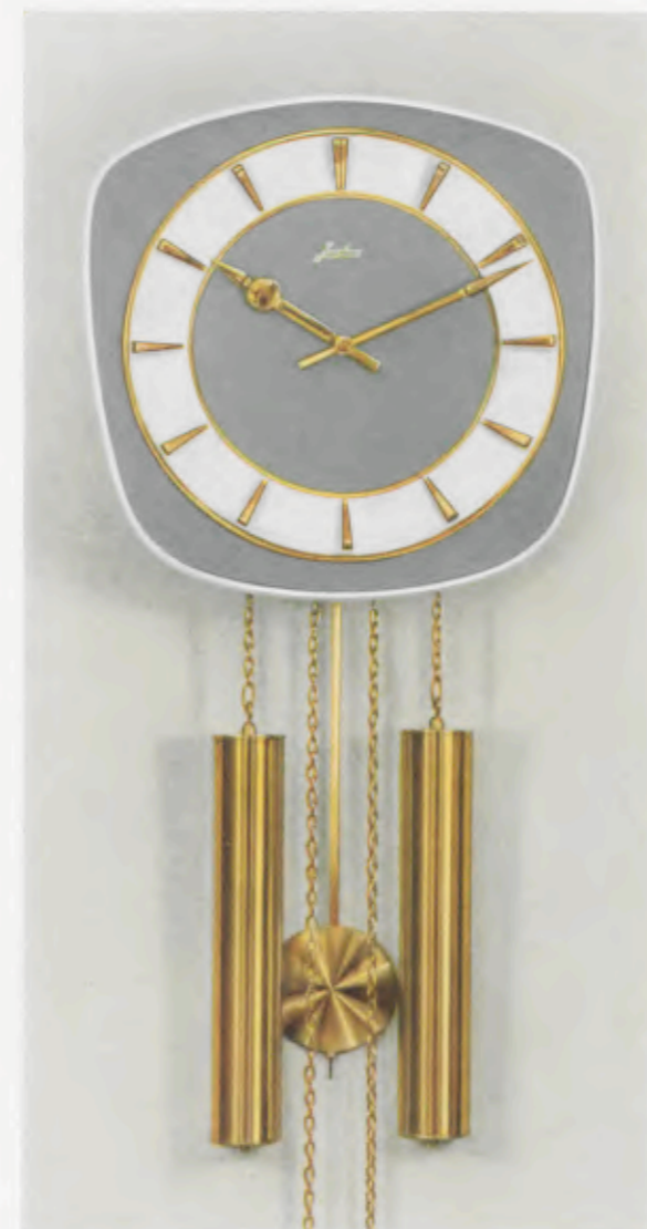
28 x 28 cm = 11 x 11 inches

Smart wall clocks for the modern home Pendules art nouveau pour intérieurs modernes Relojes de pared especiales para la casa moderna