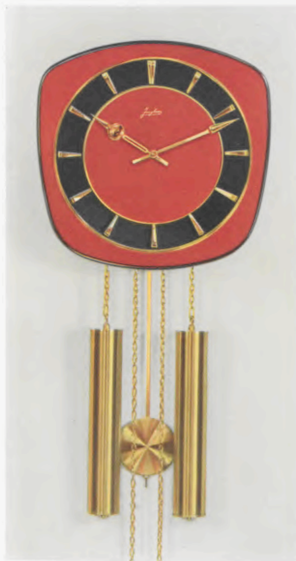
28 x 28 cm = 11 x 11 inches

8 Tage Schlagwerk Nr. 248 auf vollklingenden Membran-Gong „Bim Bam“, 3 Stäbe (DBP. und Auslandspatente) – 8 day strike on membrane-gong “Bim Bam”, 3 rods (German and foreign patents) – Mouvement 8 jours avec sonnerie sur gong à membrane «Bim Bam», 3 tiges (Brevet allemand et brevets étrangers) – Máquina 8 días con sonería sobre gong membrana »Bim Bam», 3 varillas