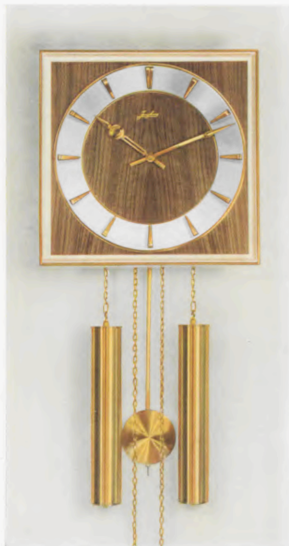
28 x 28 cm = 11 x 11 inches

Smart wall clocks for the modern home Pendules art nouveau pour intérieurs modernes Relojes de pared especiales para la casa moderna