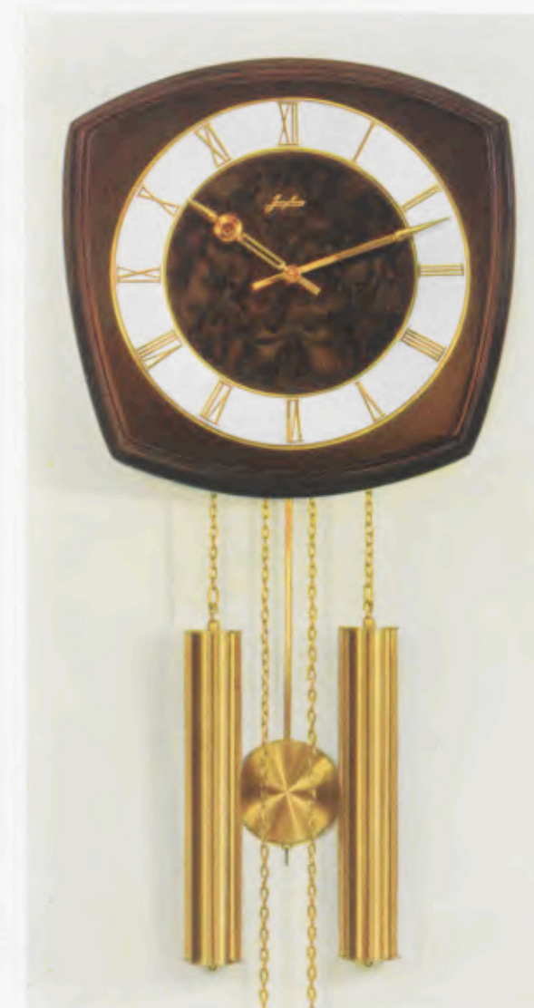
30 x 31 cm = 11 3/4 x 12 1/4 inches

8 Tage Schlagwerk Nr. 248 auf vollklingenden Membran-Gong „Bim Bam“, 3 Stäbe (DBP. und Auslandspatente) – 8 day strike on membrane-gong “Bim Bam”, 3 rods (German and foreign patents) – Mouvement 8 jours avec sonnerie sur gong à membrane «Bim Bam», 3 tiges (Brevet allemand et brevets étrangers) – Máquina 8 días con sonería sobre gong membrana «Bim Bam», 3 varillas