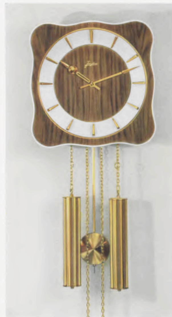
28 x 28 cm = 11 x 11 inches

Smart wall clocks for the modern home Pendules art nouveau pour intérieurs modernes Relojes de pared especiales para la casa moderna