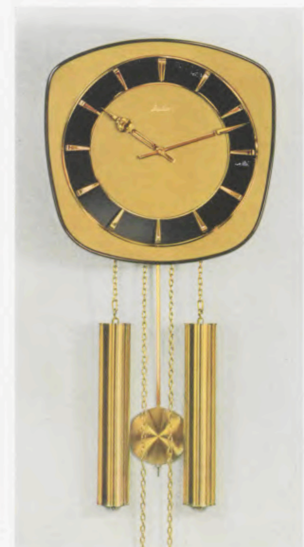
28 x 28 cm = 11 x 11 inches

8 Tage Schlagwerk Nr. 248 auf vollklingenden Membran-Gong „Bim Bam“, 3 Stäbe (DBP. und Auslandspatente) – 8 day strike on membrane-gong “Bim Bam”, 3 rods (German and foreign patents) – Mouvement 8 jours avec sonnerie sur gong à membrane «Bim Bam», 3 tiges (Brevet allemand et brevets étrangers) – Máquina 8 días con sonería sobre gong membrana «Bim Bam», 3 varillas