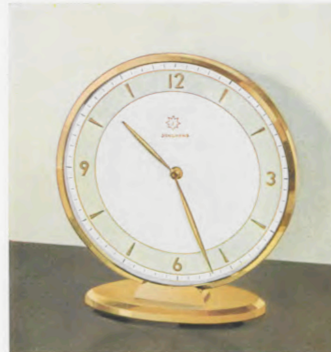
14,8 x 13 cm