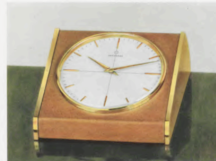
10,5 x 12,5 x 5 cm = 4 1/4 x 4 3/4 x 2 inches

Desk clocks • Pendulettes de bureau • Relojes para escritorio