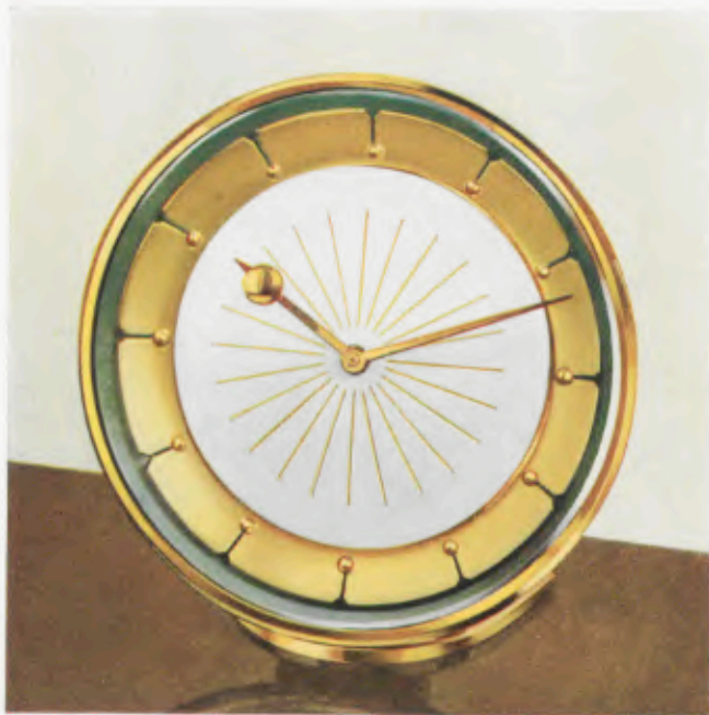
13 x 12 cm = 5 1/4 x 4 3/4 inches

Desk clocks • Pendulettes de bureau • Relojes para escritorio