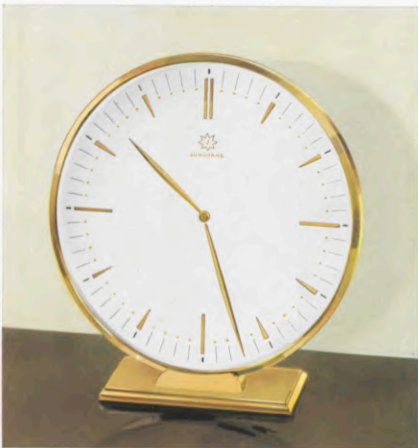
18,5 x 17 cm

Uitvoering van de kast als van 10/0201. Voorzien van Junghans Electora Batterijwerk.