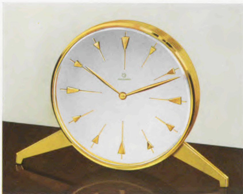
13 x 10 cm = 5 1/4 x 7 1/2 inches

Latón pulido, borde interior verdegris, cristal biselado y convexo, esfera plateada bombeada con cerco de cifras color de oro mate, puntos dorados pulidos