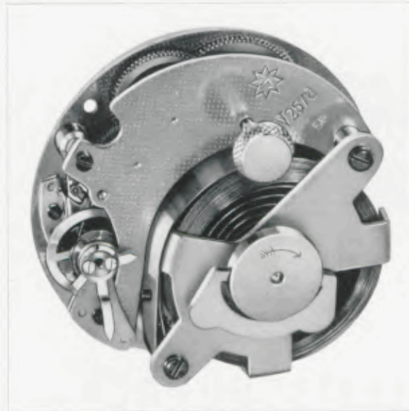
Platinen - Plates - Platines - Platinas 42 mm = 1 3 / 4 inches

Desk clocks • Pendulettes de bureau • Relojes para escritorio