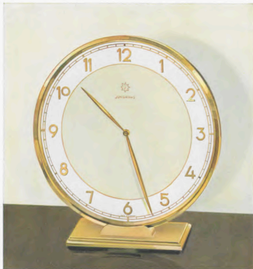
18,5 x 17 cm