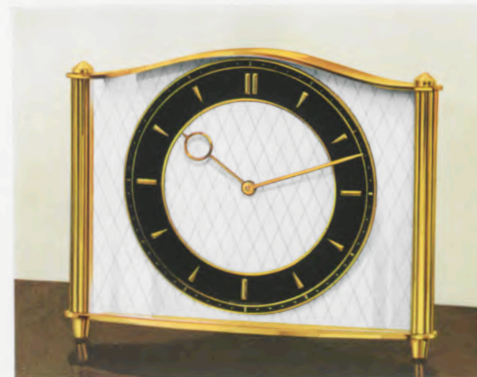
15 x 19 cm - 6 x 7 1/2 inches

Latón pulido, cerco de cifras negro y aplicado con cifras doradas pulidas aplicadas, frente blanco/mate