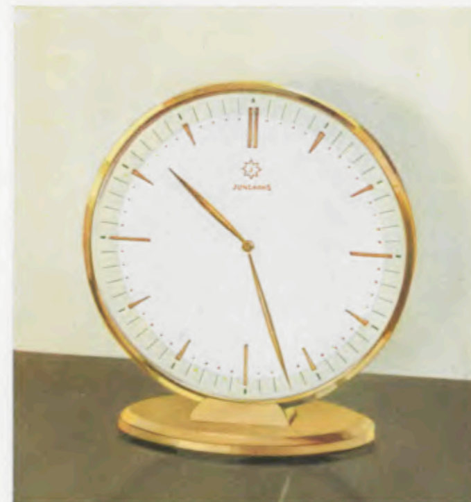
14,2 x 13 cm

Kast van gepolijst en van geslepen geelkoper, tweekleurige metalen wijzerplaat met gepolijste geelkoperen reliëfcijfers en strepen.