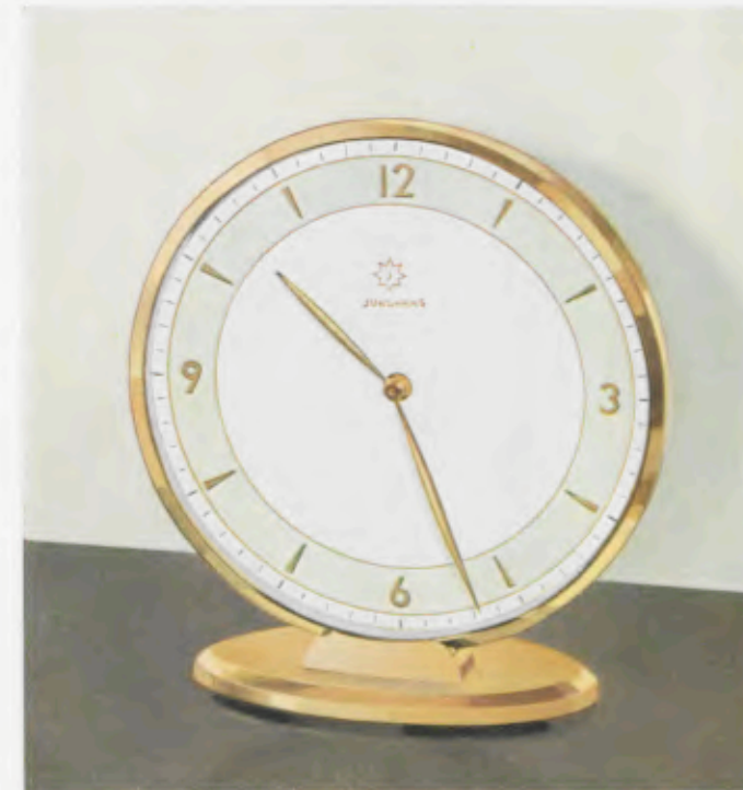
14,2 x 13 cm = 5 1 / 4 x 5 1 / 4 inches

Desk clocks • Pendulettes de bureau • Relojes para escritorio