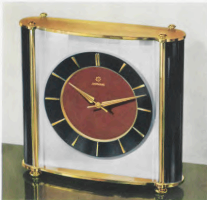
16 x 15,5 cm = 6 1/4 x 6 1/4 inches

Latón pulido y plateado, esfera plateada con cerco de cifras blanco, cifras doradas pulidas aplicadas