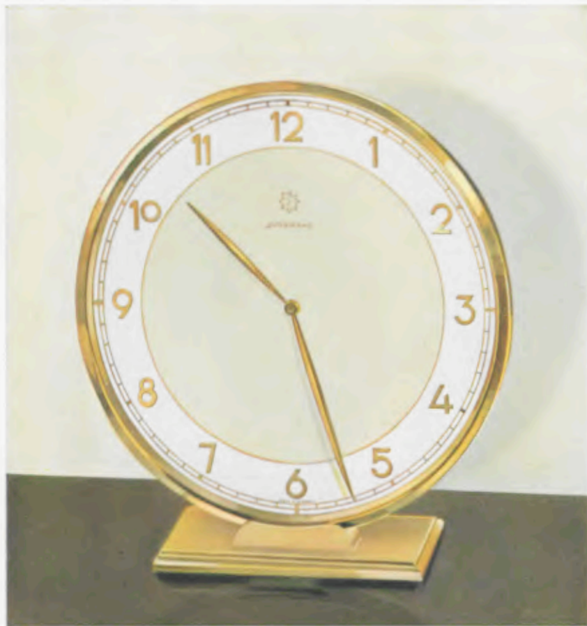
18,5 x 17 cm - 7 1/4 x 6 3/4 inches