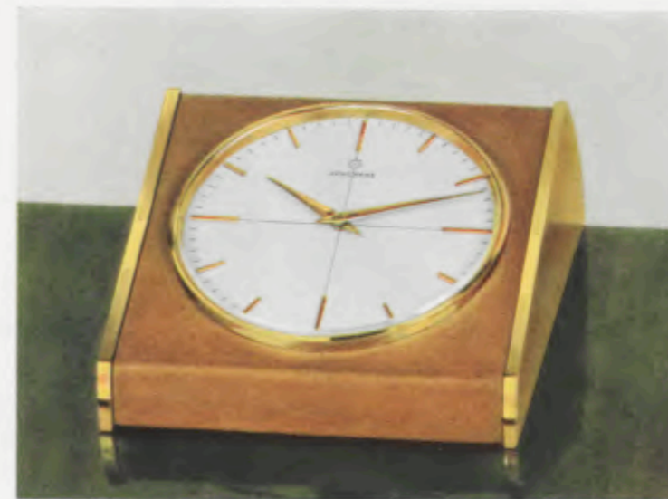
10,5 x 12,5 x 5 cm

Plat 8 dagen gaand ankerwerk No. 257, 4 stenen