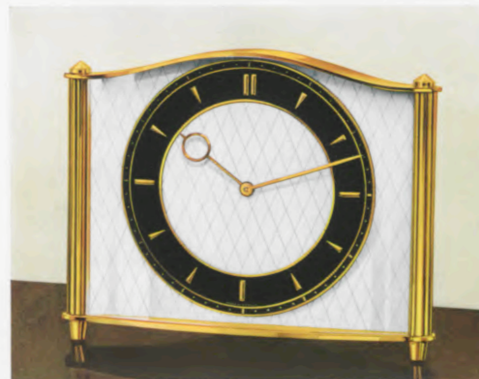
15 x 19 cm

Kast van gepolijst geelkoper, opgelegde zilverkleurige cijferrand met gepolijste geelkoperen reliëfstrepen, achtergrond gematteerd wit.