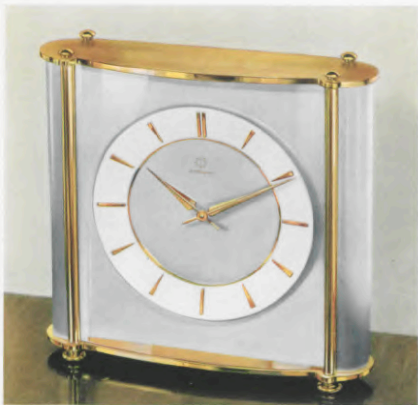
16 x 15,5 cm = 6 1/4 x 6 1/4 inches

Desk clocks • Pendulettes de bureau • Relojes para escritorio