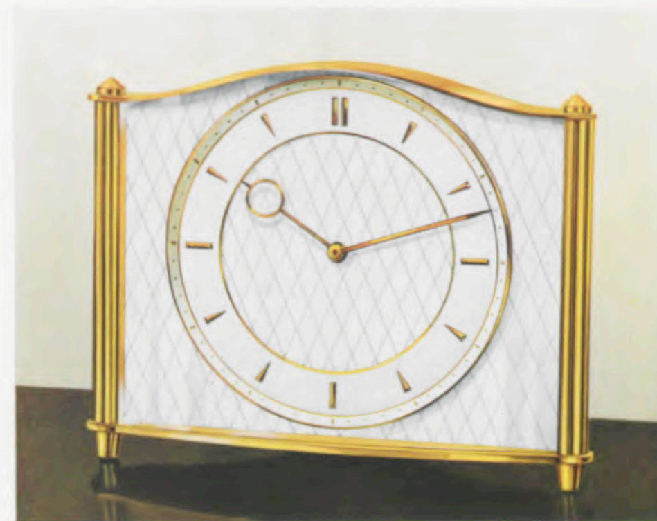
15 x 19 cm - 6 x 7 1/2 inches

Desk clocks - Pendulettes de bureau - Relojes para escritorio