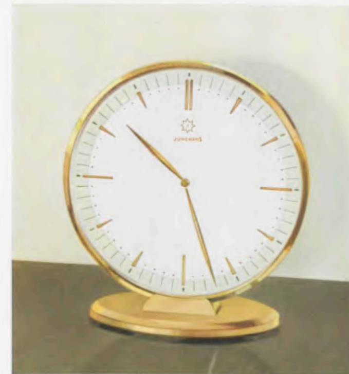
14,2 x 13 cm = 5 1 / 4 x 5 1 / 4 inches

Latón pulido, esfera de metal bicolor con cifras doradas pulidas en relieve