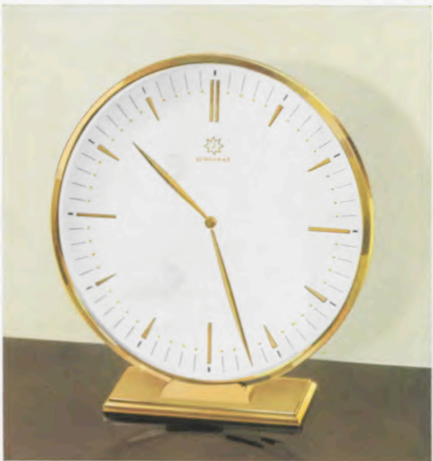
18,5 x 17 cm - 7 1/4 x 6 3/4 inches

Latón pulido, esfera de metal bicolor con cifras doradas pulidas en relieve