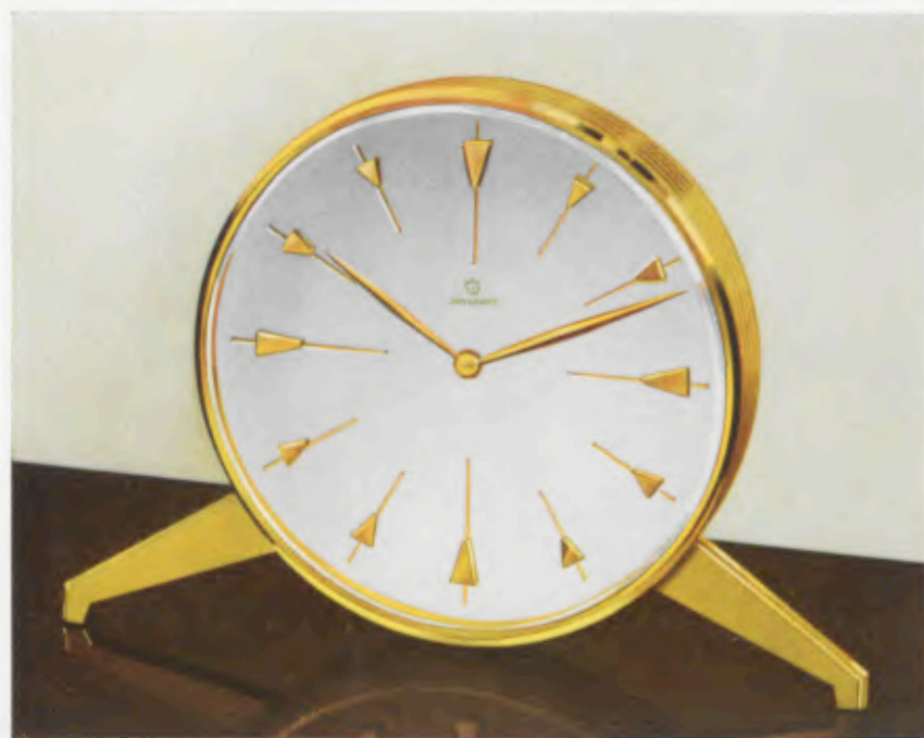
13 x 19 cm

Kast gepolijst geelkoper, binnenrand groen gepatineerd, gefacetteerd bol glas, bolle zilverkleurige wijzerplaat met gematteerde goudkleurige cijferrand, waarin gepolijste geelkoperen noppen.