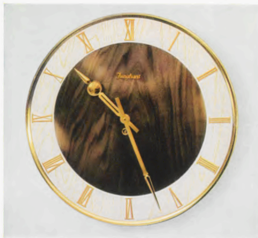
40 cm ø = 15¾ inches

Nogal mate con marco latón, cerco de cifras color marfil con cifras doradas aplicadas