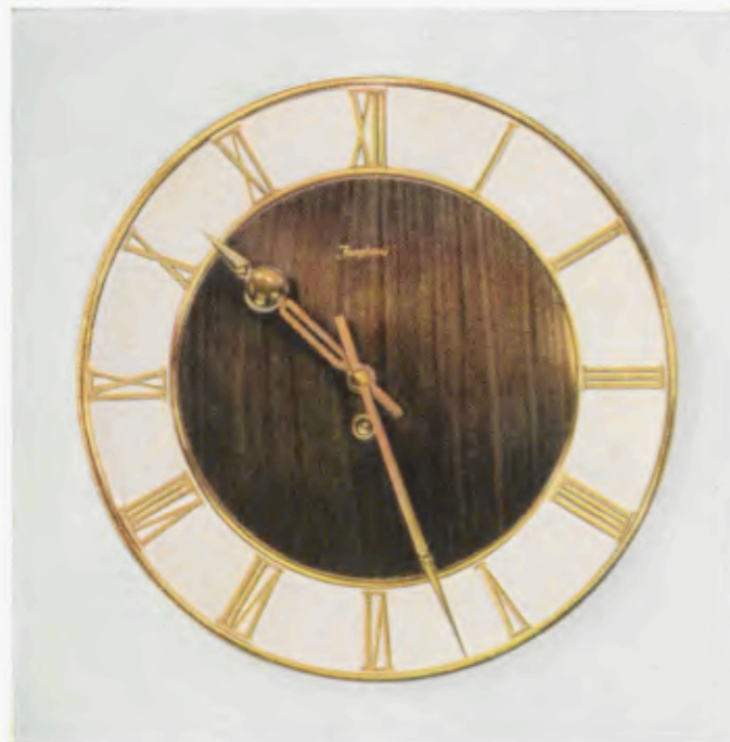
30 cm ø = 11¾ inches