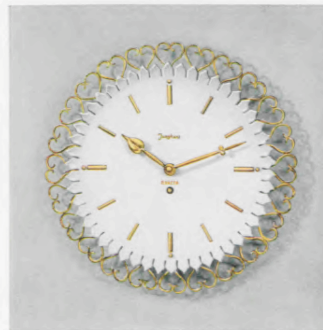
27,5 cm ø = 10¾ inches

Nogal mate con cerco de cifras color marfil, cifras doradas aplicadas, marco latón