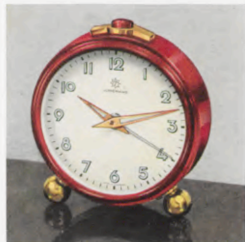
52/0123 7 cm = 2¾ inches