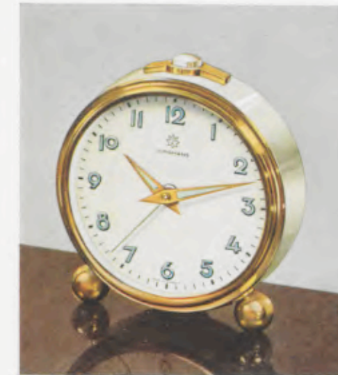
52/0125 7 cm = 2¾ inches

1 Tag halbflaches Weckerwerk Nr. 282, Rückwandglocke, staubdichter Regulierring - 1 day alarm movement with back bell, dustproof regulating-slot - 30 heures réveil sur timbre fond, fente de réglage hermétique - Despertador, 30 horas cuerda con campana en el respaldo, hendrija de ajustamiento hermética