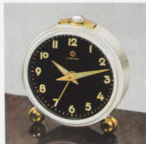
52/0124 7 cm = 2¾ inches