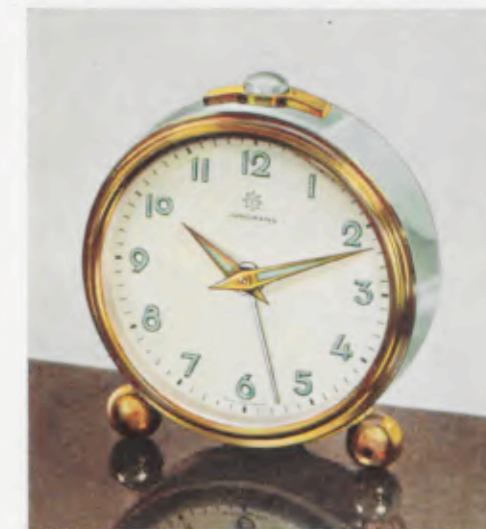
52/0126 7 cm = 2¾ inches