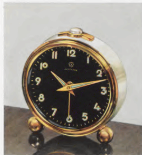
52/0127 7 cm = 2¾ inches