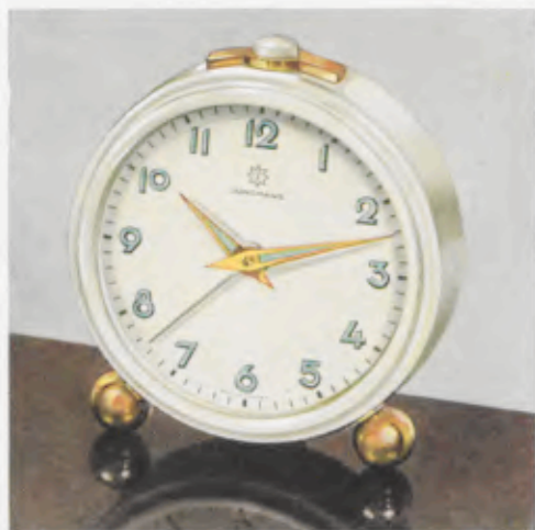
52/0121 7 cm = 2¾ inches