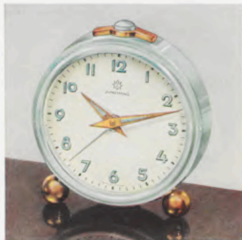
52/0122 7 cm = 2¾ inches