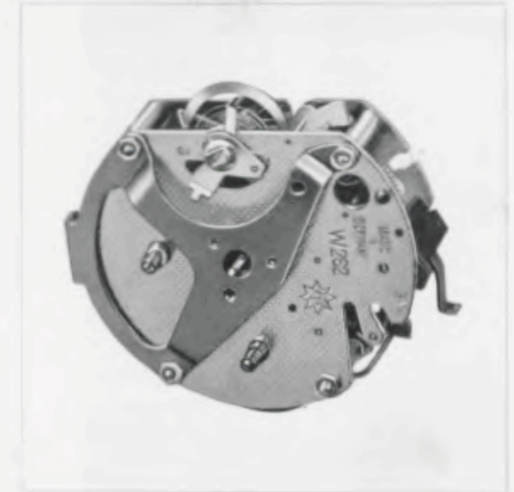
Platinen Plates - Platines - Platinas 44,2 mm \varnothing = 1 7/8 inches

Small alarm clocks in metal cases Petits réveils en boîtes métal Despertadores pequeños en cajas de metal