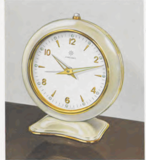
52/0145 10 x 8,8 cm = 4 x 3 1/2 inches

1 Tag halbflaches Weckerwerk Nr. 282, Rückwandglocke, staubdichter Regulierschlitz - 1 day alarm movement with back bell, dustproof regulating-slot - 30 heures réveil sur timbre fond, fente de réglage hermétique - Despertador, 30 horas cuerda con campana en el respaldo, hendrija de ajustamiento hermética