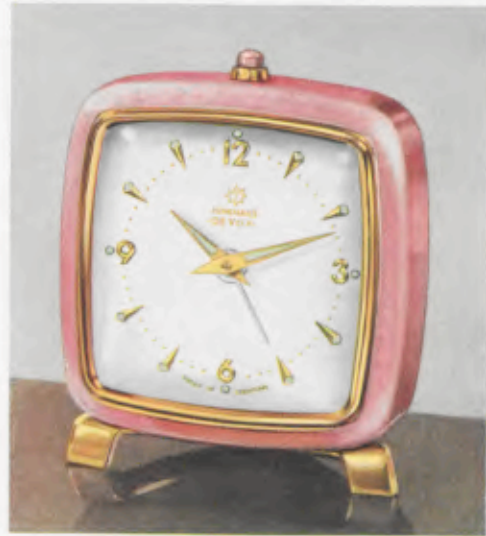
52/0543 BIVOX 7,5 x 6,5 cm = 3 x 2 5/16 inches

1 Tag halbflaches Weckerwerk Nr. 282, Rückwandglocke, weckt erst leise, dann laut, staubdichter Regulierschlitz - 1 day alarm movement, semi-flat, with back bell, wakes first softly, then aloud, dustproof regulating-slot - 30 heures réveil mi-plat, timbre fond, d'abord «en sourdine», ensuite sonore, fente de réglage hermétique - Despertador, 30 horas cuerda, medio plano, con campana en el respaldo, despertando primero silencioso - y luego fuertemente, hendrija de ajustamiento hermética