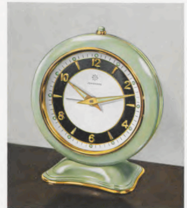
52/0147 10 x 8,8 cm = 4 x 3 1/2 inches