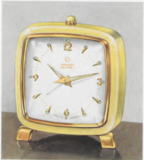
52/0544 BIVOX 7,5 x 6,5 cm = 3 x 2 5/16 inches