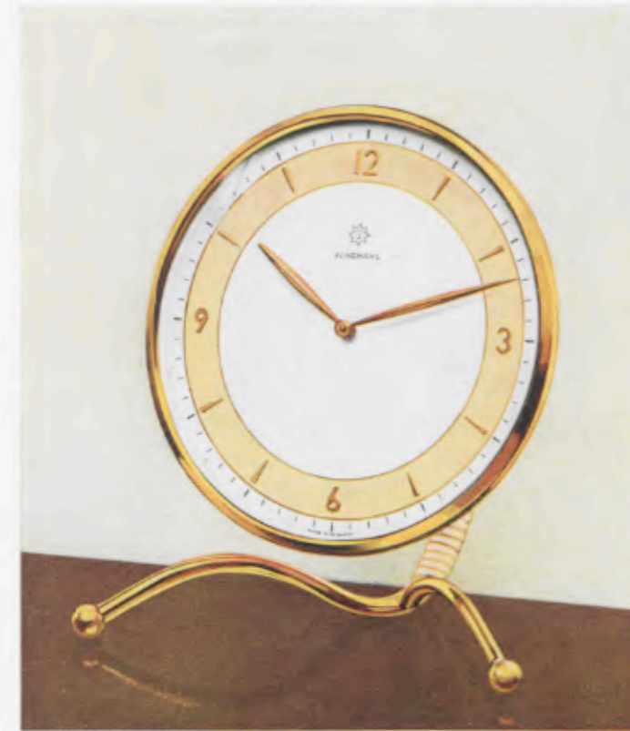
16 x 14,5 cm = 6 1/4 x 5 3/4 inches

Desk clocks • Pendulettes de bureau • Relojes para escritorio