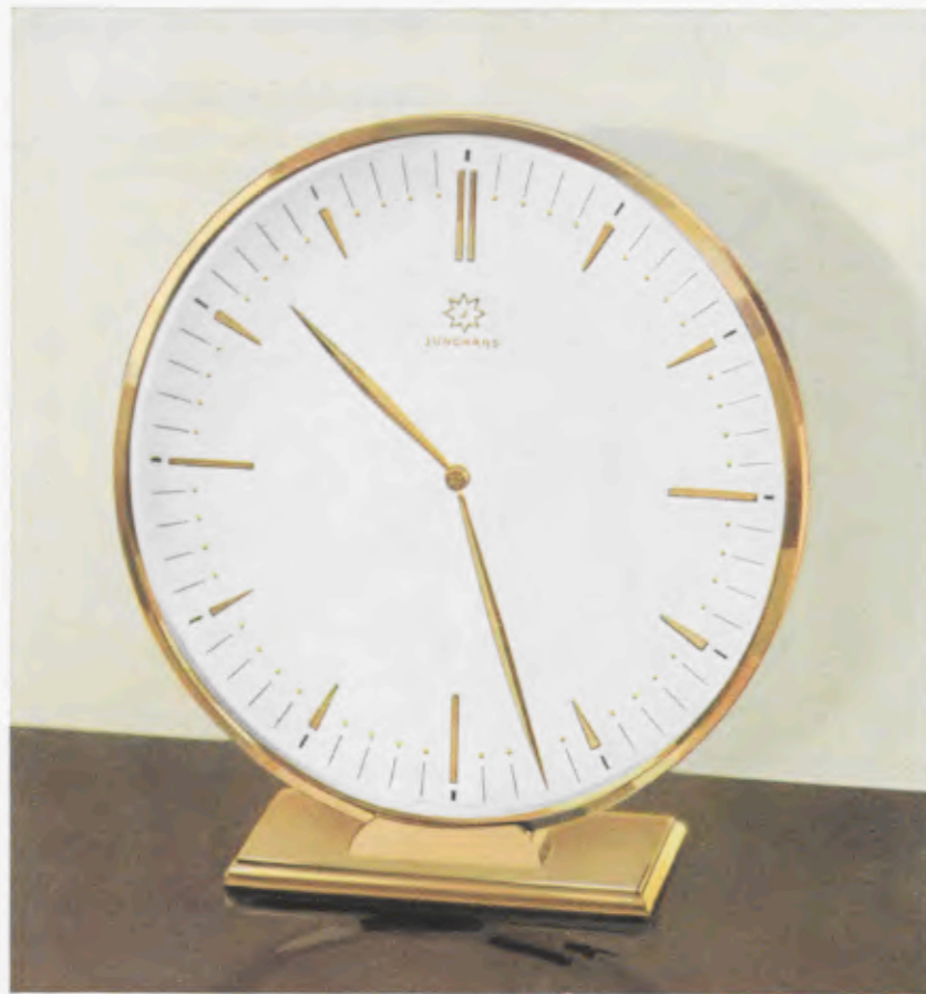
18,5 x 17 cm = 7 1/4 x 6 3/4 inches