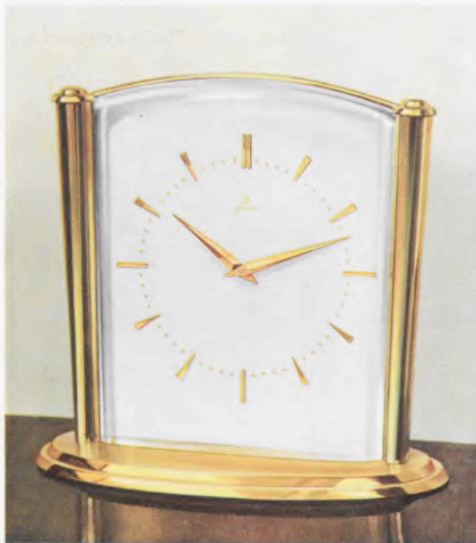
16 x 14,5 cm = 6 1/4 x 5 3/4 inches

Desk clocks • Pendulettes de bureau • Relojes para escritorio