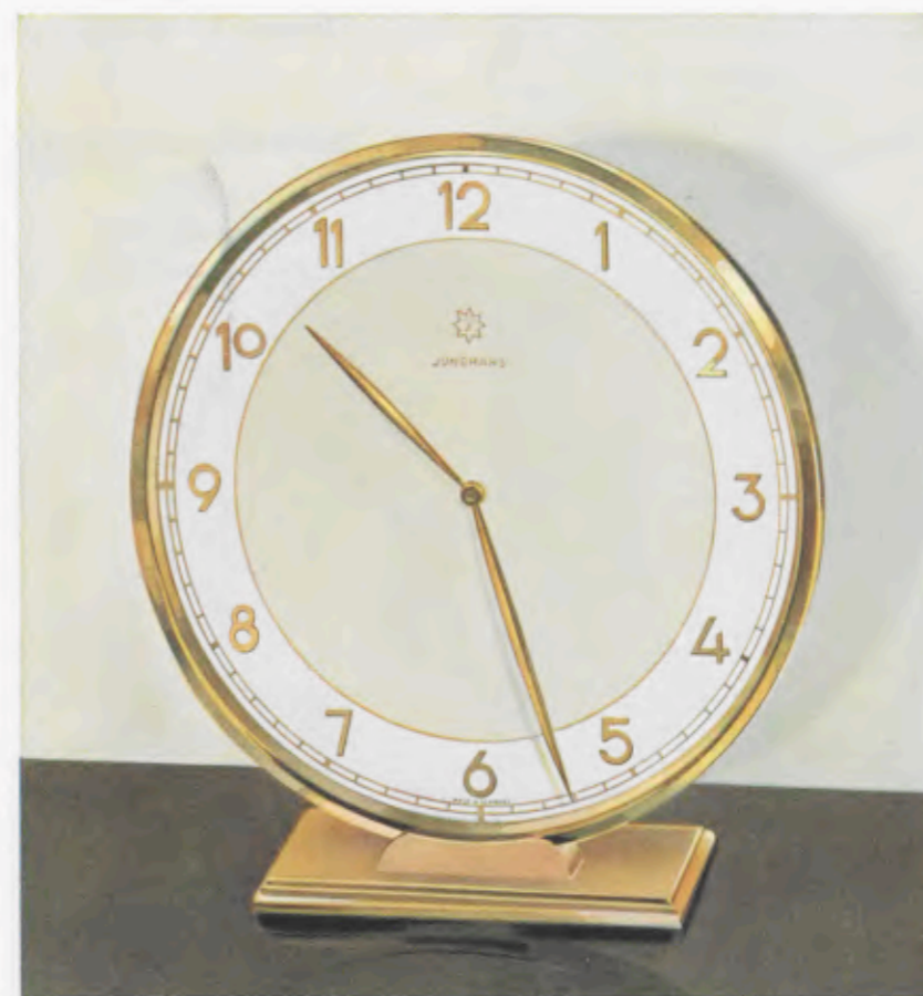
18,5 x 17 cm = 7 3/8 x 6 3/4 inches

Desk clocks • Pendulettes de bureau • Relojes para escritorio