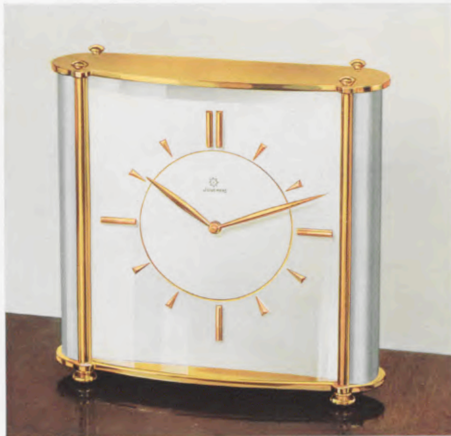
16 x 15,5 cm = 6 1/4 x 6 1/8 inches

Latón pulido, cristal biselado y convexo, esfera plateada cóncava con cifras doradas pulidas aplicadas