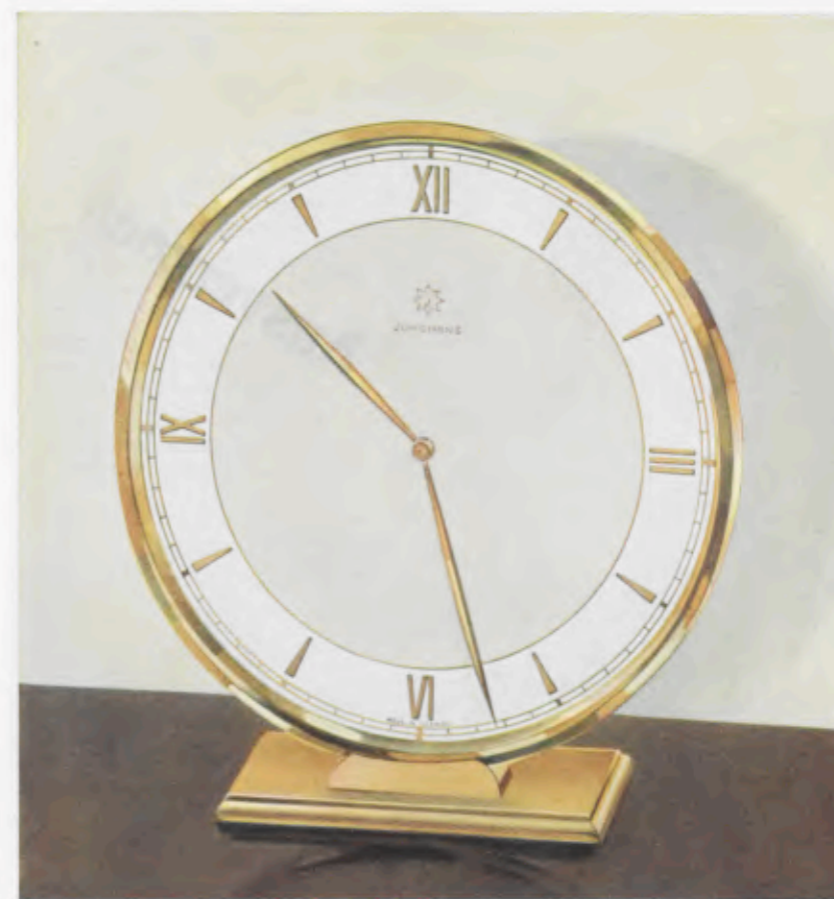
18,5 x 17 cm = 7 3/8 x 6 3/4 inches

Latón pulido, esfera de metal bicolor con cifras doradas pulidas en relieve