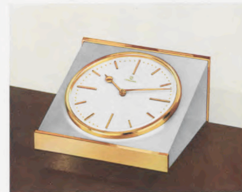
10,5 x 10,5 x 5,5 cm = 4 1/8 x 4 1/8 x 2 1/16 inches

Latón pulido y mate, esfera plateada con cerco de cifras negro aplicado y con cifras doradas pulidas aplicadas, vidrio plexi