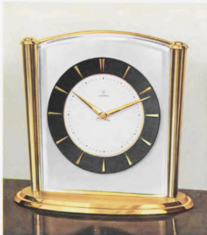
16 x 14,5 cm = 6 1/4 x 5 3/4 inches

Latón pulido, borde interior verdegris, cristal biselado y convexo, Esfera plateada bombada con cerco de cifras color de oro mate, puntos dorados pulidos