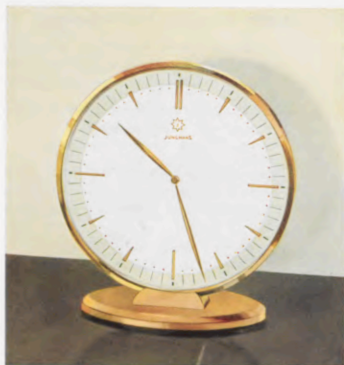
14,2 x 13 cm = 5 5/8 x 5 1/4 inches

Latón pulido, esfera de metal bicolor con cifras doradas pulidas en relieve