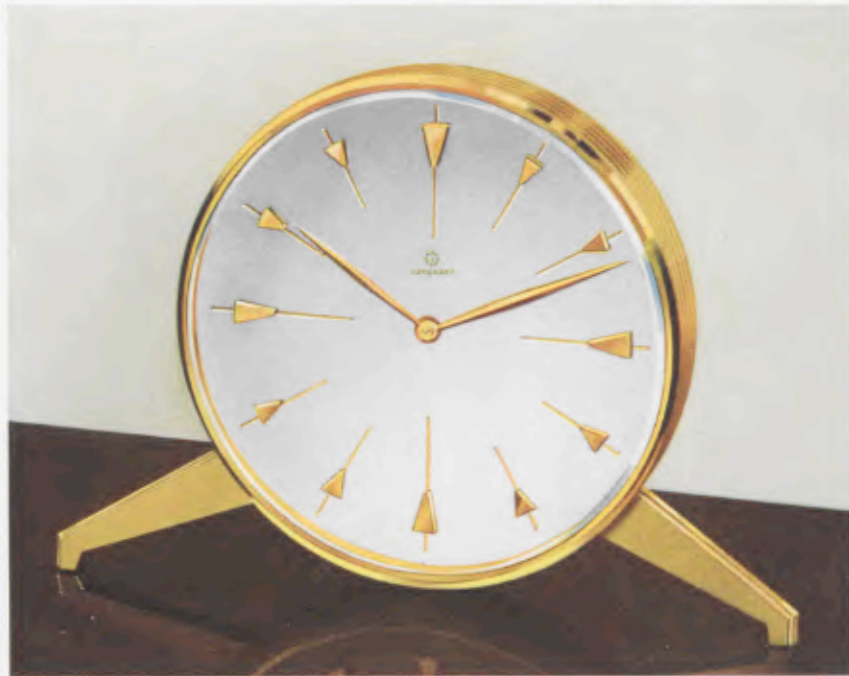
13 x 19 cm = 5 1/4 x 7 1/2 inches

Desk clocks • Pendulettes de bureau • Relojes para escritorio