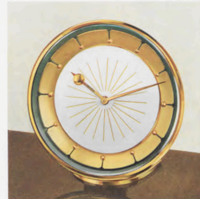
13 x 12 cm = 5 1/4 x 4 3/4 inches

Latón pulido y mate, esfera plateada con cifras doradas pulidas aplicadas, vidrio plexi