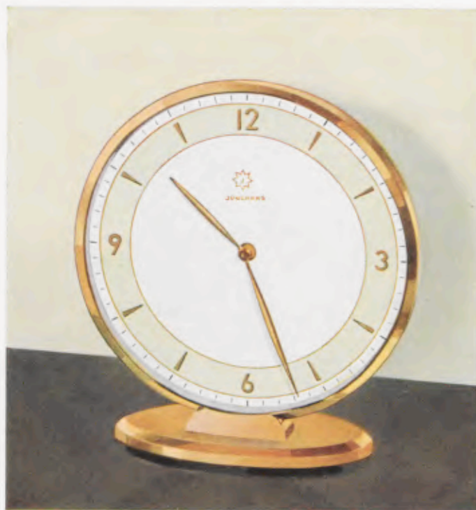
14,2 x 13 cm = 5 5/8 x 5 1/4 inches

Desk clocks • Pendulettes de bureau • Relojes para escritorio