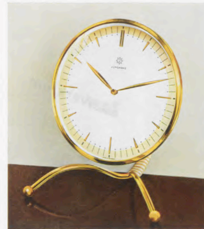
16 x 14,5 cm = 6 1/4 x 5 3/4 inches

Latón pulido, esfera de metal bicolor con cifras doradas pulidas en relieve