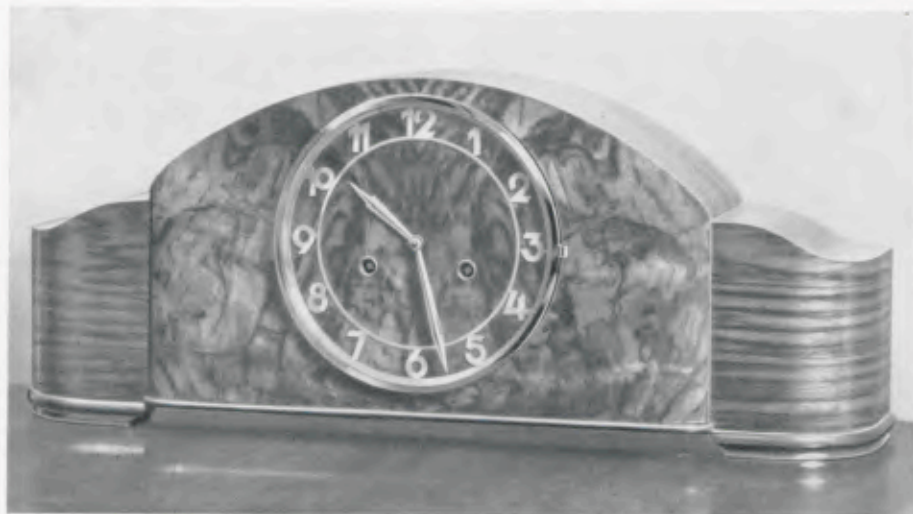
22 x 56 cm