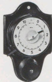
Nr. 310/0749 Höhe 25,5 cm

Gehäuse weiß auf weiß lackiertem Holzbrett