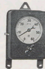
Nr. 310/0720 - 310/0723 Höhe 16,5 cm

Glocke und Gehäuse weiß auf weißlack. Bakelit-Brett