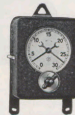
Nr. 310/0728 - 310/0731 Höhe 16,5 cm

Metallgehäuse schwarz lackiert Staub- und dampfdicht