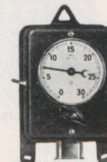
Nr. 310/0732 - 310/0735 Höhe 16,5 cm

Metallgehäuse schwarz lackiert Staub- und dampfdicht