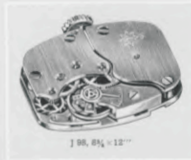
J 98, 8\frac{3}{4} \times 12''

Cadran métal noir avec chiffres et aiguilles lumineux