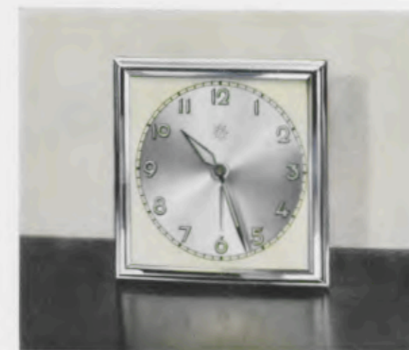
7 x 7 cm = 2 \frac{3}{4} x 2 \frac{3}{4} inches

Chromé poli Cadran métal bicolore avec chiffres et aiguilles lumineux Cromado pulido Esfera de metal bicolor con cifras y agujas luminosas