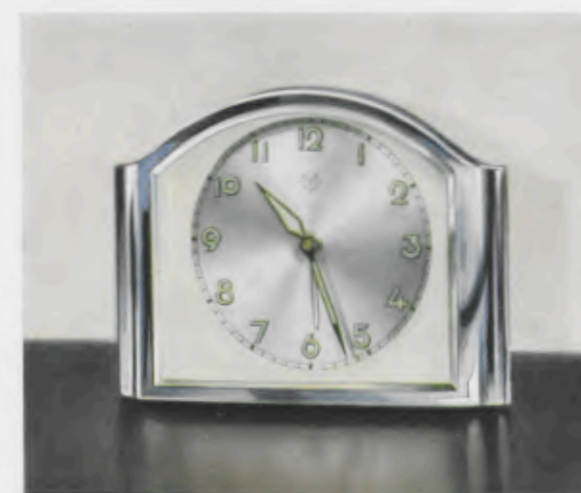
7 x 9 cm = 2 \frac{3}{4} x 3 \frac{1}{2} inches

Máquina despertador, 30 horas cuerda, medio plano, escape áncora á clavijas, platinas y ruedas de latón especialmente, puntas de piñones finamente pulidas, platinas desinadas