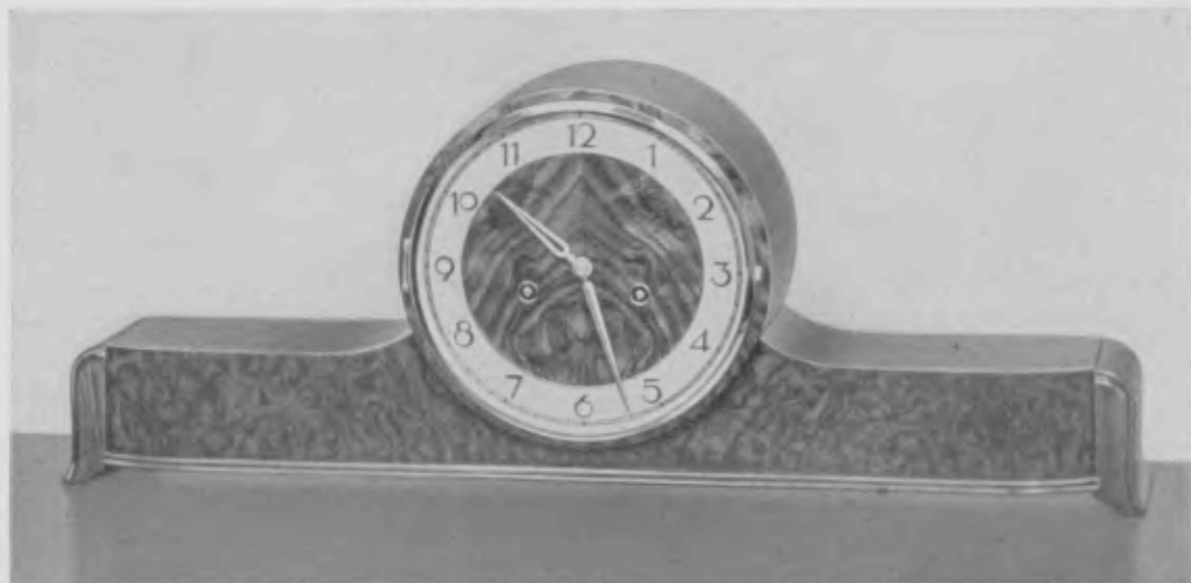
21,5 x 60,5 cm = 8½ x 23¾ inches