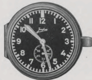
7 cm = 2 3/4 inches