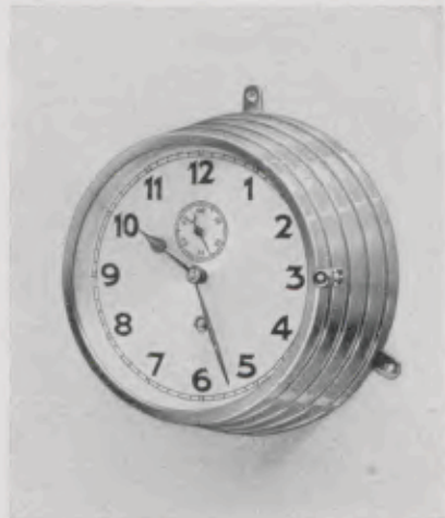
20 cm = 8 inches

Bisel cromado, esfera plateada. Máquina de precisión, 8 días cuerda, escape á áncora con 7 rubis