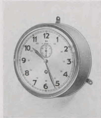
20 cm = 8 inches