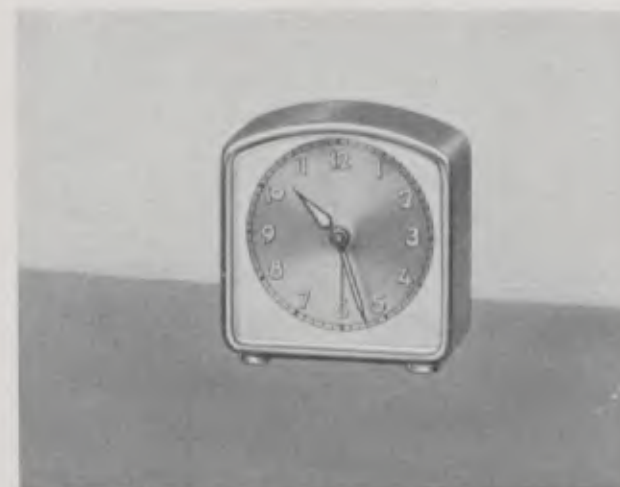
8 x 9 cm = 3 1/8 x 3 5/8 inches

Esfera de metal bicolor con cifras y agujas luminosas, cristal biselado, despertador, 30 horas cuerda, máquina de reloj de bolsillo, 4 rubis Respaldo pulido, impermeable al polvo