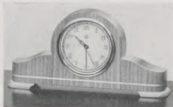
8,5 x 18 cm = 3 3/8 x 7 1/8 inches