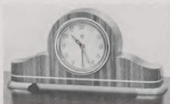
8,5 x 18 cm = 3 3/8 x 7 1/8 inches