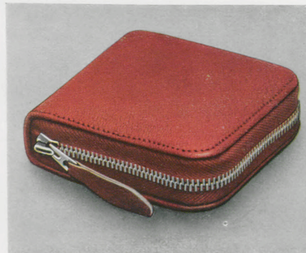
8,5 x 8 cm

Schweinsleder-Mouton Gesenkter Ladenpreis ..... RM. 18.—