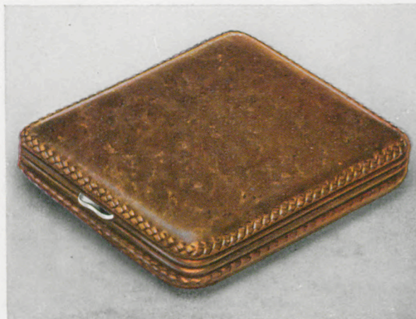
8 x 9 cm

Schwarz Seehund Gesenkter Ladenpreis ..... RM. 21.—