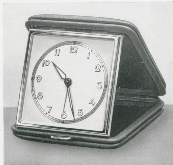
8 x 9 cm