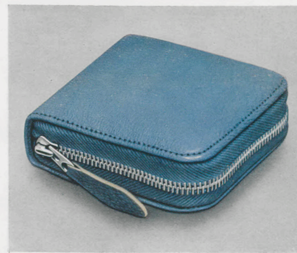
8,5 x 8 cm

Facetteglas, zweifarbigen Metallblatt mit Radiumzahlen und -zeigern