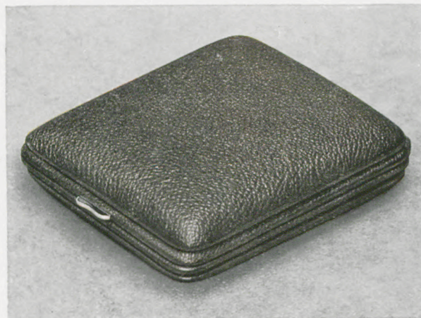
8 x 9 cm

Facetteglas, zweifarbigen Metallblatt mit Radiumzahlen und -zeigern