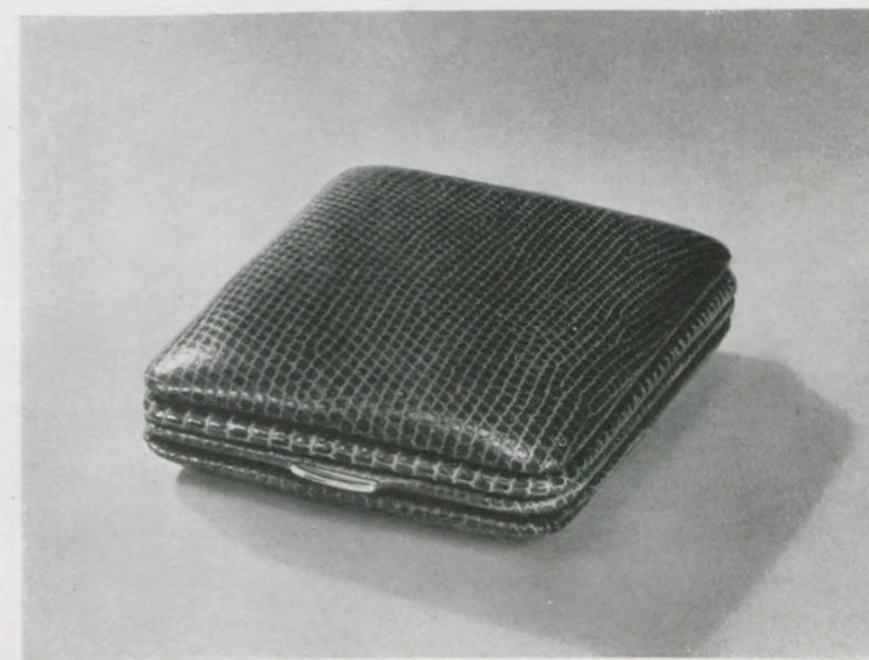
7,1 x 7,4 cm = 2 3/4 x 3 inches

Goldrahmen, Schwarzblatt mit aufgelegten Goldzahlen, Radiumpunkte und -zeiger - Gilt frame, black metal dial with gilt raised figures, luminous points and hands - Cadre doré, cadran métal noir avec chiffres dorés appliqués, points et aiguilles lumineux - Marquito dorado, esfera de metal negro con cifras doradas aplicadas, puntos y agujas luminosos