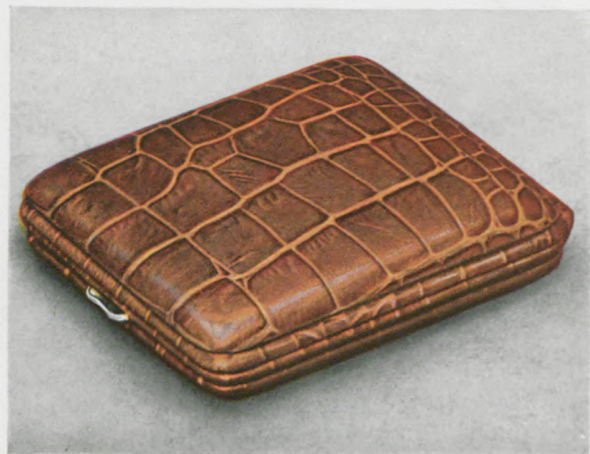
7,1 x 7,4 cm = 2 3/4 x 3 inches

Marquito dorado, esfera de metal bicolor con cifras doradas aplicadas, puntos y agujas luminosos