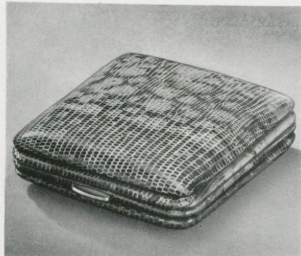
7,1 x 7,4 cm = 2 3/4 x 3 inches

Blau Ecrasé - Blue Ecrasé - Ecrasé bleu Ecrasé azul