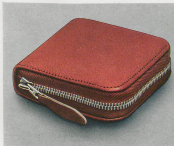
8,5 x 8 cm = 3 3/8 x 3 1/8 inches

Schweinsleder-Mouton - Hog-skin - Cuir de porc Cuero de puerco