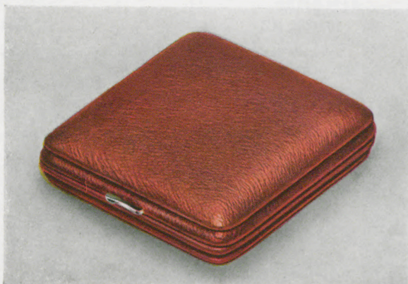
7,1 x 7,3 cm = 2 3/4 x 2 7/8 inches

Schweinsleder-Mouton - Hog-skin - Cuir de porc Cuero de puerco