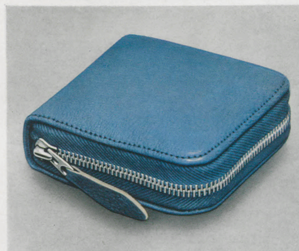
8,5 x 8 cm = 3 3/8 x 3 1/8 inches

Marquito cromado, cristal biselado, esfera de metal bicolor con cifras y agujas luminosas