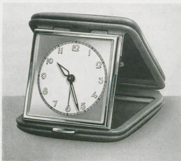
7,1 x 7,3 cm = 2 3/4 x 2 7/8 inches

Travelling watches - Montres de voyage - Relojes para viaje