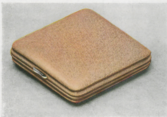
7,1 x 7,3 cm = 2 3/4 x 2 7/8 inches

Marquito cromado, cristal biselado, esfera de metal bicolor con cifras y agujas luminosas