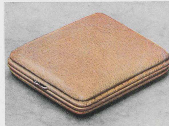
8 x 9 cm

Facetteglas, zweifarbiges Metallblatt mit Goldreliefzahlen, Radiumpunkte und -zeiger