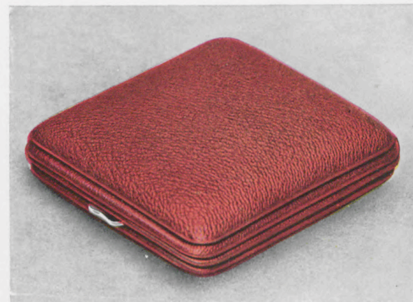
8 x 9 cm