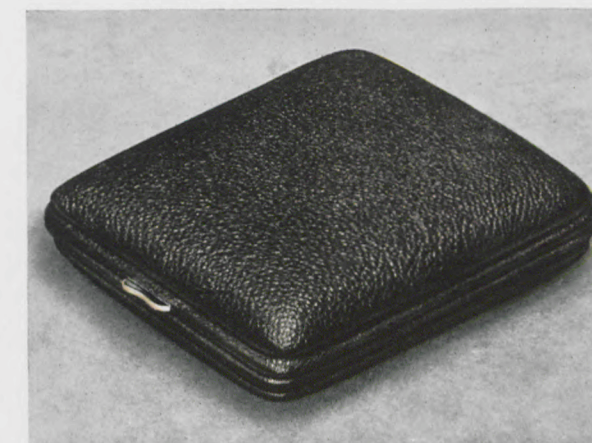
8 x 9 cm