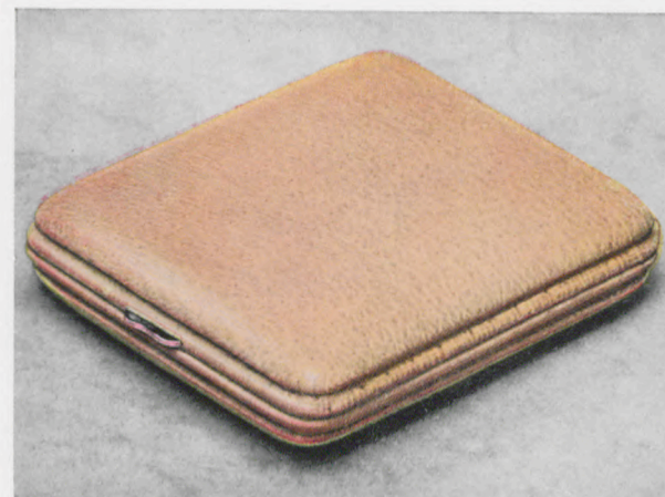
8 x 9 cm