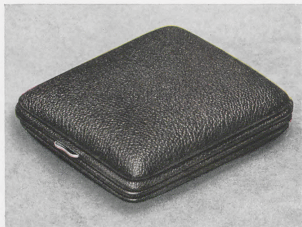
8 x 9 cm