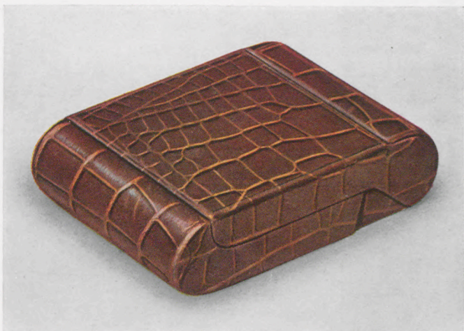
6,5 x 9 cm