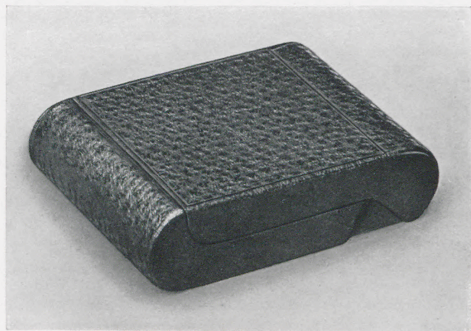
6,5 x 9 cm