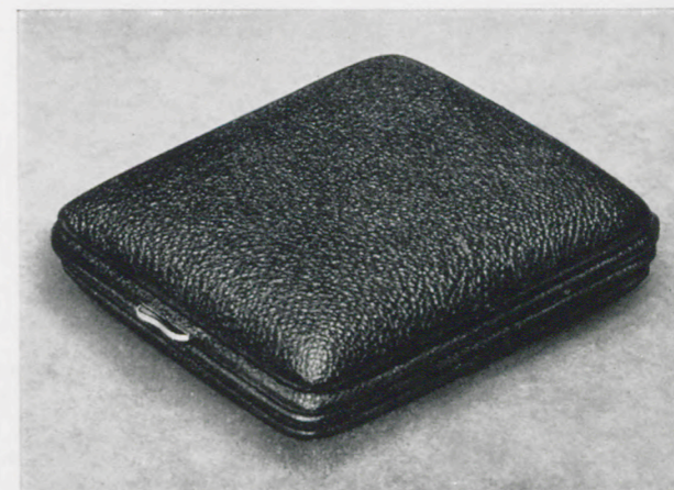
8 x 9 cm

Facetteglas, zweifarbige Metallblatt mit Chrom- reliefzahlen, Radiumpunkte und -zeiger