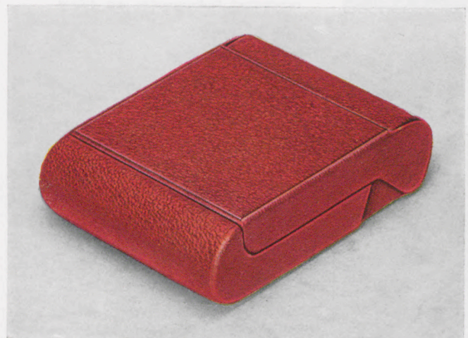
6,5 x 9 cm