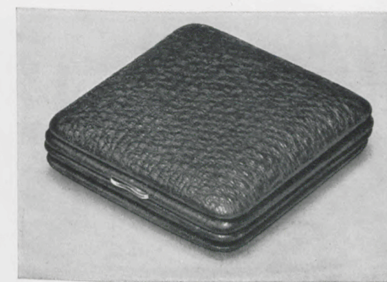
7 x 7 cm

Facetteglas, zweifarbiges Metallblatt mit Radiumzahlen und -zeigern