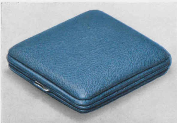
8 x 9 cm