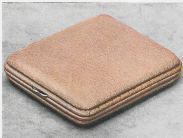
8 x 9 cm