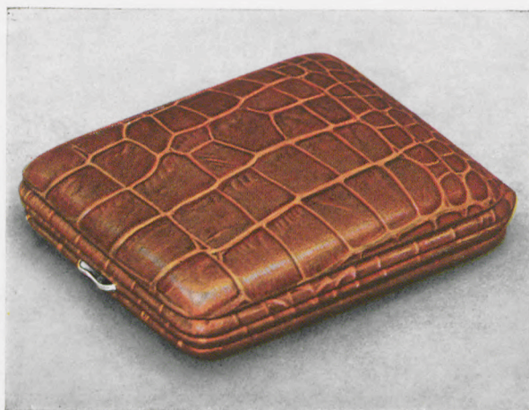
8 x 9 cm