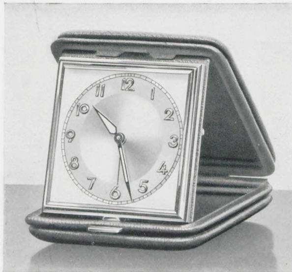
8 x 9 cm

Flaches und ganggenaues Weckerwerk mit Stiften-gang, abnehmbare Anker- und Balancebrücke, seitlich herausnehmbare Federhäuser massive Stahltriebe, 2 Decksteine