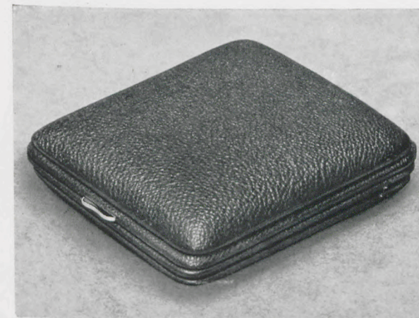
8 x 9 cm