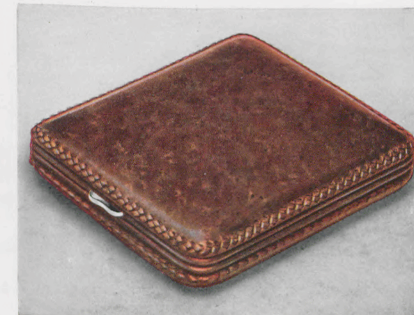
8 x 9 cm