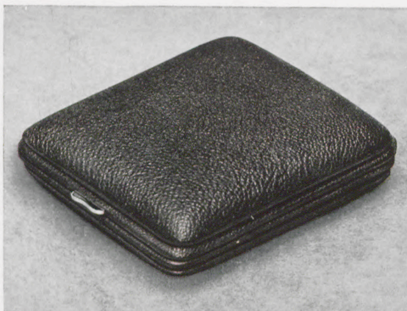
8 x 9 cm

Facetteglas, zweifarbiges Metallblatt mit Chromreliefzahlen, Radiumpunkte und -zeiger